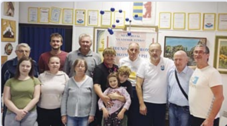
Учасніки Мемориалу у бавеню столного тенису

Ровноправно ше змагали наймладши и найстарши, бо гоч важне победзиц, ище важнейше участвовац и попри културного розвивац и спортски дух.