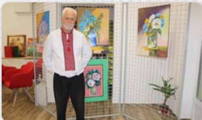
Владимир Провчи з виставу малюнокх