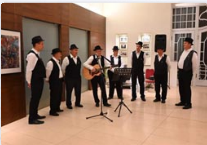
КУД Яким Гарди зоз Петровцох

Автор подзековал шицким присутним на указаним довирию, наглашаючи же вельки уплїв на