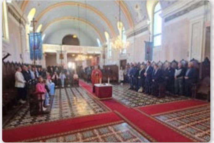
Свята Служба Божа зоз панахиду за страдалих Петровчаньох у Отечественей войны