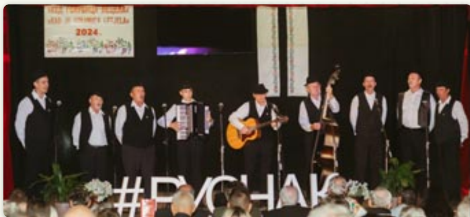
КУД Яким Гарди з Петровцох