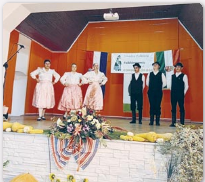
Венчик руских народних танцох