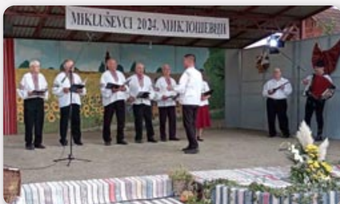
КУД Осиф Костелник Вуковар