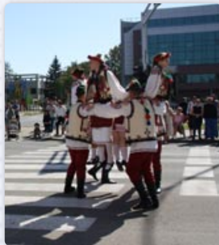
Часц пастирских танцох у Винковцох