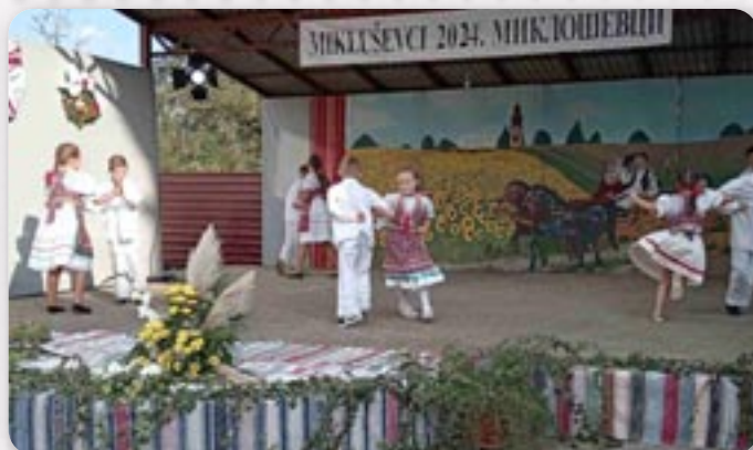
Дзецинска танечна група, Миклошевци