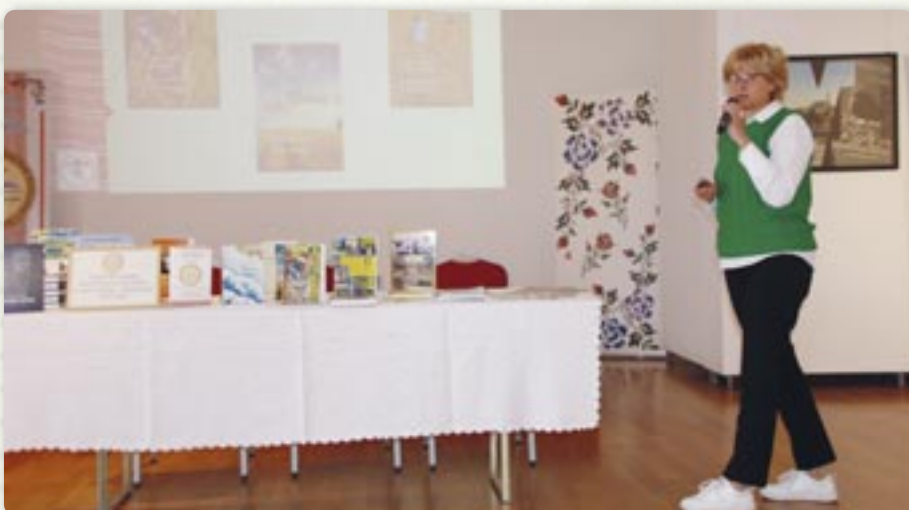
Представяне нових виданюх Союзу Русинох РГ