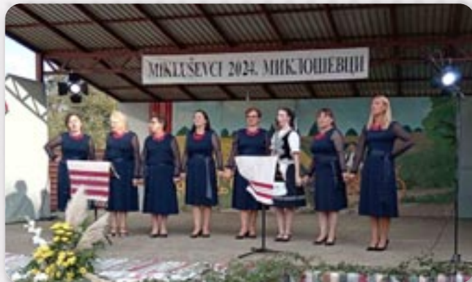
Женска шпивацка група з Миклошевцох