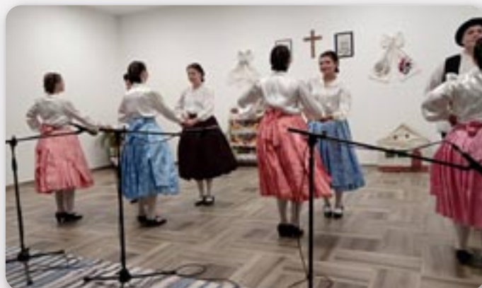
Венчик руских танцох