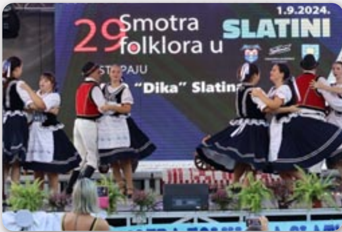
Шаришка полка на бини у Слатини