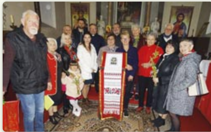
После грекокатоліцкей Служби Божей у Риеки

дзень снованя зоз Шветочну академию и зоз представяньом 20 роки роботи Дружтва. Госцовал Закарпатски хор, а у „Руским обисцу“ дзе було сноване Дружтва отримни банкет.