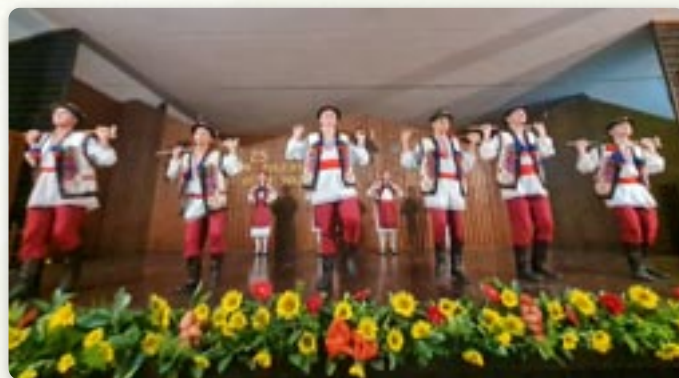
Танец „Я до леса желеного не пойдем“

Манифестацию 25. Вечар полеснякох 7. септемра организовала Матка словацка Марковец и СКУУ „Франьо Страпач“ Марковец, а под покровительством Совету за национални меншини Републики Горватскей, Уряду за людски права и права националних меншинох Републики Горватскей, Союзу Словакох у РГ, Уряду за виселених Словакох, Городу Нашицох, Туристичней заедниці городу Нашицох и Рада Месного одбору Марковец Нашицки. Шицких учашнікох привитала пред-