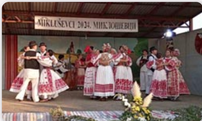
КУД Обрешка Доня Обрешка, Словацка