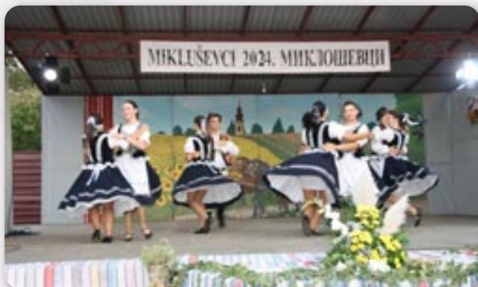
Красота розтанцованей младосци КУД Яким Говляя Миклошевци