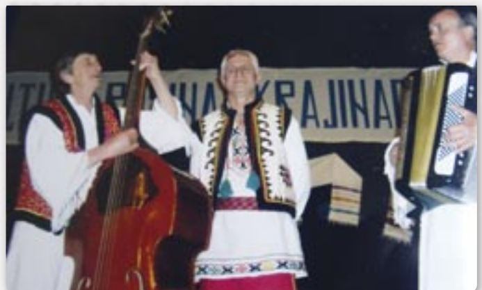
Бал у Риеки