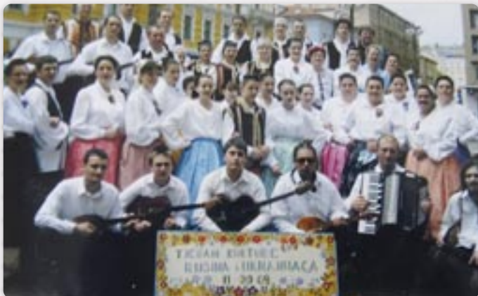
Тидзень культури Руснацох и Українцох ПГЖ