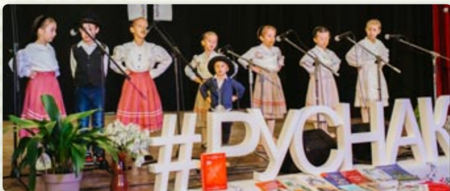
„Голубчата“ и „Голубки“