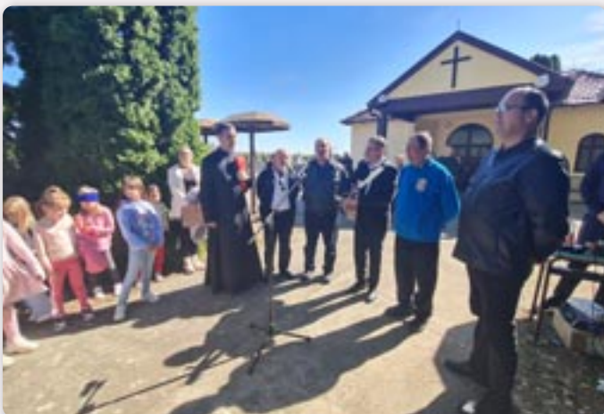
Хлопска шпивацка група КУД Яким Гарди Петровци