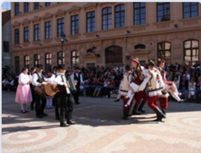
Красота руских танцох пред найвисшима госцами на манифестації