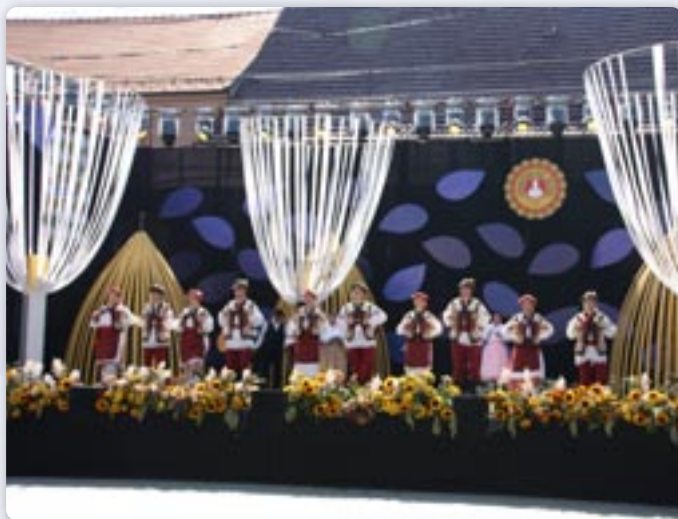
Наступ на велькей бини Винковских ешеньох 2024

Зоз шветочним дефилеом 22. септембра ожили винковски улїчки по 59. раз. Найвекша горватска, але и европска манифестация традицийней култури позбєрала 62 фолклорни дружтва и коло 3000 учашнїкох. После рока на вельки дзвери врацєли ше нам 30 кочи и 68 шєдлаче, котри приказали моц и елеганцию найплеменїтєйшей животинї, а так и красу кочох котри дали закончуюцу ноту тогорочного дефилеа. У шветочним дефилеу Винковских ешеньох медзи 62-ма културно-уметнїцкима дружтвами участвовали и члєни КУД „Яким