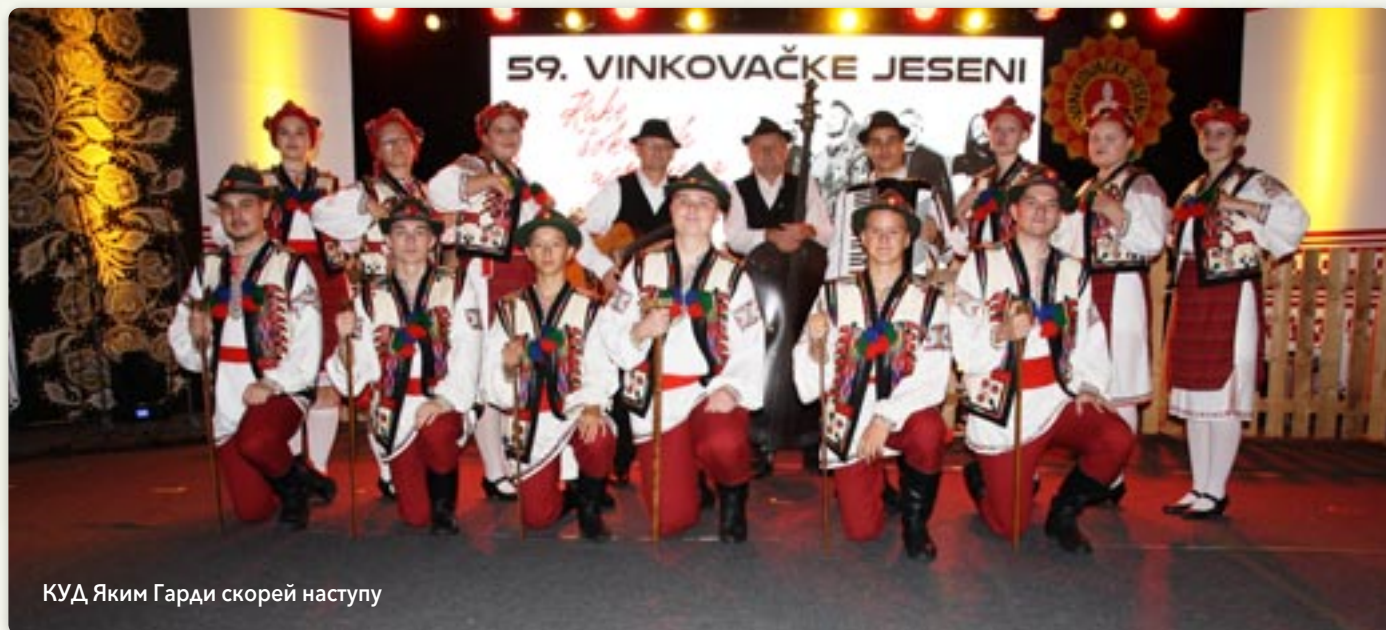
КУД Яким Гарди скорей наступу

У шатру на Площи Винковских ешеньох, 13. септембра шветочно отворени Фолклорни вечари – жупанийска смотра фолклору Вуковарско-сримскей жупанії. Фолклорни вечари отворел Франьо Орешкович, заменік жупана котри окончуе длужносц жупана. Винковчаньох и їх госцох привитал председатель ЗАКУД-а Андрия Матич и председатель Организационного одбору 59. Винковских ешеньох, винковски городоначалнік и соборски заступнік Иван Босанчич. У шатру на Площи