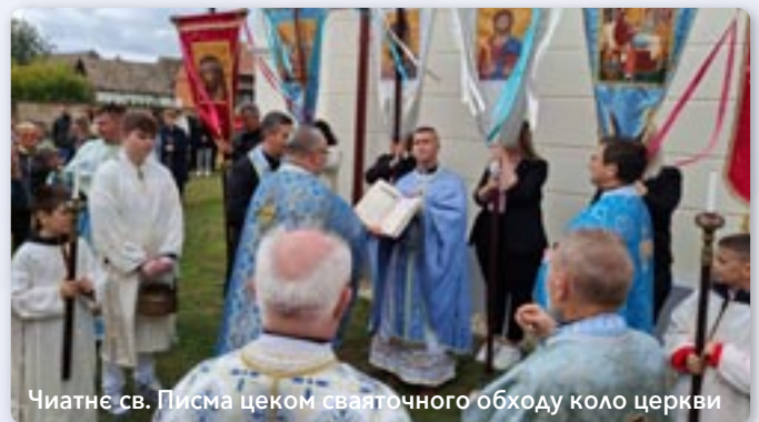
Чиятнє св. Писма цеком святочного обходу коло церкви