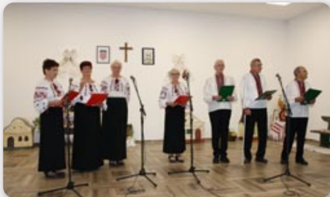
КД Русинох Винковци на пиятковой програми