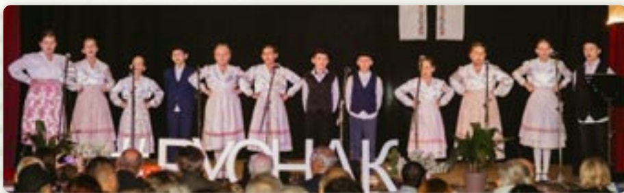
Петровски школяре од 1. по 8. класу хтори ходза на наставу руского языка и култури