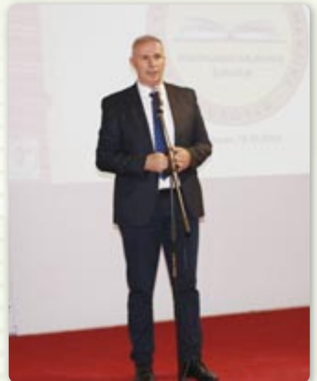
Председатель Координації Радох и Представителюх націоналних меншинох ВСЖ