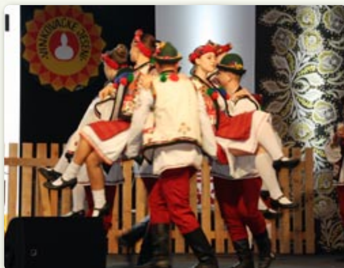
Танечна фігура Пастирских танцох