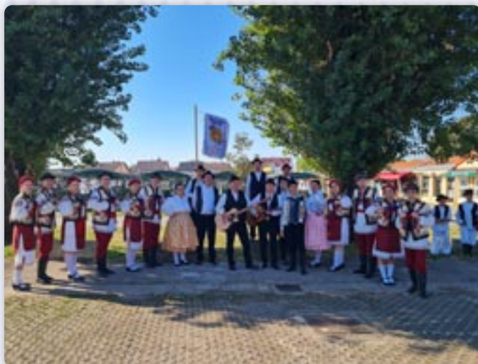
Члєни КУД Яким Гарди Петровци порихатни за святочни дефилє на Винковских ешеньох