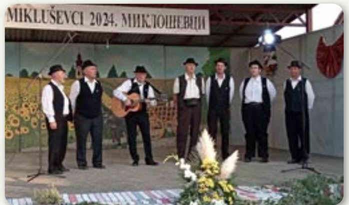
Хлопска шпивацка група з Петровцох

уметніцке друство „Тарас Шевченко“ зоз Дюрдьова.