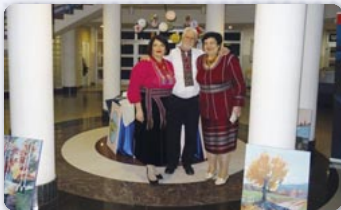
Заєдніцка слика зоз бандуристками