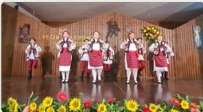
КУД Яким Гарди на бини у Нашицким Марковцу