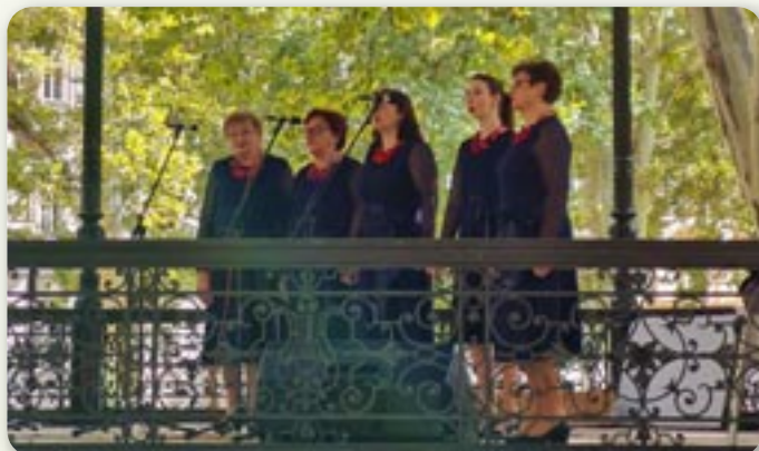
Женска шпивацка група Миклошевци