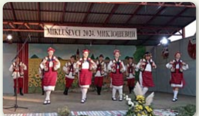
КУД Яким Гарди Петровци