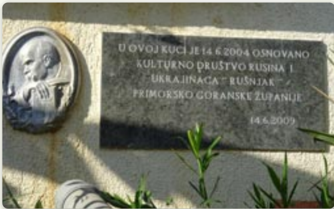
Означене место дзе основане КД Руснацох и Українцох ПГЖ Рушняк