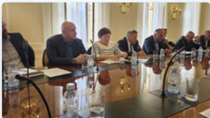
Predstavnici HRT sa članovima Savjeta za nacionalne manjine RH