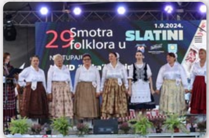
Женска шпивацка група

У рамикох преслави Дня городу и означованя 727. рочниці першого писаного здогадованя мена Слатини, у тим варошу 1. септембра отримана 29. Смотра фолклору. Програма отримана на централней Площи св. Йосипа, а организатор манифестациі було Горватске културно-уметніцке друштво „Дика“ Слатина. Попри домашніх, своєю розкошне народне облечиво, танци и автентичну музику Слатинчаньом и гостом представели