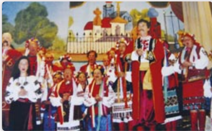
Дні опери и оперних арийох