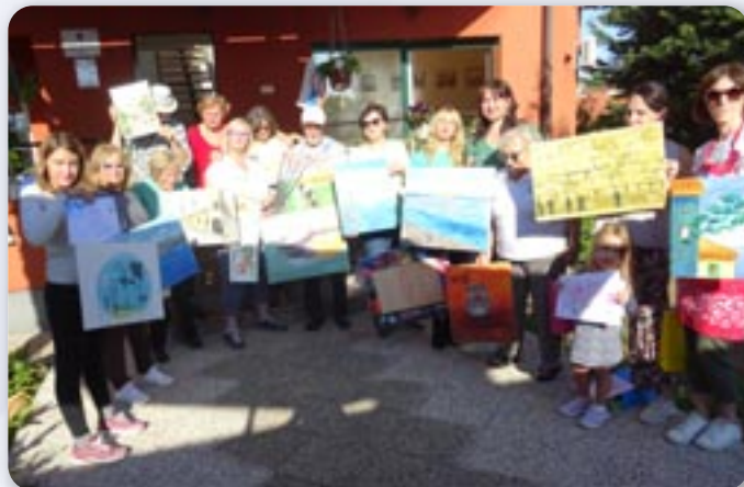
Учасніки Колонії зоз своїма роботами

„Матка словацка“ у Риєки ма свою хижу хтору им купела матична жем. Ту ше одвиваю рижни збудваня и манифестациї у їх організації. Литературне стретнуце отримане 20. септембра з намиру презентованя новей поезиї. Учасніки читали поезию на мацеринским языку и у прекладу на горватски язык.