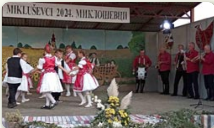
КУД Чаковци з Чаковцох