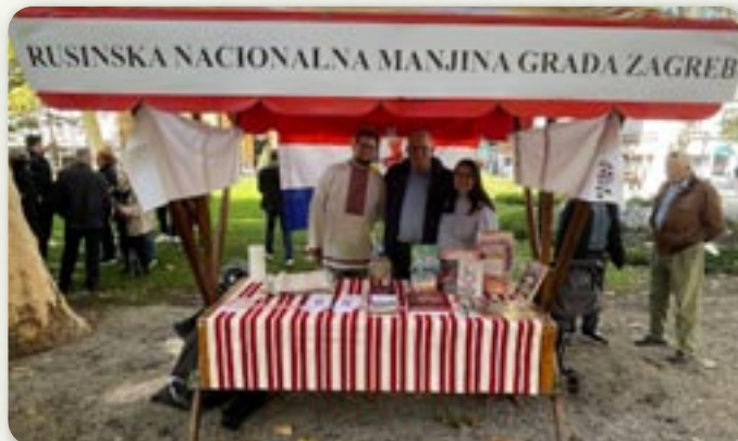
Штанд рускей националней меншини Городу Загребу