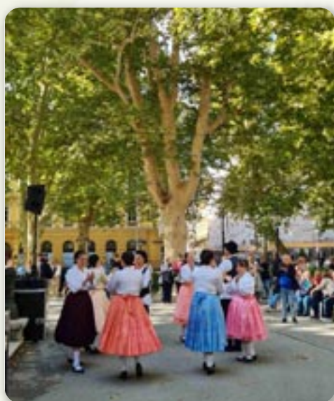
Венчик руских танцох у виводзеню КУД Яким Говля з Миклошевцох

У організації Координації ради и представнікох националних меншинох Городу Загребу, 29. септембра у музичним павильону на Зриневцу отримани День националних меншинох Городу Загребу. У програми участвовали шеснац национални меншини: албанска, бошняцка, чарногорска, ческа, мадярска, македонска, ромска, словенска, сербска, болгарска, польска, руска, словацка, италянска, турска и украинска.