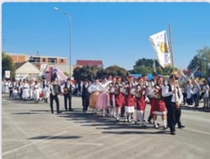
Прєход през главну улїчку