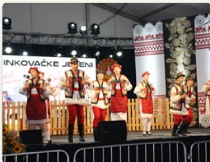
Пастирски танци на Фолклорних вечарох у Винковцох