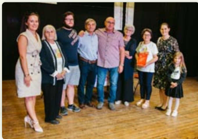
Представяне монографії Дружтва „Руснак“

Под покровительством Совету за национални меншини РГ, а у организацији здруженя „Руснак“ Дружтва Руснацох у Републики Горватскей, 27. и 28. септембра у Петровцох и Старих Янковцох, отримана 14. по шоре КМ медзинародного характера „Кед голувица лецела“ на хторей ше зишли Руснаци/Русини/Лемки зоз седем жемох.