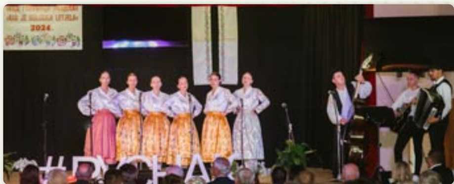
Младежка група и оркестер Дружтва „Руснак“