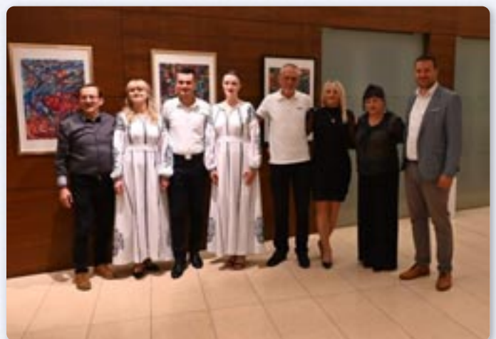
Заедніцка фотография автора зоз організаторами и водителями збуваня