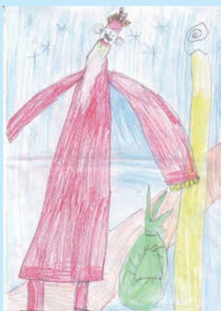
Сара Губица, 1. класа, Петровци