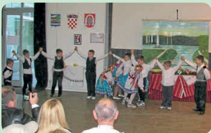
Петровчане у танцу осем хлапци и штири дзвизчата