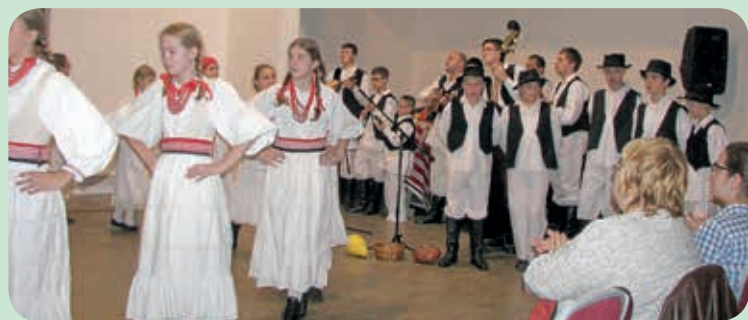
КУД “Ловро Єжек” зоз Мариї Бистрици