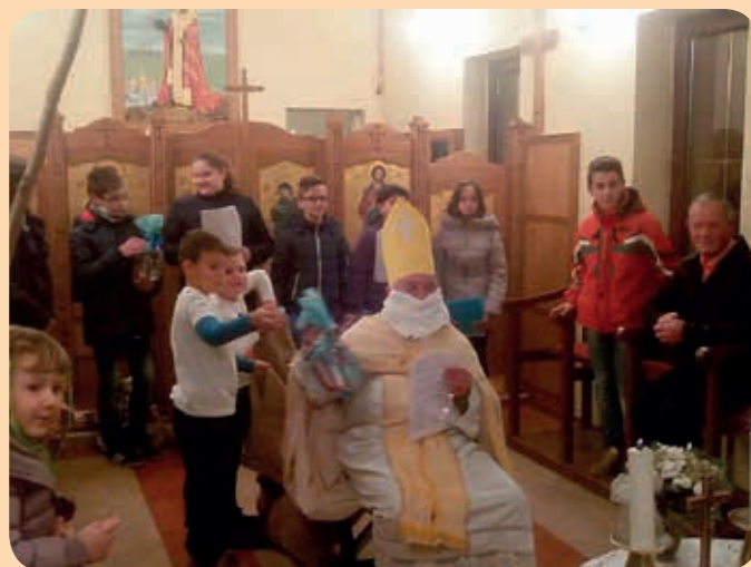
Миколай дзелі дари