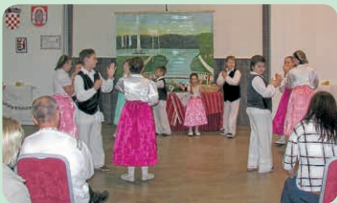
Миклошевски танцоше и танцошки