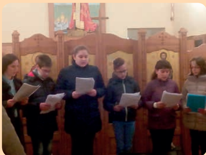
Вирніки на Служби Божей