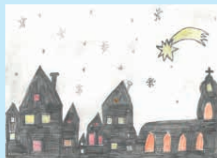
Марино Бабинчак, 5. класа, Миклошевци