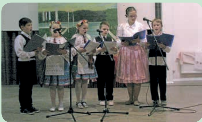
Шпивацка група “Петровски ноти”