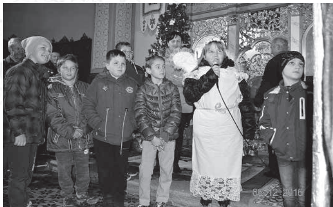
Програма за Миколая