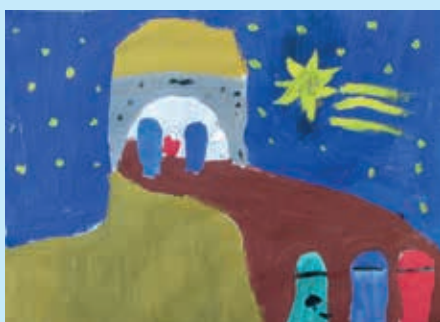
Миа Бучко, 3. класа, Миклошевци