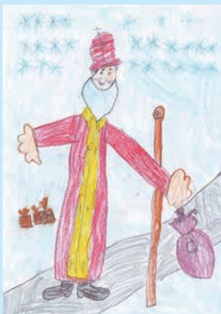
Дарио Джуджар, 1. класа, Петровци