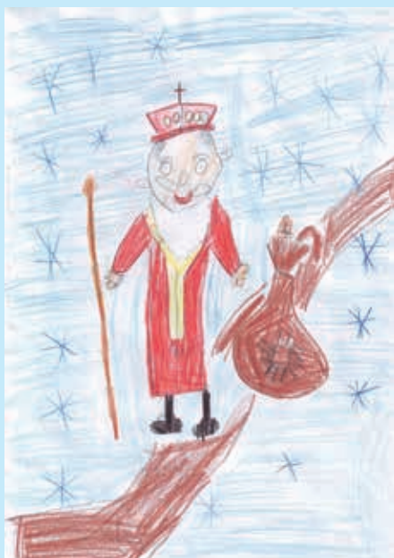
Марко Сеґеди, 1. класа, Петровци