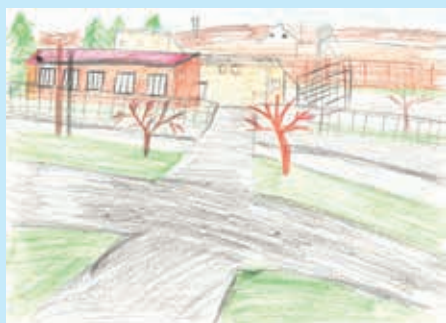
Кристиан Мудри, 5. класа, Миклошевци