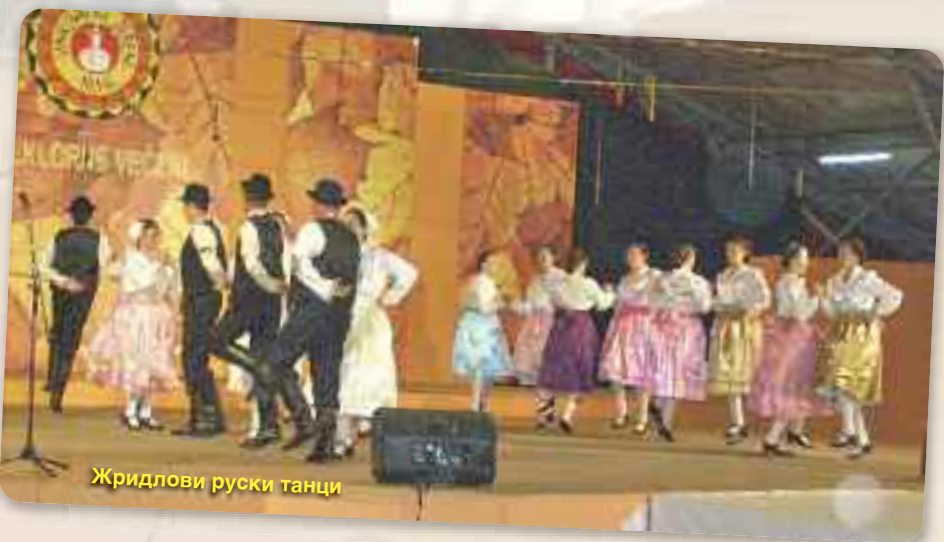
Жридлови руски танци