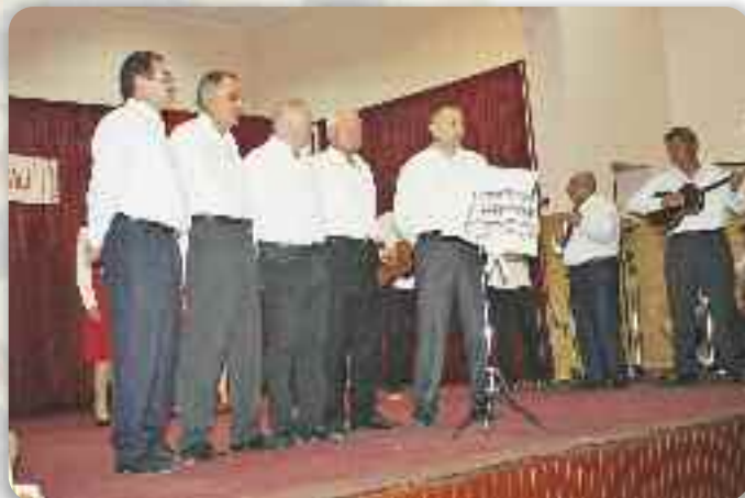
Хлопска група КУД Руснацох Осиек

На поволанку тайомниці Општини Ердут, КУД Руснацох Осиек вжал учасц на манифестацији котра ше у рамикох Сайму старих обичајох и ремеслох отримала 6. и 7. октобра у Далю.