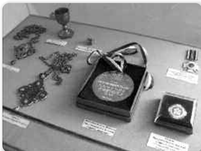
Часц експонатох, шветочни митрополитово ризи

княз Роман уединитель Во- линя з Галичину, творитель Галицко-Волинскей держави. Славу и шветови угляд Га- лицко-Волинскей держави змогнул Романов син княз и краль Данило Галицки. На Крилоскей гори пренайд- зени найзначнейши культурни памятніки, дзе, насампредз, учишломе фундаменти Ус- пенского собору, Чудотворну икону мацери Божей Кри- лоскей, Церкву Успения Пре- святей Богородици, збудовану 1586. року зоз камених бло- кох Успенского собору... У Митрополитней палати, лет- ней резиденції митрополита А. Шептицкого змесцени Му- зей исторії Давного Галича, а на другим поверху музея виложени и церковни святині, ордени, припознання, ризи, малюнки и самого митропо- лита А. Шептицкого.