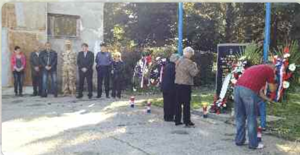
Покладане венцох погинутим падобранцом и пилотом, членом аероклубу „Борово“ при спомин плочи на аеродроме у Вуковаре

У Вуковаре, у аероклубу „Борово“, 21. октобра означене здогадоване на погинутих воздухоплівцох у Отечественой войны.