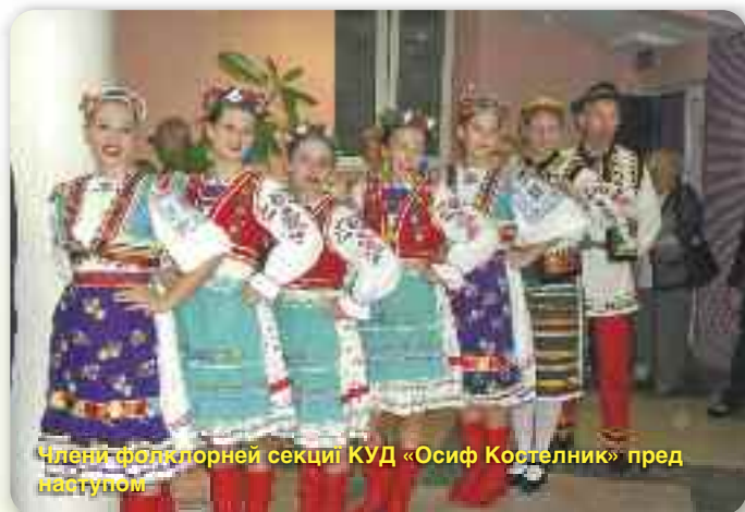
Члени фольклорней секції КУД «Осиф Костелник» пред наступом