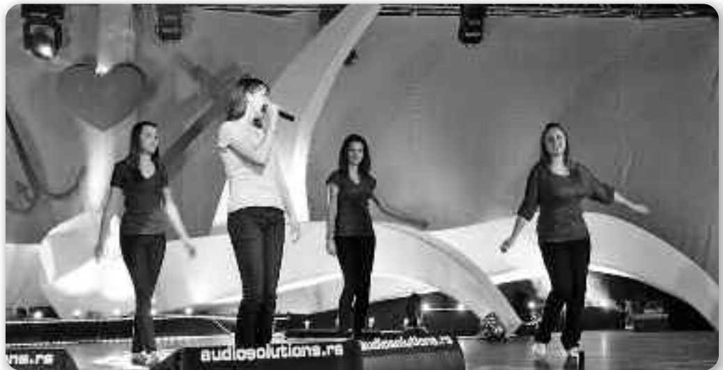
ВИС «Христове ято» зоз Петровцох