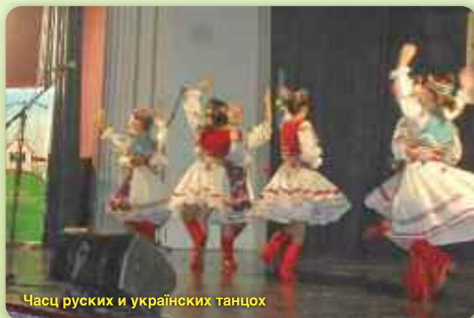
Часц руских и українских танцох