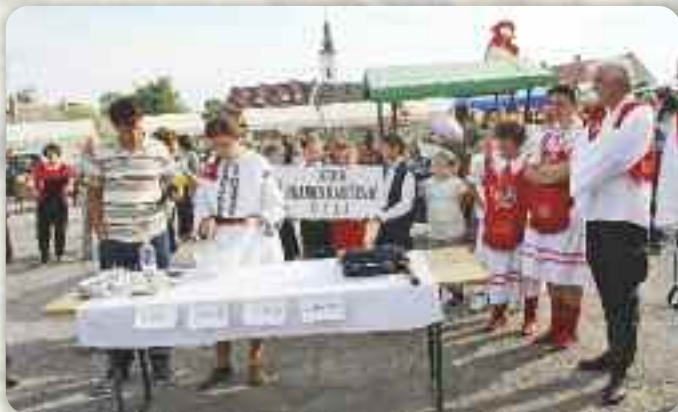
Роботня о правеню «славонскеј гужвари»