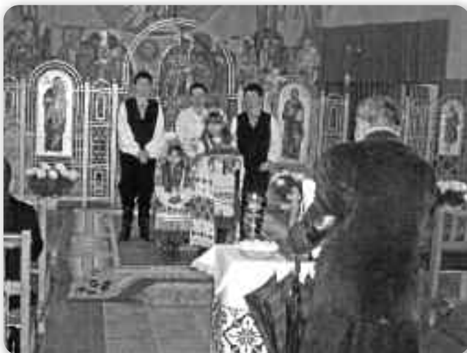
Цепли привит владикови од наймладших вирнікох