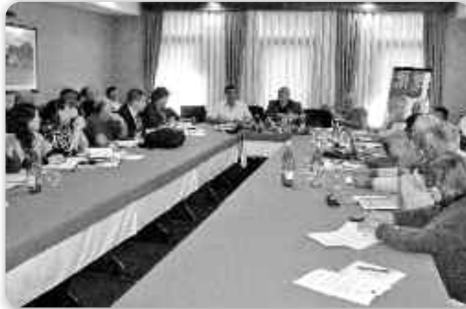
Учасніки семинару у Илоку и Вуковаре

Семинар отримани з нагоди проекта «Змоцненє явней свідомосци о мултиетничносци як позитивному социяльному