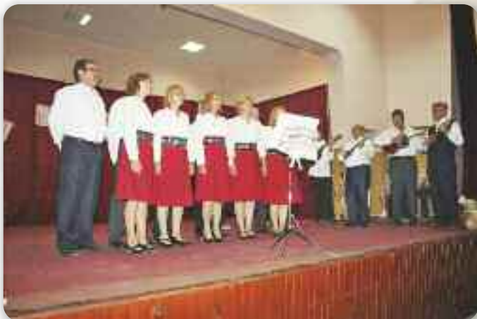
КУД Руснацох Осиек