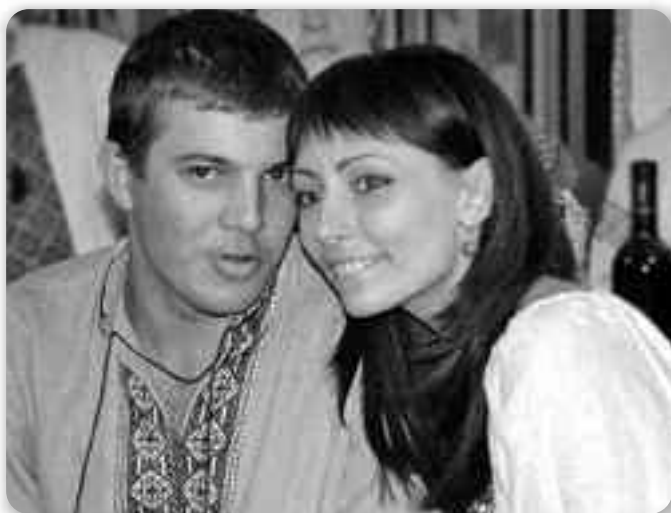
Сільська молодь спілкувалась на вечорницях

Дошлюбне спілкування колись не було так, як сьогодні – через «фейсбук» або «в контакт». Колись дошлюбне спілкування, зокрема сільської молоді, відбувалося зазвичай на людях, причому найчастіше дівчата й хлопці знайомилися в межах свого рідного села. Тож і дружину було заведено обирати, як казали, «зі своїх».