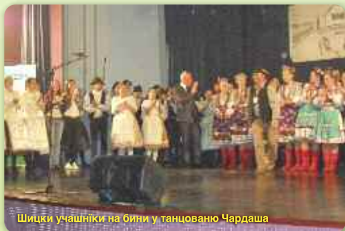
Шицки учашніки на бини у танцованю Чардаша