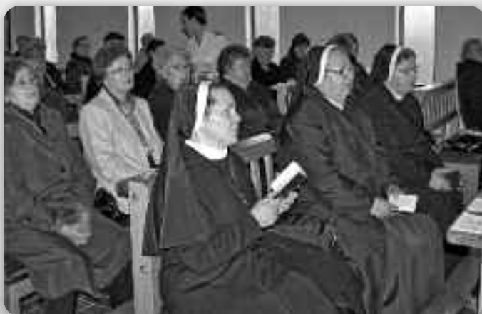
У обновеней церкви Христа Царя у Вуковаре