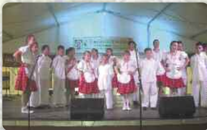
Миклошевска дзезинска фолклорна секција на Етно-сайму у Вуковаре

У пополадновим термину, на 14.30 годзин на етно сайму, под вельким шатором на Плоци Републики Горватскеј, наступело и КУД «Осиф Костелник» з Вуковару. Їх програма тирвала коло godzину и пол. Зоз таким богатим