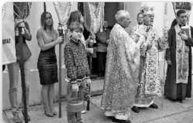
Священіки пред рушаньом процесії