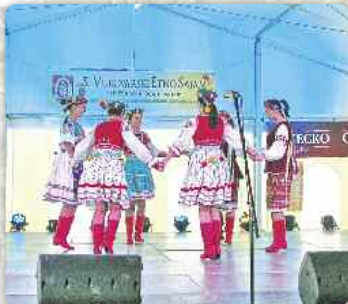
Танечніки КУД «Осиф Костелник» зоз Вуковару

У Вуковаре на централней городской плоци 13. и 14. октобра отримана 5. викладательно-предавательна програма под назву „ЕТНО САЈАМ“, хтору отворел городоначалник Желько Сабо.