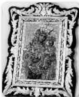
Чудотворна икона Мацери Божей Крилоскей

українським парохам за- кладати церковні школи, а Василіан зреформував і до- ручив їм ведення вищих шкіл. Лев — коли у 1773 році Галичина прийшла під Австрію — своїми заходами щодо цисаревої Марії-Тере- си та цисаря Йосифа II спричинив прихильну по- літику цих монархів щодо українського народу.”