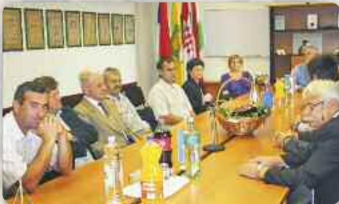
Прием при началнікови Општини Ердут

талног туризма. Промовуе традицију, культуру, гастрономију, ремесла, як и обичај того подручя. Числени роботни котри отримани першого дня Сайму прицагли шицких котри зацкавени же би научели дацо нове, а старе, як цо то нпр. правене рижних стварох зоз слами котри презентовала ОШ зоз Таванкуту, а котри иншак