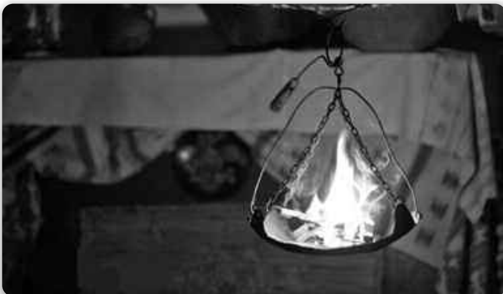
Посвіт - неодмінний атрибут вечорниць

На забавах молодь танцювала, співала, водила хороводи. А коли вже наставали холоди, хлопці та дівчата збиралися на досвітки, посиденьки, вечорниці.