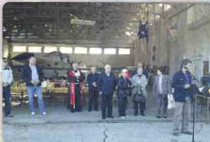
Аероклуб „Борово“ у Вуковаре