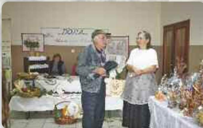
Викладаче на Сайму

познати по правеню прекрасних поглядніцох зоз слами.