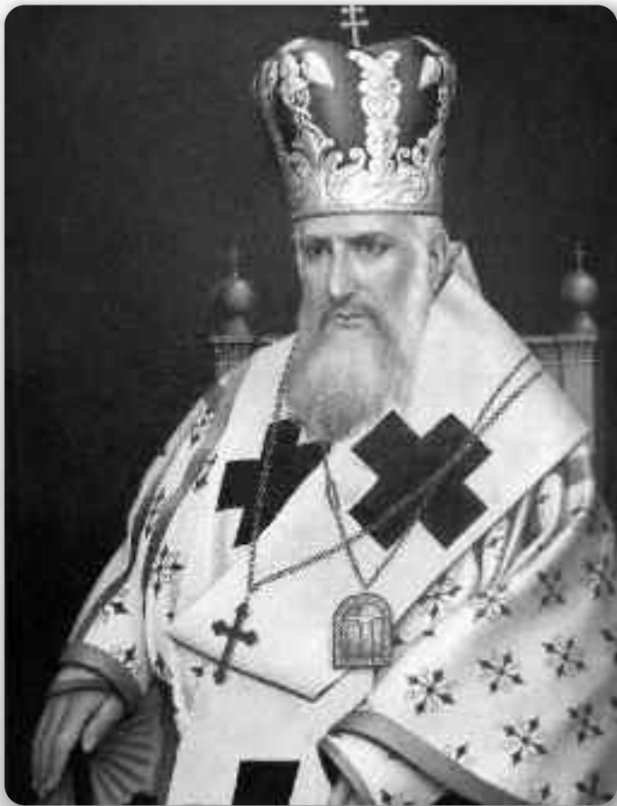
Митрополит Андрей Шептицкий (1901-1944)

Цє львівські владики, Атанасій та Лев, здвигнули величавий храм св. Юра на горі, котра піднімається над містом Львовом. Збудований славними італійськими архітекторами, кафедральний храм св. Юра є одним з найкращих зразків барокового стилю на весь світ. Св. Юр є гордістю українського будівництва та окрасою Львова і цілого краю. Будувався цей храм 30 років (з 1744 до 1774). Всі три щойно згадані митрополити з роду Шептицких визначились як організатори Церкви, культурні діячі та оборонці української народності. Варлаам підніс рівень освіти сільського духовенства та хотів зрівняти його в повазі з духовенством польським. Атанас наказав