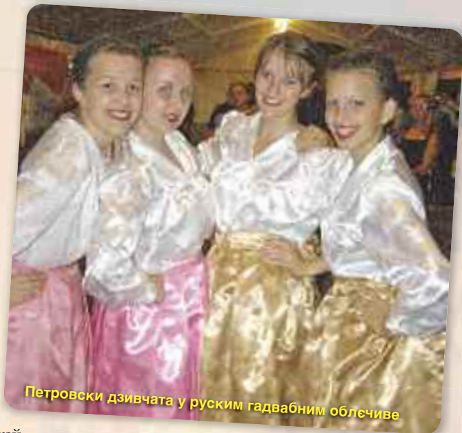
Петровски дзивчата у руским гадвабним обличиве