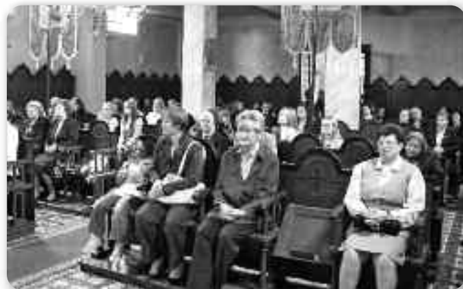
Часц вирнікох на кирбайскей Служби Божей

през историю. Потим ше здогаднул и “Року вири” (хтори почал 11. октобра 2012. а будзе тирвац по 24. новембер 2013. року). Владика наглашел же бизме праве през тот “Рок вири” ягод вирни требали одкривац красоту власного византийского обряду у Католицкей церкви и не ганьбиц ше svojого пред другима, бо шицки обряди Католицкей церкви за Рим равноправни. Остатня часц казані була пошвечена Ма-