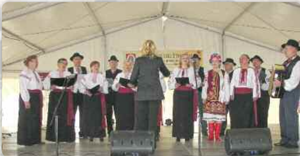
Члени мишаного хору КУД «Осиф Костелник» зоз Вуковару