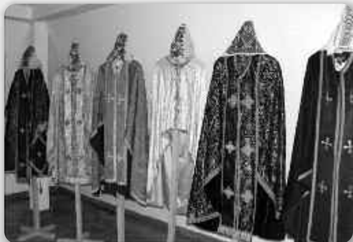
Часц експонатох, шветочни митрополитово ризи

Врацаме ше з Львова знова до Галичу, на нашо початки и найвекши святині. Дзекую- ци праве Андрийови Шеп- тицкому, митрополитови, у чаше медзи двома войнами барз вельо зробене на архео- логийним „одкриваню“ Дав- ного Галича, престолного го- роду князя Володимирка Ро- стиславича, дзе поховани и