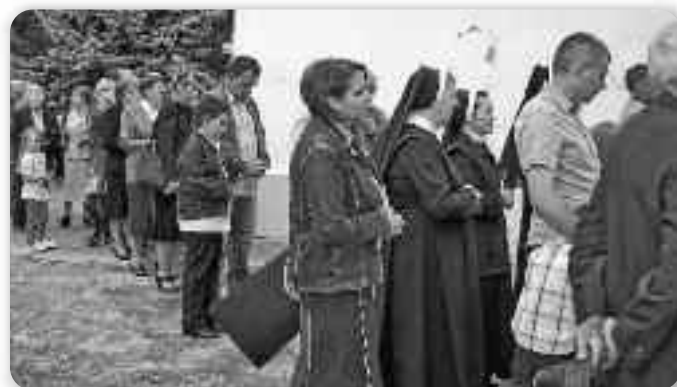
Вирніки у святочней процесії коло церкви

Друга часц кирбайского дня предлужела ше по обисцох, а на радосц наймладших и