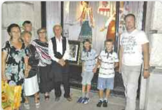
Пред авзлогом на Риєцким корзу

Од 8. по 9. септембер КУД Русинох и Українцох Приморско–горанскей жупанії „Рушняк” по 8. раз організувал уж традиційну културну манифестацію под назву „Дні опери и оперних арийох” у просторе риєцкей културней институції „Филодраматика” на риєцким корзу, точнейше у святочней сали того центра. Саме збуванє добре рекламоване и наявене риєцкей явности на рижни способи, од виложеной бабки у народним облечиве у авзлогу