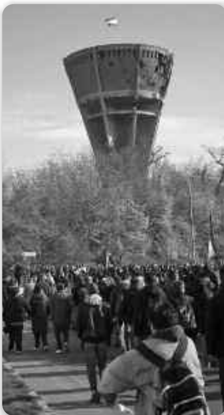
Километерска колона здогадованя при водоторню – символу вуковарского страданя на уходу до Митници

Венци тиж так положили и швички запалели и делегациї Главного штабу Оружійних моцох РГ Управи полициї 204. вуковарскей бригади, чийо припадніки участвовали у охрани Вуковару, цеком хторей забито и страдало 887, а ранєто 1300 припаднікох бригади. Координациї здруженьох насталих зоз Отечества войни городу Вуковару, городох Дубровнику, Синю, Шибенику, Трогиру, Загребу Вуковарско-сримскей и других горватских здруженьох, як и здруженьох организаційних воєних формацийох и других организаційних зоз жеми и иноземства, першенствено зоз Босни и Герцеговини.