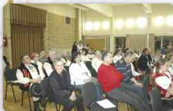
Медзи иншима, патраче пришли и зоз Пишкуревцох