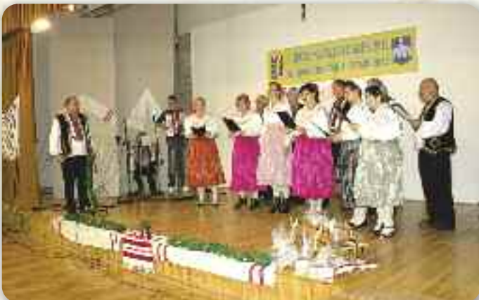
КД РУСНАЦОХ И УКРАЇНЦОХ ВИНКОВЦИ

КУД Руснацох Осиек основал тоту манифестацию, з єдного боку, котри початком децембра преславує Дзень городу Осиеку, а з другого же би ше очувало руске вецейгласне шпиване.