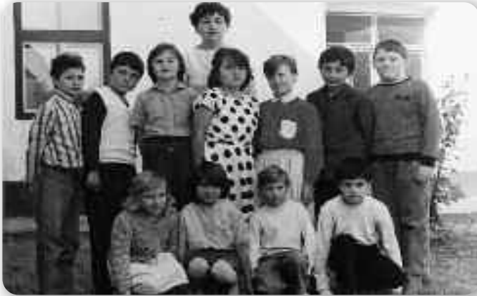
Учителька зоз своїма школярами концом осемдзешатих рокох

тирвали по три дні. Главни задаток тих стретнуцох було злепшане живота у своїм стредку и през пейц роки їх тирваня научела сом писац проекти цо ми барз помогло кед сом у априлу 2002. порушала сноване Дружтва „Нашо дзеци“.