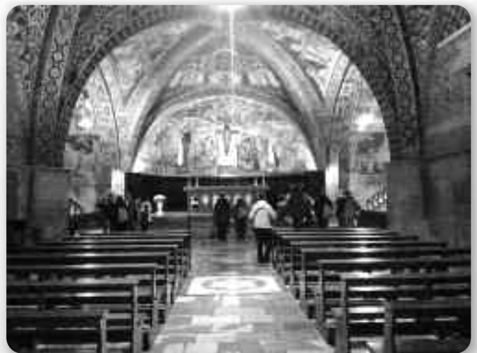
Папски олтар у Долней церкви

приповедаю же є збудована преїг родней хижи св. Франі. Но незаобходне место церква Святей Марії од Ангелох (Basilica of Santa Maria degli Angeli) котра глаши за єдну од найвекших церквох на шведе. У тей церкві ше находзи Порциункола, церквочка у церкви блізко хторей умар св. Франьо. Понеже святы Франьо Асизски барз любел шицки створи и створеня, знал шпивац птицом та го екологове барз ценя. Цикави податок и же перши яшелька