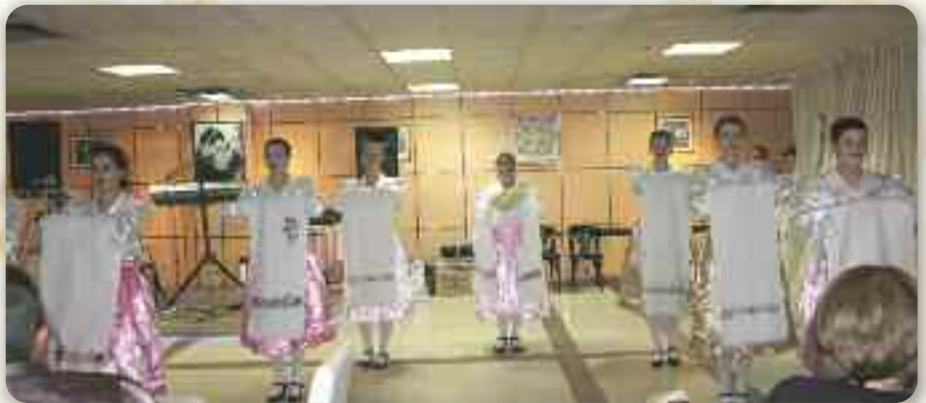
Привитни танец КУД «Яким Гарди» зоз Петровцох

Того року у культурней часци програми участвовало КУД «Яким Гарди» зоз Петровцох. Вони одтанцовали вецей фолкорни точки у хореографии Звонка Костелника, а забавну часц програми анимировал Микс бенд зоз Руского Ке-