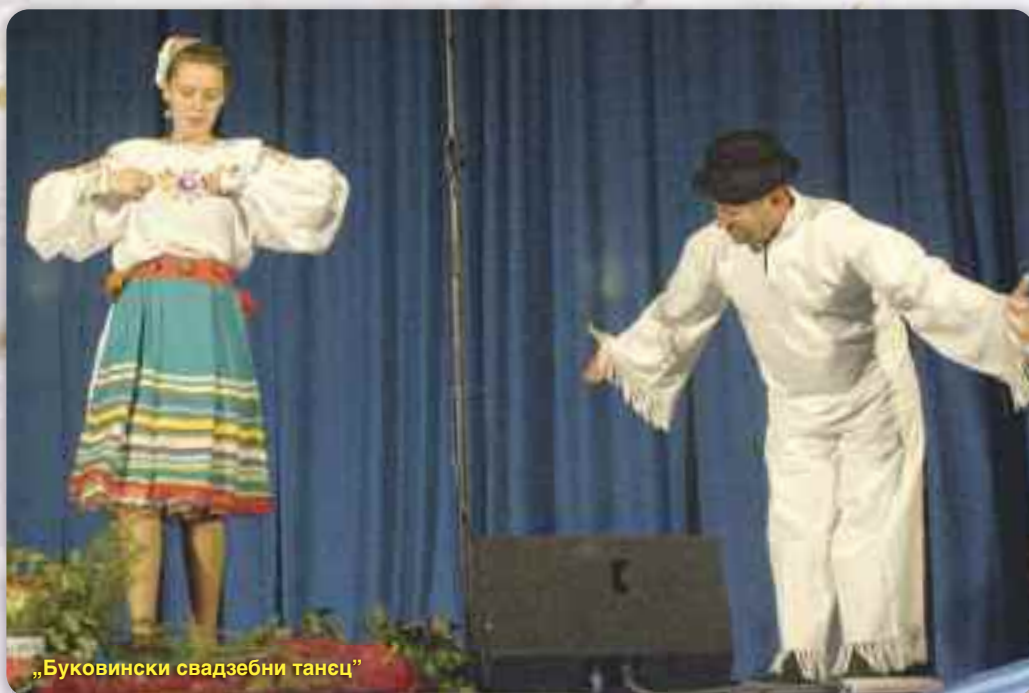
„Буковински свадзєбни танец“

Публика була обчарована на прекрасним наступу петровского дружтва з незвичайними танцами и танєчними миниятурами котрих мали нагоду опатриц и не жаловац дланї же би наградзели вредних аматєрох. Тота смотра у Риєки уж ше трдиційно отримує и найстарша є и найвєкша, а найупечатейша часц програми то култура рижних народох у котрих панує писня и танец як и презентованє старих обичайох, окреме през народне облєчиво.