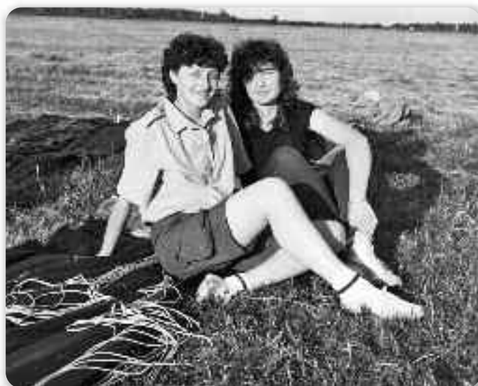
Дні зоз падобранства

З дому сом пошла кед сом по законченей школи достала роботу у фабрики Борово. Причина на перши погляд банална але не було теди тельо авта лебо иншаки можлівосци путованя. Чежко подношим вожно на автобусу, та ми кажди дзень було не-