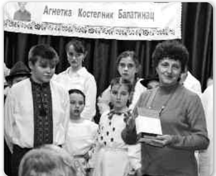
На школским вечару Руснацох у Петровцох

Чежко би тераз було начишліц шицки награди котри були пред войну, але начишлім тоти котри сом достала кед сом ше привйовала на конкурс котри розписує КПД ДОК зоз Коцура бо ше там посилаю писні под псевдонимом и комиссия не вибера по мену автора але насправди по писні. Там сом прешлого року достала першу награду за писню «На концу валала» котру верим, читаче буду мац нагоду пречитац и у тих Думкох з Дунаю, а исту тую писню вибрала и редакция Шветлосци за свойо юбилейне число. Тиж сом, на истим конкурсу, прешлих рокох освоювала треце, друге, а ния,