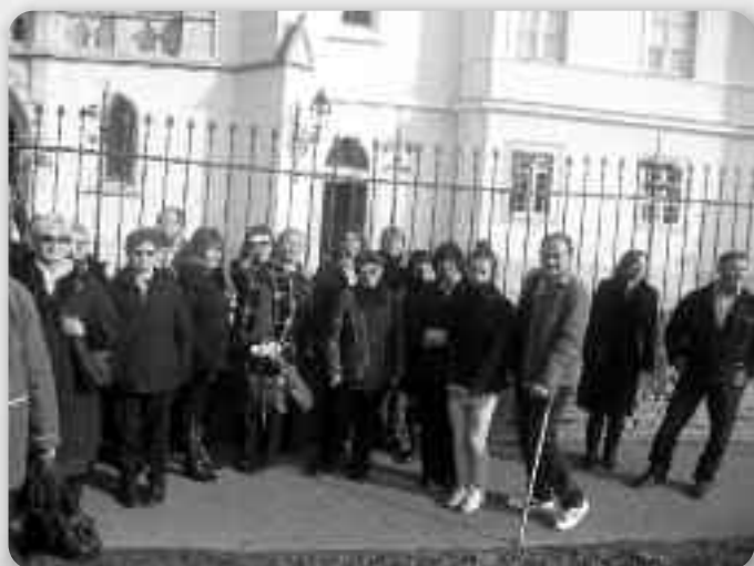
Часц вирнікох зоз Петровцох у розпатраню Крижевцохв