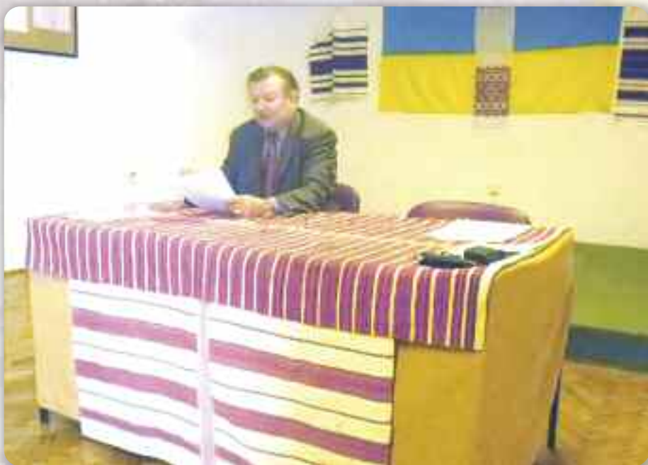
Преподавач и бивши амбасадор Горватскей у України мр. Дјуро Видмарович