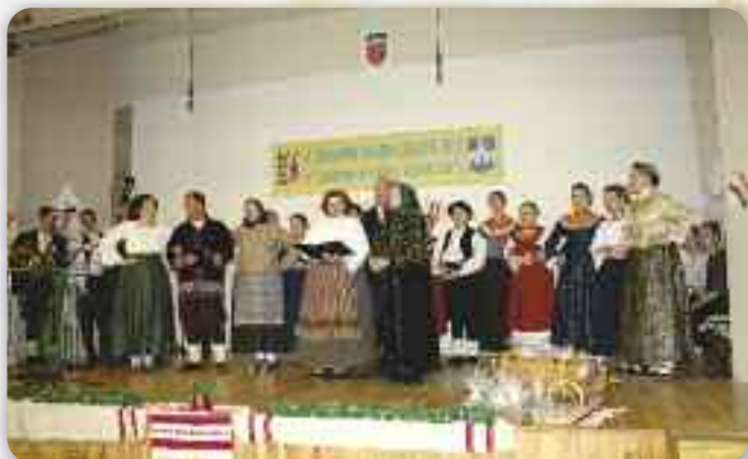
КУД «ЗОРА» ПИШКОРЕВЦИ