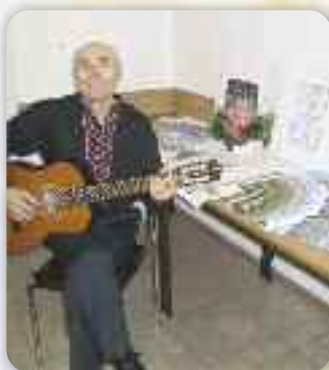
Виводженє авторскей пісні на текст зоз збирки пісні на текст зоз збирки поезії Мелани Вашаш «Мойо квитки»

У ж традиційно, по пияти раз, у Риєки отримани Вечари літера-