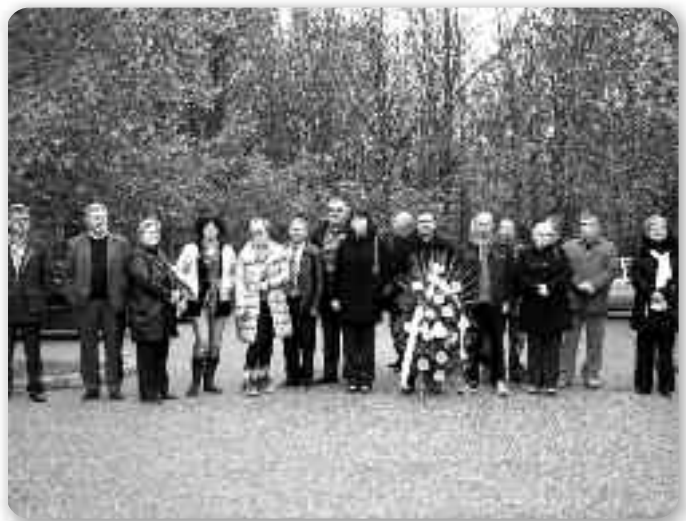
Координация национальных меньшин Вуковарско-сримской жупаниї