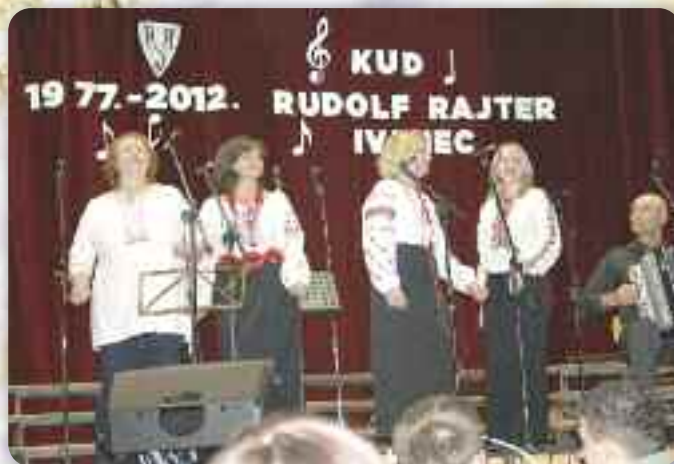
Наступ Каліни у Иванцу