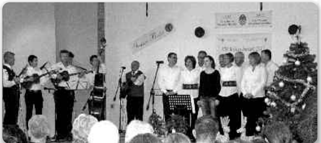
КУД Руснацох Осиеку на Крачунским концерту при Словакох у Осиеку

Так було и того року. Медзи численима Словацкими дружтвами, як госц було поволање и КД Руснацох Осиек котри з провадзеньом там-