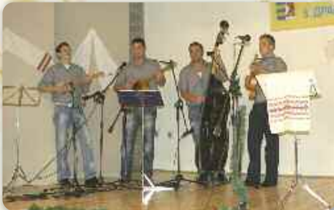
КД РУСНАЦОХ «ЦВЕЛФЕРИЯ»

Потим ше представело КД Руснацох «Цвелферия» зоз Райового села зоз шпиванками «Сї не видно тот мой валал» и «Чия то заградка не орана». Матица Словацка