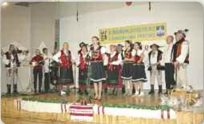
МАТИЦА СЛОВАЦКА ОСИЄК

нацох РГ. Пре винімно невидогну хвилю, шніг котри завял цалу Горватску и парализовал транспорт, число учашнікох було скоро преполовене. Но тоти витирвалши сцигли та «Дравски габи» и того року успишно отримани.