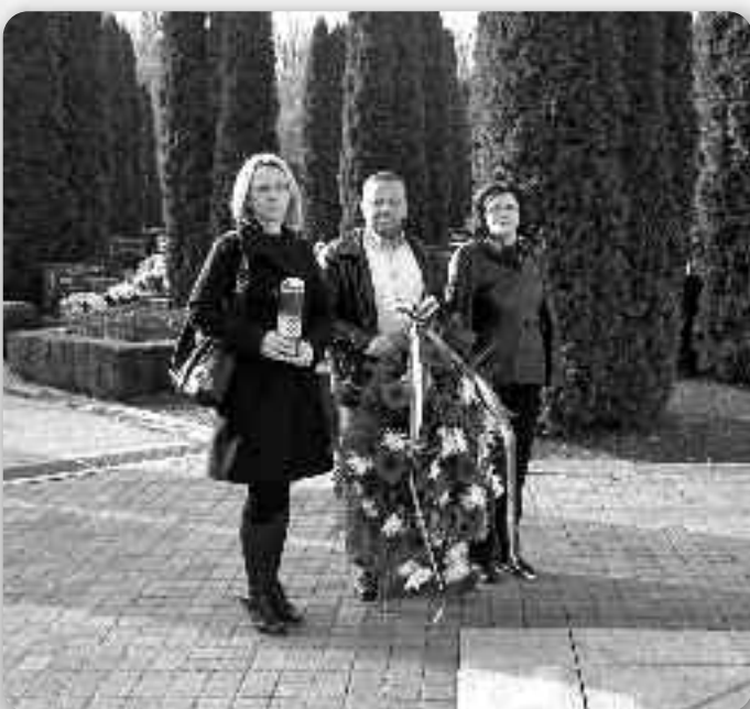
Координация русской национальной меньшини Вуковарско-сримской жупаниї