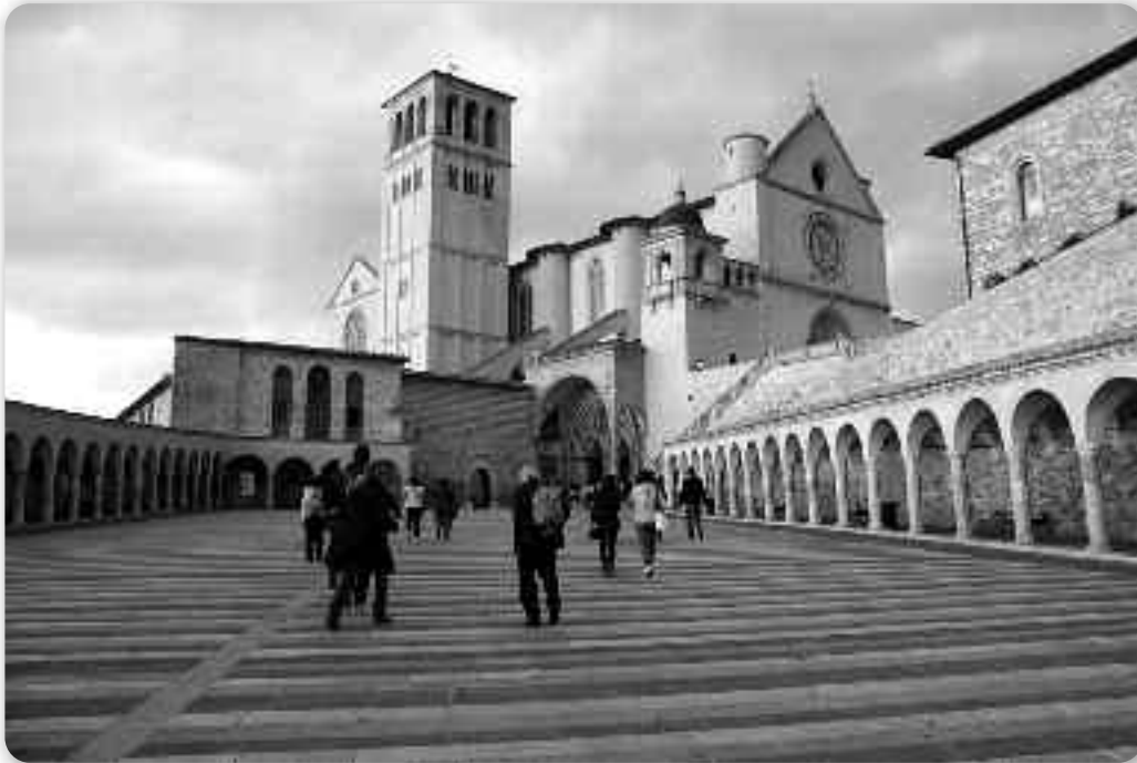
Приход до церкви св. Франі Асизского у Асизу

шичко пообиходзели. Медзи иншима знаментітосцами ту и штредньовиковни замок Рока Мадіоре котри збудо-