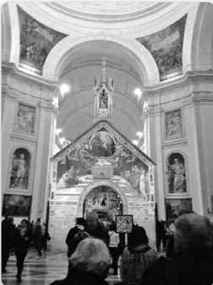
Порциункола, церквочка у церкви Святей Марії од Ангелох

През историю Асиз бул значни по рижних збуваньох, а нешка глаши за незаобходне паломніцке место. 1997 року Асиз потрафели два руйнуюци трешеня жеми, та велі знаменітосци зруйновани, але