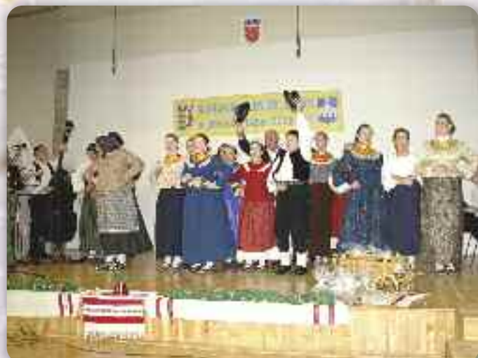
КУД «Зора» зоз Пишкуревцох з традицийним поздравом зоз калапами, на одходу з бини, поздравя патрацох

Пишкуревцох, та зме нараз мали еден вельки оркестер котри грал так зложно як же роками гралѣ вѣдно. Учашніки и нацивителе за танцовали, а вѣц ше зменьовала руска, словацка, горватска писня, а добре роз-