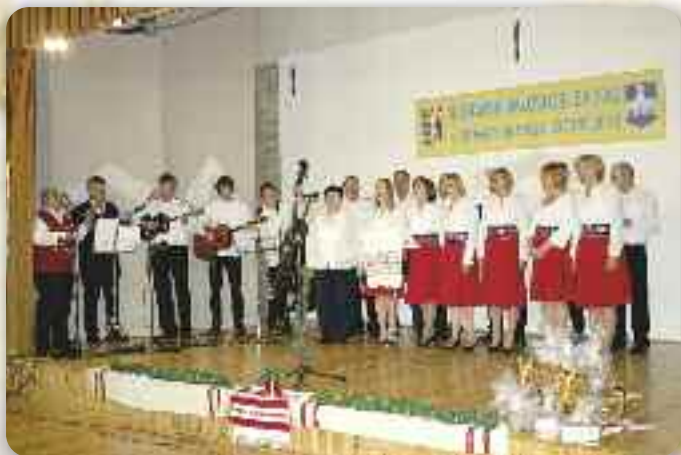
КУД РУСНАЦОХ ОСИЄК

У Осиеку, всоботу, 8. децембра 2012 року, у організації КУД Руснацох Осиек, а з финансијну потримовку Совету за национални меншини РГ и городу Осиеку, отримани 8. «Дравски габи», стртнуце хорох и шпивацких групох Рус-