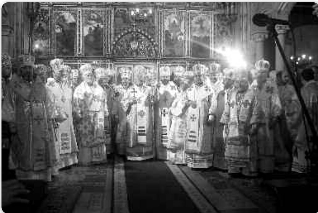
Грекокатоліцки владикове у крижевскей катедралі Пресвятей Тройци