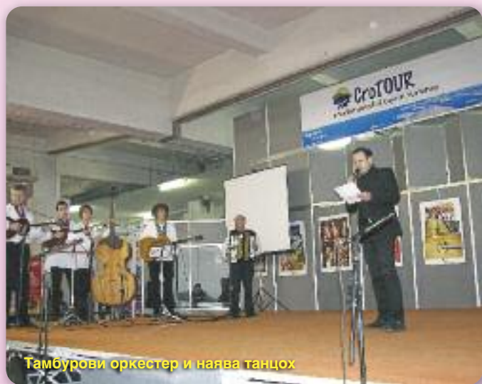
Тамбурови оркестер и наява танцох