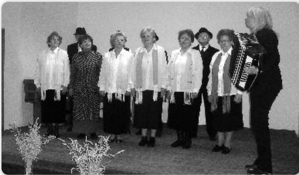
Мишани хор КУД „Гавриїл Костельнїк” зоз Кули