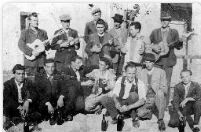
Тамбурови оркестер основани 1955. року у Петровцох