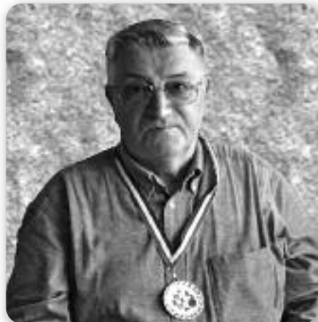
Златна медаля на першенству Горватскей у кугланю у категорії «У71»

– И не спрєведли сце ше. Постали сце перши у Горватскей у своєї категорії. Поведзце нам даскельо импресии зоз прег-