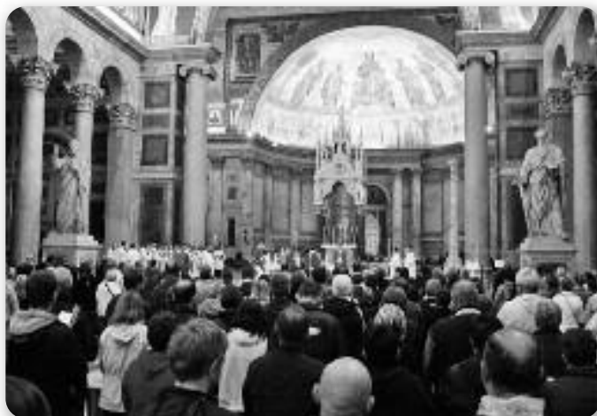
Нукашньосц базилики св. Павла (Служба Божя)

та отадз и назва "вонка з мурискох" у наслову. Гоч ше не находзи у Ватиканским Городу, з Латеранским контрактом, базилики додзелени екстериториялни статус як власніцтву Святого престолу. Будоване базилики започате коло 386. року, под час владивини цара Константина велького на месце историйного гроба св. Павла. Базилика сама по себе грандиозна, а напрез ше находзи, ми би поведли конк и то штиробочни котри обрубую 150 слупи у стилу старохристиянских базиликох, а у штредку скульптура св. Павла зоз вицагнуту шаблю. Базилика ма пецери уходни дзвери, а крайні прави то Святи дзвери котри замутовани и отвераю ше лем под час преслави Святого (Ювильейного) року. Нукашньосц теї пейцладьовеї базилики велічезна, зоз безкрайним шором слупох помедзи котри доходзи шветлосц з двойністих облакох од алабастру. Визначую ю скульптури 12 апостолах, мозаїки шицких папох од Петра та по Бенедикта XVI (нешкайшого Папи), фрески котри приказую живот апостола Павла, та даскельо каплічки. Повала у ренесансним стилу у билих и златних фарбох. Базилика 1823. року знічтована у огню, а обновена є спрам стародревних нарисох под час папи Пия IX, 1845. р. Цикаве же єден од добродійох котри помогнул обно-