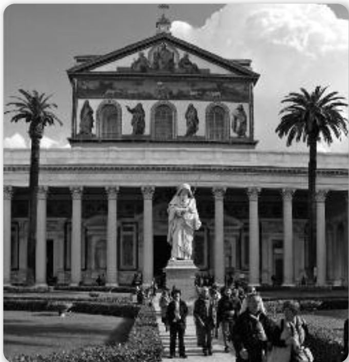
Напрез базилики св. Павла