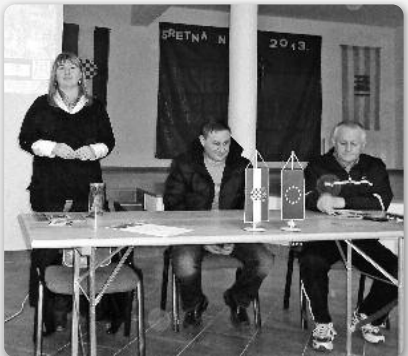
Представени проєкт наводньованя