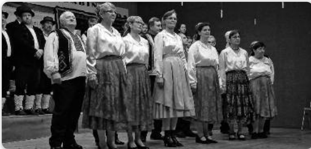
Члени КУД Русинох и Українцох зоз Винковцох на бини у Бабиной Греди

Першого дня наступели седмнац ґрупи зоз хторих два були вонка з конкуренції, а петнац ґрупи мали змагательну улогу у вибору найлепшей шпивацкей ґрупи у нашої жупанії. Предлужене змаганя тиж так ше традиційно ор-