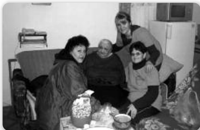
Članice Udruge u obilasku staračkih kućanstava

našim posjetom, a željeli smo ima otvoriti vrata i srca najprije pred Božićne blagdane koji su posebni jer svima donose radost rođenja maloga Isusa. Mnogi od njih su usamljeni u svojim kućama. Razgovarali smo o njihovim problemima, a najviše ih brinu bolest i usamljenost. Većini djeca žive daleko, pa su tijekom godine najčešće sami. Neki nemaju nikoga tko bi im pomogao, a žive u jako teškim uvjetima. Naišli smo na obitelj koja nema