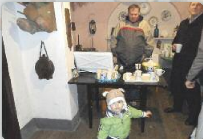
Медзи нащивителями були и дзеци