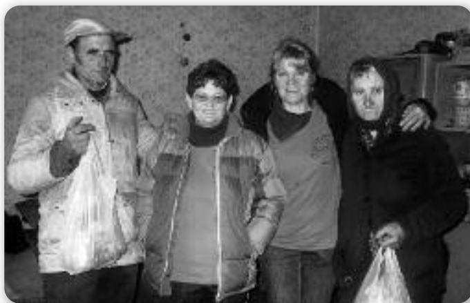
Trenuci radosti uz članice Udruge

u svoj plan i projekt rada uvele smo i obilazak starih i nemoćnih jer smo smatrale da je to potrebno u našem selu. Sredstva kojima raspolažemo su mala, te smo ovoga puta posjetili 15 osoba, a ima ih puno više. Odlučili smo na našim sastancima da pred Božićne i druge blagdane obiđemo stare i nemoćne. Želimo da im svojim dolaskom i skromnim darovima donesemo malo radosti u njihove domove. Mnoge smo ugodno iznenadili