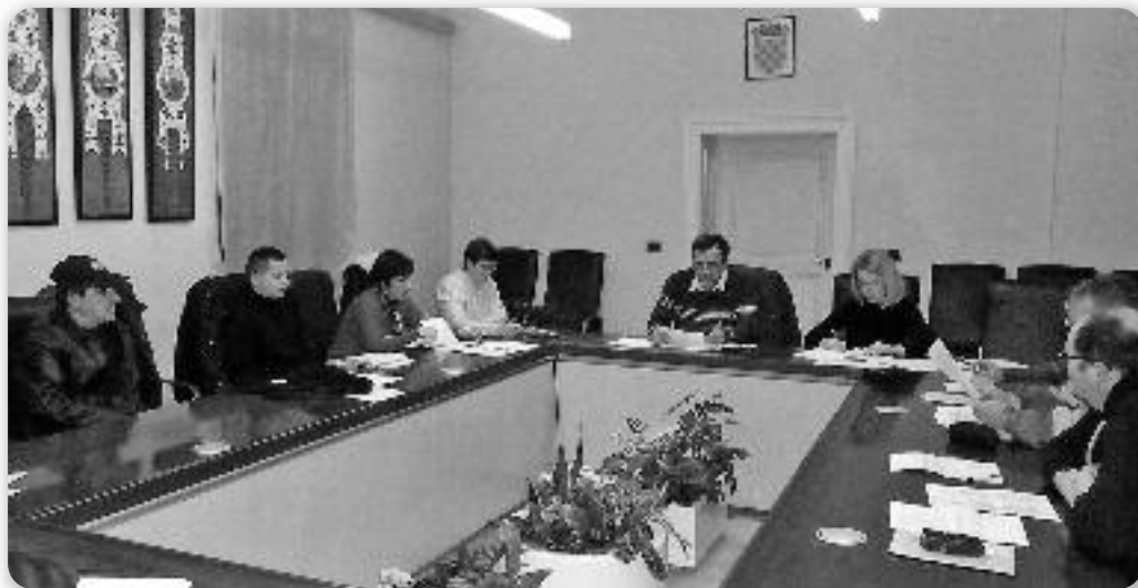
Члени Координації руской націоналней меншини на схадзкі у будинку Жупанії вуковарско-сримской

даню Руснацох у Отечественней войны; Контакти зоз Руснацами у Републики Горватской и сотрудничтво зоз Руснацами у иноземстве; Просвита, спорт, информованє и електронски медії. Шицко тото попровадзене зоз финансийним планом хтори за 2013. рок зменшани у одношеню на прешли рок, але ше будзе патриц виполніц план кельо то будзе можліве. План и програма роботи як и Финансийни план за 2013. рок принешени єдногласно. На слідующей схадзкі Ради руской націоналней меншини Вуковарско-сримской жупанії, остатней у 2012. року, хтора отримана 27. децембра у Вуковаре, медзи иншим, направени ребаланс бюджету за 2012. рок. Понеже ані не було вельких одступаньох и лєм дзепоедни ставки були пребити, 1. ребаланс бюджету за 2012. рок направени и єдногласно прилапени. Председатель Ради дал звіт о 5. Рутенияди хтора отримана 26. августа у Старих Янковцох. Коло шицкого, було бешеди и о резултатох пописованя жительох 2011. року у Вуковарско-сримской жупанії, дзе шицких жите-