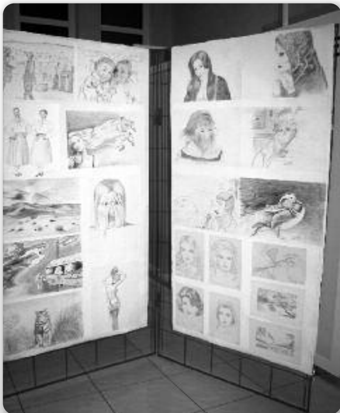
Графика наймилша тєхнїка Влади Мудрого