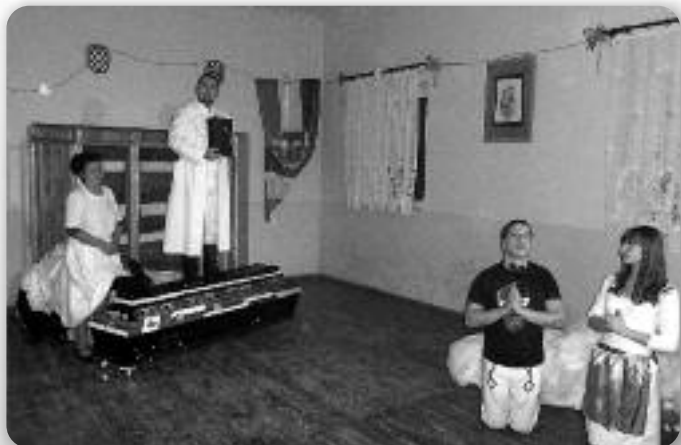
Сцена зоз Русалки