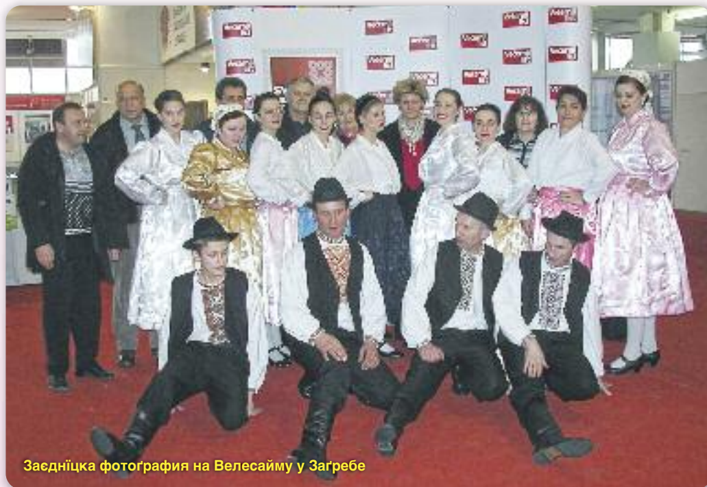
Засідниця фотографія на Велесайму у Загребі

калапи. Програма почала на час, а Вуковарчане Руснацох представели зоз штирома танцами: “Чийо же то волки” и “Увиванец” у виводзеню дзивоцкей танечней секції, а ветеране одтанцовали танец “Три гвиздоочки на небе” и мініятуру “Буковински весельни”. Кед ше одпитали од публики и уж попреблекали, несподзивано пришла поволанка з боку організаторох же би дали ище еден таки наступ на 15,30 годзин цо вони з одушевийом прилапели. Знова ше попреблекали и, ніч подлейше, презентовали культурни скарб Руснацох.