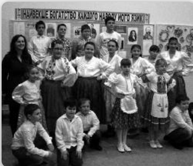
Учашніки програми у школским будинку

На Генералней конференції UNESKO 1999. року було прияте ришенє означованя Медзинародного дзеня мацеринского язика, зоз цильом потримованя язиковей и культурней рижнородносци. При