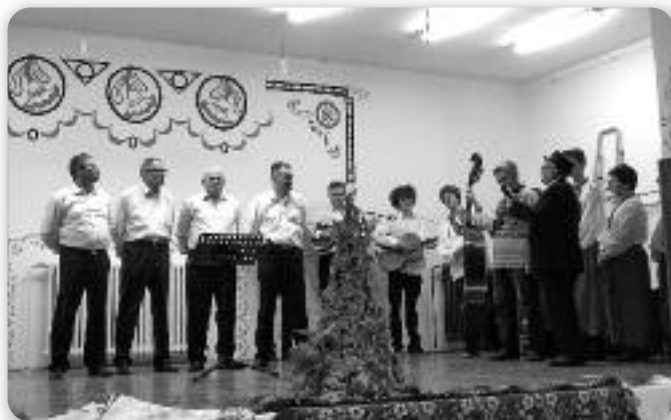
Члени КУД Руснох зоз Осиєку