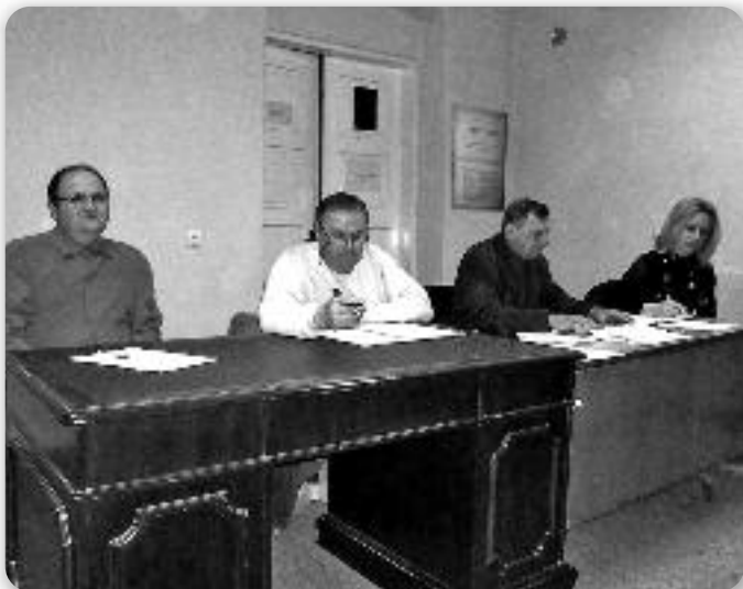
Члени роботногo Предсидательства КУД «Яким Гарди»