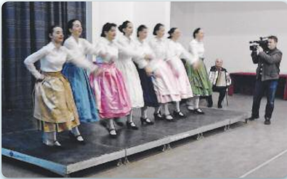
Танечні ансамбл КУД «Осиф Костелник»

На Горватській телевізії 15. фебруара у Меншинским мозаїку була приказана емисия о Руснацох у Вуковаре. Найва за тоту емисию под назву “На побережью двух риков” ишла так даяк: “Корені цагаю зоз Карпатох. Розошати су по цалим швецю. Не маю свою державу, але маю власне мено, язык и мощну националну свидомост. Вони Руснаци. У городу – герою Вуковаре скорей пол століття пренашли свой дом...”