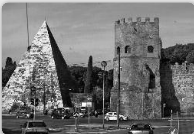
Цестийова Пирамида и Аврелийово муриска