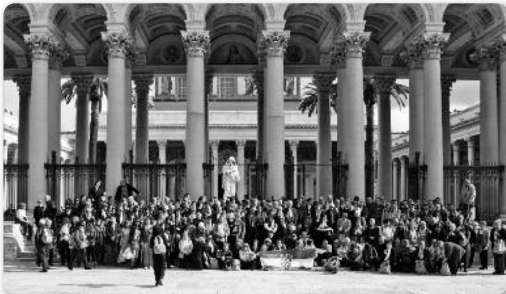
Паломніки Дяковско - осецкого надвладичества напрез базилики св. Павла у Риме

Фриштик бул на 7 рано, а вец коло пол осмей до автобуса, та на перше стретнуце з Римом. Гужви на калдерми