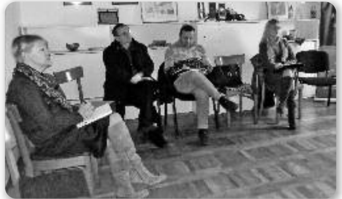
Часц учашнікох Совитованя

нежу за рижни проєкти, як на приклад за: реконструкцію етнографскей збирки и вибудов дома култури, та на тоті питаня зме и достали