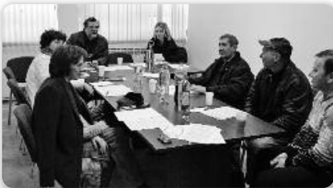
Члени Координації рускей націоналней меншини РГ

Восботу, 23. фебруара 2013. року, у просторіях Ради рускей націоналней меншини городу Вуковару, отримана східка Координації рускей націоналней меншини Републики Горватскей. На дньовим шоре були питаня од значносци за континуовану роботу Координації. Присутни були шцики члени окремих представителів рускей націоналней меншини Городу Загребу, котри пре невігодну