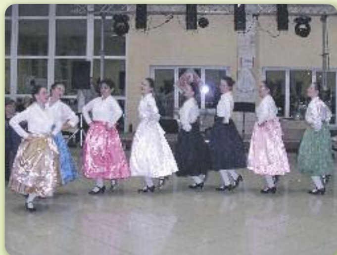
"Чийо же то волки"