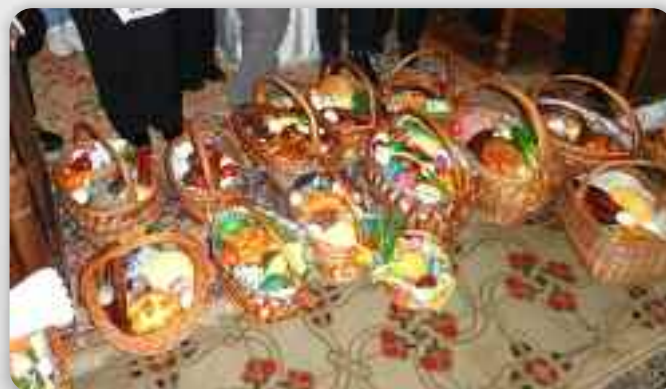
Кошарки на пошвецаню паски