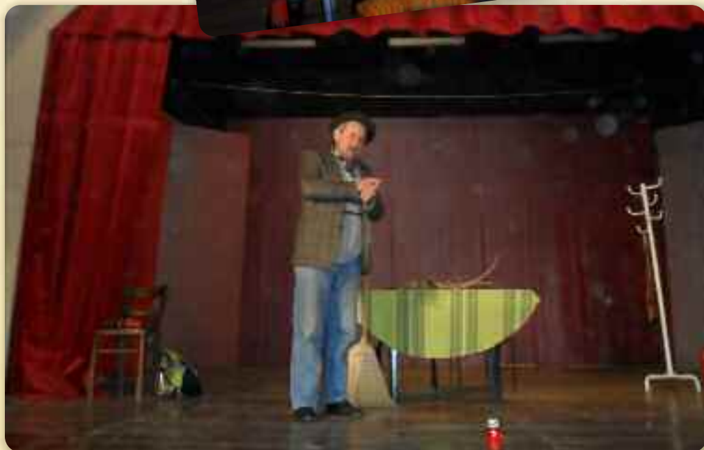
Найлешпе у своїм дворе