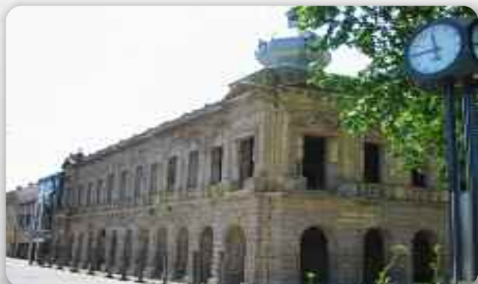
Будинок Роботніцкого дому у Вуковаре пред обнавляньом