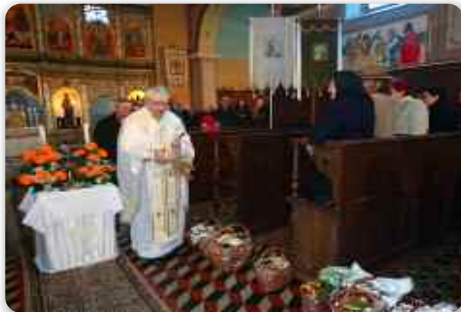
Велька ноц у Миклошевцох