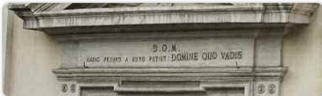
Чловєчє дзє идзєш?

На драги, преходзимє коло Константиновог славолуку. Славолук з троїма дзверми збудовани за цара Константина I, дзєшка медзи 312. и 315. роком, як памятник на Костантинovu побиду над Максєнциєм 312. року. Историчар Евзєбие гутори же ше царови Константинови пред битку указал криж и коло нього грєчески надпис „touto nika“ (з тим побєдзуй). Того року означуєме 1700 роки од Миланского едикту, уредби котру 313. року у Милану ведно прєглашєли Константин