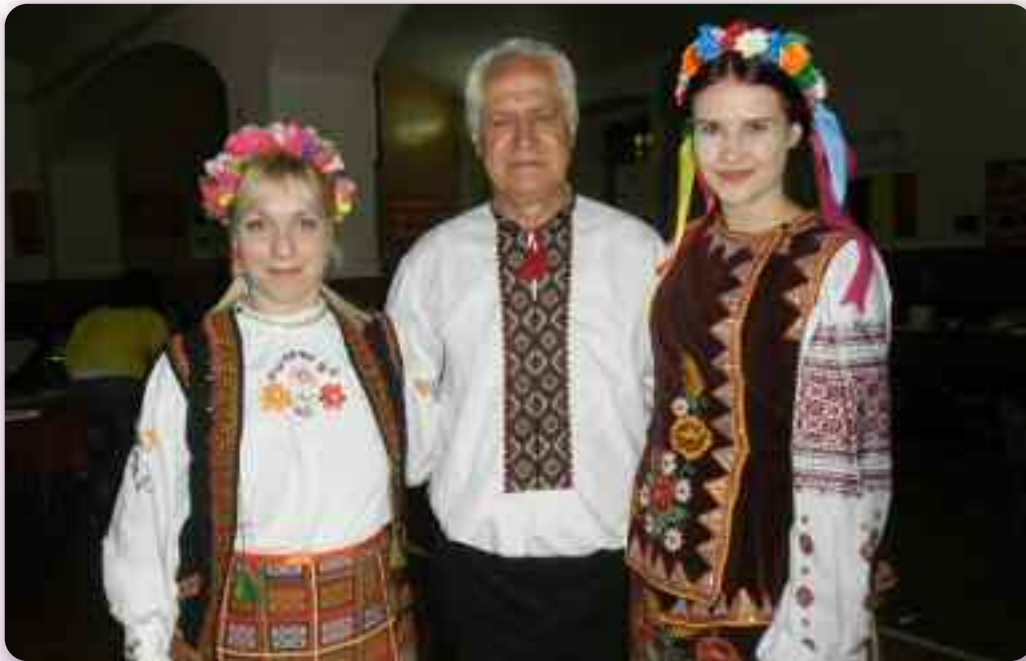
Народне облечиво зоз централней України

Штредня економска школа „Мие Митровича” зоз Риски у своїм курикулуму ма проекти вязани за упознаване горватскх жителях зоз другима народами и жителями Европи. Проект лепшого познаваня народох чийо держави члени Европскей унії, до хторей того року як пол-