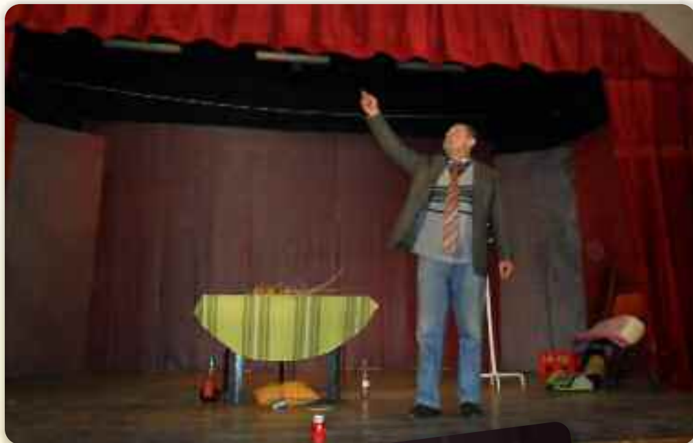
Як го кум водзел на лови