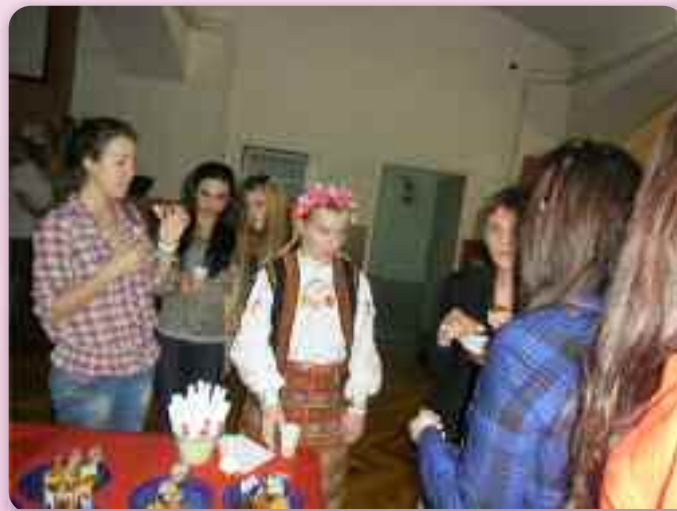
Смак традиційней рускей и українскей кухні