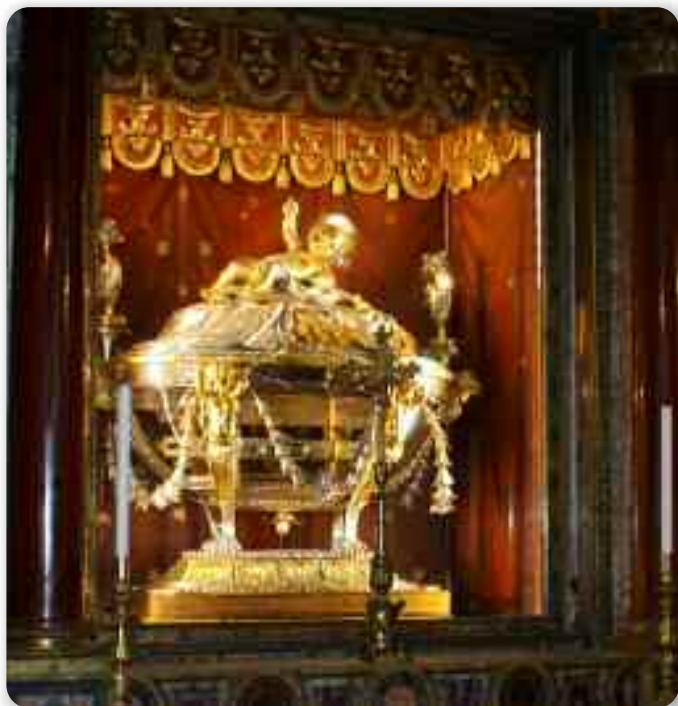
Реликвії вифлеємських яшелькох

на Ефезким соборе 431. року преглашена догма о Марійовим божественним мадеринству, то постало барз значне за спознане же Марія не лем мац дзецка Исуса, але є мац Сина Божого. Папа Сиксто III жадал же би ше то приближело людзом, та так кажди хто уходзи до тей базилики, уходзи до таїнства котре Церква жадала наглашиц з будованьом того прекрасного мариянского храму.