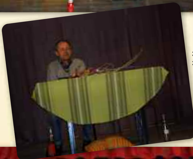
Здогадоване та женідбу