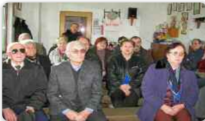
Члени КУД «Осиф Костелник» на Скупштини