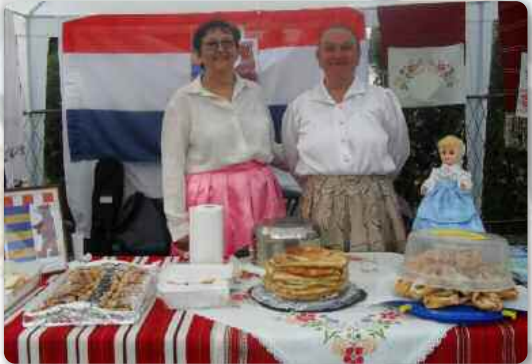
Вистава руских национальних едлох

Преслава Дня национальних меншинох уж ше традиційно каждого року означує у даєдним месце у жупанії дзе заступени национални меншини, а домашні преслави