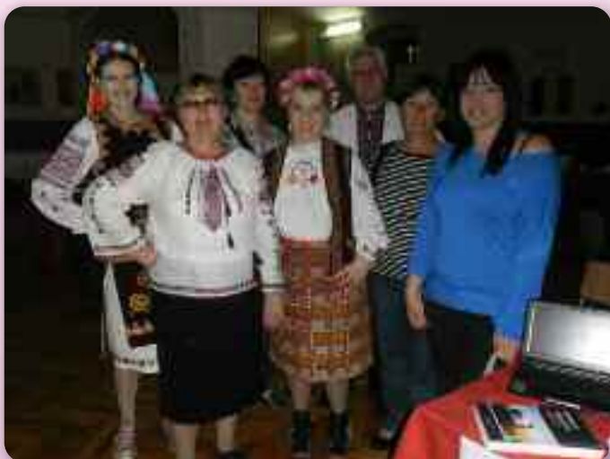
Члени КУД «Рушняк» зоз Риски