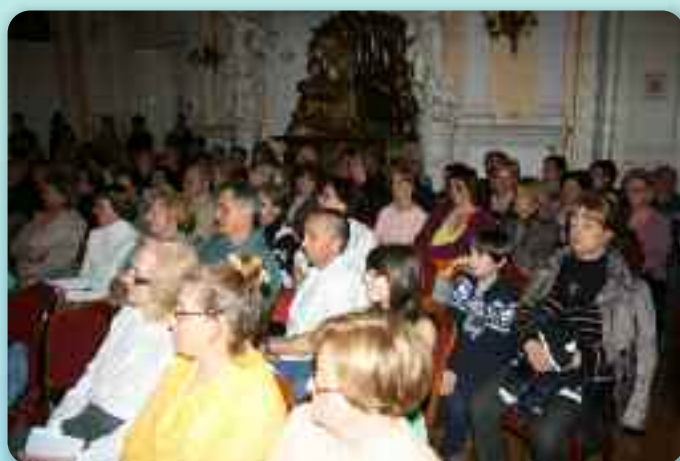
Публика на концерту