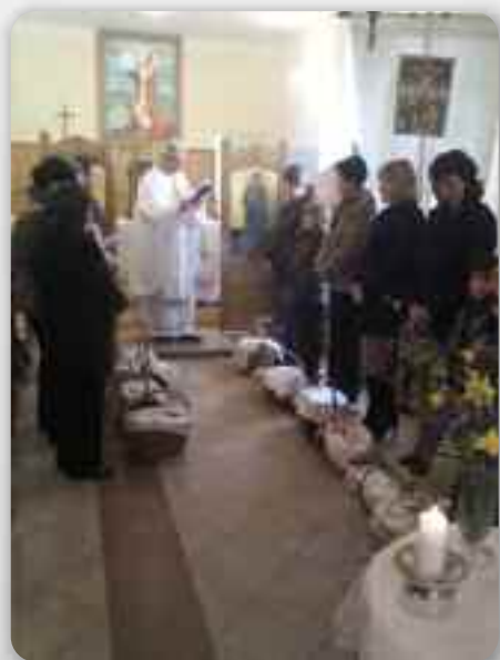
Вельконоцна Служба Божу у Райовим Селу