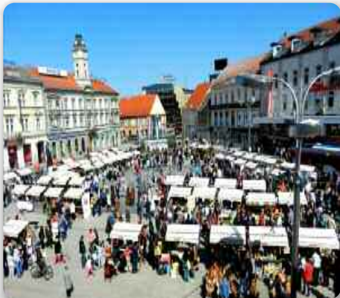
Панорама городской площади на котрей були поставени штанди за манифестацию „Цифровани вайца у фарбох городу“