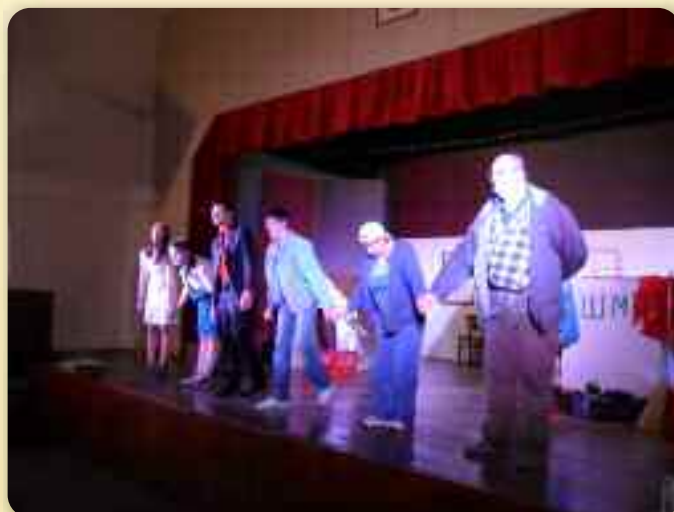
Цали ансамбл пред домашню публику