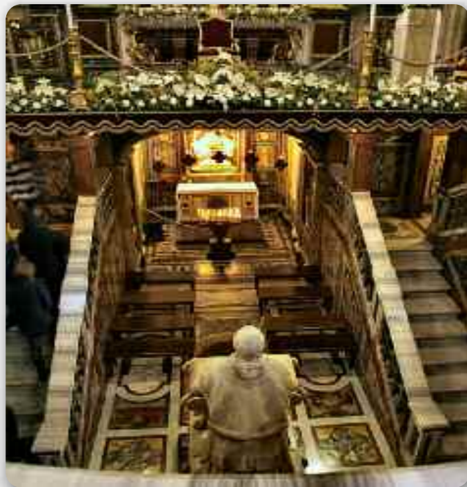
Крипта у базилики св. Марії Велькей