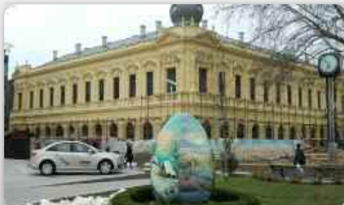
Нова обновена вонкашньосц Роботніцкого дому