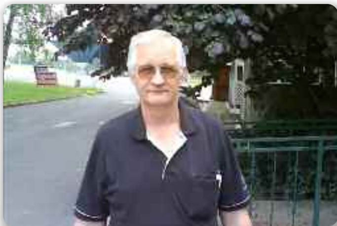
У розваги у Самобору