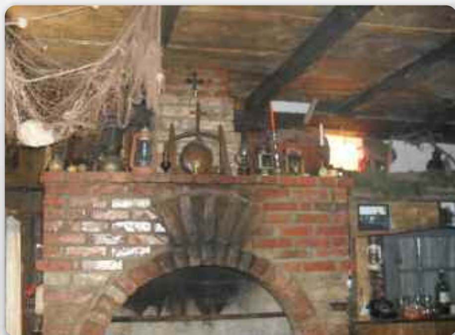
Нукашньосц шопи у Грубєнєвих ушорєнау духу прешлих часох