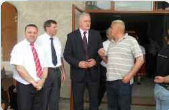
Зоз жупаном Вуковарско-сримским ( другим з права) пред початком програми