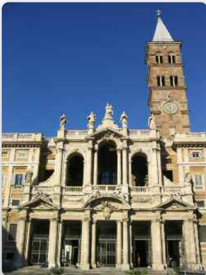
Базилика св. Марії Велькей

У базилики, окрем папох, поховани и вєлї значни особи, а медзи инашїма ту и крипта фа-