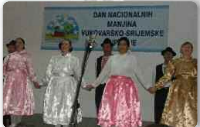
Часц руских танцох у виводзеню КУД «Осиф Костелник» зоз Вуковару

Руску националну меншину представело КУД «Осиф Кос-