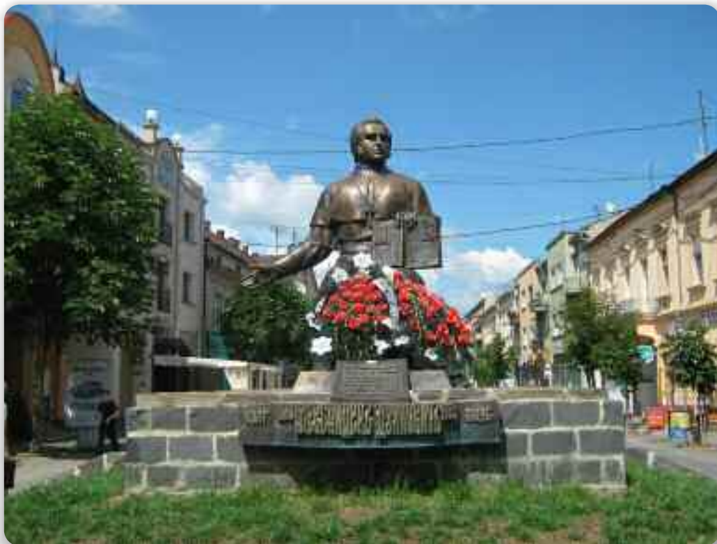
Памятник Духновичови у Мукачове

У януару 1844. року преглашени є за каноніка у Прешове, дзе ше стаємно населює. Там Духнович розвива педагогийну, культурно-просвитну, литературну и видавательську діялносц. Заїмал ше зоз станом и розвиваньом народней просвити: писал и видавал школски учебніки, видал молитовнік, записовал народну творчосц, писал и видавал