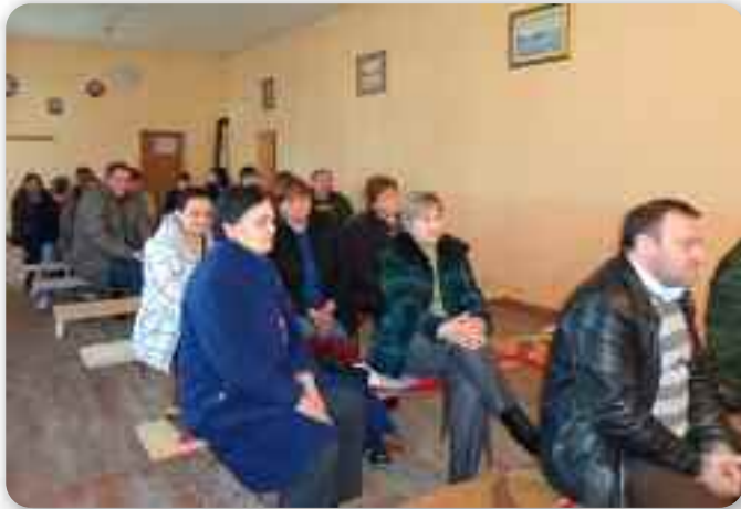
Зоз Скупштини КУД у Миклошевцох