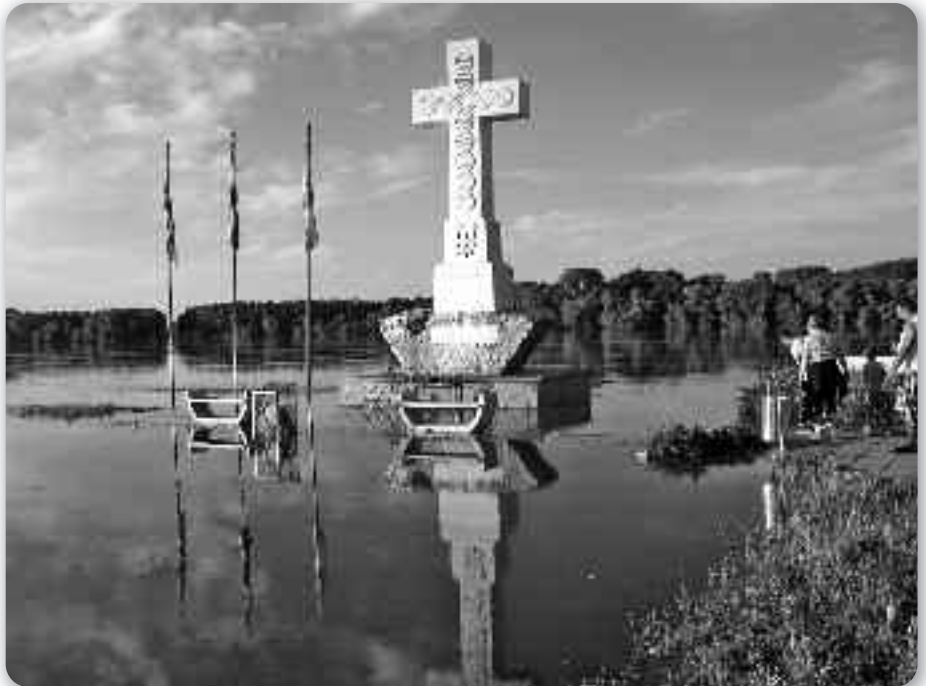
Дунай ше вилял по криж. Памятнік у центру Вуковару