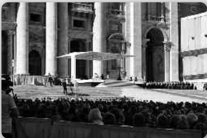
На площі под час авдиєнції

Моїо з автобуса ше порозиходзєли по околних дутянчиких зоз сувенирами, а я пошла гу обєлїску на площі ище дакус на мире поскладац импрєсїї зоз стретнуца зоз Святим Оцом, посєц свой полудзєнок «з торби»... Пред нами була ище досц напарта програма за тот дзєнь.