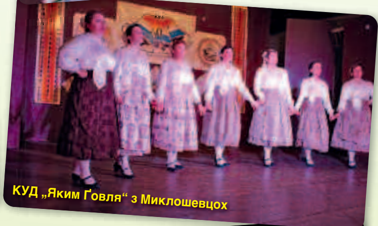
КУД „Яким Говля“ з Миклошевцох