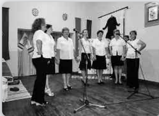
Женска шпивацка група КУД „Яким Говля“