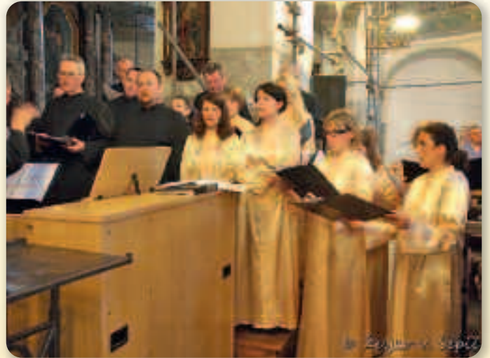
Катедрални хор зоз Крижевцох