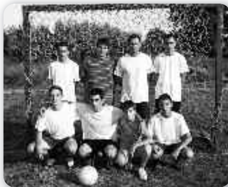
Бавяче екипи ОПГ „Вито“

були подзелени на два групи. Першо и другопласовани екипи зоз групох бавели полуфинални змаганя, а за финале ше пласовали: екипа ОПГ „Вито“ хтори победзела екипу „Гайдукових“ зоз 2:1 и екипа „Бимбо“ хтора после регуларного цека змаганя (0:0) на пенали зоз 2:1 победзела екипу „Леняк“ 2:1.