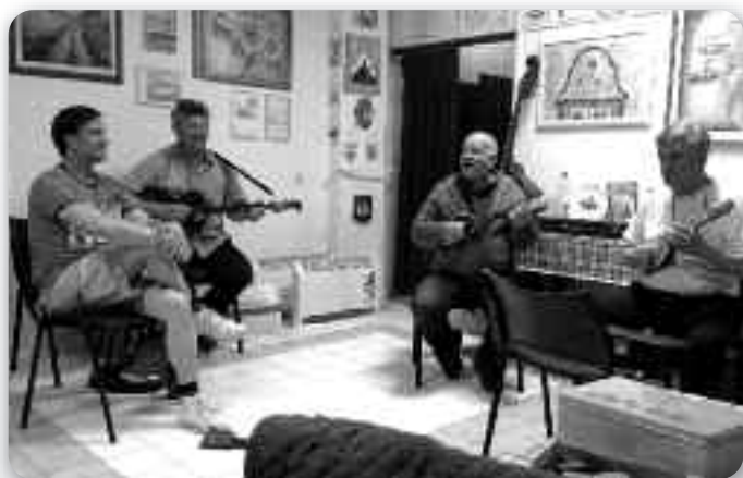
Дзень отворених дзверох

Манифестация задумана же би ше меншини вецей збліжели и презентовали, у тим