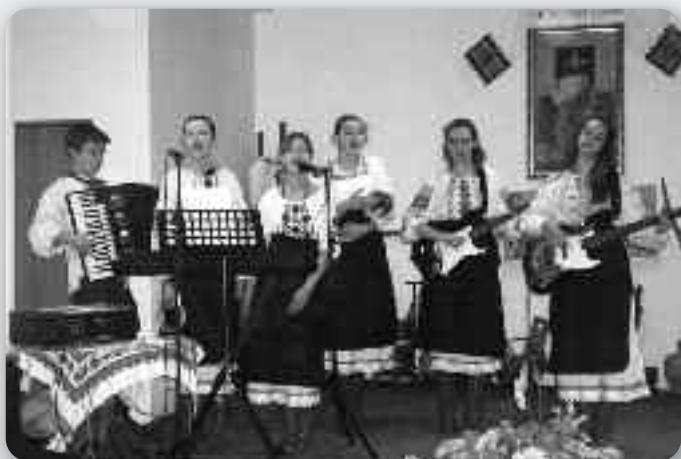
Дитяча група «Сонечко»