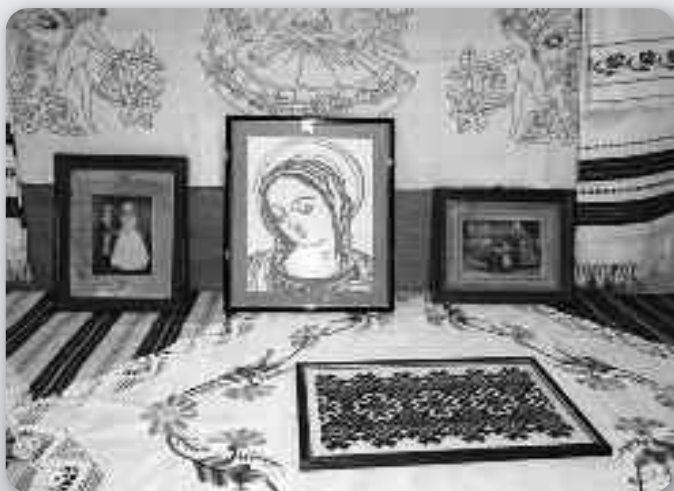
Часц вистави вишивкох и другей творчосци