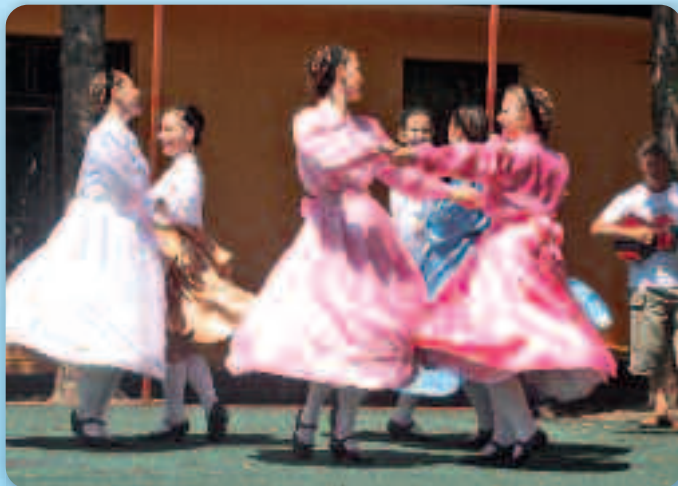
Дзивоцка група КУД «Осиф Костелник» з Вуковару на завераню Колонији