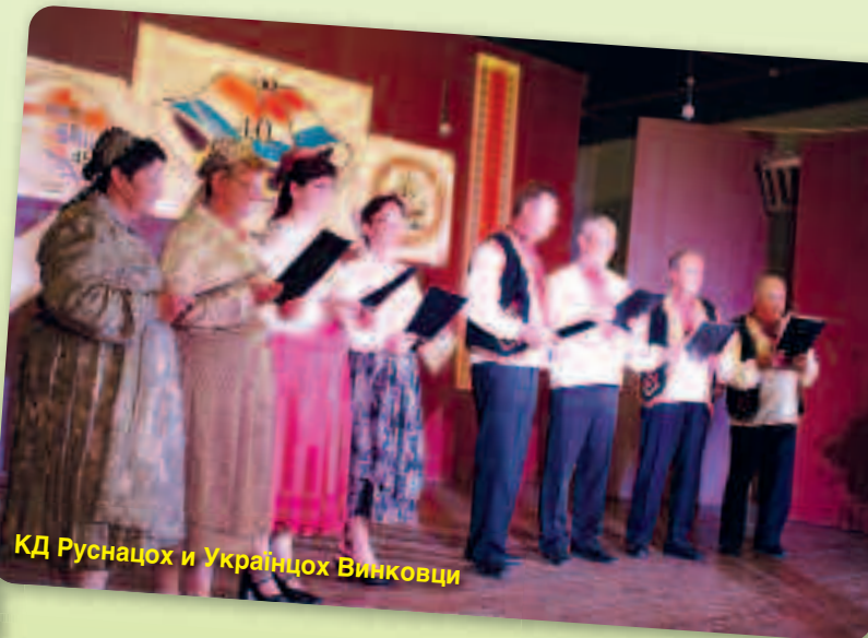
КД Руснацох и Украинцох Винковци