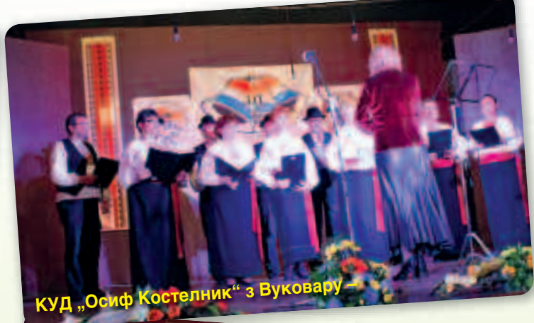
КУД „Осиф Костелник“ з Вуковару –