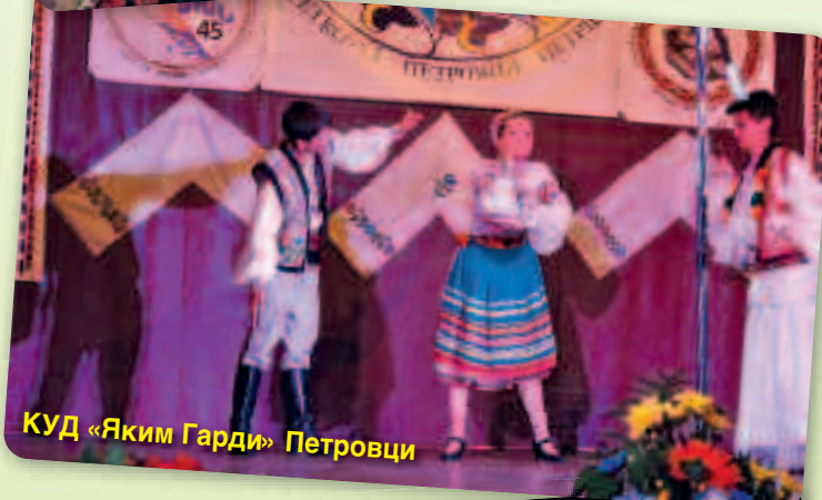
КУД „Яким Гарди“ Петровци