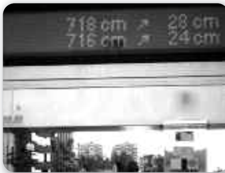
Електронічна табла днями указовала роснуце водового уровню