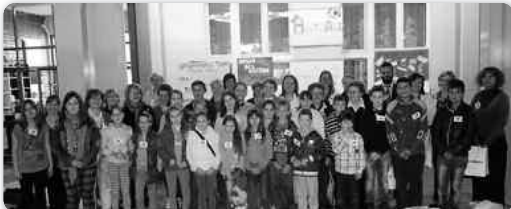
Шицки учашніки 19. Стретнуца школох

П ершого юния 2013. року у Основней школи «Велько Влахович» у Крущичу, недалеко од Руского Керестура, було отримане Дзеветнасте стретнуце руских школох котре організовало Дружтво за руски язик, литературу и культуру зоз Нового Саду. Стретнуца учительох и школярох запо-