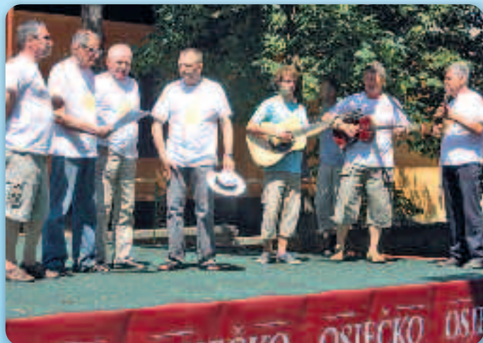
КУД Руснацох Осиек на завераню Колонији