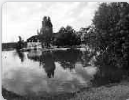
Попатрунок на острово спортох обколєшене з високу воду