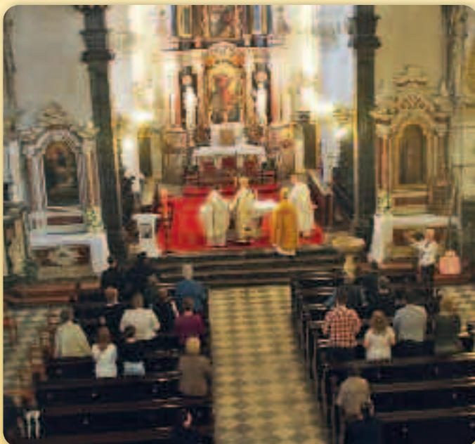
Церква Вознесения Богородици у Риски