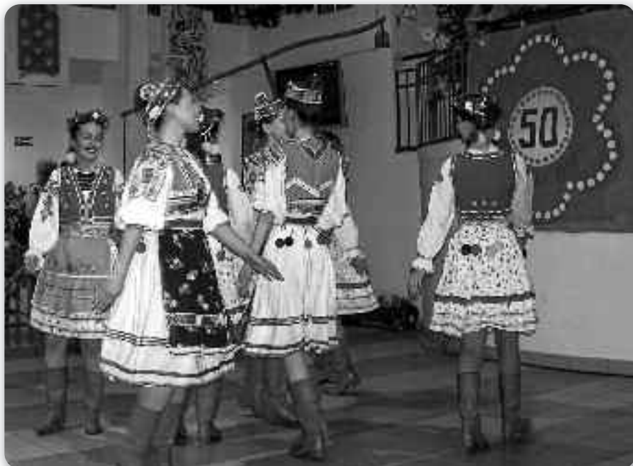
Дзивчатски танец «Увиванец»

У Осиеку уж 50 роки иснуе Центр за вихов и образование «Иван Штарк». У нїм ше за самостойни живот и роботу пририхтую дзеци и одроснути особи з меншима або векшима почежкосцами у розвою. При Центру дїйствуе основна школа до хторей ходза школяре од першей по осму класу з меншим ступньом менталней ретардації и почежкосцами у розвою. Тиж так ту дїйствую и виховнообразовни групи за школярох од 7 по 17 роки и групи роботного оспособованя за дзивки и леґиньох од 17 по 21 рок. Одроснути особи з инвалидитетом маю полдньове перебуванє у двох роботньох. Кед ше пречитаю так начишлени податки, вец ше человек можебуц опита цо то за школа и прецо би дахто о тим писал. Но за тото исную вецей причини. Як перше, то єдна окремна школа до хторей кед войдзецє, окрем прекрашне ушореного голу и учальньох прикрашених з креативними роботами школярох хтори ше там уча, єдноставно напахачє любов. А вец кед ше стретнеце зоз поглядом и ошмихом тих дзецох (або одроснутих хтори вше оставю як дзеци) похопюєце же сце вошли до єдного цалком другого швета, милого, ненасилного, невігубеного... Їх щироєц вас облапи так же бисце пожадали занавше, кед би то було можливе, остаєц у тим и таким швеце.