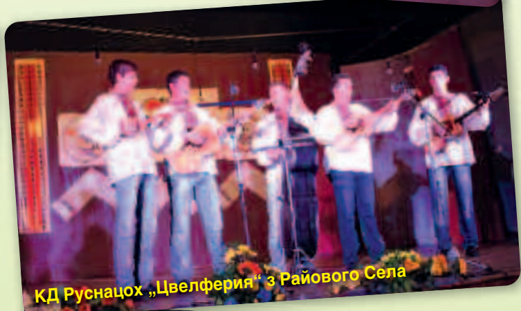
КД Руснацох „Цвелферия“ з Райового Села