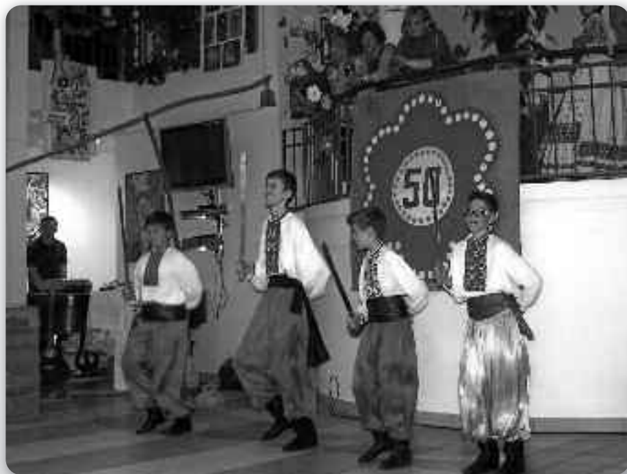
Хлапци у танцу «Герц»