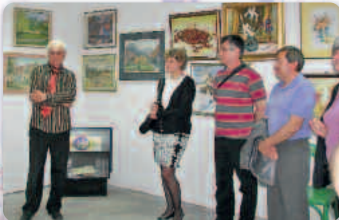
Виставка подобових роботох