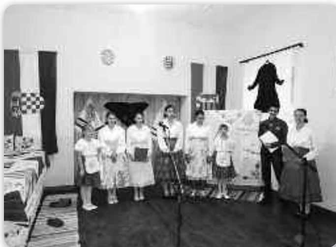
Рецитаторска часц програми