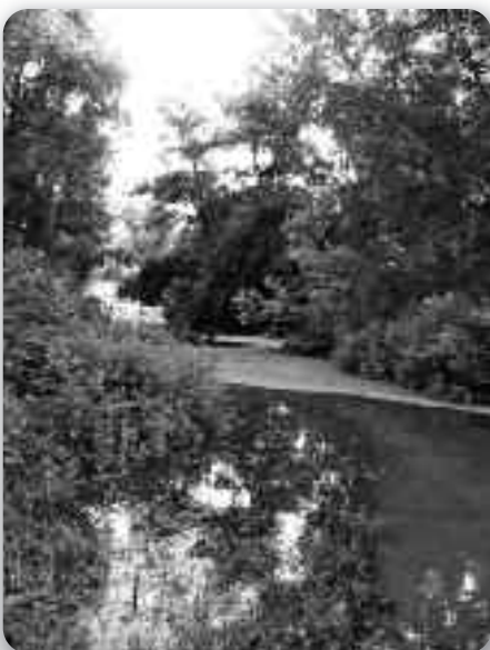
Заляти лєшик Адица

гужва хтора наволана „вилівни туризем”. Людзе з дзеци ходзели коло побережя Вуки и Дунаю, сликовали покля вода пришла, сликовали ше коло мехох зоз писком и коментаровали збуваня. Найстарши Вуковарчанає здогадує ше виліву Дунаю у Вуковаре 1965. року кед Дунай бул високи 769 центиметри и вилял ше по центру варошу. Вода теди була глібока коло 2 метери и дас дзешец дні ше по ней вожело на чамцох як у Венеції. Тото искуствие порушало тедишно власц же би коло Дунаю вибудовала глібоки гаци и пременєла цек реки вуки хтора ше по теди до Дунаю улівала гореводно, коло острова спортох, зоз чим ше вельке количество води зоз нароснутого Дунаю преліва до Вуки як до природного бегелю. У звичайних оклоносцох Вука у центру Вуковару барз плітка, та ані не нагадує на рику. Случує ше же єй корито у самим центру цалком сухе, та неупуцени не повязую тото сухе корито зоз рику. У непоштредней вилівней опасносци, як и того року, Вука рошне аж по своєю мости и випатра як директна опасносц за виліване у найстрогшим центру мєста. Тогорочни 725 центиметри на щесце не загрожели самим улічком варошу, але ше Вука виляла у етно туристичним центру Адица и на щесце не нанєсла вельки чкоди.