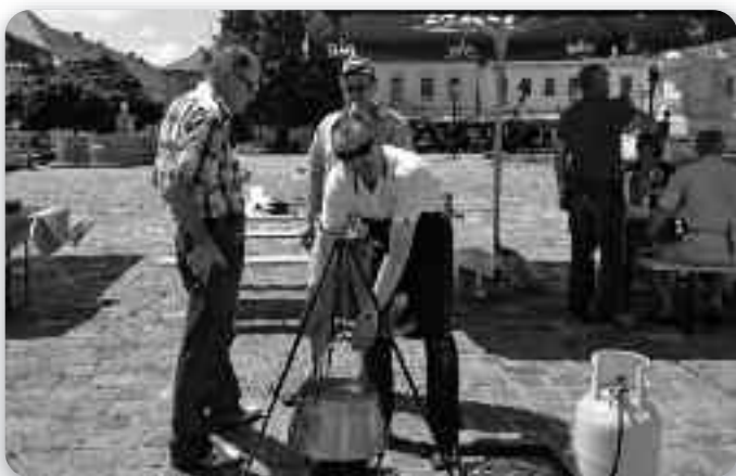
Зоз манифестациї вареня националних єдлох у котліку

В суботу, 15. юния 2013. року, КУД Руснацох Осиек вжало учасц на манифестациї котру организовала агенция Ноктуа у рамикох проекту о сотрудничестве медзи националними меншинами, под назву : Gastronomsko-kulinarska manifestacija Minority 3D- diversity, dialogue,