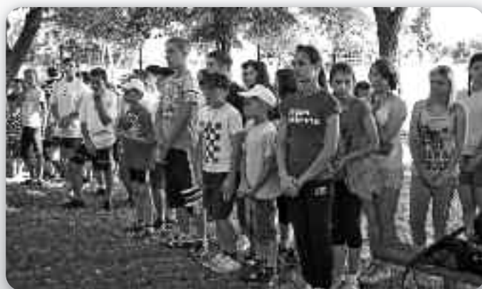
Змагателє на 6. Рутенияди

У вкупним порядку при старших, перше место завжала екипа з Руского Керестура, други були хлапци з Пишкурєвцох, а треци Миклошевчанє. Од штвартого по шесте