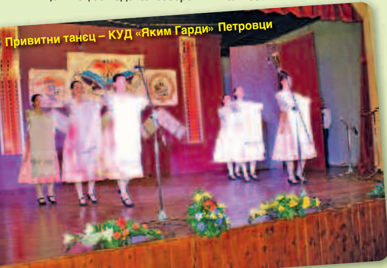
Привитни танец – КУД „Яким Гарди“ Петровци