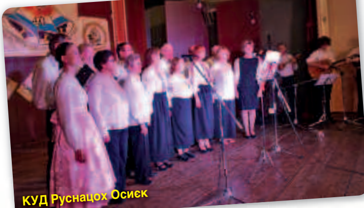
КУД Руснацох Осиек