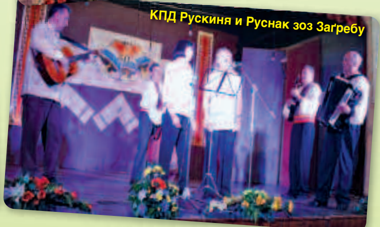
КПД Рускиня и Руснак зоз Загребу