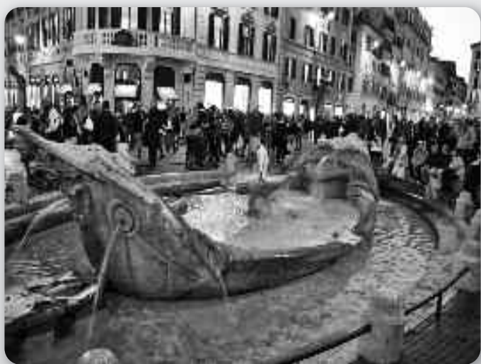
Фонтана Barcaccia у подножю Шпаньолских гарадичох