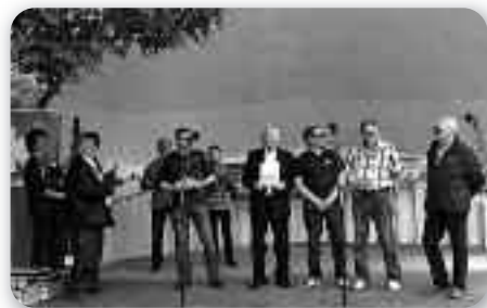
Наступ КУД Руснацох Осиек на Славония етно фесту