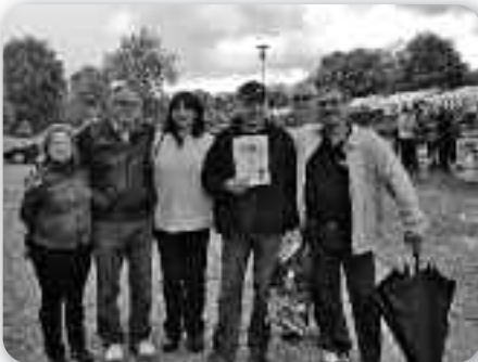
Перше место у вареню славонского чобанцу