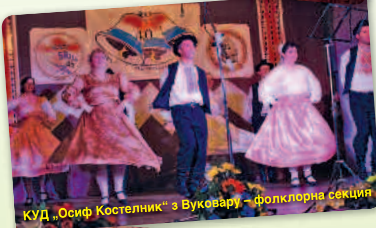
КУД „Осиф Костелник“ з Вуковару – фолклорна секция