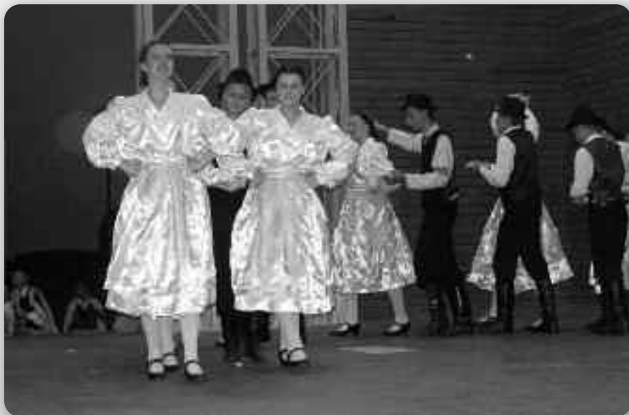
Венчик руских народних танцох пред публику у Дарди