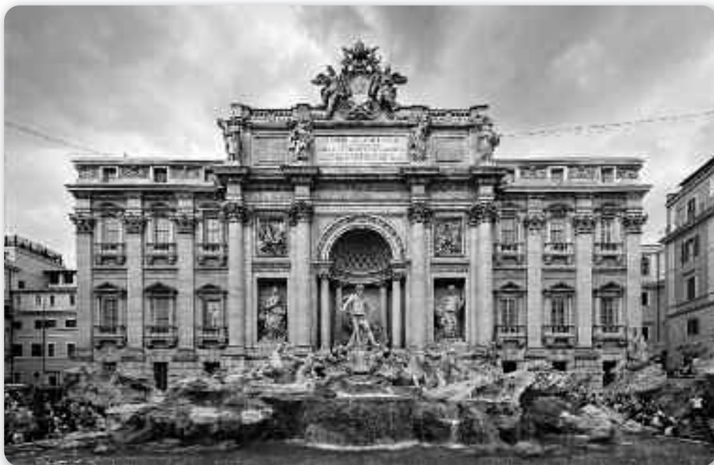
Fontana di Trevi

Сцигуєме зоз запожньєном и вєцей нам не дошлєбодзєне войсц на свойо места. Кажде ше знаходзи як зна. Я ше, зоз своїм фотоапаратом якошик предрилела недалеко драги по хторей преїдзє папамобил, а вєц зявює ше человек у билим, з благим попатрунком и до поли подзвигнуту руку, дзелі благослови як папамобил преходзи. Людзє го