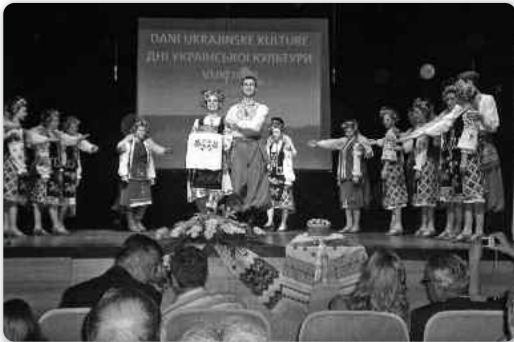
Фінальний концерт у Хорватському домі у Вуковарі

У п'ятницю 31 травня у греко-католицькій церкві Христа-Царя було відслужено Святу літургію, присвячену пам'яті велетнів українського письменства Тарасові Шев-