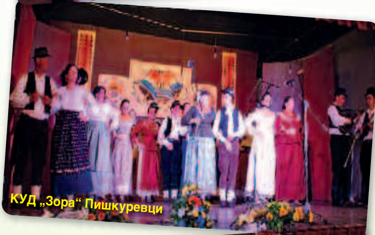
КУД „Зора“ Пишкуревци