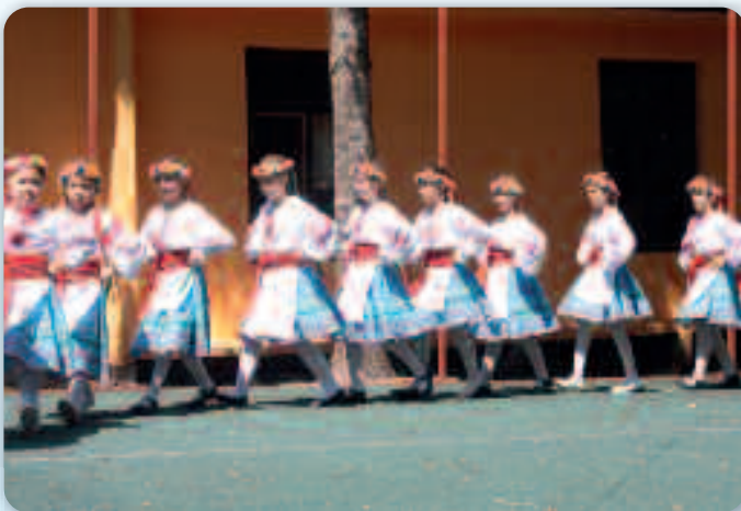
Подросток КУД «Яким Гарди» з Петровцох на завераню Колонији

Цек Колонији ма и културно-забавни характер, та так вше вечар скорей завераня Колонији, организатор пририхта културно-забавну програму и дружене з малярами, а ютрездень у предполадньових годзинох, отримусе ше заверане Подобовой колонији, вистава малюнокх, упознаванє з малярами, розпатранє малюнок