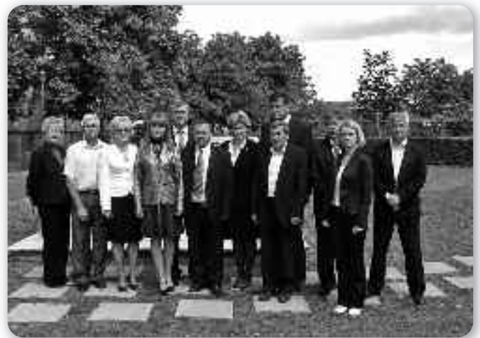
Делегация Союзу Русинох и Украинцох зоз амбасадором Украины у РГ Олександром Левченком и другим меншинским и политичним целами у Илоку