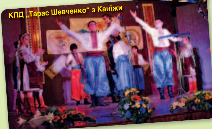
КПД „Тарас Шевченко“ з Каніжи