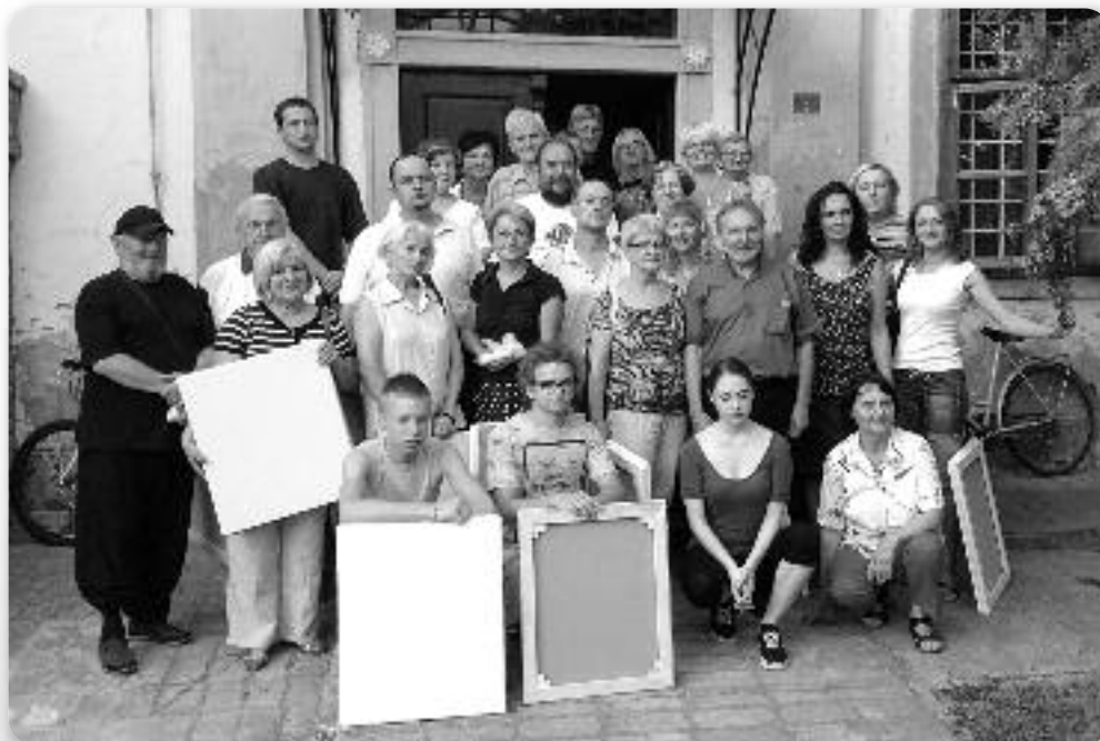
Заєдніцки знімок учашнікох 6. Уметніцкей колоніі «Руски двор» у Шидзе

Н а 6. уметніцкей колоніі «Руски двор» у Шидзе, котра отримана од 6. по 8. август 2015. року, по першираз поволани були и маляре з Горватскей.