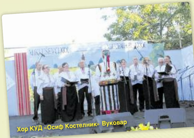
Хор КУД «Осиф Костелник» Вуковар