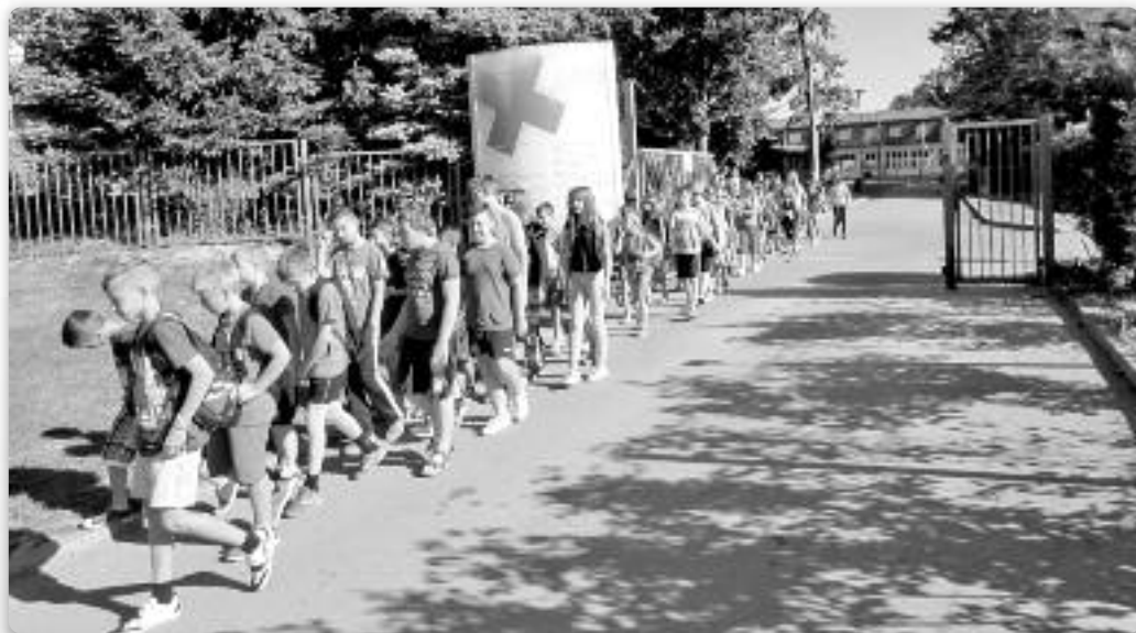
Школяре основней школи у одходу на вилет на Ораховицким озеру

Младежка Летна школа отримана од 12. по 19. јулиј у истим просторе. Зоз седму и осму класу основней школи и школярами штреднїх школах зоз РГ за организаторох того року було вельке нес-подзиване пре вельку заци-