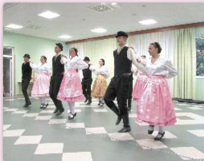
Руски народни танци