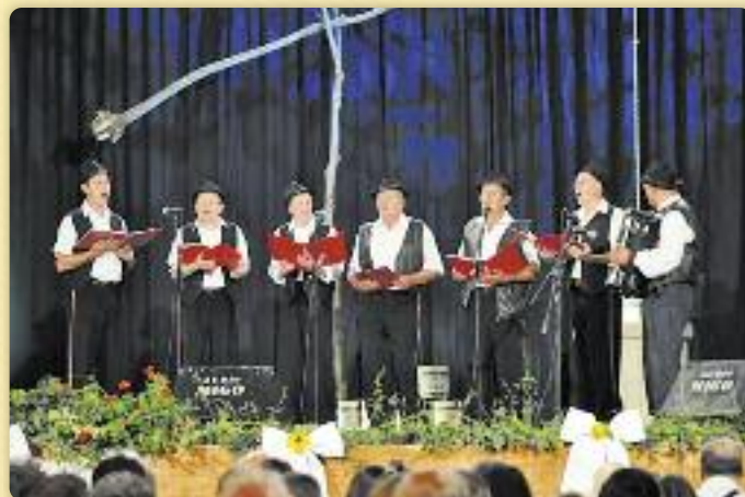
КУД «Яким Гарди» Петровци