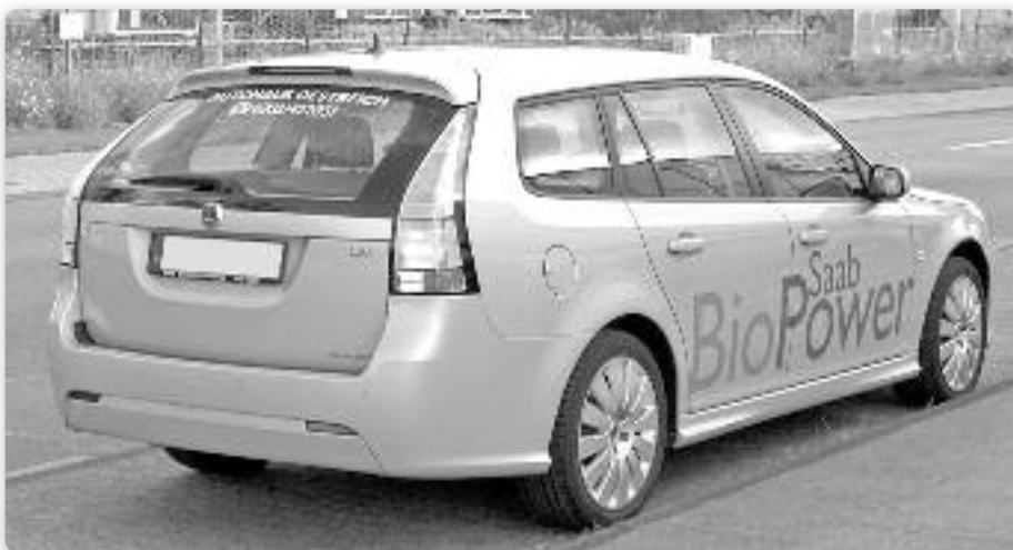
Slika 2. Saab 9-3 SportCombi BioPower prilagođen je i fleksibilan za različita goriva ili FFV (engl. flexible fuel vehicles) te može koristiti goriva koja sadrže i do 85 % bioetanola (E85).