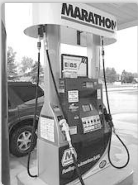
Slika 1. Pumpa za prodaju umješanog bioetanola s mješavinama standardnog E10, E15, E30 i E85 u East Lansingu, Michigan.

Etanol se prirodno proizvodi fermentacijom šećera uz pomoć enzima kvašćevih gljivica pri čemu se ugljikohidrati pretvaraju u etanol. Vrenjem se groždani mošt pretvara u vino, a fermentacijom ječma nastaje pivo. Destilacijom kukuruza ili riže dobiva se viski, a votka destilacijom svih vrsta žitarica. Razliku između alkoholnih pića i bioetanola čini sadržaj alkohola jer dok vino ima najviše 16 % alkohola ili votka 38 - 40 %, bioetanol je 99 % čistoće i može se koristiti i za proizvodnju alkoholnih pića. Njegova upotreba prvenstveno je za umješavanje u benzin u raznim omjerima, najčešće 10 ili 20 %. Zbog mogućnosti zloupotrebe bioetanola namijenjenom umješavanju u gorivo dodaju se razne tvari koje ga čine neupotrebljivim za proizvodnju alkohola