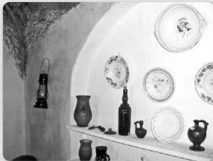
Танєри на муре у кухні

Таня: На розуме ми думка же як крашне же нешка маме таку богату часц прешлосци – хижу котра шведочи живот наших предкох. Прето вредзи присц и опатриц, чловек вше може и треба дацо нове видзиц, упознац и научиц.