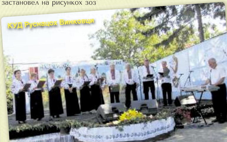
КУД Руснацох Винковци