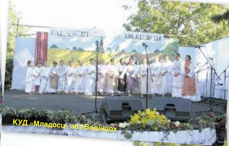
КУД «Младосц» зоз Водінцох