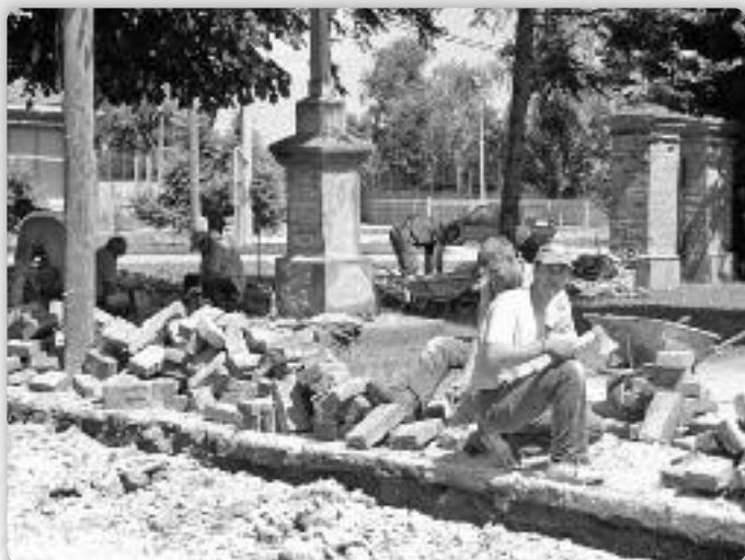
Валяне мурика коло церкви

Ми, нешкайши жителе Миклошевцох, дзечне ше оглядаме до прешлосци, горди зме, цешиме ше же зме ведно зоз нашима предками успишно хранели наш национални идентитет. Цешиме ше же ше о Миклошевцох бешедовало, же ше о їх жительох чуло, писало. Роботни успихи наших людзох служели за приклад