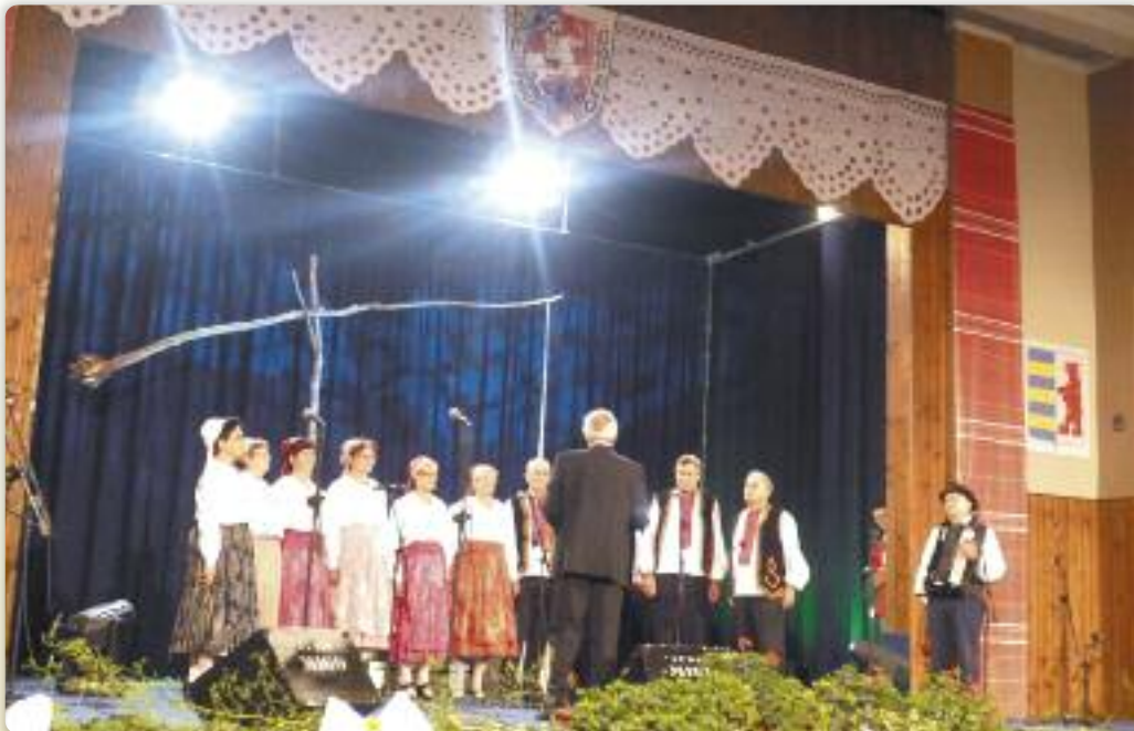
КУД Русинох Винковци

Внедзелю, 23. августа того року, у войводянским месце Дюрдьов отримани XIII фестивал жридлового шпиваня “Най ше не забудзе”, на хторим участвовали руски культурно-уметніцки дружтва зоз Републики Сербії, але и три Дружтва члени Союзу Русинох РГ.