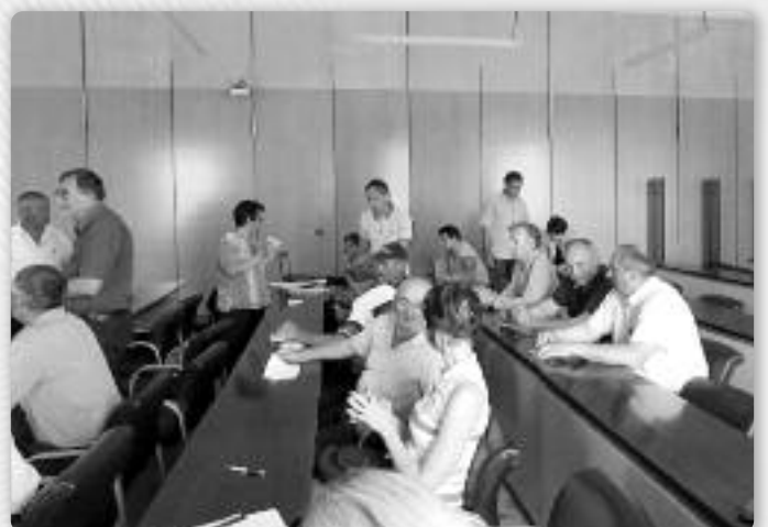
Члени Радох рускей националней меншини на схадзки