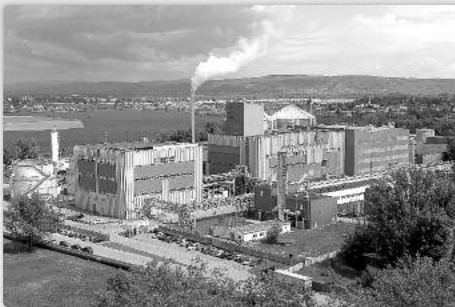
Slika 4. Postrojenja za proizvodnju biogoriva u Leopoldovu, Slovačka. U prvom je planu tvornica Enviral gdje se proizvodi preko 145 000 m 3 bioetanola godišnje.

Sirovine bogate šećerima vrlo su pogodne za proizvodnju etanola, budući da već sadrže jednostavne šećere glukozu i fruk-