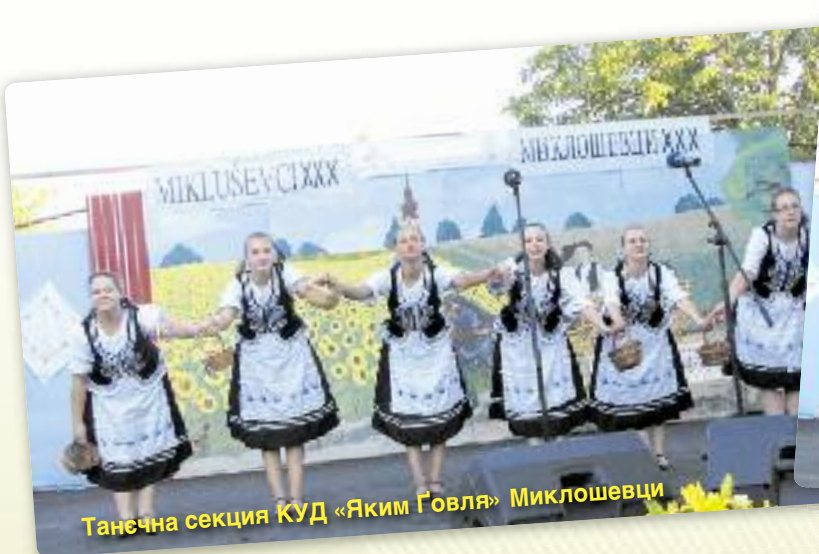
Танечна секција КУД «Яким Говля» Миклошевци