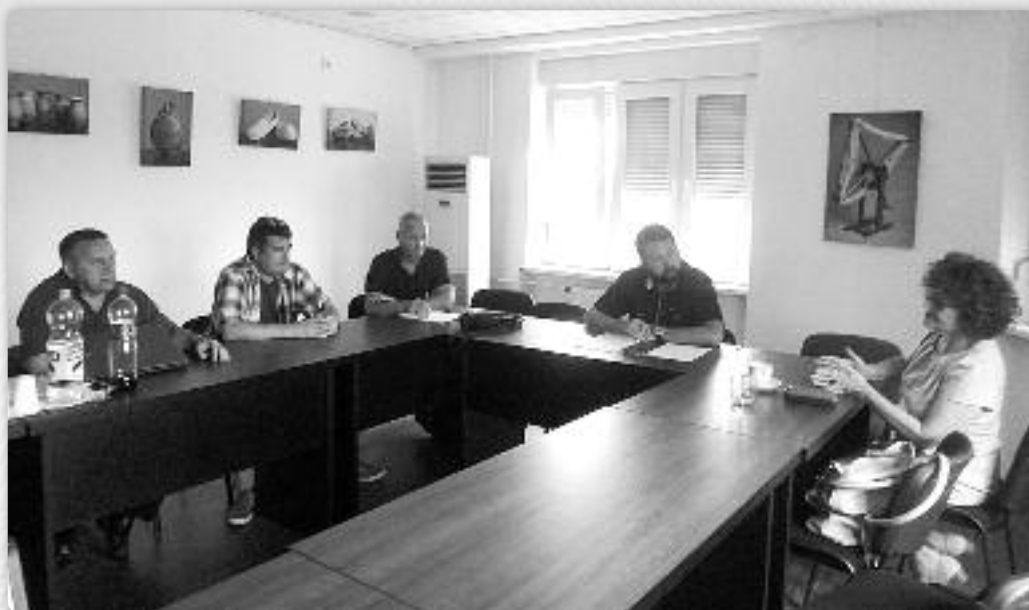
Схадзка у Заводу за културу Войводянских Руснацох