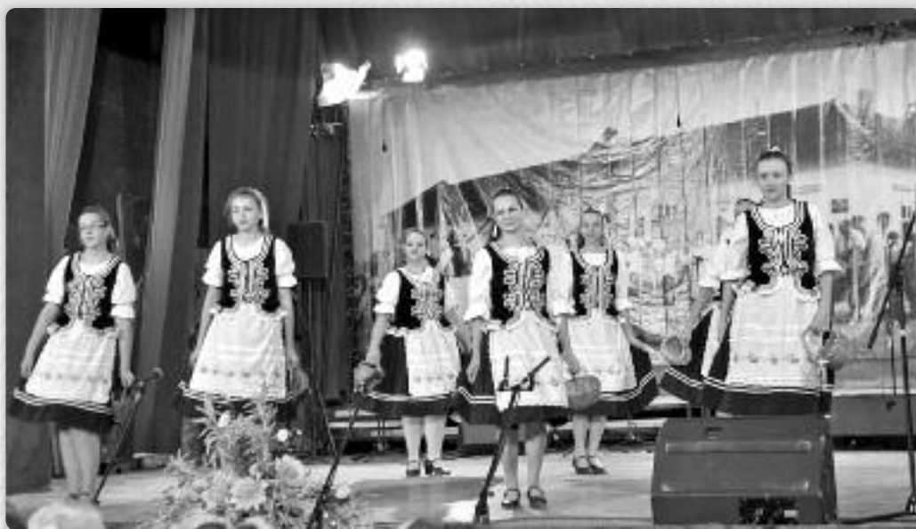
КУД „Яким Говля” з Миклошевцох, „Тарки”