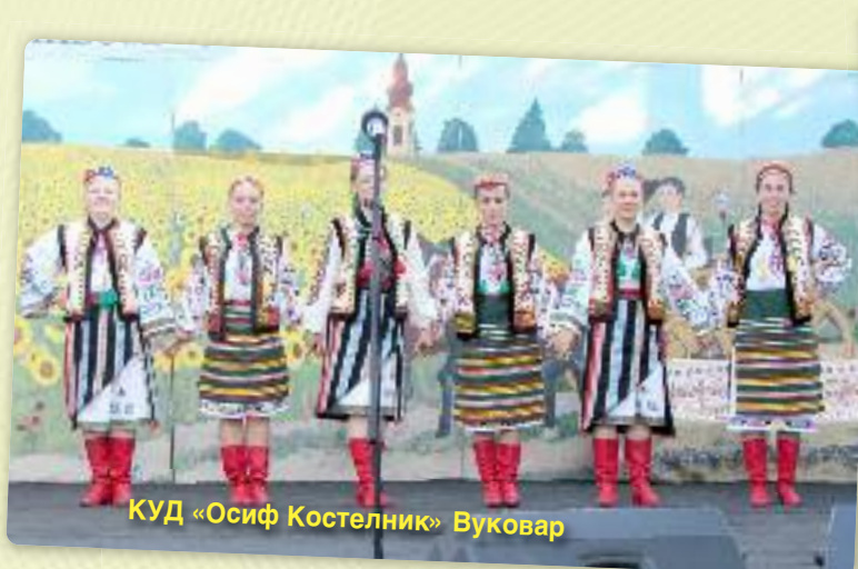
КУД «Осиф Костелник» Вуковар