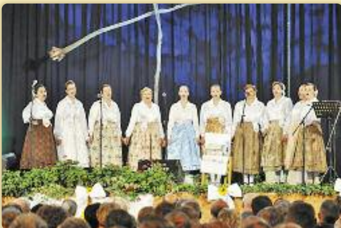
КУД «Яким Говля» Миклошевци