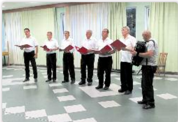
Хлопска шпивацка група