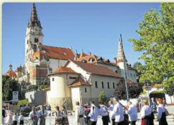
У святочним дефилеу гу бини

Дефиле од школи по Базиліку Мацери Божей Бистрицкей почал на пол шестей вечар, а потим шицки учашнікі культурней програми були присутни на Служби Божей,