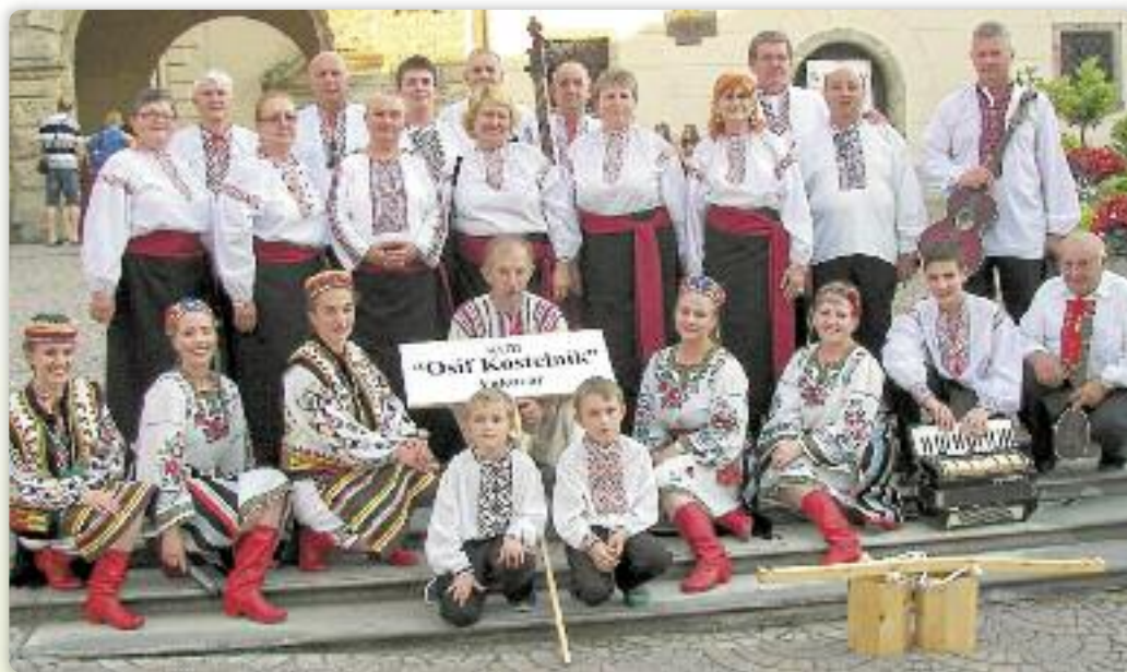
Заєдніцка фотография на памятку

Єдно зох местох дзе вуковарске КУД "Осиф Костелник" любі наступац то вшеліак Марія Бистрица. Гоч драга далека и напарта, знова лем ше и страши члени дзечне одволюю на тоту поволанку. Приятельство КУД "Осиф Костелник" и КУД "Ловро Єжек" тирва уж роками, точнейше од вибеженских дньох, кед у тим городу до часови дом мали дзепоедни Вуковарчане, та и члени нашого Дружтва. Всоботу, 11. юлія того року, зох Вуковару до Маріі Бистрици рушели на дзевец рано, же би путовали помали и необтерховано. Зашли и до