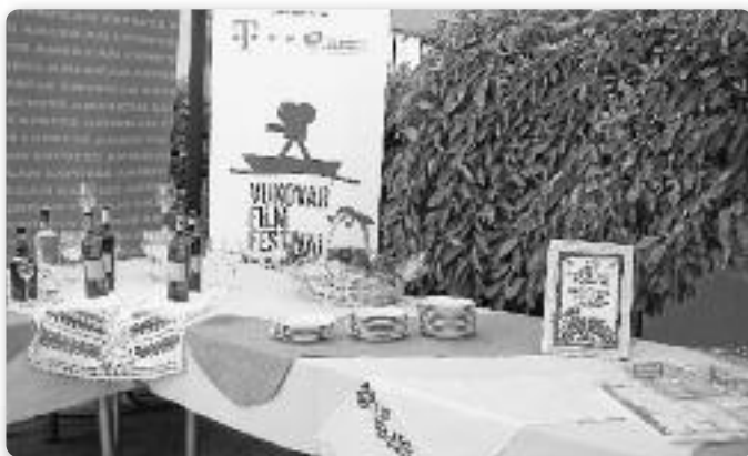
Руска декорация на