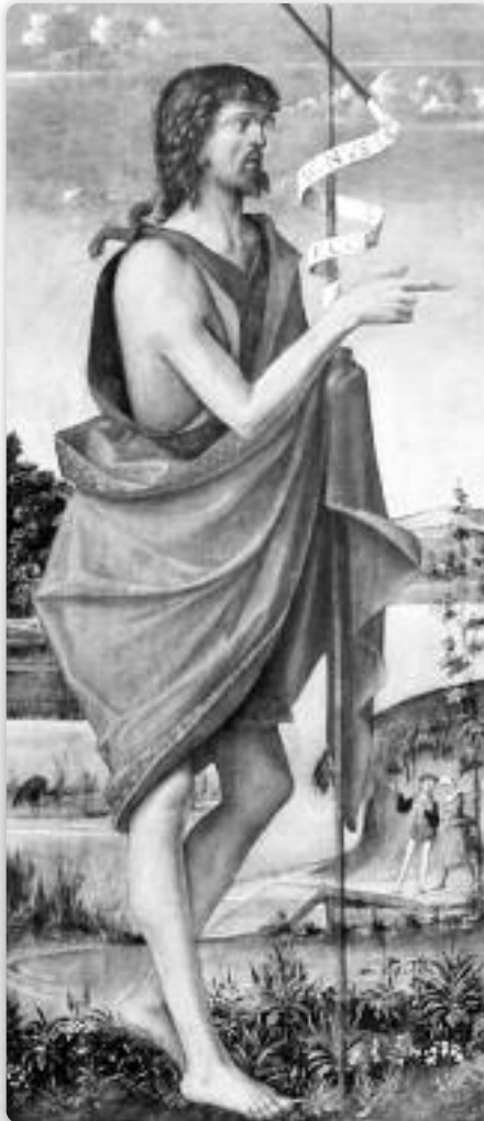
Святы Йоан Креститель

Патраци глібше до структури текста евангелиї, бо слово евангелиї, то слово Боже, воно вше у себе ноши поручене котре надиходзи пречитану причту, видзие же ше обезглавене котре нашло св. Йоана очитусе перше у обезглавеносци цара Ирода. Цар Ирод, перше и перше не бул цар у самостойним значеню, але слуга Риму котри управлял зоз єдну обласцу Римского царства. Так же фактично не бул глава держави, але поведзме же бул глава народу, а тоту народну главу було легко по потреби меняц и зоз боку римского цара и зоз боку израильского народу. Не бул вон человек святы и пошвечени, але заш ше, гвари евангелия, намагал слухац, и розважовац тото о чим бешедовал його духовни авторитет — Йоан. То значело же ше намагал не дац спреднуц од тих котри го окружовали. Єдна з ніх була и Иродияда, жена Иродового брата Филипа зоз котру вон жил, а котра мала свой власни интерес, директно и преиґ своей дзивки длуґши час балансировац на политичней сцени. Понеже „і овсе, і повсе“ можеце достац лем на реклами, очивисно же Йоанова праведносци и