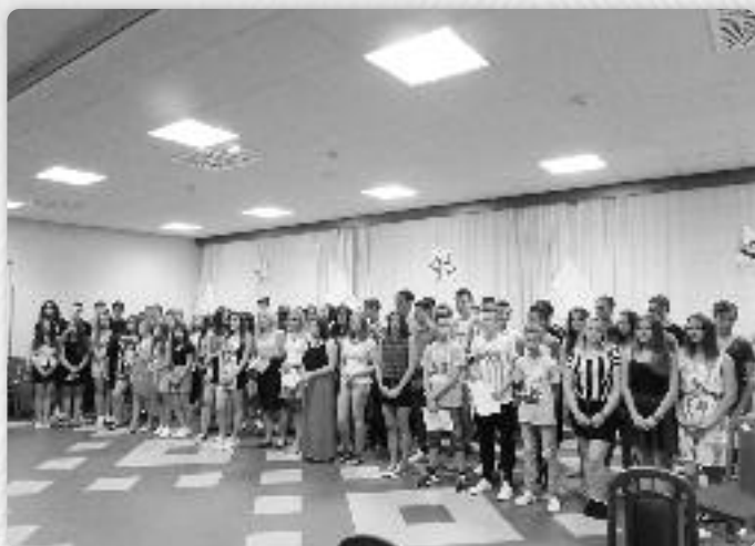
Закончујуца програма на младежскеј Летней школи у Ораховици