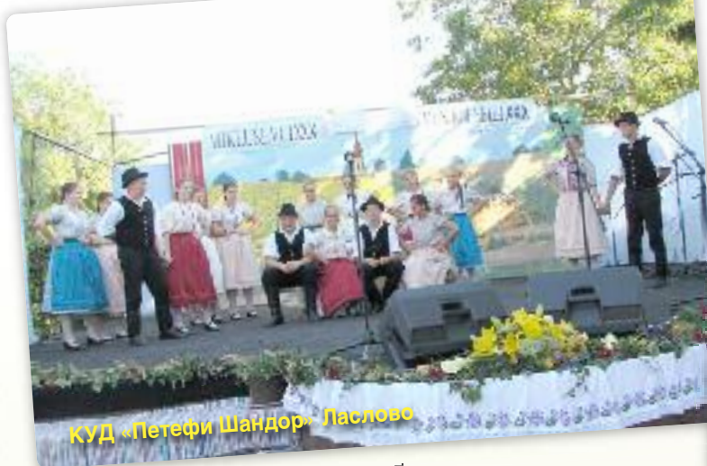
КУД «Петефи Шандор» Ласлово