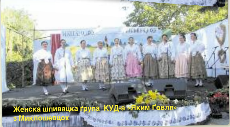
Женска шпивацка група КУД-а «Яким Говля» з Миклошевцох

«Лем писня далей будзе жиц док будзе швета и ест сна».