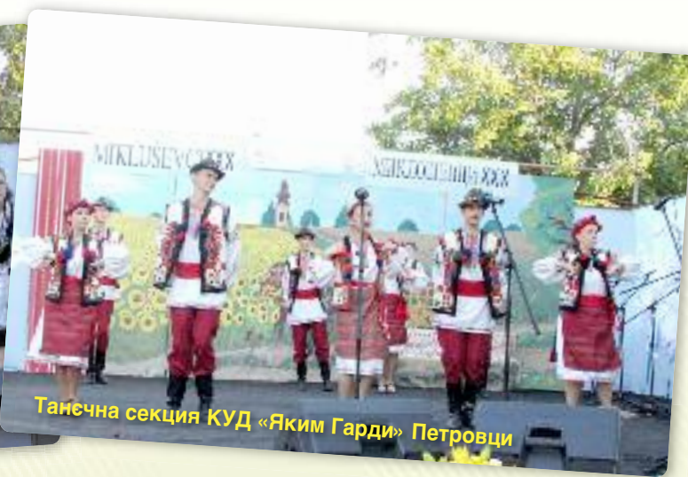
Танечна секција КУД «Яким Гарди» Петровци