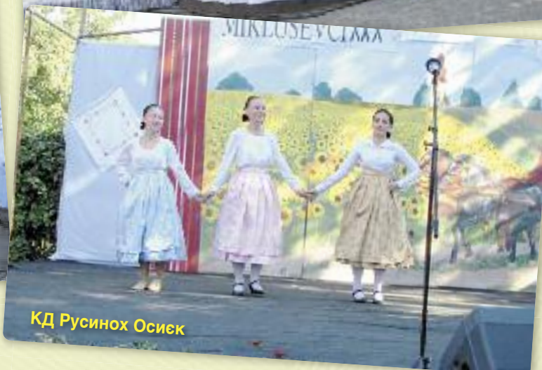
КД Русинох Осиек