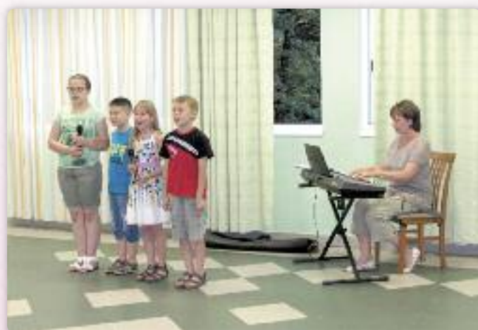
Дзєцинска шпивацка секция