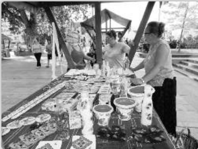
Богати вибор ручних роботох на Вуковарским корзу

а дзе индзей кед не на Фейсбуку и поволали людзох же би ше пришли прешейтац, ніч окремно од того не обчековац, єдноставно буц ту, ту на вуковарским корзу. У поволанки за суботу 18. априла 2015. року межди иншим читамає: “... видзце ше пре-