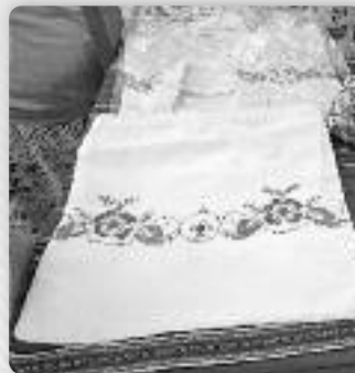
Руски свадзєбни ручнік

лосци, Город Вуковар и Туристична заєдница городу Вуковару препознали як барз добру. Дали єй потримовку и вона преросла до збуваня у городу хторе ма винімово традиційну, дружтвену и репрезентативну вредносц за город.