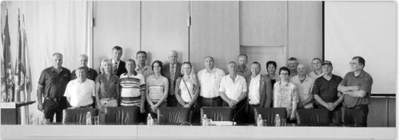
Члени Руских радох у Вуковарско-сримскей жупаниї

Ш тврти порядово виберанки за членох радох националних меншинох и за представителюх националних меншинох отримани 31. мая 2015. року на основу Одлученя Влади Републики Горватскей.