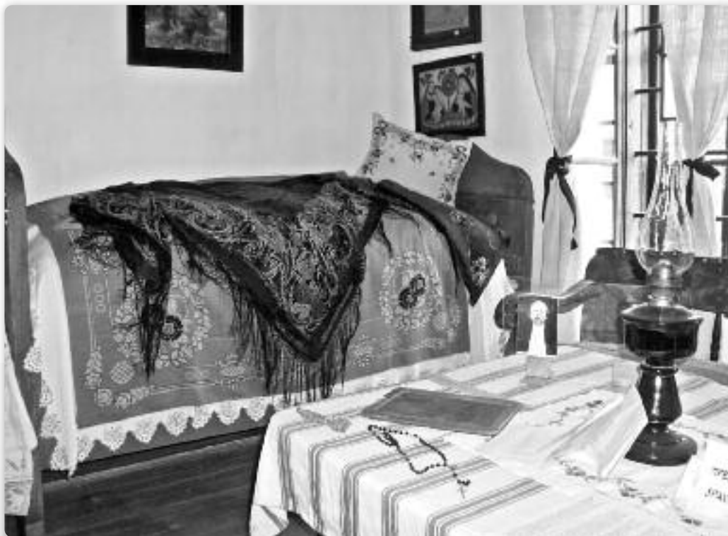
Посцель у предней хижи

хижу и моцни запах упечених погачикох, та ме порасне кухні здогадло на дзедзински дні.