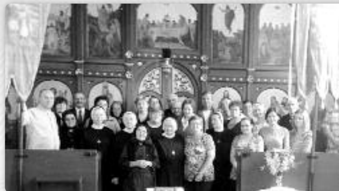
Чесни шестри Василянки з вирнима з Пишкуревиц