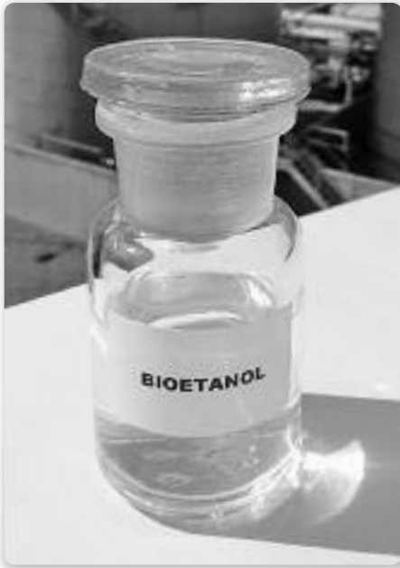
Слика 5. Квалитета биоетанола строго се провјерава у лабораторијима.

тозу који могу ферментирати изравно у етанол. Сировине богате škробом садрже велике молекуле угљиководика које треба разложити на једноставне шећере процесом сахарификације. То захтијева још једну фазу у процесу производње што повећава трошкове. Угљиководичи у сировинама богатим целулозом састављени су од још већих молекула и требају се претворити у шећере који могу ферментирати киселом или ензиматском хидролизом.