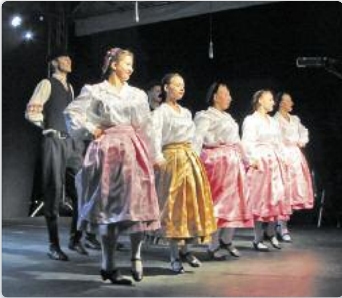
Народни руски танци у виводзиню КУД «Яким Гарди» зоз Петровцох