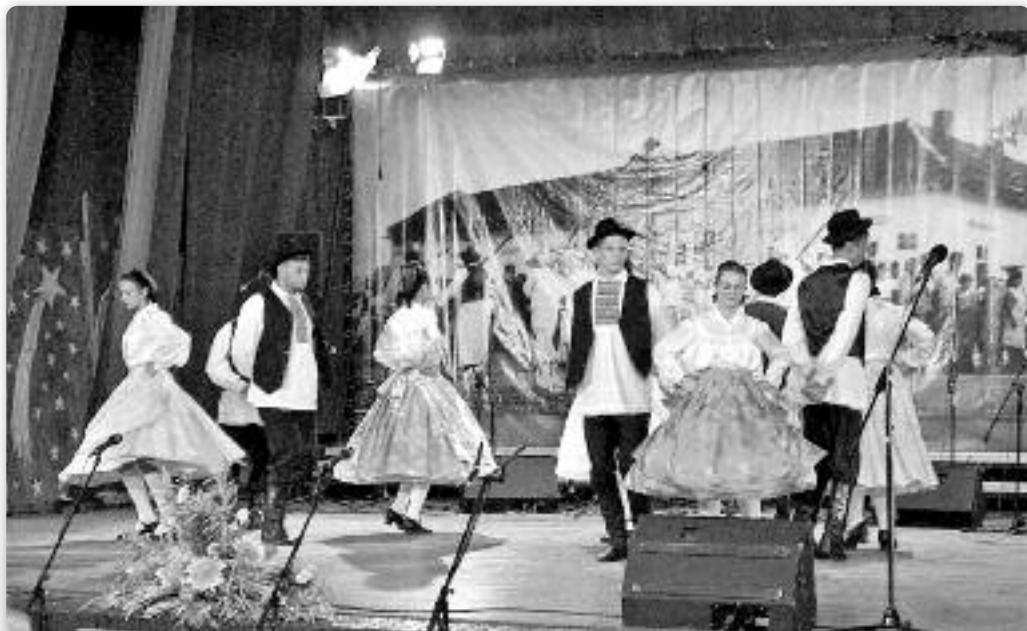
КУД „Яким Говля” з Миклошевцох, „Горніцки танец”

Всуботу, 11. юлия, у поподневних годзинох отримани дефиле и наступ наймладших, а у предвечарших годзинох пририхтани Етно столи з лакотками у школ-