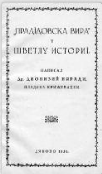
Насловни бок кніжки