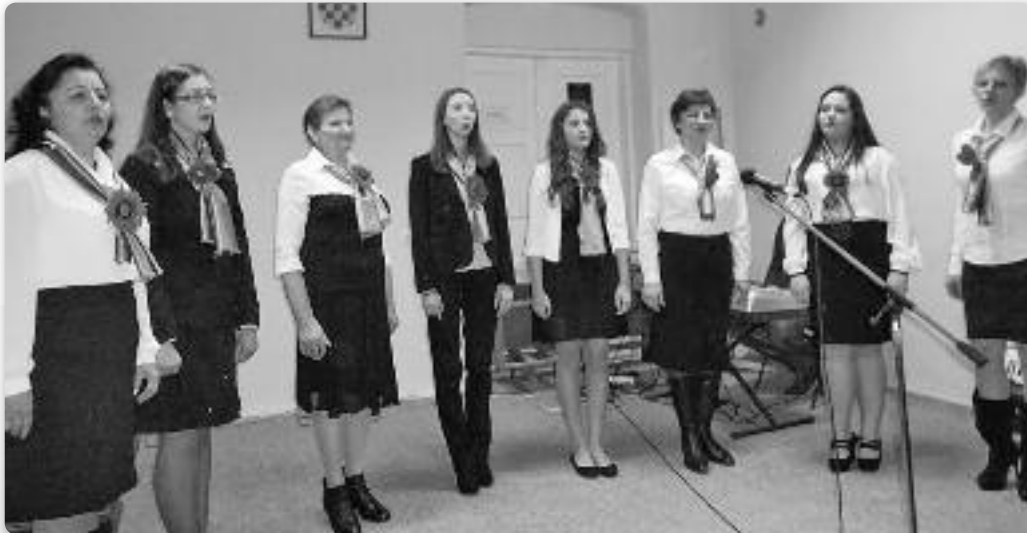
Члени Женской шпивацкей групи КУД «Яким Говля»