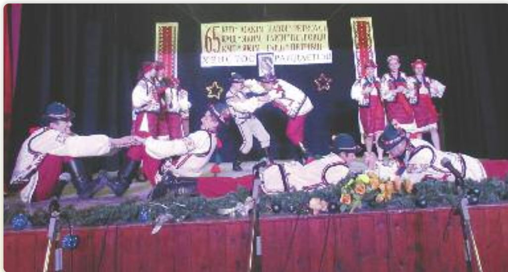
Атрактивна танечна фігура у виводзеню КУД «Яким Гарди» Петровци