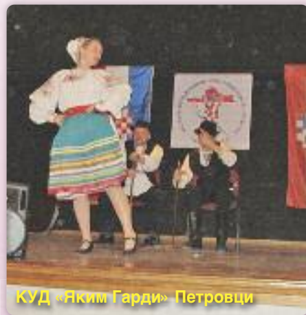
КУД «Яким Гарди» Петровци