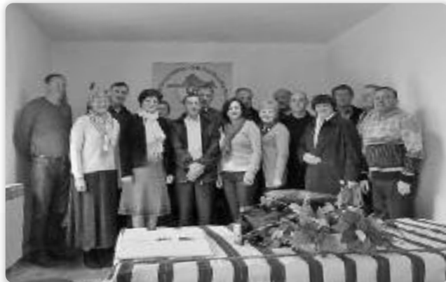
Члєни Скупштини Союзу Русинох РГ

Порядна рочна Скупштина Союзу того року отримана 27. фебруара зоз початком на 9,00 годзин у просторійох Союзу Русинох РГ у Вуковаре.