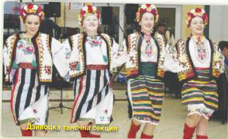
Дзивоцка танецьна секция