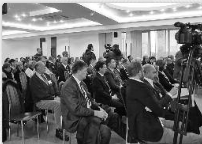
Присутни у Музею у Вуковаре