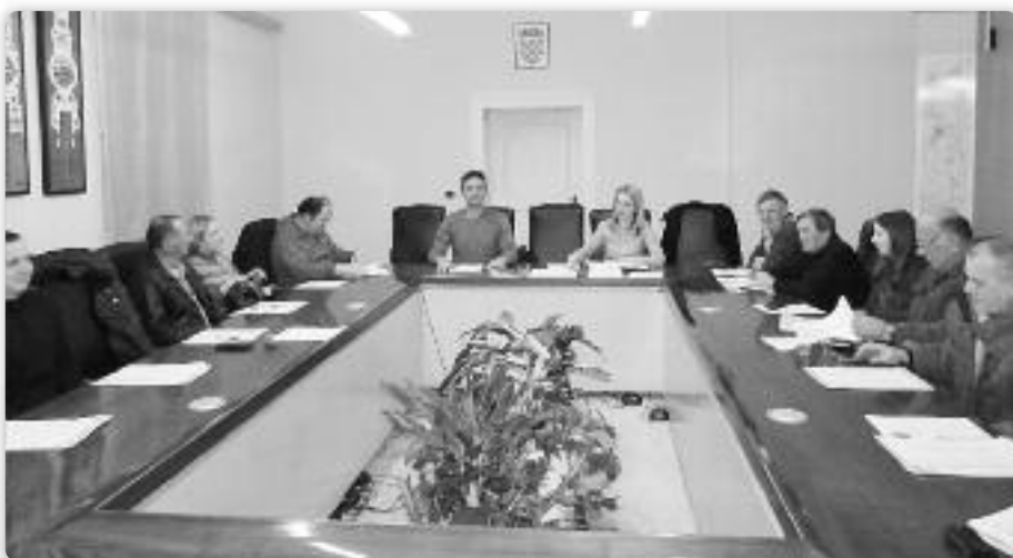
Члени Ради рускей националней меншини Вуковарско-сримскей жупанії

Раду националних меншинох може ше дефиновац як специфичну непрофитну правну особу хтору поєдина национална меншина снус пре витворйованс правох своїх припаднікох на участвованс у явним живоце, заступанс своїх интересох на уровню єдинки локалней (општини и городи) и подручней (жупанії) самоуправи, а у складзе з одрдбами Уставного закону о правох националних меншинох.