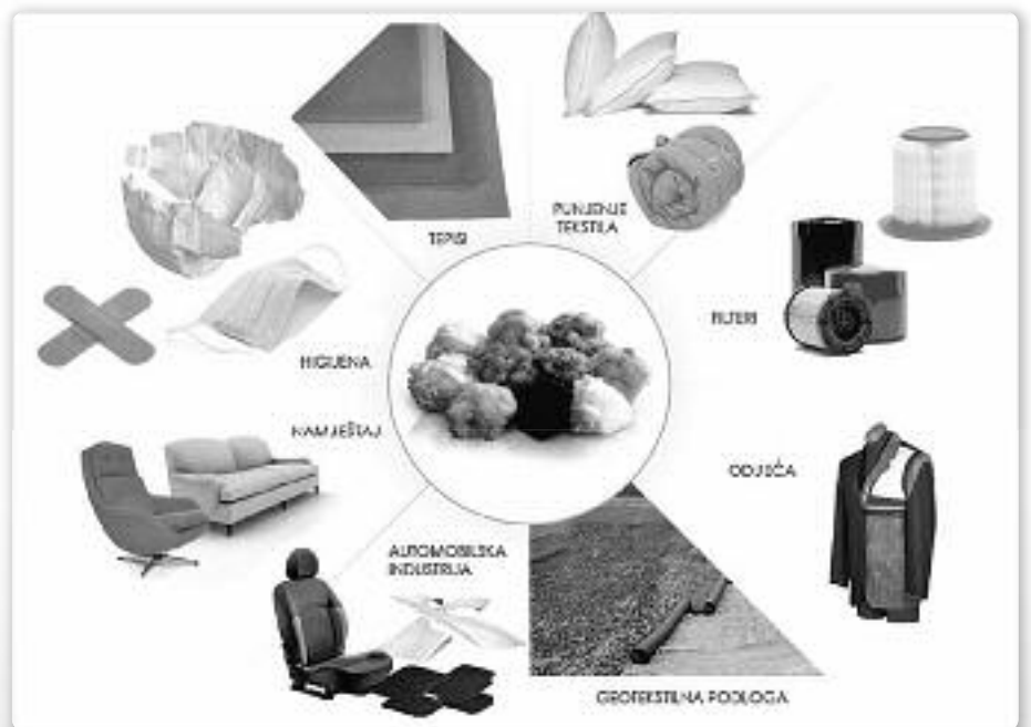
Proizvodi nastali recikliranjem plastičnih boca.

Većina je upoznata s kućnim otpadom, a ilustracija prozirne kante na slici 5 izvrsno prikazuje prosječan sastav tipičnog kućnog otpada. Najinteresantnije je to što samo 13 % te količine zapravo otpada na smeće, dok se ostatak može reciklirati. Najveći dio otpada (39 %) biorazgradive je prirode, kao što su otpaci od voća i povrća i hrane koji se mogu lako kompostirati. Ostatak otpada na papir koji također možemo preraditi recikliranjem i proizvesti niz korisnih proizvoda. Plastika (12 %) iduća je po količini i u RH možemo biti ponosni da se otkup plastike i limenki sustavno provodi te da većina PET boca završi mljevena i upotrebljena za nove proizvode (slika 4). Nadalje, staklena ambalaža poput boca, staklenki, žarulja, vaza i staklenog posuđa čine više od 6 % kućnog otpada u kanti. Staklo zbog svoje strukture i svojstava predstavlja idealni materijal za recikliranje jer se može gotovo beskonačno reci-