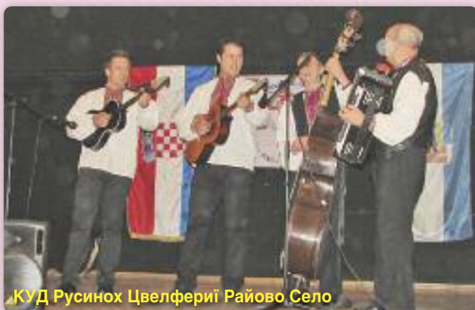
КУД Русинох Цвелферіі Райово Село