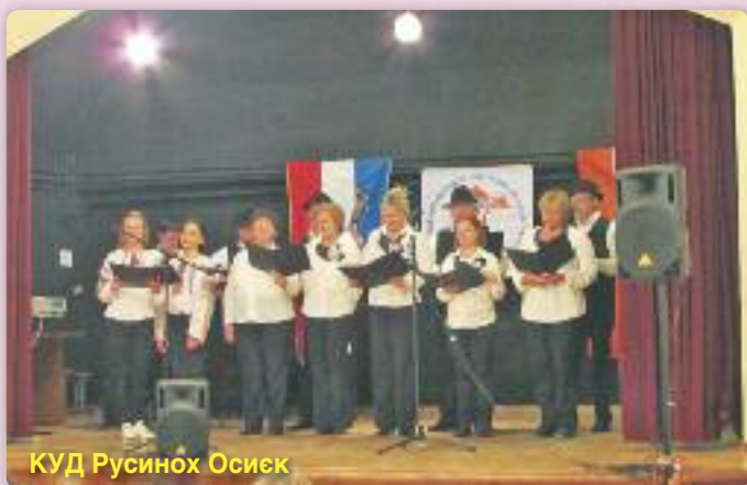
КУД Русинох Осиек