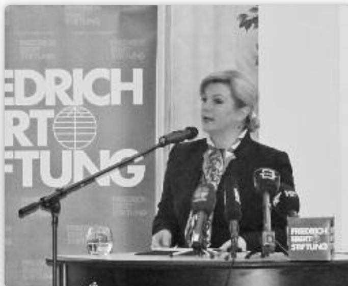
Председателка РГ Колинда Грабар Китарович

Китарович. Рада безпечности Зєдинєних народох 15. јануара 1996. року принєсла резолуцију 1037 о операциј УНТАЕС-у у восточнеј Славониј з роком тирваня од єдног рока. Процєс мирнеј реинтеграциј закончєл 15. јануара 1998. року кєд ше горватске Подунавє (восточна Славонија, Бараня и западни Срим) конєчно врацєло до рамикох Републике Горватскеј и такој оможлєвени початок обнови и врацаня вигнатих. После уводних и привитних словох гу шицким присутним обрацєла ше председателка Републике Горватскеј пані Колинда Грабар Китарович и наглашєла же мирна реин-