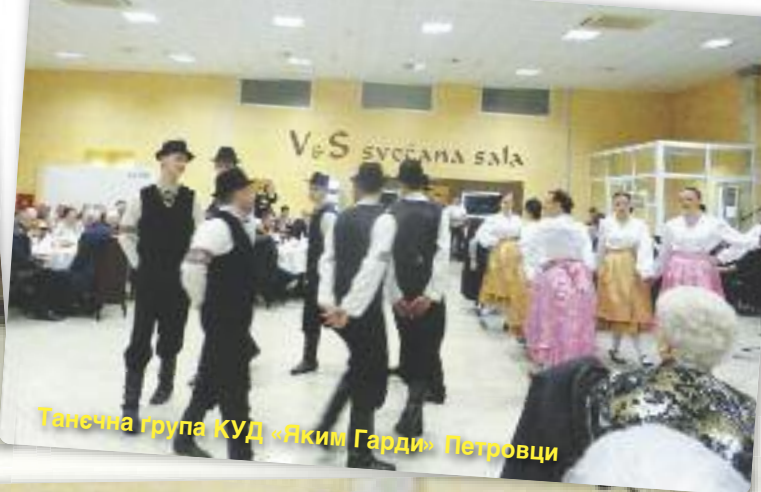
Танецьна група КУД «Яким Гарди» Петровци