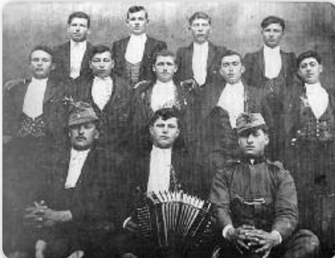
Хлопске облєчиво Руснацох