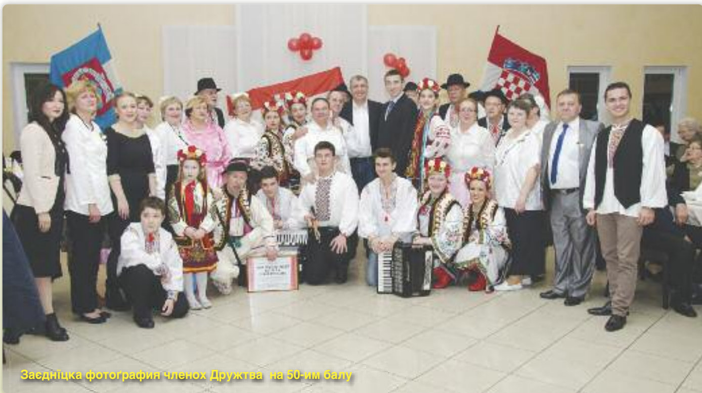
Заєднічка фотографія членох Дружтва на 50-им балу

У організації КУД “Осиф Костелник” зоз Вуковару отримани 50. юбилейни бал, хтори ше традиційно отримуве останей суботи у януару мешацу. Так було и того року, та бал отримани 30. януара 2016. року з початком на 19 годзин.