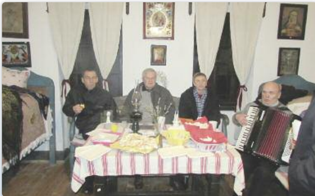
Веселе дружтво у предней хижі Етнографскей збирки у Петровцох

У організації Союзу Русинох РГ, КУД-а „Яким Гарди“ Петровци і Ради рускей націоналней меншини Општини Богдановци у Етнографскей збирки у Петровцох отримана манифестация „Ноц музейох“ з нагоди 180. рочніці приселєня Руснацох до Петровцох і Горватскей, 180 роки петровскей парохії і 45 роки Новей думки, котра отримана 29. януара того року. Предсидателька Союзу Русинох РГ привитала шицких нашивительох і учашнікох манифестациі і нагласела же треба чувац шицко тото цо зме створели же бизме