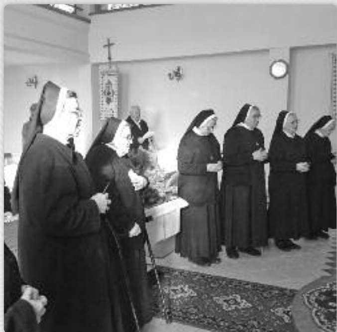
Шестри Василянки у Осиеку обнавяю свойо завити