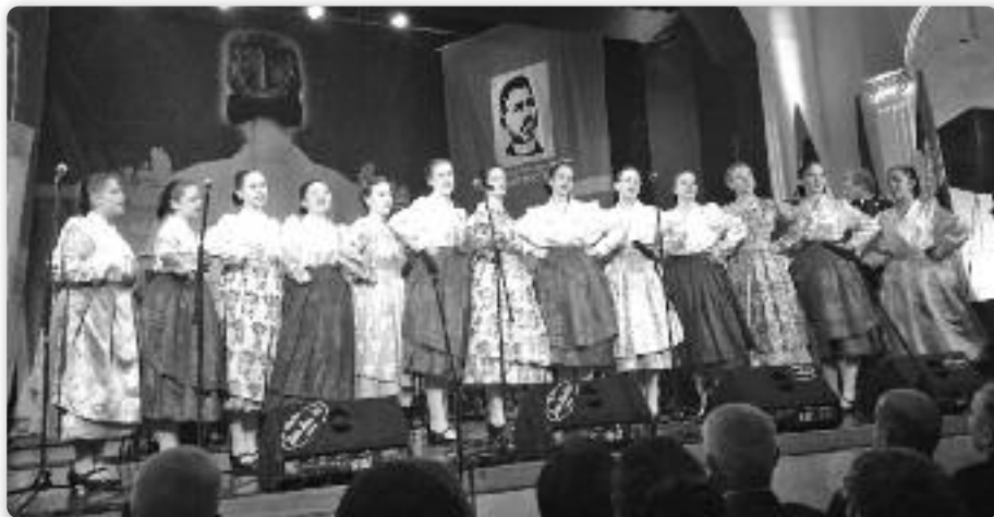
13-членова Дзивоцка шпивачка група Дома култури Руски Керестур