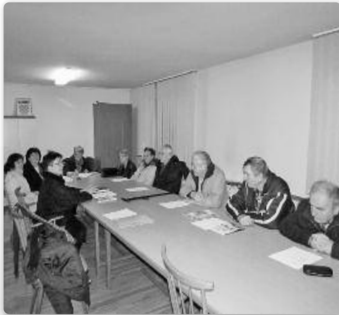
Члени КД Русинох Винковци