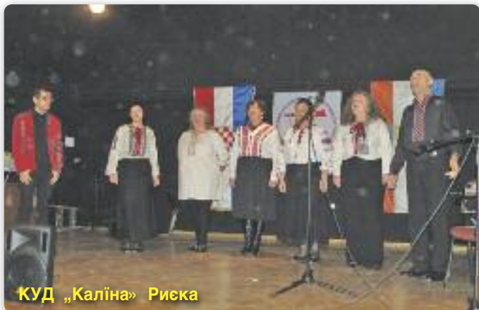
КУД „Каліна» Риска