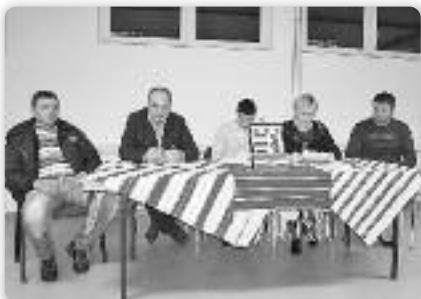
Роботне председательство КД Русинох Цвелферіі

У просторе обновеней школы у Райовим Селу, 20. фебруара того року КУД Руснацох Цвелферіі отримало порядну звітну Скупштину Дружтва зоз дньовим шором хтори ше одшоел на звит о роботі у прешлим року, план роботи у тим року и рижне.