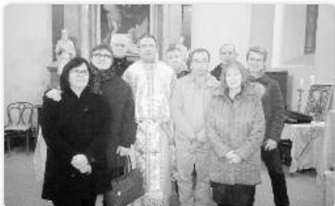
Вирнико на Служби Божей зоз паноцом и панїматку

Так уж еденасти рок у церкви св. Флоріяна и Себастьяна на Перши дзень Крачуна, 25. децембра, служена наша крачунска Служба Божя. По Служби Божей на