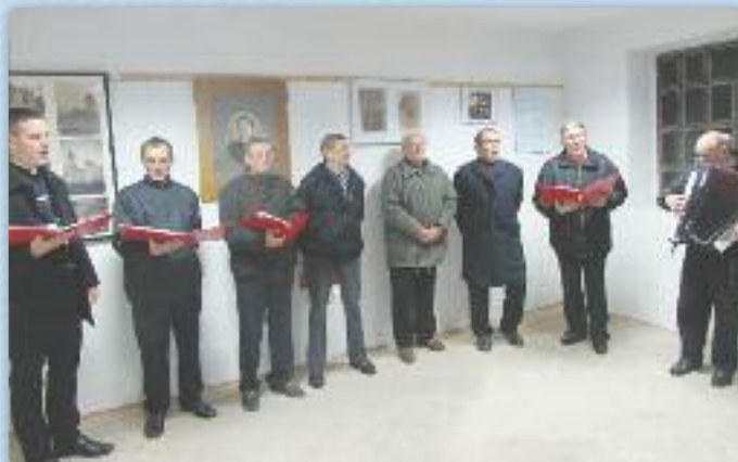
Хлопска шпивацка група КУД „Яким Гарди“ Петровци