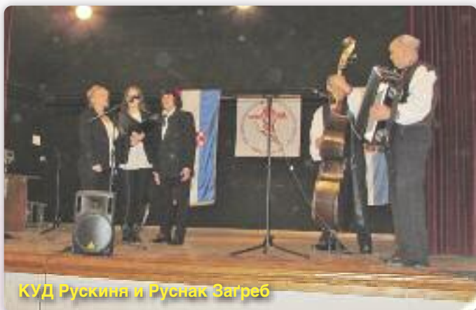
КУД Рускиня и Руснак Загреб