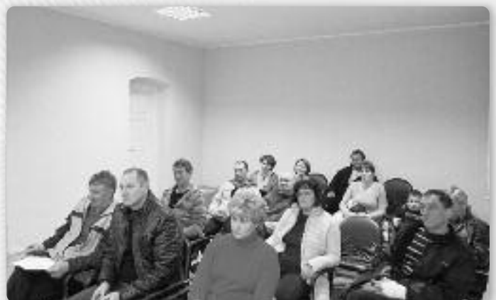
У публики була и председателька Союзу