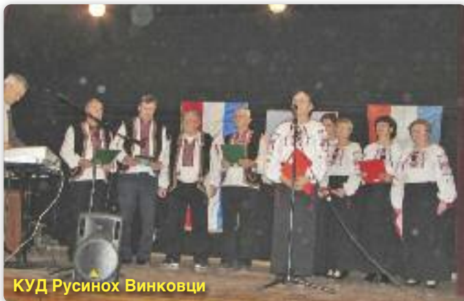
КУД Русинох Винковци