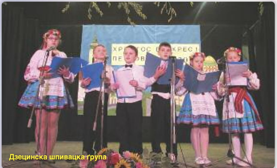
Дзєцинска шпивацка група