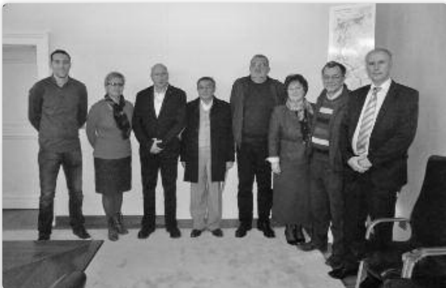
Члени Координації националних меншинох Вуковарско-сримскей жупаниі

У Координації радох и представителюох националних меншинох Вуковарско-сримскей жупаниі маме пейц ради националних меншинох (Мадыаре, Словаци, Руснаци, Бошняци и Серби) и штирох представительоох националних