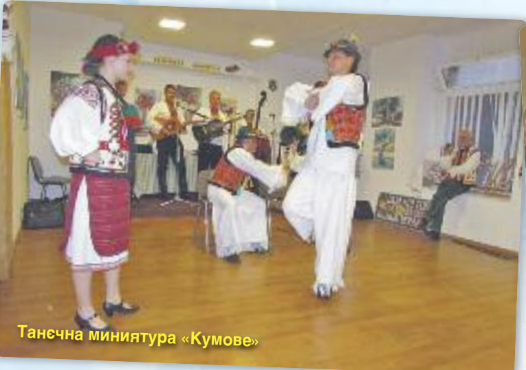
Танєчна миниатура «Кумове»