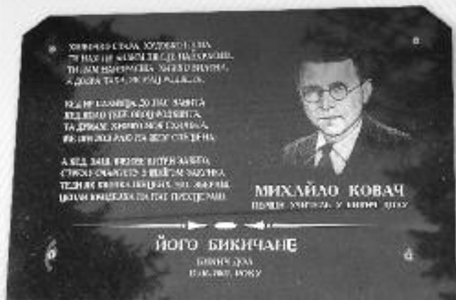
Памятна плоча рускому писательови