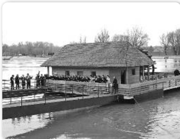
Воденіца на Драви у Осієку