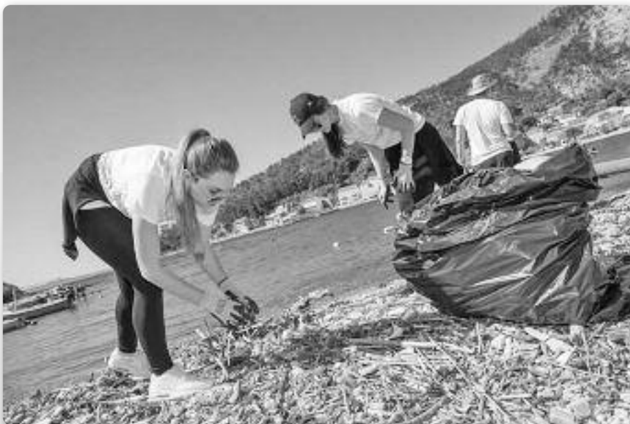
Studenti čiste plažu na Pelješcu.

Umjesto da svaki put uzimate papirić na kojem stoji izvješće o stanju računa, dovoljno ga je pogledati na zaslonu. Inače imate previše papira po džepovima i torbicama te vam ne trebaju dodatni