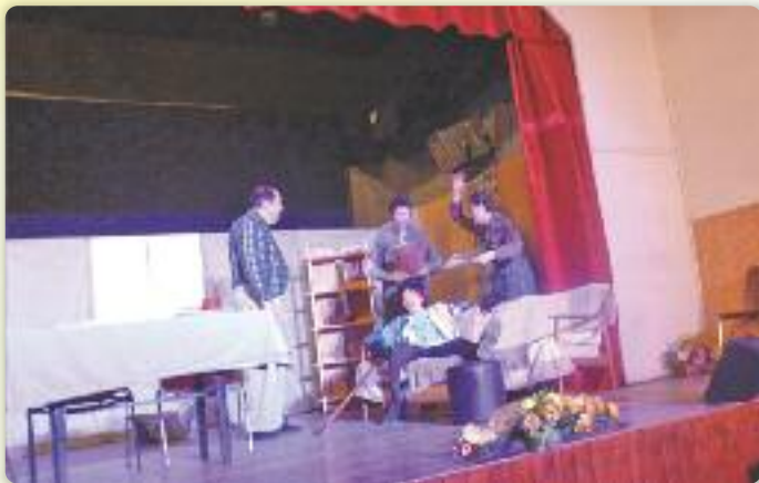
Застараносц пре замлетосц