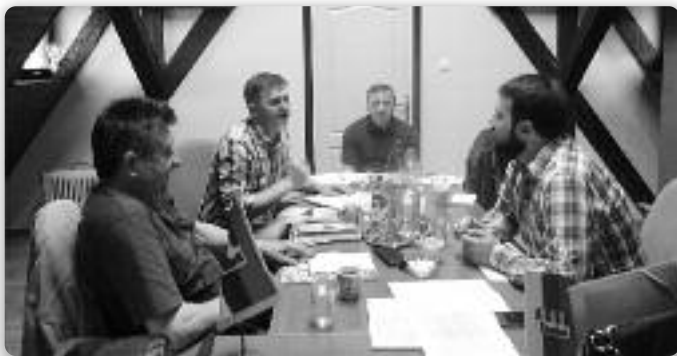
Члени національного Совиту и дружтвеного живота зоз Звонком Костелником