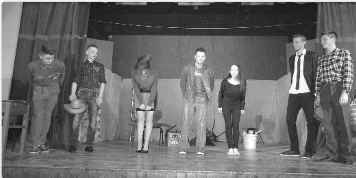
Глумецки ансамбл на премиери представи «Кров понад главу»