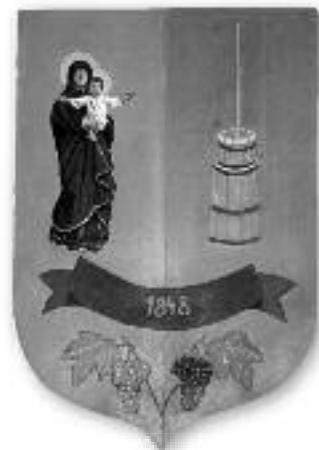
Герб Бикич Дола