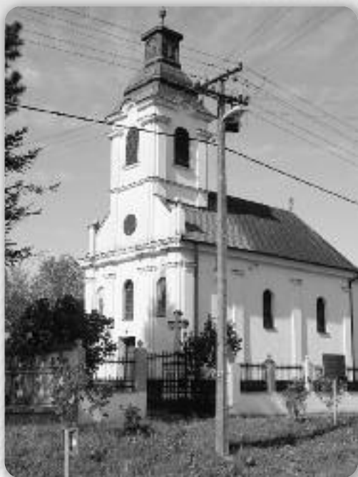
Црква Успения Пресвятей Богородици

Велі роки, по 1940. рок, мали Бикичанє до школи ходзели до валалу Привина Глава. Гоч ше у чаше Другей шве-