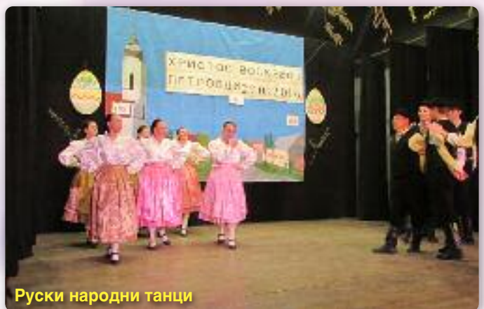
Руски народни танци