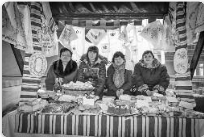
Здружене женох Бикичанки