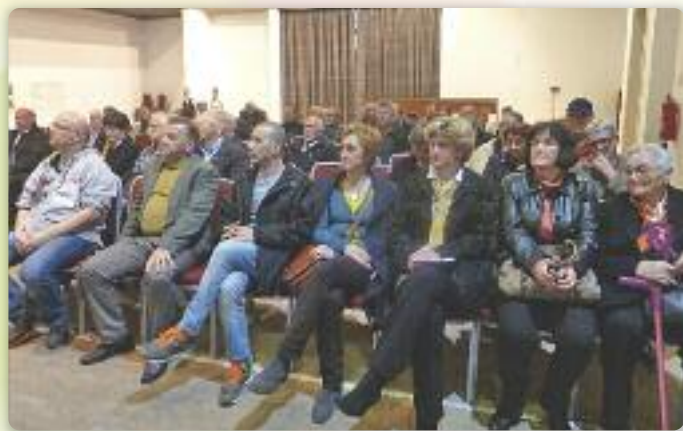
Публика на промоцији кнџики