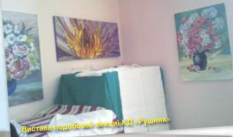
Вистава подобовей секції КД «Рушняк»