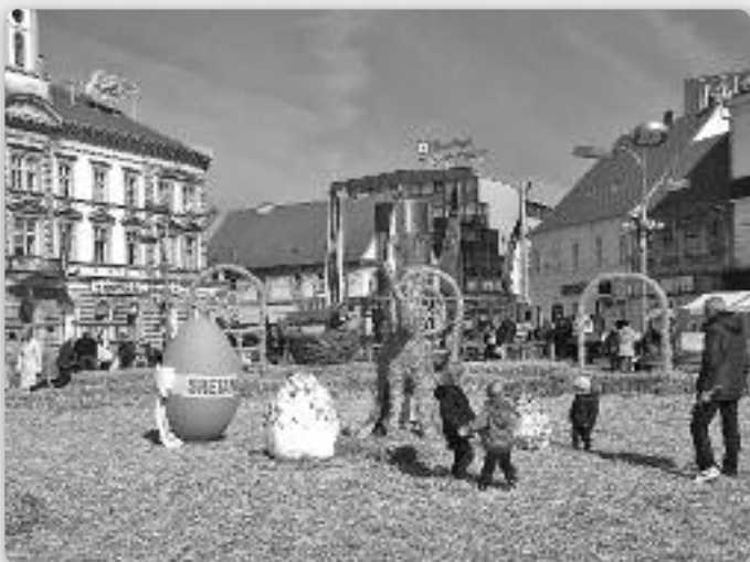
Гніздо зоз слами вельке 230 квадратни метери на централней площі у Осієку

У Осієку ше отримую рижни збудваня пред Вельку ноцу, а медзи иншим направене и найвекше округле сламяне гніздо на швеце.