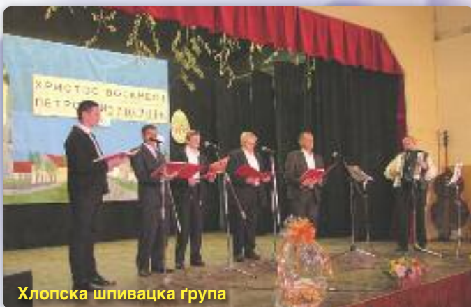
Хлопска шпивацка група