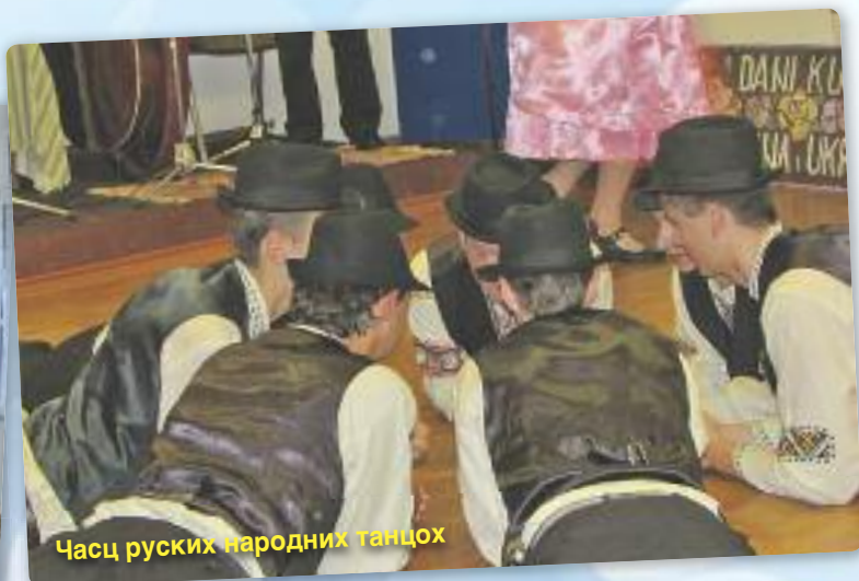
Часц руских народних танцох