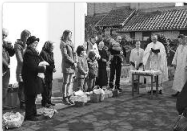
Пошвещанє Паски у Осієку