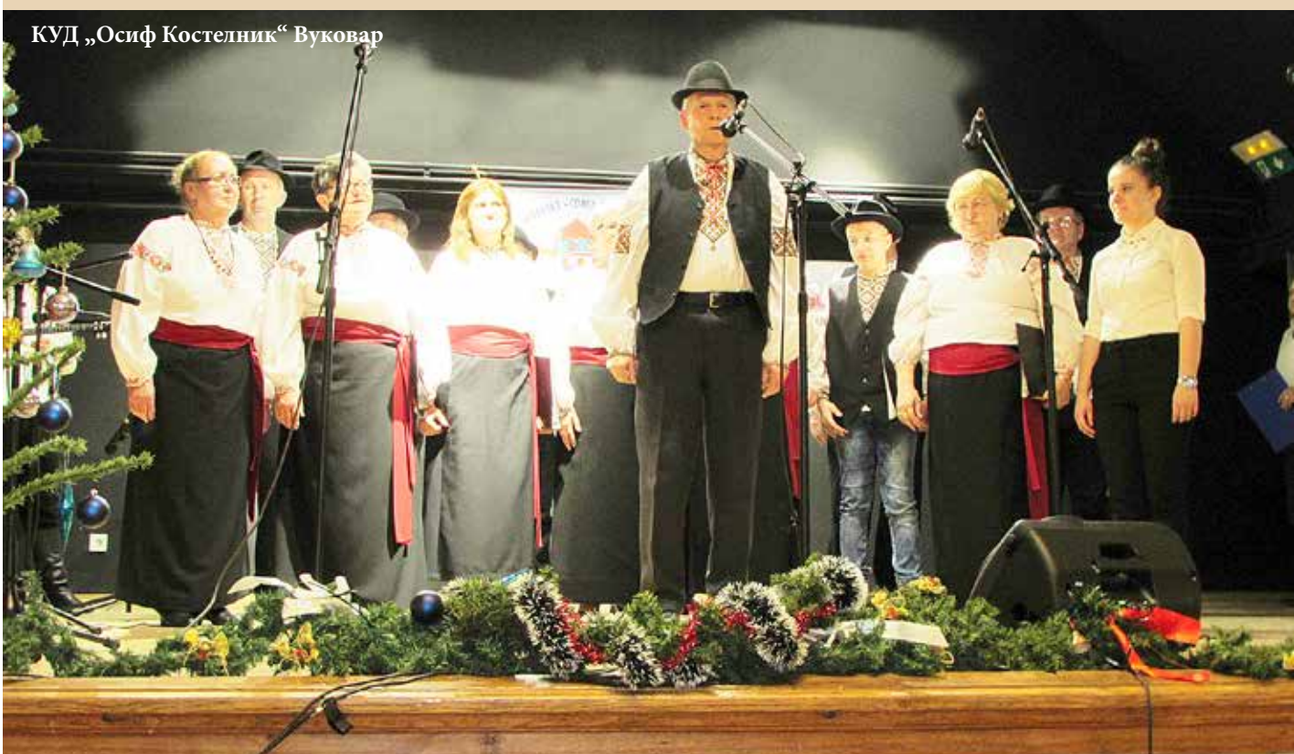
КУД „Осиф Костелник“ Вуковар