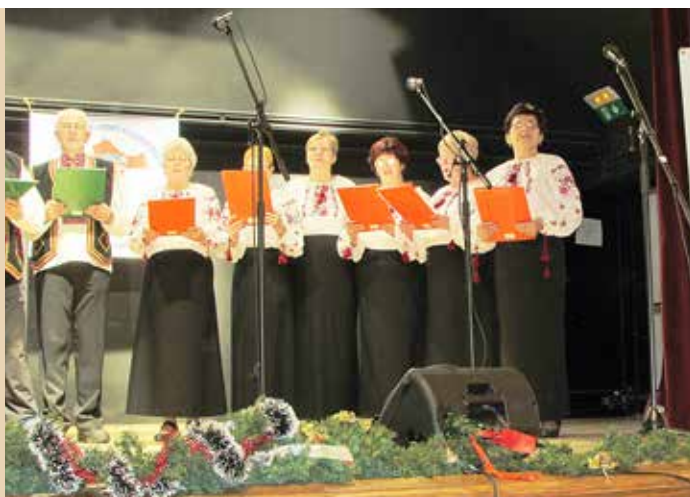
КУД Русинох Винковци