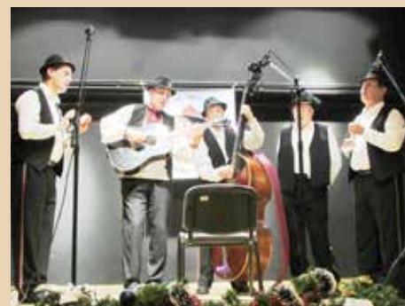
КУД „Яким Гарди“ Петровци