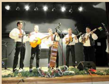
КД Руснацох Цвелфері Райово Село