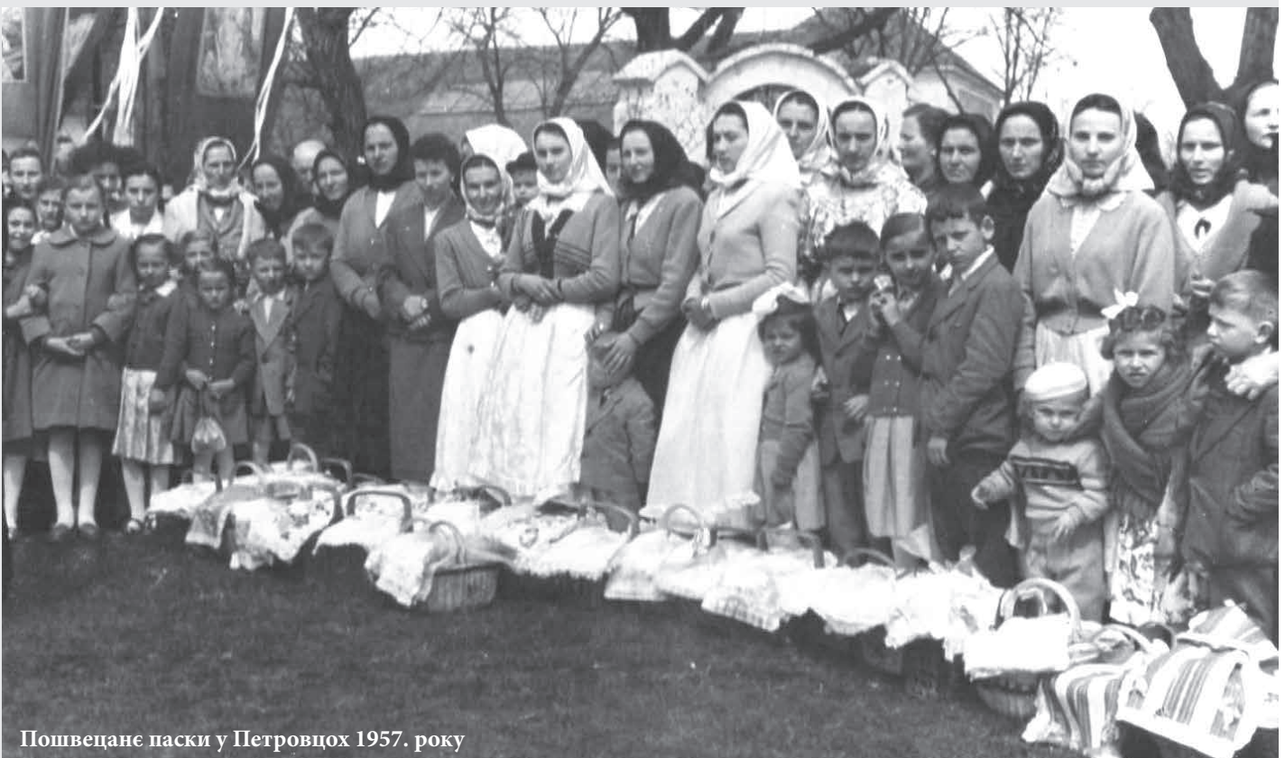
Пошведанє паски у Петровцѡх 1957. року