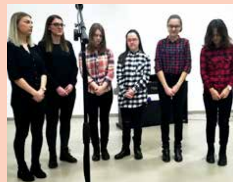
Хор зоз Солянох