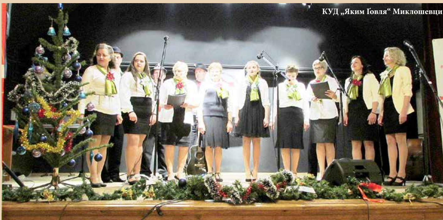
КУД „Яким Говля“ Миклошевци