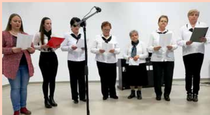
Хор парохије св. Йосафата