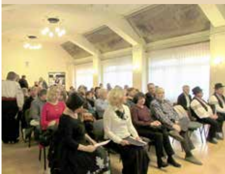
Публика на манифестации