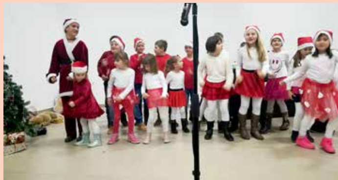
Дзеци зоз основеней школи