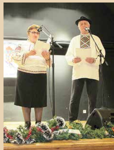
КУД Русинох и Українцох ПГЖ „Рушник“