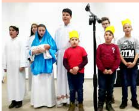
Дзеци парохије св. Йосафата