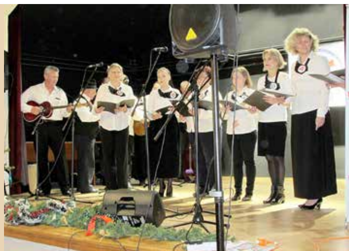
КУД Руснацох Осиек