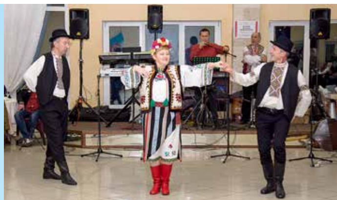
Ветреане Бурчак, Алерич, Мудри