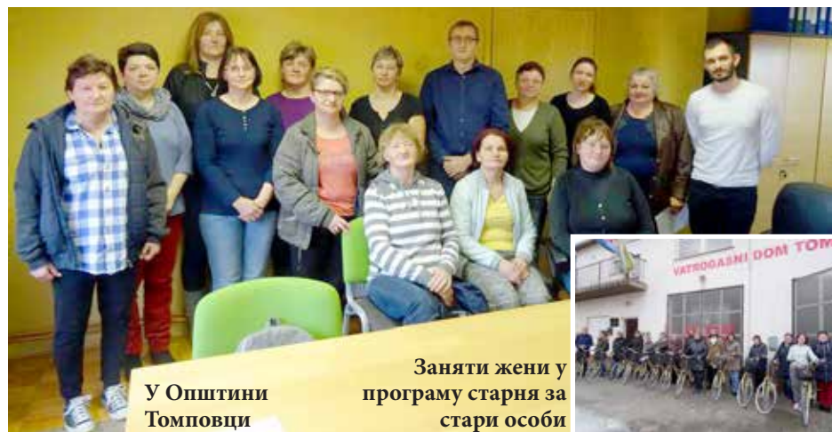
У Општини Томповци

Проектну документацию розробел Уряд за медзинардне сотрудніцтво TINTL, а партнере проекту Завод за обезпечоване работи и Центр за социалне старане.