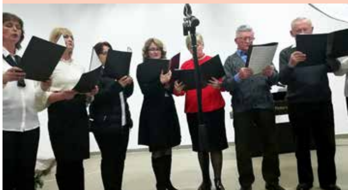
Хор церкви св. Илії Пророка