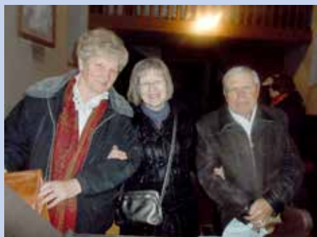
Вирніки после Служби Божей на Крачун

Крачун односно родзене Исуса Христа у Риєки достоїнствено преславени и у руских обисцох. Давни народни обичай уношеня слами до обисца не бул запровадзени, але ше дзечне колядовало зоз познатим питаньом „Дате нам се навесити“. На руских столах були бобальки и други традиційни крачунски єдла. Крачунска Служба Божа служена 25. децембра на 17 годзин у церкви св. Себастьяна и Флоріяна у центру Ри-