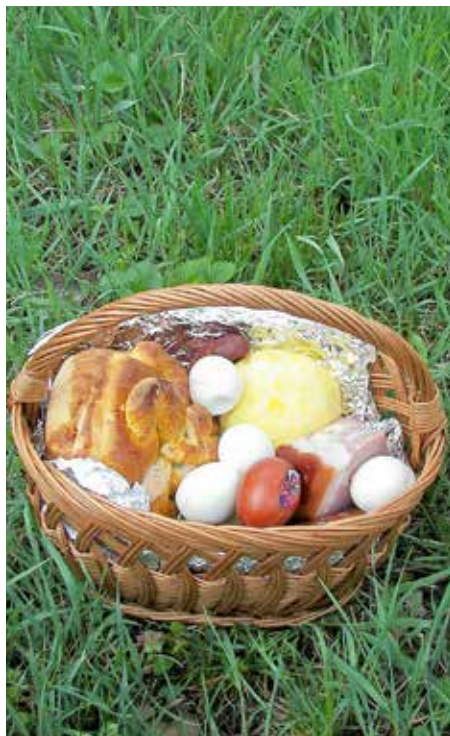
Паска у кошарки з лівого боку

У серватки хтора нам остала од сирца розмочиме квас и замишиме цесто. На пол кили муки досц 2,5 деци серватки и 2 деки швижого квасу. Кед не маме серватки, квас розмочиме у млеку або води, до хторей ше положи цукру, а познейше посоліме по смаку. До цеста долеєме погарик олею и 2-3 жовчки, добре вимишиме и зохабиме най викишне. Цесто добре кажди пол годзини ище два раз претрепац. Викиснуте цесто порежеме на менши цесточка зоз хторих правиме пасочки, кладземе их до помасченей шерпенки, поверху намаścиме зоз жовчком и украсиме з рижнима ружичками зоз цеста. Украси поприпинаме зоз зубодлбками же би ше не зошлісли док ше пасочки буду печиц. Пасочки печеме сциха же би ше випекли з нука, ище горуци по верху умиеме з воду, та закриєме з ручнічком же би одмекли.