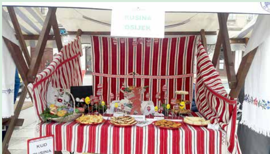
Национални руски едла и лакотки

Манифестацию провадзел и „Квитни корзо“ у котрим переважно участвовали оводарци зоз Осецких оводоох. Дзекеди их знало буц преї 1000. Були то прекрасни манифестации дзе шицко пирскало од младосци и радосци!