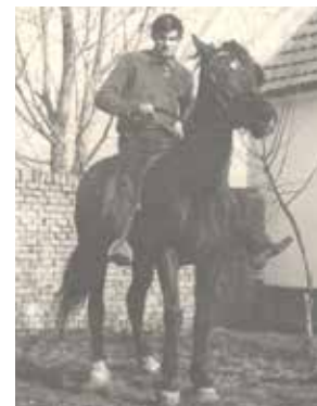
Владимир Еделински любєл шєдлац конї