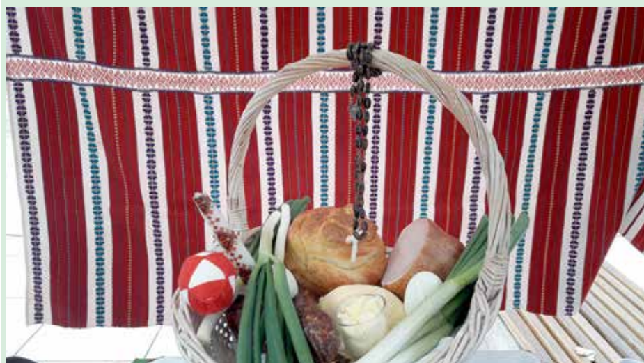
Традиційна руска кошарка за пошвещане