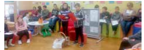
Руски язык представели школяре котри виучую руски язык

Спрам поради председательства Дружтва, того року зме поволали дзеци з Пе-