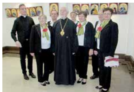
Фотография на памятку зоз нашим преосвященим владиком Николом Кекичом