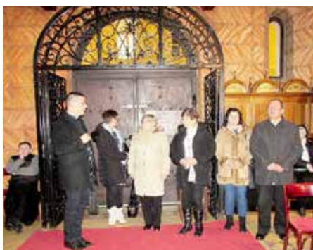
Нашпива грекокатолицкей церкви святих Кирила и Метода у Загребе