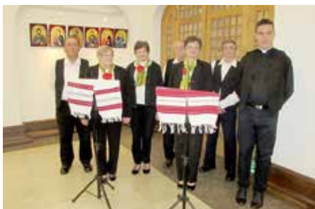
Члєни шпивацких секцийох КУД „Яким Гарди“ зоз Петровцох и КУД „Яким Говля“ зоз Миклошевцох