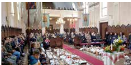
Кошарки за пошвещане на Вельку ноц у петровскей церкви Покрова Пресвятей Богородици

цали дзень отвореной церкви, у тихей молитви нащивйовани Иисусов гроб. Долоадня ше при гробе вименьовали дзеци, а валалски огньогасци тиж при гробе мали свою молитвену статистию. Зоз саночним и пасхалну утриню дочекали зме, гоч и зоз диджом, радосне швето Пасхи. На сам дзень швета полну церкву прикрашали порихтани кошарки котри зме вец спрам жридлового обичаю, бо ше вонка наисце вишвилело, винесли швецци у церковней порти. На други и треци дзень швета