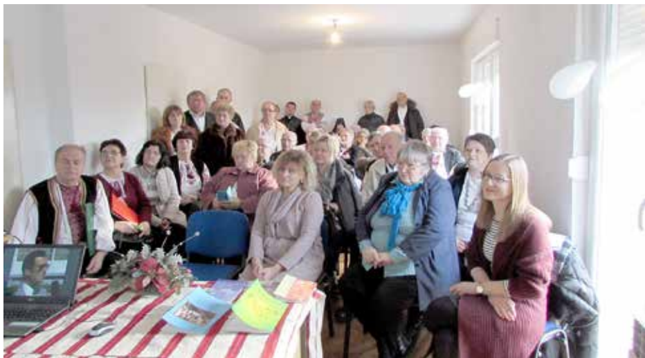
Публика на збуваню