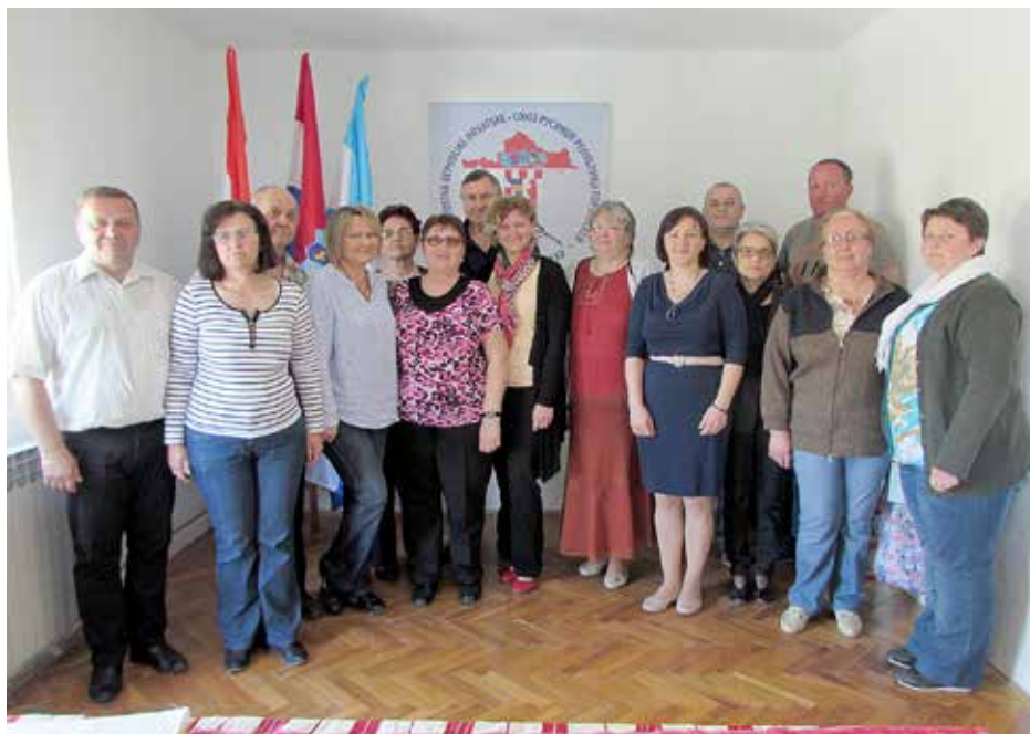
Члени Скупштину Союзу Руснох РГ