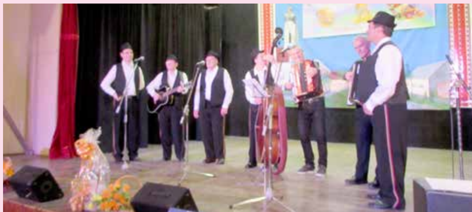
Хлопска шпивацка група

Дочаровац гласи Закарпатя, Прикарпатя и Буковини постарли ше танцоше виводзацкей групи зоз танцом „Опришки Олекси Довбуша – Дедіка“. Одпочивок уж шицким вше баржей треба, а и же би ше танцоше ище кус одпочинули, Хлопска шпивацка група одшпивала венчик руских шпиванкох под назву „Яй, Боже, мой тоти мойо черешні“. За конец зме зохабели „Русински пастирски танци“ принесени зоз Горніци, дзе нашо дїдове були пастире. На одушевіе и паметане шицких присутних и госцох Дома култури у Петровцих, на добру ноц и по наступни концерт, танцоше ше одпитали од своєй вирней публики, а шицки учашніки концерту одшпивали писню „На многая літа“ котру прилапела и ведно з німа одшпивала и публика у Доме култури.