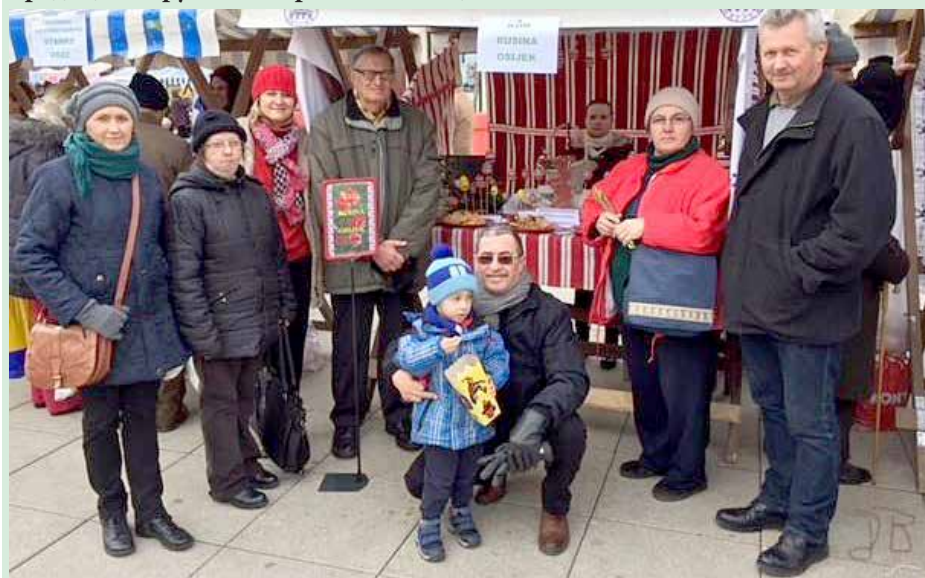
Члени КУД Руснацох Осиєк опрез руского штанду