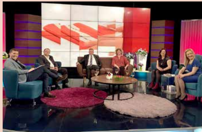
У студию РТВ Нови Сад