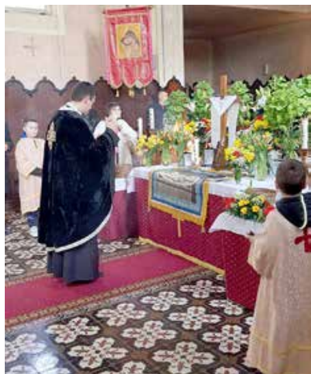
Часц Святей Служби Божей

Швето воскреснуца Господа нашого Исуса Христа, найвекше християнске швето. Прето ше и шветкуе торжественно през вецей дні. На Вельки (желени) штварток зазначели зме Христову Тайну вечеру з апостолами и постановене Евхаристії зоз Службу Божу св. Василя Велького и вечерню на 17 годзин. На Вельки пияток, дзень строгого посту и здогадованя на Христову муку и шмерц. Вечурня „Хованя Христового“ служена зоз викладаньом плащаниці на 15 годзин. На Вельку субботу, у