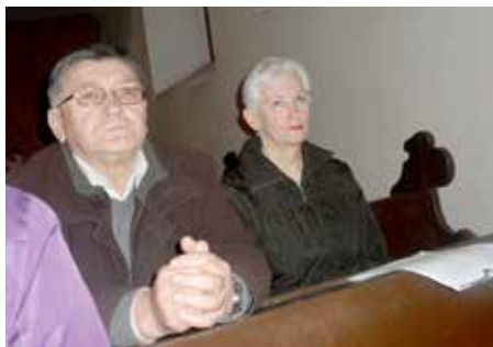
Вирніки у Риєки на Служби Божей

За швето Велькей ноци зме ше порихтали по руским обичаю, зоз вареньом