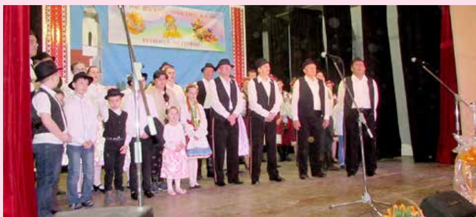
Шицки учашніки шпиваю „Многая літа“