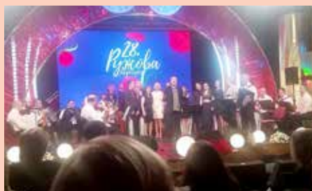
Интерпретация новей русской шпиванки на „Ружовой заградки“