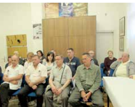
Публика на збуваню