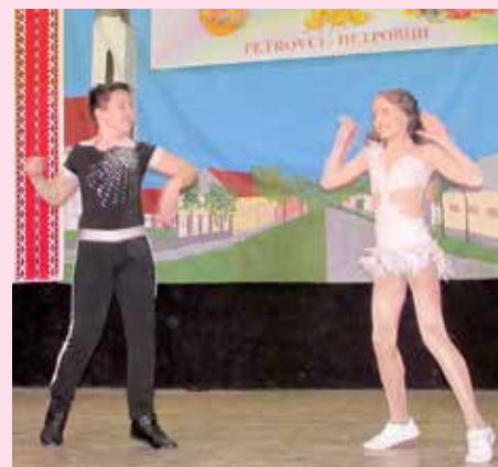
Танечени клуб Кик зоз Осиеку