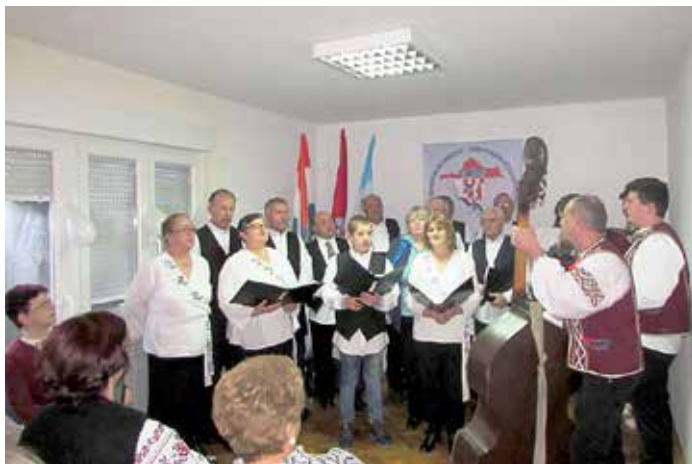
Мишани хор КУД „Осиф Костелник“ Вуковар