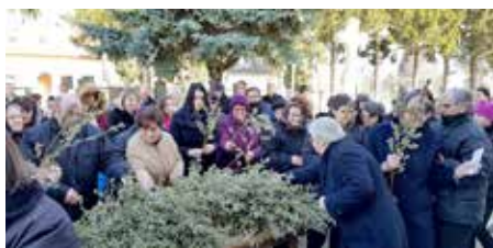
Багнітки на Квитну недзелю

цали дзень отвореной церкви, у тихей молитви нащивйовани Иисусов гроб. Долоадня ше при гробе вименьовали дзеци, а валалски огньогасци тиж при гробе мали свою молитвену статистию. Зоз саночним и пасхалну утриню дочекали зме, гоч и зоз диджом, радосне швето Пасхи. На сам дзень швета полну церкву прикрашали порихтани кошарки котри зме вец спрам жридлового обичаю, бо ше вонка наисце вишвилело, винесли швецци у церковней порти. На други и треци дзень швета