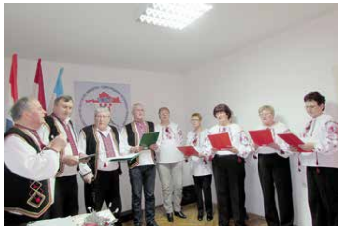
Мишани хор КУД Русинох Винковци