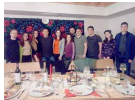
Рада Шветового форуму русинской младежи з домашнїма