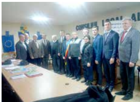
Члени Шветовой ради Шветового конгресу Русиных/Руснацох/Лемкох з представителями власци Румунії

На Ради прилапени два проєкти з котрима ше будзе конкурвовац за гранти. То II Медзинародни школярски табор у юлиу и IV Медзинародни мултижанрови фестивал русинской музики у октобре, а обидва би ше отримали у Словацкей. На истей прилапене и предкладане за утвердзоване заедницького Дня Русиных у швецце, же то будзе 23. марец. Организация преслави започне од идуцого року. Преслава трецого Дня Русиных у Мукачеве, на Закарпатю у України, того року ше отрима 21. априла кед ше означаи и 24. април, дзень народзенья русинского будителя Алексан-