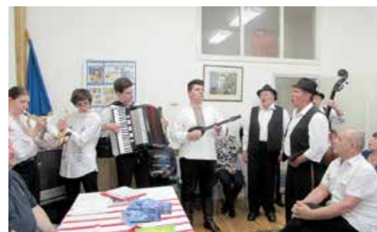
Хлопска шпивацка група КУД „Яким Гарди“ Петровци