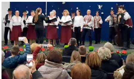
KUD „Osif Kostelnik“ Vukovar