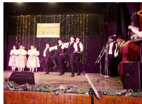
Руски народни танци