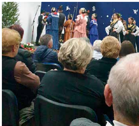
KUD Sava Rajevo Selo