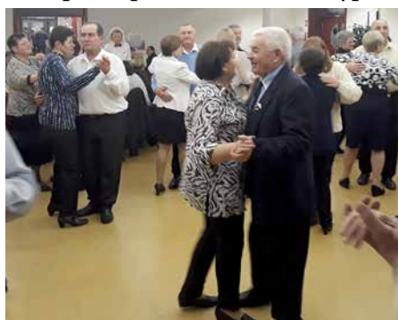
Танец до рана