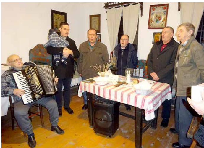
Зашпивало ше у предней хижи