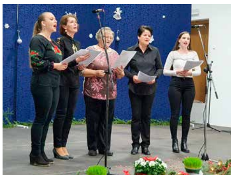
KUD Rusina Cvelferije Rajevo Selo