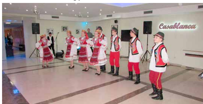
Закарпатска полка КУД „Яким Говля“ Миклошевци