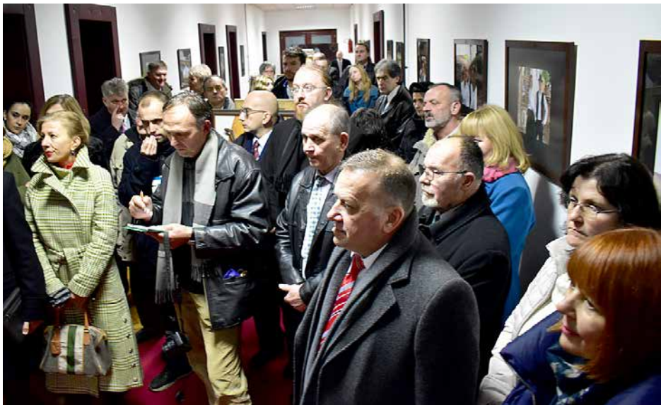
Делегация з Републики Горватскей на Дню Руснацох Сербії у Шидзе