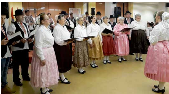
Мишани хор КУД „Осиф Костелник“