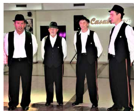
Хлопска шпивацка група КУД „Яким Гарди“ Петровци