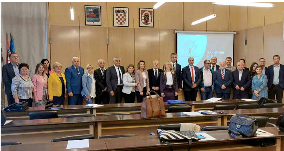
Шицки учашніки на збуваню