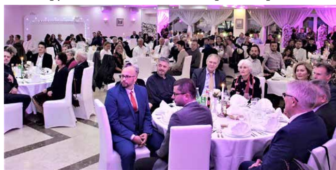
Вельке число госцох