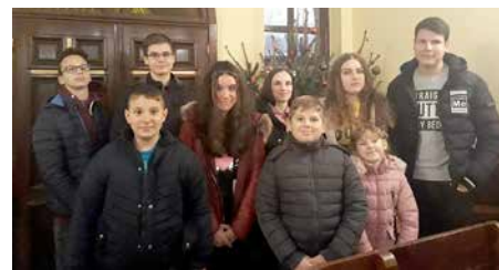
Vjernici na božićnoj liturgiji

U blagdanskom duhu, djeca župe sv. Jozafata iz Rajevog Sela pripremala su se i vježbala koljade. Na Badnjak su se u popodnevним satima okupili u župnoj crkvi i okitili jelku. Dok su kitili jelku, pjevali su tradicionalne božićne pjesme. Nakon toga u 18 h krenili su od kuće do kuće i pjevali koljade. Za svoje pjevanje dobili su i prikladne darove. Na samom kraju došli su i do župne kuće gdje su otpjevali koljade, a zatim krenuli svojim kućama pripremati se za polnoćku.