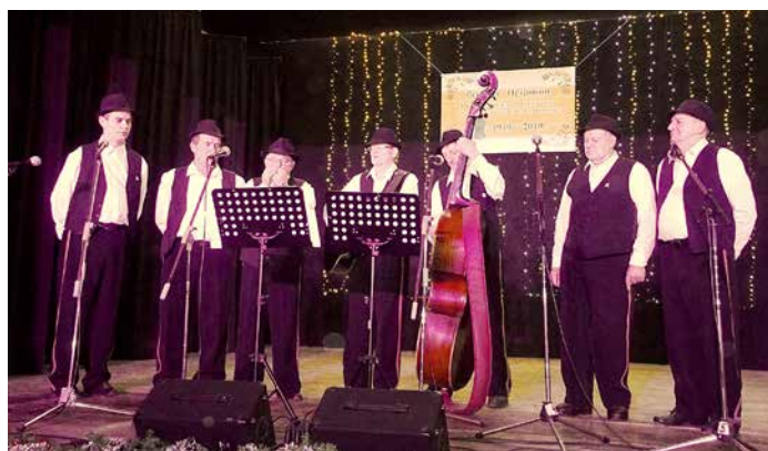
Хлопска шпивацка група КУД „Яким Гарди“