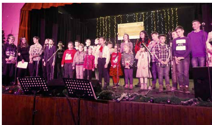
Школяре хтори уча руски язык у ПШ Петровци