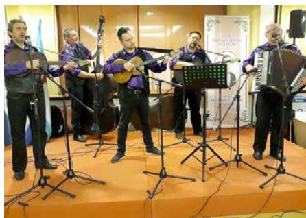
Оркестер КУД „Жатва“ Коцур