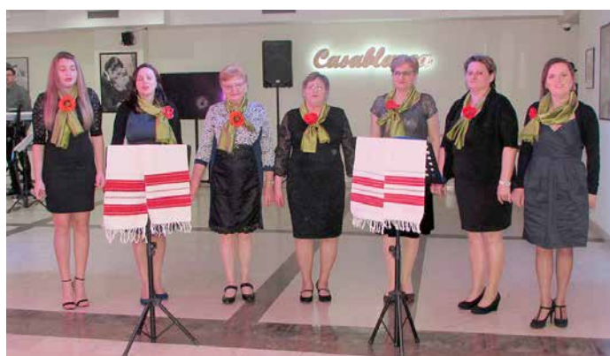
Женска шпивацка група КУД „Яким Говля“ Миклошевци