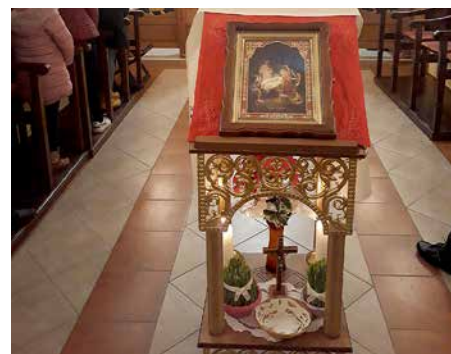
Župa sv. Jozafata Rajevo Selo, božićni detalj

U 23 h započela je božićna liturgija. Nakon mise vjernici su jedni drugima čestitali Božić i družili se u župnom dvoru uz kuhano vino. Na sami blagdan Božića misa se održala u 9 i 30 h.