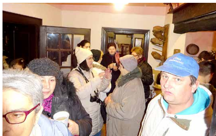
Зацїкавени розпатраче музею