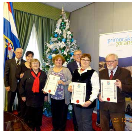
Лауреати зоз провадзацима членами