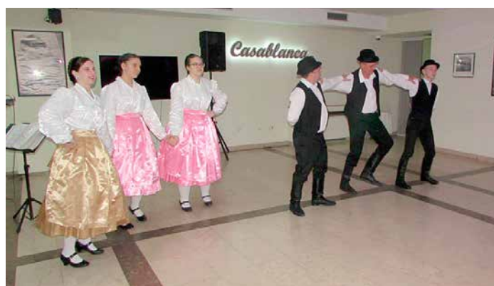
Венчик руских танцох КУД „Яким Гарди“ Петровци