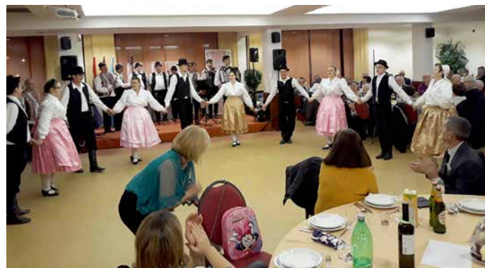
Венчик руских народних танцох