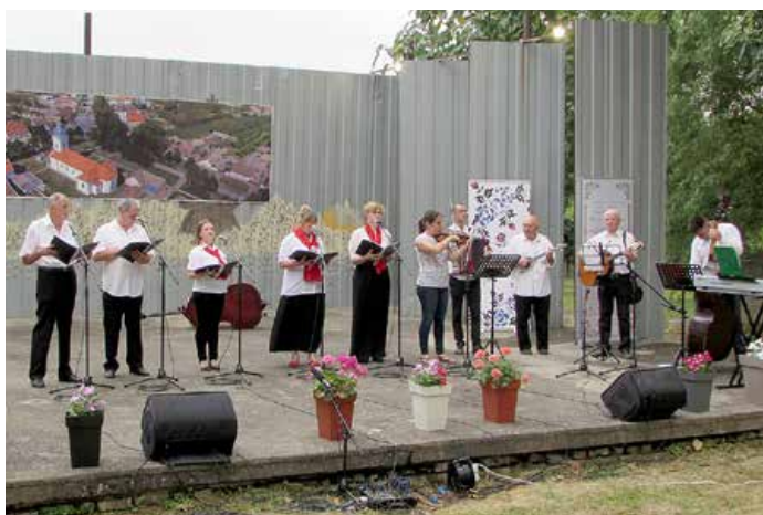
КУД Руснацох Осиек