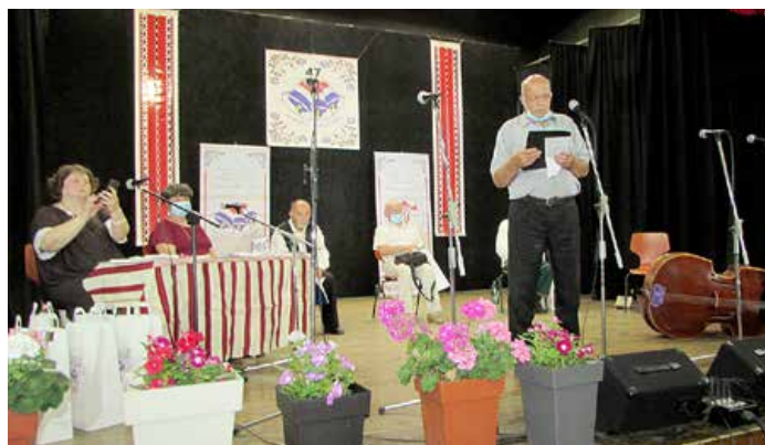
Звонимир Барна, поет