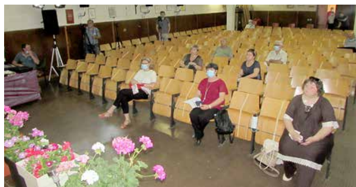
Публика у сали шедзи справ препорученьох Штабу цивилней заштити