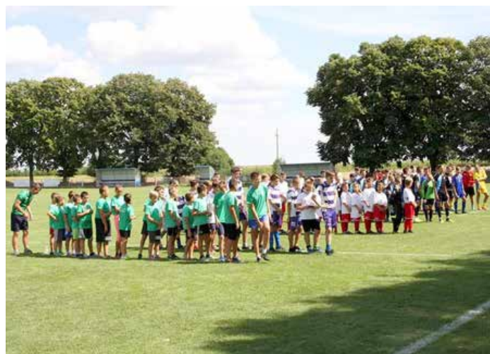
Екипи на турніру