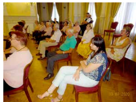
Публика на концерту

Идуцого дня, 8. юлія, у Матки пензионерох отримана Подобова робо-