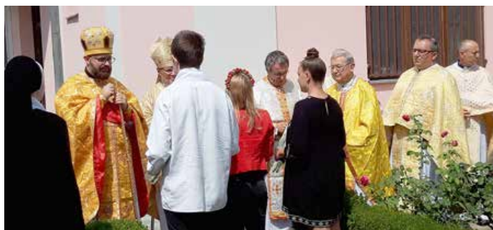
Дзеци витаю монс. Стипича и монс. Хранича