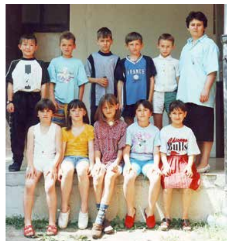
Перша генерация у хторей класа 1998./99.

Ми ище вше не маме учебніки и вец я дзецом правим и давам скрипти. Але ані тоти скрипти не можу буц универзални бо до едней класи не вше приходза школяре з истим пред'знаньом, так