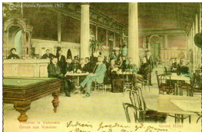
Карчма готела Пунович_ Гранд готел познейше Роботнічки дом, 1903. рок

Kraljevski komesar Pichler htio je da se samostan pretvori u lazaret okuženika, ali mu eks-provincijal o. Ladislav Spaić svojom predstavkom na kraljevskog na-