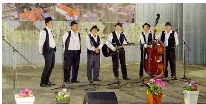
КУД „Яким Гарди“ з Петровцох