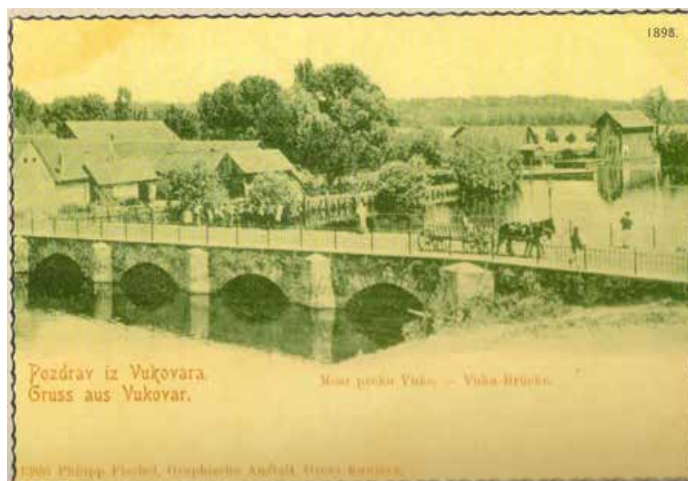
Мост на рики Вуки 1898. року