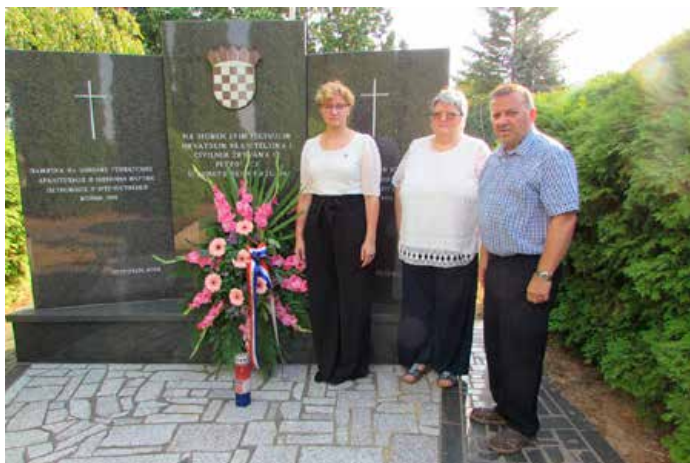
Покладане венцох на памятник шицким погинутим барнітельюм и жертвом у Отечественей войны на петровским грекокатолицким теметове

По перши раз на Петровским дзвону наступело и Бошняцке КУД „Лїлян“ зоз Дреновцох – Падежи, котре основане 2003. року и чишли коло штерацец членох. Одшпивали венчик народних шпиванкох зоз свойого краю.