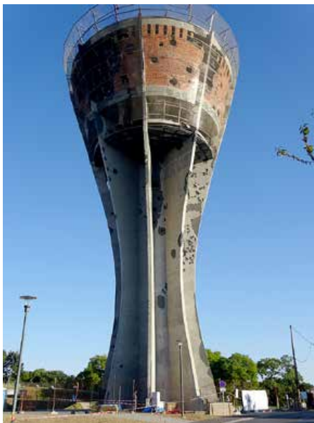
Випатрунок Водотурні тераз

проекту, слово о будовательним подняцу зоз яким ше потераз у РГ ніхто не стретал. Вуковарска Водотурня висока 50 метери, а под час войны була потрафена зоз преїг 600 гранатами, цо виволало вельки очкодованя пре хтори рекон-