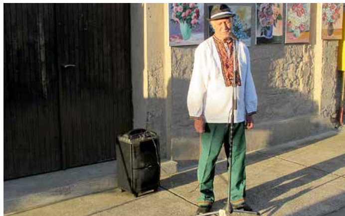
Слово автора о вибраних експонатах