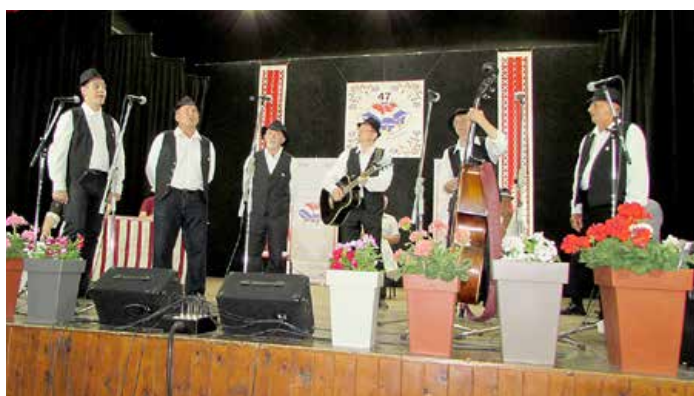
Хлопска шпывацка група КУД „Яким Гарди“ на літаратурнім вечару