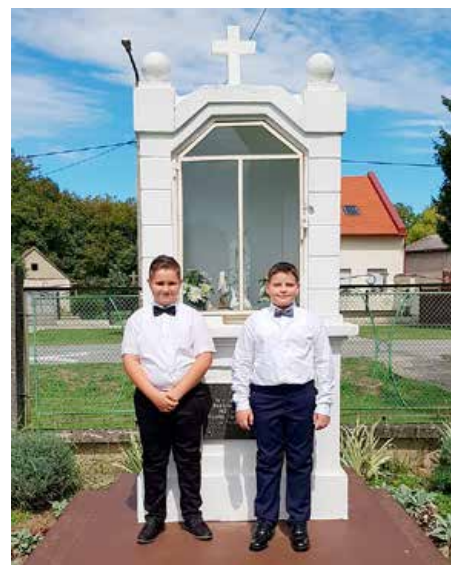
Памятка на Першу причасц

Плановац кеди ше одбудзе славе, у якей форми, з яким пририхтованьом, то того року остало наисце вельбаржей у Божих рукох. Ище вше ест вельо парохїи у Горватскей дзе пре актуални обставини, нажаль, Перша причасц не була и до дальшого не будзе славена. Научели зме же найвекша радосц тей