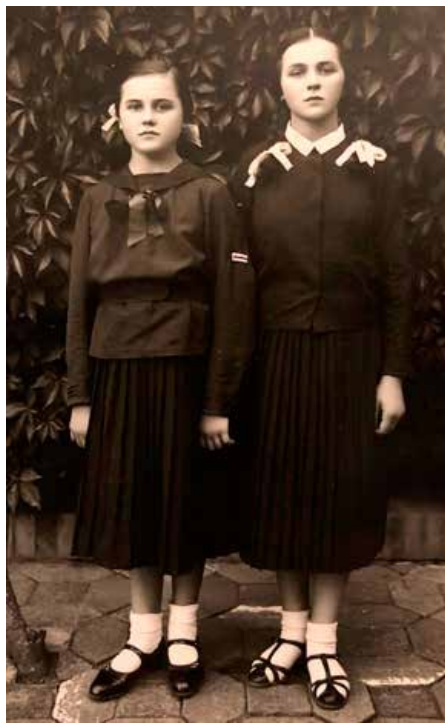
Здогадоване на дзивоцки роки