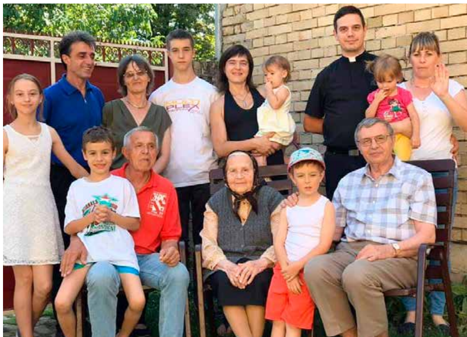
Ведно зоз своїма наймилшима у старосци