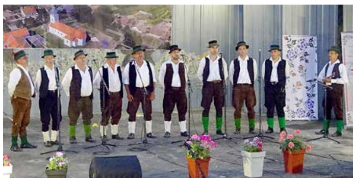
Хлопска шпивачка група „Баче“ зоз Бошнякох