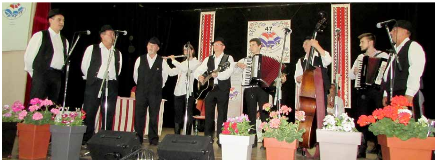
Оркестер КУД „Осиф Костелник“ провадзи Хлопску шпывацку групу КУД „Яким Гарди“