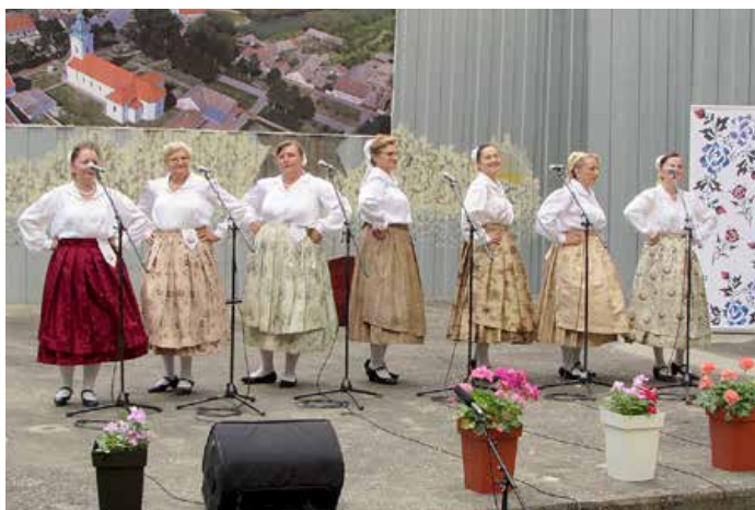
КУД „Яким Говля“ Миклошевци