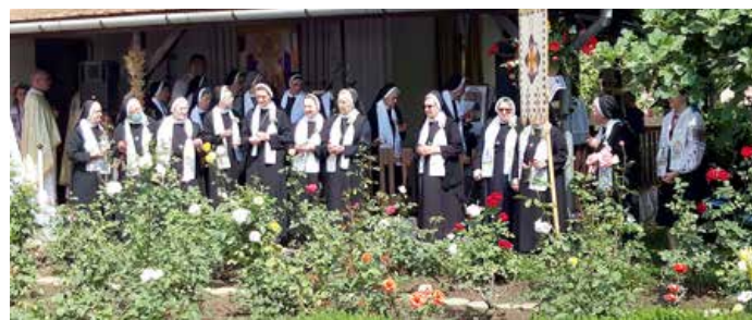
Чесни шестри Василиянки на преслви 100-рочніці свойого перебуваня на тих просторох

Всоботу, 18. юлия, у манастирскей каплички Христа Царя, чесни шестри святого Василия Велького (ЧСВВ), зоз благодарну Службу Божу, та пригодну програму, преславели вельки ювильей – 100 роки од приходу на тоти нашо простори.