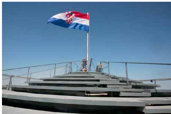
Верх Водотурні зоз символичнима гарадичами