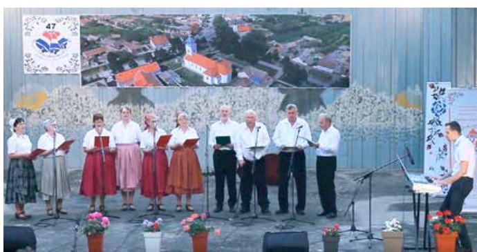
КУД Русинох Винковци