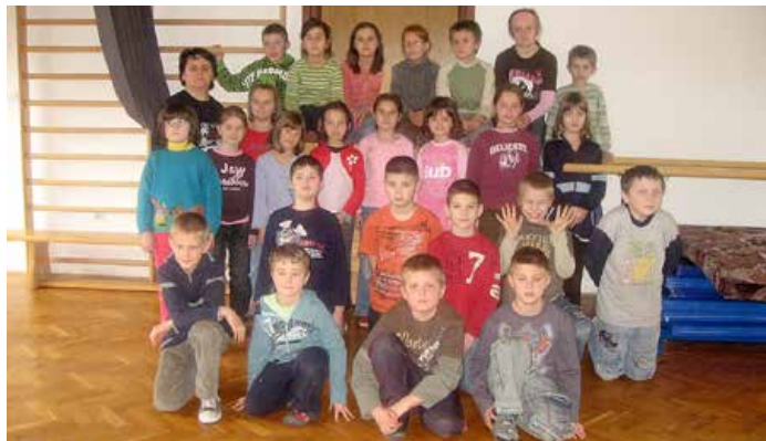
Руски язык, нїзши класи 2008./2009.