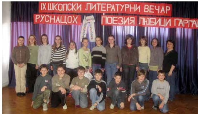
Руски язык, висши класи 2008./2009.