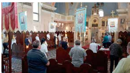
Вирни на Служби

Кед ше спомне мено С. Радича, вец би требало з общей култури знац же то перши школовани политолог и политичар з наших крайох. Пре свою идею „seljačka sloga i vjega u Boga“ його рух бул барз популярни и медзи нашим народом. О тим мож читац и у дзепоедних спомин-кнїжкох наших грекокатолицких парохийох по цалей Горватскей, окреме у Славонїи и Сриме. Радич студирал по велїх стредньоевропских городов, а на концу и у Паризу. По своїм опредзеленю не бул монархист, але републиканец. Добре познал чеськи язык и оженел Чехиню. Тиж добре знал хто то Русини у Австро-Угорскей Монархїи, як и у Горватскей. Вон у своїх идеяох о сотрудованю Славянох вецей раз спомина и Русинох, не думаючи при тим лем на тих цо жию у бачванско-сримским ареалу, або приселенцох зоз Галичини, але и гевтих цо жили вонконцом восточней часци