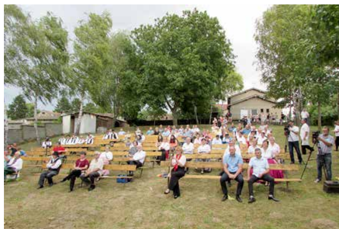
Публика на Петровским дзвону