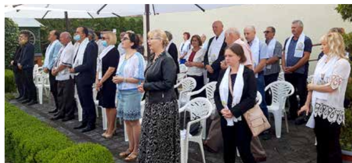
Вирни на Служби Божей