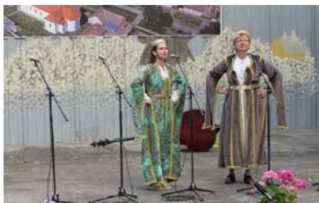
КУД Бошнякох „Лілян“ Дреновци – Падеж