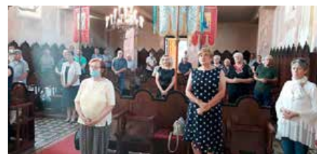
Служба Божя за Степана Радича у петровскей грекокатолицкей церкви Покрову Пресвятей Богородици

На молбу же би ше рочніца Радичовой шмерци того року на жупанийским уровню молитвено означела у Петровцох, приступело ше планованю програми за 8. август. У догварки з Општину Богдановци, грекокатолицку петровску парохию и членами жупанийскей ГСС-и пораждане же би ше положел венец на памятник шлицким пострадалим Петровчаньом – цивилом и бранїтльом у Отечественей войны з