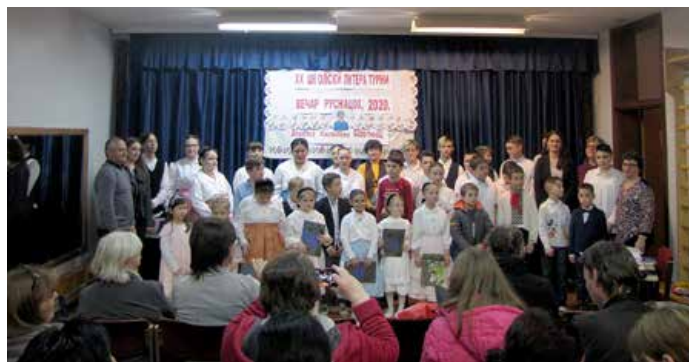
Руски язык, шицки класи петровских школярох з петровским колективом, поетесу и директором