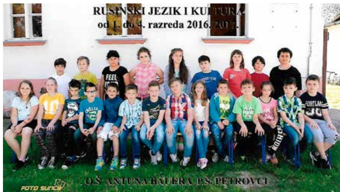
Руски язык, нізши класи 2016./2017.