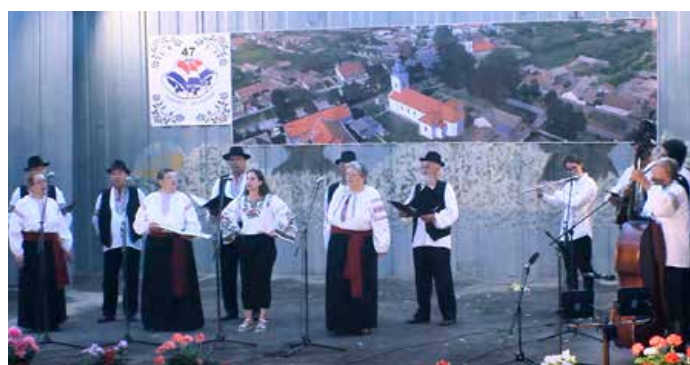
Мишани хор КУД „Осиф Костелник“ Вуковар