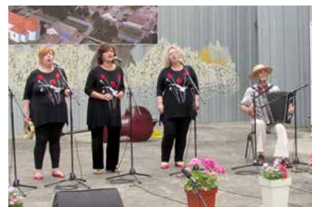
Дружтво „Каліна“ Риека