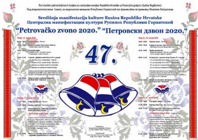
Плаката тогорочного Петровского дзвону