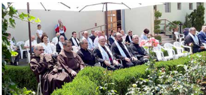
Визначни госци провадза програму