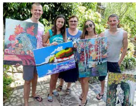
Малярски роботи на колоніи