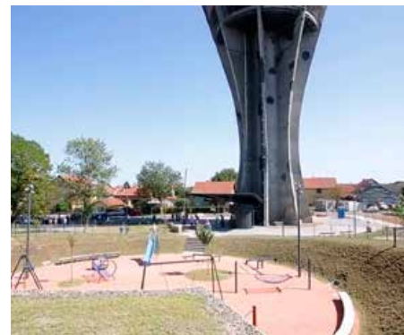
Бавиліще за дзеци под Водотурню

проекту, слово о будовательним подняцу зоз яким ше потераз у РГ ніхто не стретал. Вуковарска Водотурня висока 50 метери, а под час войны була потрафена зоз преїг 600 гранатами, цо виволало вельки очкодованя пре хтори рекон-