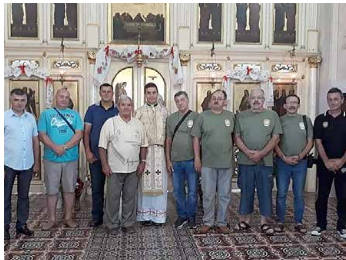
Свята Служба Божа у петровскей грекокатолицкей церкви