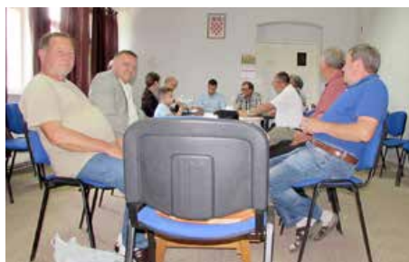
Члени Ради рускей националней меншини Општини Богдановци

Єдна од наших задачох повязоваць и потримоваць нашо здруженя. Так зме мали задумку того року до Петровцох привесць госцох з Нового Саду. Друж-