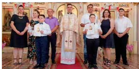
Тогорочни першопричашнїки з родичами и петровским парохом пред олтаром

Тогорочни Перши причасци здогадли велїх спомедзи нас котри зме уж призабули же то у першим шоре не дацо