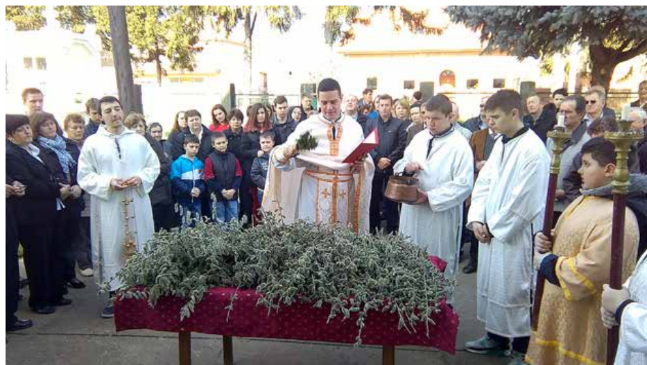
Швецене багнїткох на Квитну недзелю 2016. року

– Кед чловек не обтерховани з идеологию идентитету, але природно усвое одредзени вредносци, у обставиных дзе ше вони тиж и жию, вец то збогацоване, а не психоза. Паметам же сом ше руски намагал научиц у Коцуре, у мацеровей фамелиї. У Суботици зме не бешедовали часто по руски, але у Коцуре зме ше природно преруцовали на руску бешеду. На летних ферийох намагал сом ше уклопиц до тедишней валагалей слики. Кед ме послали по млеко, по хлеб або до тарговини, кед сом ишол до церкви, вшадзи бешедовали по руски, та так и я робел. Патрел сом вше буц инклузивни.