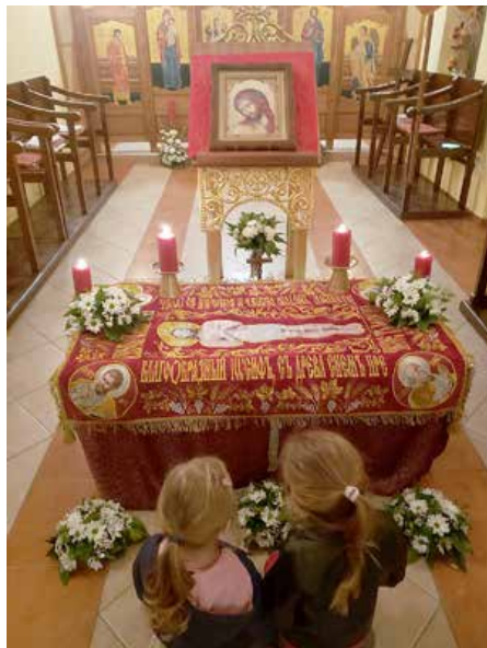
Molitva pred Kristovim grobom

s polaganjem plaštenice u grob, a nakon toga je postavljena straža koja je čuvala Kristov grob. Za stražu su se pobrinuli naši najmlađi župljani.