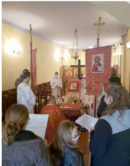
Polaganje plaštenice u Kristov grob

2. travnja 2021. godine, na petak prije Uskrsa, točnije na Veliki petak, sjećamo se Isusove muke i smrti. On je dao sebe, svoj život za nas, za naše spasenje. To je i dan kada je obvezan post za sve odrasle osobe. U župnoj crkvi u rano jutro služena je jutrenja, a poslije Carski časovi. U večernjim satima služili smo večernju Velikoga petka