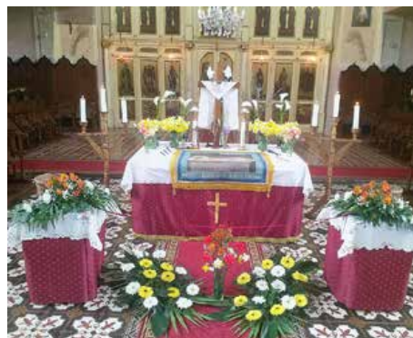
Христов гроб на Вельки пияток

На Квитну недзелю поблагословили зме багнітки и конари. На Желени штварток преславили зме постановене Евхаристии и означели Юдову зраду. У служеньох Велького пиятку Вечурня хованя Христового и викладане плащаницы были главне служене того дня. Плащаницу зме и того року не бочкали пре епидемиологийни мири. На Вельку соботу церква була отворена за циху молитву при Христовим гробе, а була