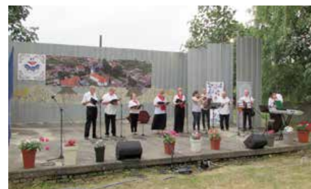
Petrovačko zvono 2020.

Moje prvo radno mjesto bilo je pripravništvo u ustanovi koja je zbrinjavala odrasle osobe s psihičkim, ali i intelektualnim teškoćama. Tamo mi je bilo ugodno raditi, svatko tko radi u nekoj ustanovi za zbrinjavanje i smještaj određenih skupina ljudi (poput djece, starijih osoba, osoba s intelektualnim teškoćama itd.) zna da to nije samo posao, nego i suživot. Oni s vama dijele svoj životni prostor, radne obveze, brige i probleme itd. Slavite zajedno rođendane, blagdane, odlazite na ljetovanja. Nakon što mi je završio pripravnički staž, dok sam nastojala pronaći posao, shvatila sam da se ne vidim toliko u socijalnoj skrbi. Posao je vrlo zahtjevan, često i stresan, što javnost može vidjeti i iz nedavnih događaja u centrima za socijalnu skrb. Kad mi se ukazala prilika za rad u školi, odlučila sam se prijaviti i dobila sam posao. Radila sam najprije u osnovnim školama oko godinu dana, a onda sam dobila posao u srednjoj školi kao nastavnica psihologije i tu sam i danas. U početku nisam niti sanjala da ću raditi nastavnički posao, no s vremenom sam ga zavoljela. Dobar je osjećaj kad nekome objašnjavate neku psihološku pojavu i on/a to primijeti kod sebe, nauči nešto