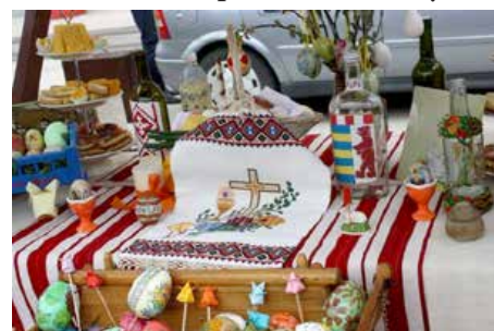
Фрагмент зоз штанду КУД Руснацох Осиек

националних меншинох зоз гражданами Осиеку, упознаване з националним скарбом, радосц же єдно предлоадне шицки буду ведно и не важне хто ма пенєжи а хто не, шицки були з радосцу привитани на каждем штанду, каждей националней меншини. Познейше, як зме уж писали, преросло до манифестації на хторей ше заребя, квитни корзо утаргнути, а продукти на штандох почали приносиц профит.