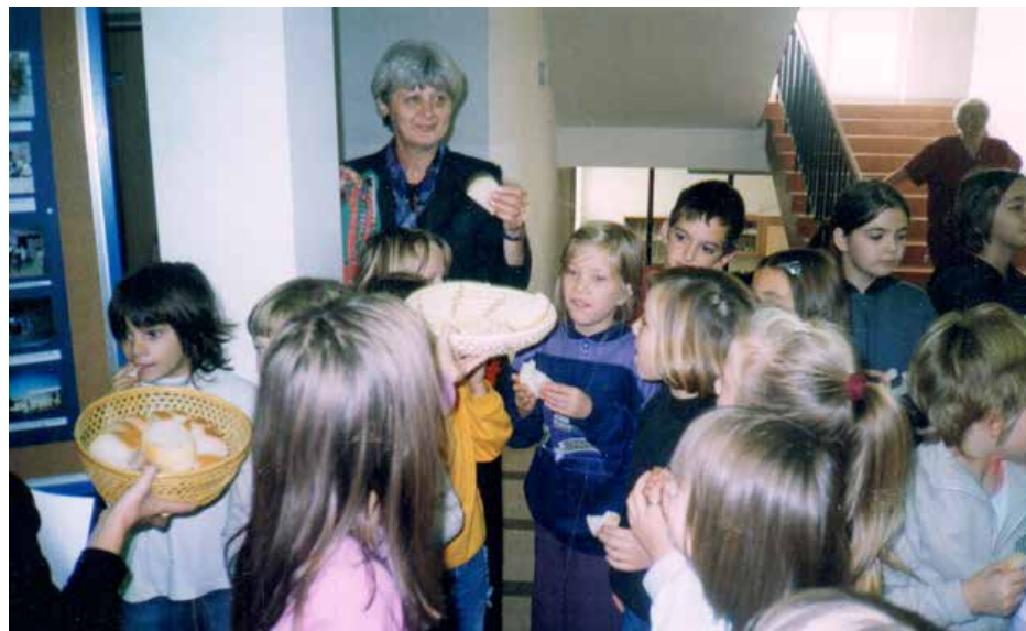
Днї хлєба 2003. року

Гєй. Моя фамилия мала вєльо порозумєня. Мала сом у своєй хижї стол и на нїм шицко потрєбнє; вшє сом мушєла виправяц задачницї, або лектири, або контолни. То мушєло буц прєшє и вшє сом шицко сцигла одрєбиц на час. Од малючка сом була така жє сом вшє шицко сцигла.