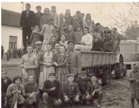
Миклошевски давни часи