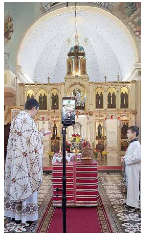
Швецене паскох у пандемийних условийох 2020. року преношене онлайн

Ту у Сриме, з часу на час обиходзаци родзину у Миклошевцох и ширше, патраци на обисце у котрим ше народзел мой дїдо, валал у котрим вон роснул, не чувствуем ше цудзо. По дїдох сом не лем Бачвань, але и Сримец. На питане баржей Коцурец чи Керестурец? Патраци на коренї, заш обидва, бо ше „чарни Минарово“ (Мудрово) преселели зоз Р. Керестура до Микло-