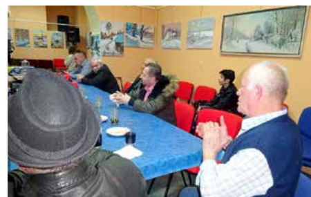
Провчи у Ради Бошнякох у Риеки на Валентиново 2021. року