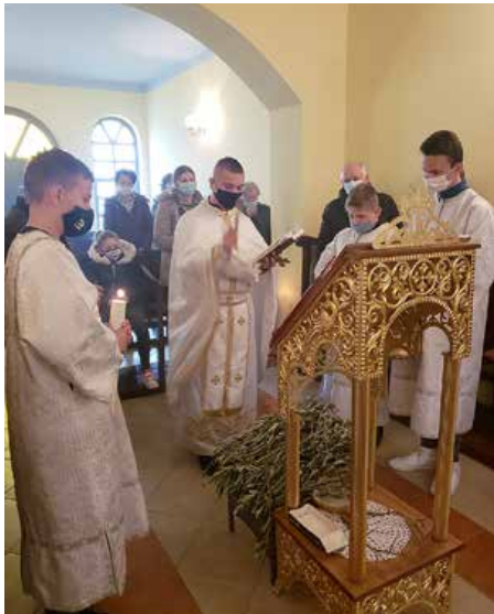
Blagoslov maslinovih grančica na Cvjetnicu

Ove godine Veliki tjedan započeo je na Cvjetnicu 28. ožujka 2021. godine. Na svetoj liturgiji održanoj u 9:30 sati, blagoslovljene su maslinove grančice koje su župljani odnijeli svojim kućama. Sjetili smo se svečanog Isusovog ulaska u Jeruzalem. Cvjetnica je kao i Uskrs pomični blagdan, svake godine je u drugo vrijeme, nedjelja prije Uskrsa. Ovisno o kraju u kojem se nalazimo, ljudi donose različito proljetno cvijeće, npr. palmine grančice. Također, u nekim krajevima običaj je i umivanje u proljetnom cvijeću, točnije u laticama koje se potope u čistu vodu. Ukućani se umivaju u rano jutro, a sami običaj povezuje se sa ljepotom, blagostanjem i zdravljem.