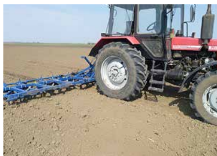
2. Пририхтоване з дерлячу