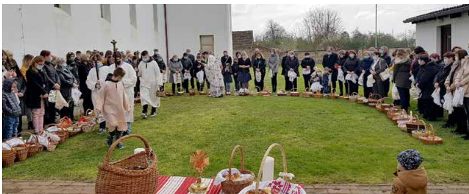
Швецене паски на Вельку ноц 2021. року

можливосц приступити и гу св. Тайни споведзи. Вечар служене саночне, а по першираз бул обход по ошвиценим церковним дворе. Потим була святочна пасхална утриня.