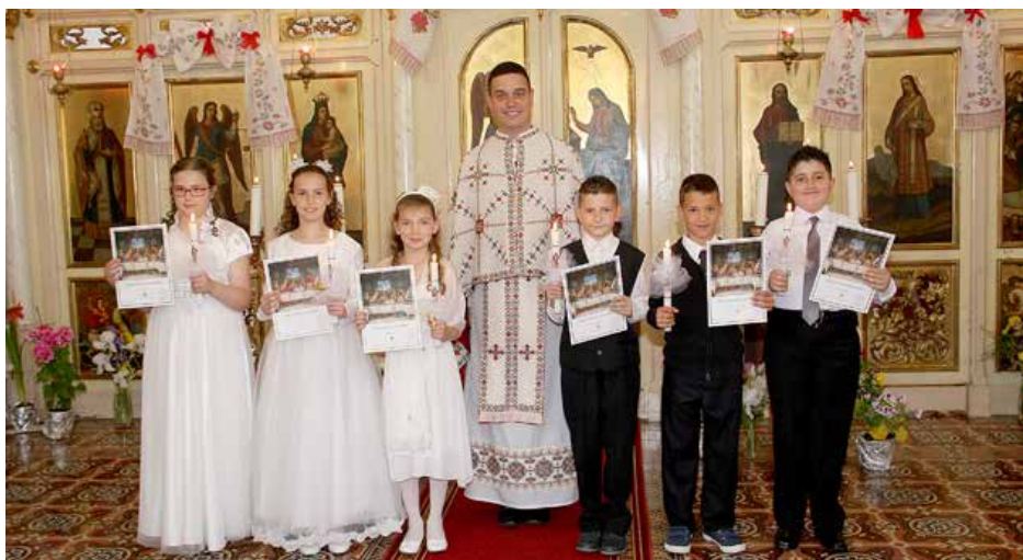
Перша причасц 2015. року