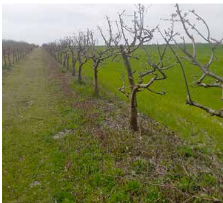
3. Яблоні на початку вегетациї

Зоз самим тим же хвиля донедавна була релативно подла за тоту часц рока, ані