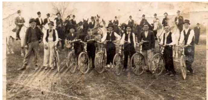
Перши бицигли у Миклошевцох

Бицигли ше и надалей розвивали, та так нешка маме вшеліяки модели, як цо городски бицигли (женски и хлопски), драгово бицигли зоз ценкима гумами, брегово бицигли моцнейшей конструкції и ВМХ менших колесох и єдиноставней конструкції. Иснук и други категорії на хтори ше бицигли можу дзеліц. На нашей старей фотографії у першим плане тиж видзиме бици-