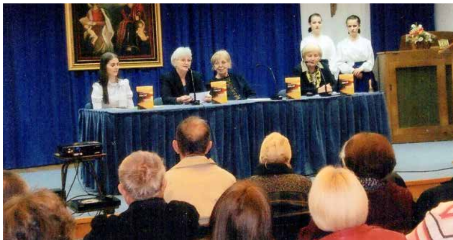
Промоция кнїжкї Писні загойсаного шерца у Пасторалним цєнтру Сяти Боно 2014. року