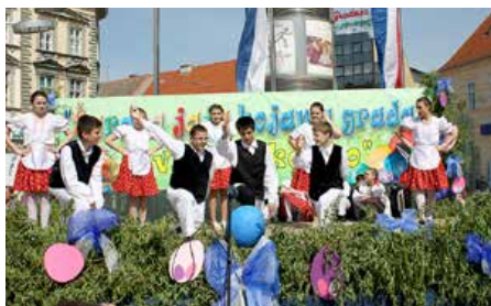
Миклошевски дзеци наступаю на манифестації Цифровани вайца у фарбох городу

манифестация почала важиц за цошка цо вредне видзиц, а була единствена у Горватскей.