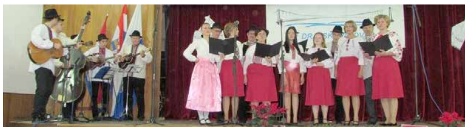
KUD Rusina Osijek

U vrijeme kad sam ja završavala studij, 2011. godine, ekonomska kriza je bila u punom jeku. Iako su psiholozi bili deficitarna struka, teško su se odobravala nova zapošljavanja u javnom sektoru, privatnici su također oklijevali zaposliti psihologe u svojim tvrtkama ako im nisu bili nužni i na posao se dugo čekalo. Tad je postojala mjera stručnog osposobljavanja bez zasnivanja radnog odnosa, temeljem koje sam ja stekla svoje prvo radno iskustvo, kao i mnogi mladi. Danas su se stvari promijenile. Psiholozi više nisu deficitarna struka, mnogo je mladih kolega bez posla. Ne postoji više ovakva mjera kakvu sam ja koristila, nego postoji mjera pripravništva, no broj potpora za pripravnike je vrlo ograničen. Ili se pak mora čekati na otvaranje radnog mjesta u nekoj instituciji, udruzi ili tvrtci. Stoga, ukoliko želite raditi isključivo kao psiholog, mogućnosti su vam ograničene. No, valja gledati šire od toga. Treba se pitati: „Što ja mogu raditi sa svojim znanjem usvojenim na studiju? Koje vještine i znanja mi trebaju da bih mogao/la raditi određeni posao?“ Današnja radna mjesta sve manje zahtijevaju određenu diplomu, a sve više specifična znanja ili vještine. Psiholozi se tako mogu zaposliti vještine kao odgojitelji u dječjim domovima, u marketinškim agencijama, u digitalnoj industriji itd. Ako ste malo kreativniji i ambiciozniji, možete si i sami stvoriti radno