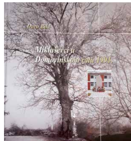
Насловни бок кнїжки „Миклошевци у Отечественей войны 1991.“