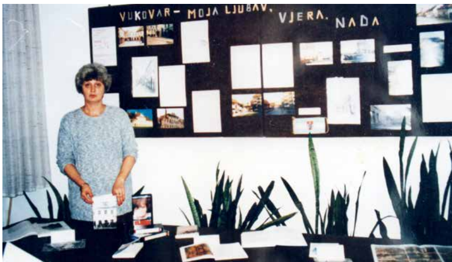
Вистава пошвєчена городу Вуковару 1996. року у Загребу

у истей школи сом за тоти годзини достала же бим водзєла библиотеку. Ту сом робєла по 1980. рок, а вєц сом пошла робиц до Борова Насєля. Там зме достали кварталъ и почала сом робиц у Основней школи „Братство и єдинство“, а преподавала сом горватски язык. По войну сом там робєла. Кєд пришла война мала сом уж двацєц єден рок роботного стажу.