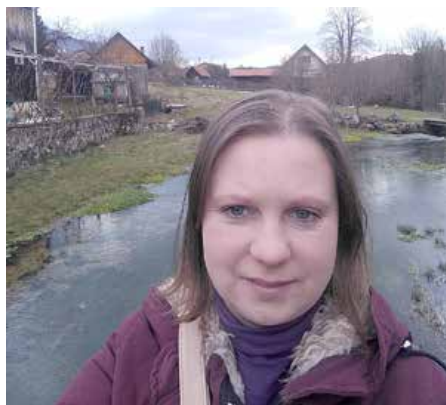
Izvori Gacke 2021.