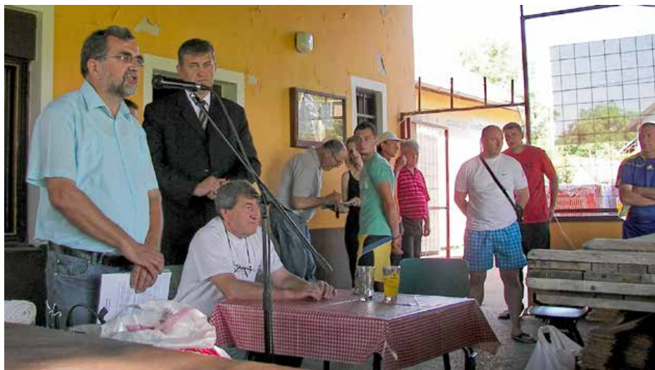
Под час отримованя Рутенияди 2013. року у Петровцох

Нашу роботу финансиуе жупания. Мама и плацену професийну секретарку, тиж плацену зоз жупанийских средствох. Не таки то вельки средства, але су до-