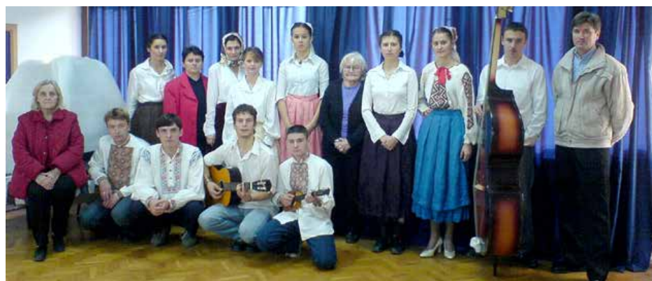
Зоз архиву Дружтва Руснак 2006. року - Члени управного одбору и форуму младих на наступу у Петровцох

З нагоди ей рочниці, и народзения и упокоеня, пре пандемию КОВИД-19, литературну часц онлайн порихта-