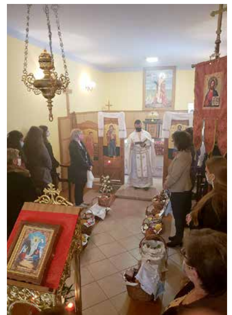
Blagoslov košarica s hranom

Najradosniji i najvažniji kršćanski blagdan Uskrs dočekali smo također kao i ostale dane pred Uskrs, sukladno epidemiološkim mjerama. 4. travnja 2021. uskršnja jutrenja i liturgija služeni su u 9:30 sati. Zatim je blagoslovljeno jelo, koje su župljani nosili svojim kućama blagovati zajedno s ukućanima i obitelji. Marija Zakaljuk