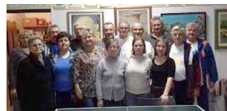
Na memorijalnom turniru Valdimir Timko u stolnom tenisu organizaciji KUD Rusina Osijek

Ovdje moramo najprije vidjeti što je razlog sve većoj učestalosti psihičkih teškoća u populaciji, osobito kod djece i adolescenata. Neki problemi mogu se uspješno prevenirati, ako im znamo uzrok. Psiholozi često organiziraju predavanja i radionice za javnost, u kojima se radi na specifičnim temama, kao što su tehnike opuštanja i smanjenja stresa, usvajanje zdravih životnih navika, kako razumjeti adolescente, o odgovornom roditeljstvu itd. Današnji način života je užurban, i djeca i odrasli imaju puno obveza te često nemaju vremena za provođenje kvalitetnog zajedničkog vremena. Događa se da sa svojim bližnjima više komuniciramo putem elektroničkih uređaja, a manje uživo. Slično je i druženje s vršnjacima. Djeca se sve manje igraju jedna s drugima, a sve više s uređajima. Gube priliku za razvoj raznih vještina i osobina ličnosti koje pruža igra s vršnjacima. U adolescenciji mogu imati poteškoća u definiranju sebe i svog životnog puta, odnosno s formiranjem vlastitog identiteta. Sve to doprinosi nastanku raznih teškoća i razvoju tjeskobe, usamljenosti, depresivnosti, brige za vlastitu budućnost itd. Na žalost, potresi koji su se dogodili prošle godine te pojava pandemije COVID-19 i svih mjera i pravila koja su uvedena s njezinom pojavom,