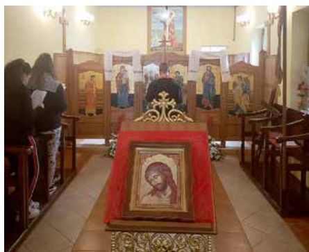
Večernja misa na Veliku subotu

Dan prije Uskrsa sa kojim završava vazmeno trodnevlje. Jeruzalemskom jutrenjom započeli smo obrede u župnoj crkvi. Nadgrobno povečerje i liturgija svetog Bazilija Velikog održani su u 18 sati, nakon čega je plaštanica prenesena na oltar.