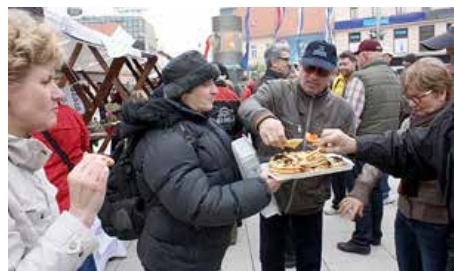
И сами зме коштовали цо зме направели

Збуване ношели национални меншини котри на штандох презентували своєю єдла у Вельким посце и за Вельку ноц, єдла ше могло коштовац бесплатно, а на бини ше вименьовали наступи дзецинских ансамблех националних меншинох. КУД Руснацох Осиек и Представителька рускей националней меншини Осецко-бараньскей жупанїї, вше до госцох поволовали єдно дзецинске фолкорне друство, з Петровцох, Миклошевцох лебо Вуковару, а дзекеди дали штанд и нашим етно секційом зоз других культурних друствох дзе етно секції исную. На початку, манифестацию провадзел и „квитни корзо“ у котрим переважно участвовали оводарци зоз осецких оводоц. Були пооблекани до маскох ярнього квеца и шпацирали ше по главней городской площі и улїчкох коло площі. Дзекеди их знало буц преїг 1000. Призор бул права потїха за очи, шицко пирщало од младосци и радосци, а дзеци-квитки розвешельовали присутних! Знали приходзиц и нащивителе з других местох бо