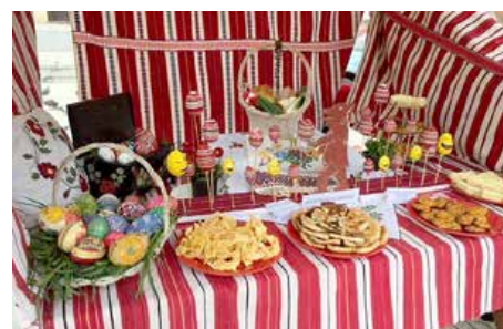
Штанд КУД Руснацох Осиек на манифестації Цифровани вайца у фарбох городу