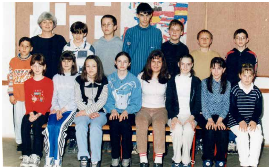
Зоз школярами ба класи 2000. року у Вуковаре