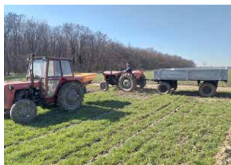
1. Прикармйоване ярцу