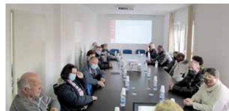
Члени Скупштини Союзу Русинох РГ

конструктивна и без вименкох и незадовольства членох, та после кратшей розправи члени Скупштини прилапени звити.