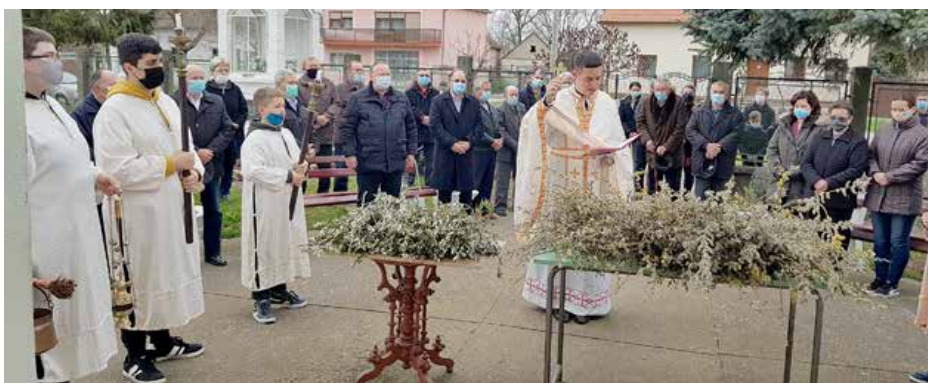
Благослов багніткы на Квитну недзелю 2021. року