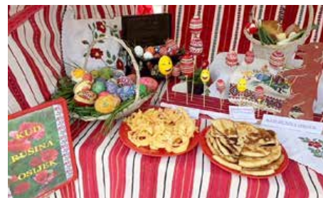
Специфични єдла хтори Руснаци рихтаю у рижних пригодах а єдна часц гевти хтори ше рихтаю за Вельку ноц