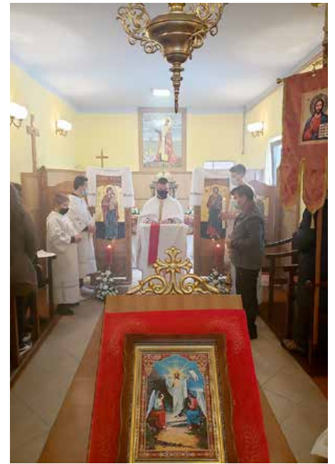
Uskršnja sveta misa

Najradosniji i najvažniji kršćanski blagdan Uskrs dočekali smo također kao i ostale dane pred Uskrs, sukladno epidemiološkim mjerama. 4. travnja 2021. uskršnja jutrenja i liturgija služeni su u 9:30 sati. Zatim je blagoslovljeno jelo, koje su župljani nosili svojim kućama blagovati zajedno s ukućanima i obitelji. Marija Zakaljuk