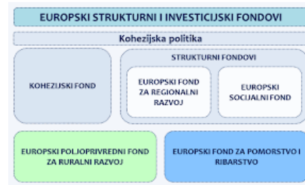
Shema ESI fondova

Osim ESI fondova postoje i drugi fondovi Europske unije, kao primjerice Fond solidarnosti Europske unije (EUSF) te instru-