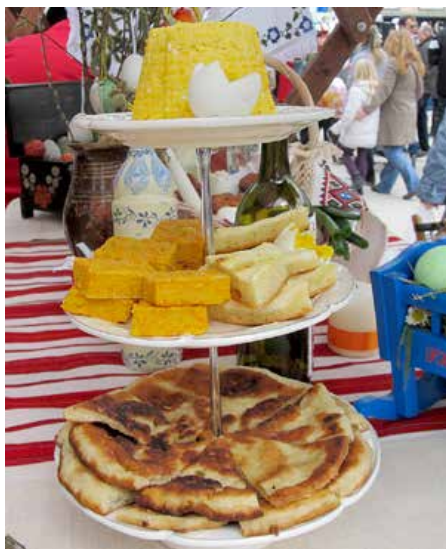
Штанд КУД Руснацох зоз нашима єдлами

Остатнї даскельо роки скорей пандемїї, окрем писанкох, на штандох ше могло найсц лакотки котри ше стрета на кирбайох, а ту и колачи лебо други продукти котри мож було купиц. Тиж було можливе купиц и рижни прикраски котри вецей припадаю саймом як манифестаційом яка тота дакеди була. Кед манифестация починала своєю традицию, шицко було понукнута на коштоване, без наплацованя. Теди то було дружене здруженьох