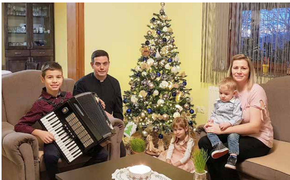
Священіческа фамелия Седлак на Крачун 2020. року