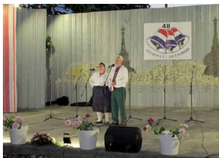
КД Русинох и Українцох ПГЖ Рушняк