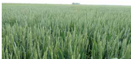
Жито у фази наліваня зарна

Рубрику започнеме зоз єдну од важнейших роботох хтора одробена концом априла и початком мая, а то садзене кукурици, слунечніку и сої хторе того року кус пожнело, понеже април не бул досц целпи и не исновали оптимальни условия за ключканє нашени у жеми. У векшини обисцох перше ше садзи кукурица, а вец слунечнік, хторому не треба тельо влаги же би зишол и рушел роснуц, а и кукурица ма длугши вегетацийни период. Идуца обовязка после садзени то защита од коровча, же би ше рошліни цо лепше розвивали у початкових фазах, бо коровче бере влагу и гной зоз жеми, а у случаю векшей закоровченосци бере и слункове шветло польопривредним културом. У векшини обисцох садзи ше зоз пневматским шаячками (сецерами), бо су прецизнейши як механічни. (Слика 1.