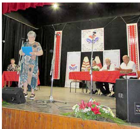
Реферат з нагоди 50. рочніці Новей думки