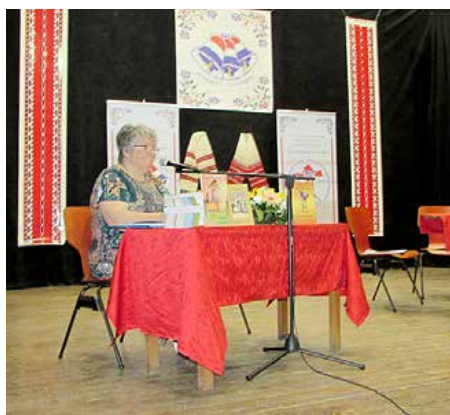
Промоція видавательства 2020. року