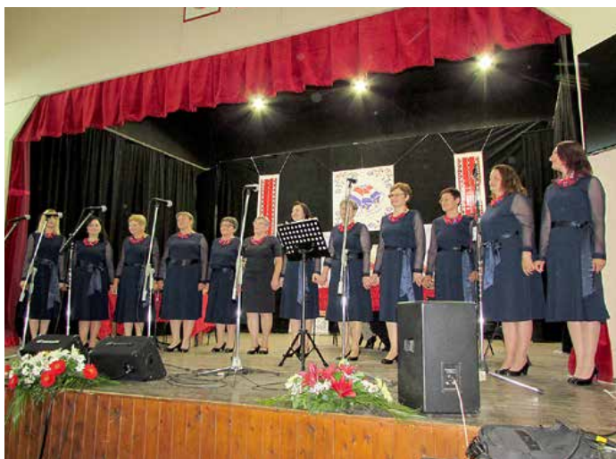
Женска шпивачка група КУД „Яким Говля“ Миклошевци