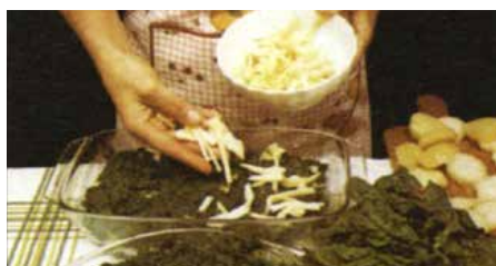
На шпинат положиц сир.