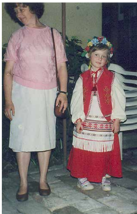
Od ranije dobi u rusinskoj nošnji

Kod nas u Osijeku zbog malog broja pripadnika rusinske zajednice nikad nije bilo organizirano učenje jezika u redovnoj nastavi, kao što je to u mjestima poput Petrovaca ili Mikluševaca. No, imali smo u više navrata organiziranu poduku iz jezika i kulture koju smo pohađali subotom. Sjećam se da je prvi put to bilo organizirano tijekom 1990-ih godina pod vodstvom učiteljice Cecilije Harhaj, u prostorijama koje je KUD imao na raspolaganju. Tada