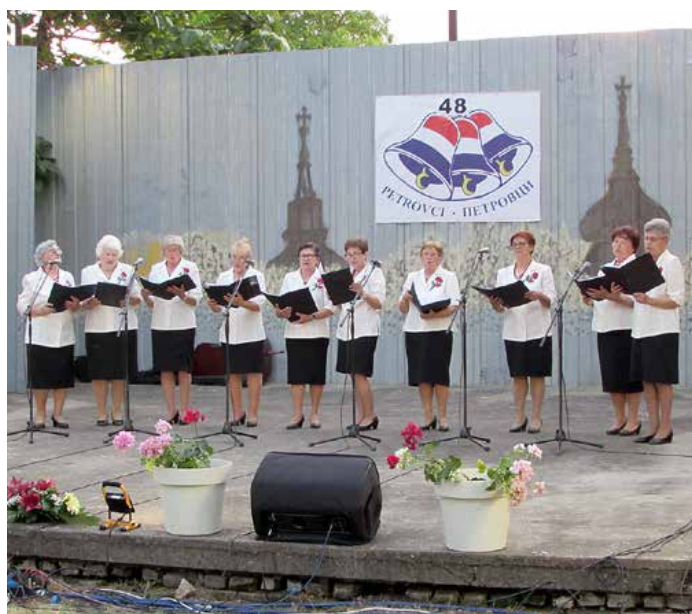
Здружене Мадярох, Вуковар