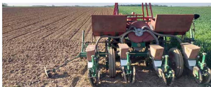
Пнеуматска шаячка у садзени кукурици

гнойом були и ділотворни. (Слика 2. Жито у фази наліваня зарна) У Петровцох 5. юния одробена работна акция ровнана хотарских дильовох же би ше оможлівел легчейши транспорт по хотаре. У акції поровнани драги котри ше найвецей хасную и котри були найпроблематичнейши, а парасты участвовали зоз розличними польопривредними машинами же би поровнали дильови и олегчали себе приступ польом. У акції участвовали и огоньгасци котри керчели древа и зароснути часци коло дильовох, бо дакеди зоз вельку механизацию, як цо комбаї, чежко преходзиц на ускей и зароснутей часци. На концу работней акції бул полудзенок у Ловарским дружтве дзе ше през бешеду плановало идуце ровнанє драгох. (Слика 3. Колона тракторох) Антун Гарди