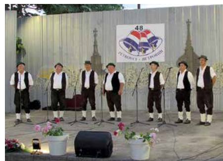
Горватске КУД „Весела Шокадија“ Гундинци