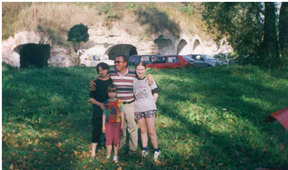
Obitelj Timko u Heleninom djetinjstvu

Koliko su fondovi privlačni za kulturne amaterske udruge nisam pretjerano upoznata, budući da osim sudjelovanja u radu u KUD-u Rusina Osijek nisam uključena u druge kulturne udruge i aktivnosti. Ono što znam da europski fondovi pružaju financiranje je kulturnih aktivnosti – organizacija određenih manifestacija, osobito međunarodnog tipa (kao recimo „Europska prijestolnica kulture“), međunarodno udruživanje kulturnih organizacija i sl. – kroz program „Kreativna Europa“. Osim toga, udruge se mogu prijaviti i na druge programe koje financira Europska unija, ovisno o ciljevima i vrsti projekta. Primjerice, Erasmus+ projekti, Twinning projekti, Europa za građane i sl. Također, ovisno o svojoj svrsi i djelatnosti, udruge se mogu prijaviti i na objavljene pozive za prijavu projekata u kojima je navedeno kakvi se projekti financiraju i tko se na njih može prijaviti. Udruga u kojoj određena aktivnost koja se financira nije definirana Statutom primjerice ne može se javiti na takav poziv. Stoga, udruge kako bi povećale