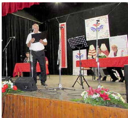
Поет Звонимир Барна