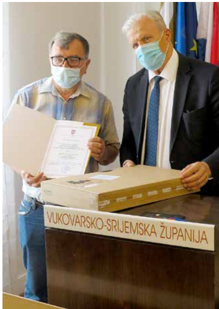
Додзельоване лаптопа рускей националней меншини ВСЖ