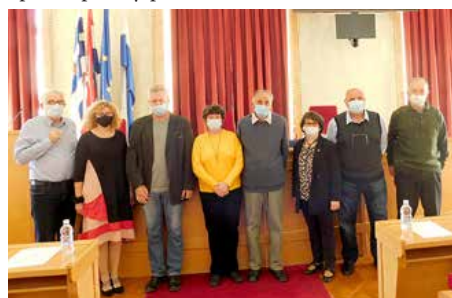
Учасніки 1. Конференциї о стану рускей заедниці у РГ