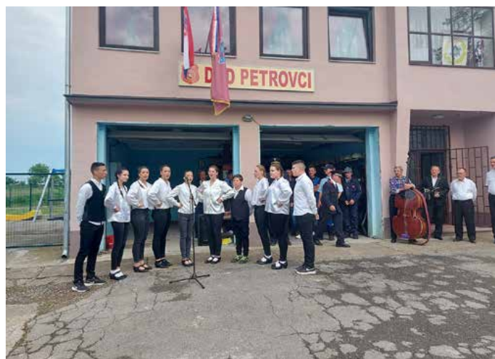
Члени шпивацкей групи Дружтва „Руснак“ з Петровцох, та Старих и Нових Янковцох