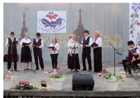
КУД Руснацох, Осиек