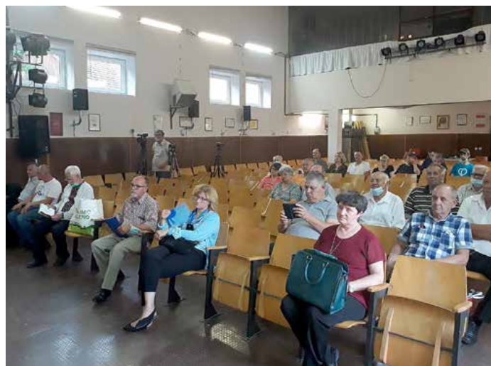
Публика у сали