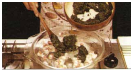
На маслу попражиц сланїну нарезану на коцочки и додац шпинат.