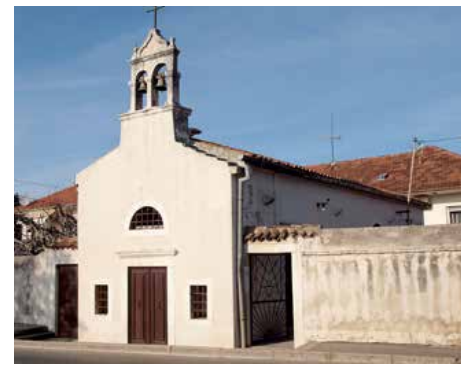
Церкав Св. Духа, Задар

На задарским подручу уж 190 роки у якимшик континуитету жию и нашо