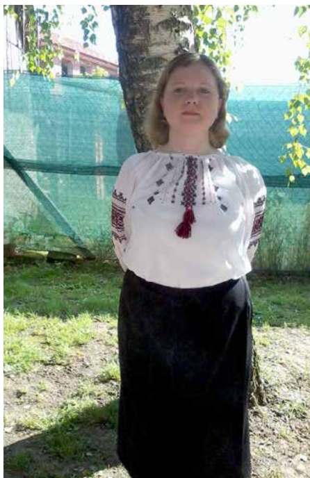
Petrovačko zvono, 2013. godine

Rekla bih da imam dosta hobija, no neki su trenutno ograničeni epidemiološkom situacijom. Volim putovati i jedva čekam mogućnost slobodnog kretanja po Europi, ne strahujući od zaraze ili karantene. Obišla sam većinu država srednje i jugoistočne Europe, a bila sam i u nekim državama na zapadu Europe, primjerice u Luksemburgu, Francuskoj, Nizozemskoj. Osim putovanja, volim sudjelovati u raznim projektima u lokalnoj zajednici, edukacijama koje organiziraju udruge, također i volontiram. Volontirala sam u nekoliko udruga, uglavnom u području socijalnih usluga – radila sam s djecom s poremećajima u ponašanju, odraslima s poremećajima vida i sluha, s djecom. Osim toga, posjećivala sam i volontirala na raznim festivalima i događanjima u Osijeku i okolici, kao primjerice „Zemlja bez granica“, Osječko ljeto kulture, gimnastički kup, pa čak i Svjetski kongres Rusina 2017. godine. Volim na neki način doprinijeti lokalnoj zajednici, osjećati se korisno, naučiti nešto novo, razviti vještine, a to mi sve omogućava volontiranje. Mnogim se ljudima volontiranje ne čini privlačnim jer za to nema nikakve novčane kompenzacije, no volontiranjem se puno toga dobije što novac ne može zamijeniti. U posljednjih godinu dana s volontiranjem sam malo stala, zbog epidemioloških uvjeta te sam se više posvetila uređenju doma i vrtlarstvu. Uzgajam svoje povrće, hehe. Osim toga, volim peći i kolače za svoje ukućane i isprobavati nove