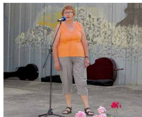
Солистка зоз Райового Села