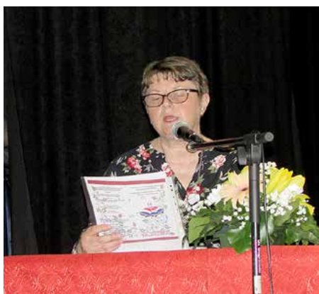
Поетеса Любица Гаргай