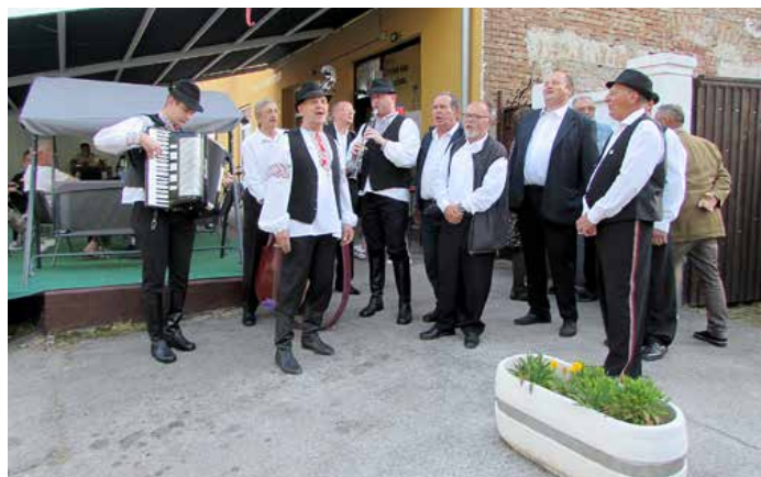
КУД „Осиф Костелник“ з Вуковару и КУД „Яким Гарди“ з Петровцох музично провадза рубане дрва