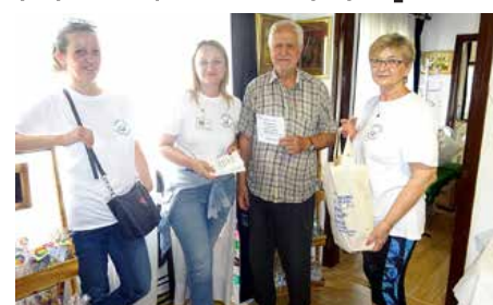
Припознанє и дарунок за участвоване

дзе мац виставу у їх просторе под час промоції кнїжки єдного мадырского автора.