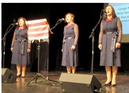
КУД „Яким Говля“ Миклошевци