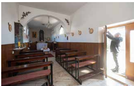
Нукашньосц церкви Св. Духа у Задру

Задар и парохії Далматинскей заґори У Далмації од давних часох було восточних християнох. Як скорей, так и по 1054. року у Задру и околїску исновали гречески заеднїци котри жили у заеднїцтву з Римским апостолским пристолом, а гу нїм ше часто причисльовали и славянски локални жителе восточного обряду. Вони мали порядни богослужєня и священїкох у шицких векших далматинских городох и островох.