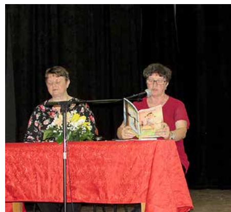
Поетеса Агнетка Балатинац