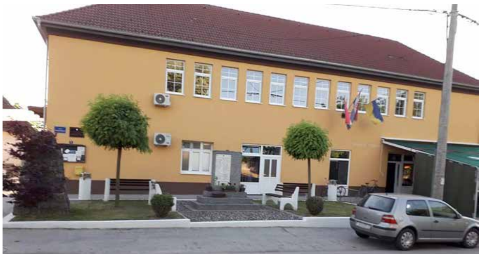
Чоло будинку Месного одбору