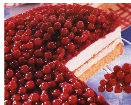
Торта готова, смачного!

5. Рибизли умийце, одцадце, очисце, поцукруйце и охабце най одстоя дас пол