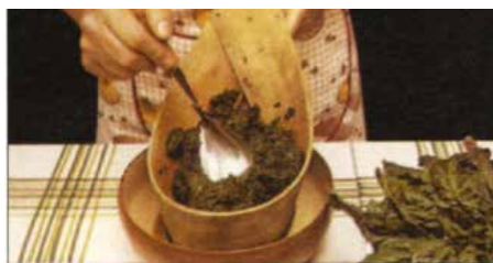
Увариц шпинат, добре го прецадиц и препасировац.

масла. Запечиц 20 минути у добре зогретеї рерни.