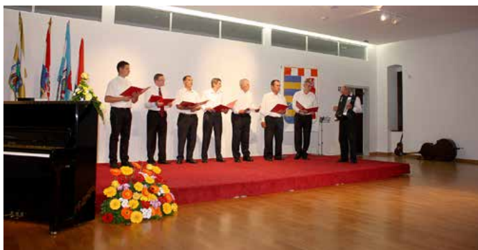
Зоз означованя Дня Руснацох у РГ 2015. року