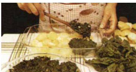
На кромплї положиц шпинат зоз сланїну. Поровнац.