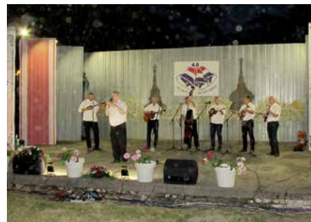
Горватске КУД „Лесаре“ Винковци