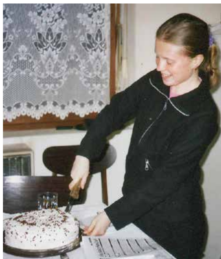
Sjećanje na jedan od rođendana

sam imala 8 godina i tada sam se prvi put na neki način susrela s organiziranim učenjem svog materinjeg jezika, a sjećam se i da sam u tim prostorima učila plesati naše tradicionalne plesove. Mislim da je to trajalo samo tu jednu godinu. Nakon toga smo mogli formalno učiti jezik jedino na ljetnim školama, koje smo uglavnom pohađali svake godine. Na njima smo učili o svom jeziku, povijesti, tradiciji, sjećam se da sam učila i tehniku vezenja. U slobodno vrijeme smo se družili, igrali, a kad su ljetne škole bile organizirane na moru, i kupali smo se. Sjećam se da nas je tad bilo puno na tim ljetnim školama, preko stotinu, no s nama su ih pohađali i Ukrajinci koji su učili svoj jezik i kulturu. No, to su samo sporadične aktivnosti učenja materinjeg jezika u kojima je upitno koliko od toga djeca zaista usvoje i zadrže. Što nas ponovno vraća na obitelj i njezinu važnost u učenju jezika i prenošenju tradicije.