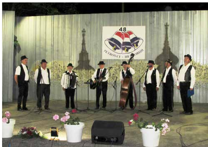
КУД „Яким Гарди“ Петровци