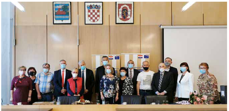
Заедніцка фотография меншинских представителейох у ВСЖ