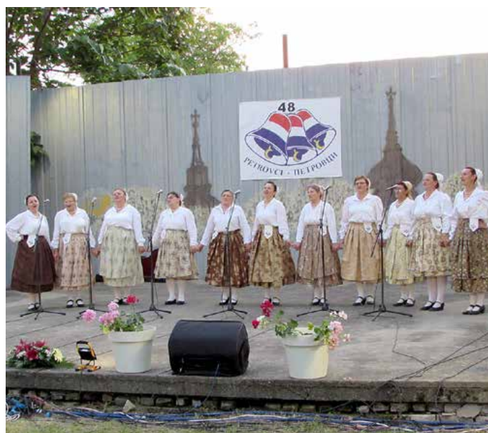
КУД „Яким Говля“ Миклошевци