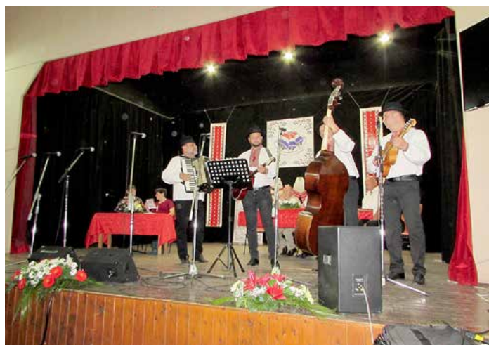
КД Руснацох Цвелферіі, Райово Село