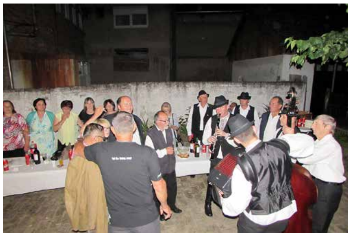
Вешеле у дворе Етнографскей збирки