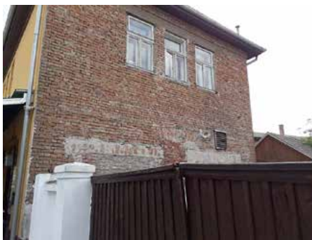
Бочни випатрунок будинку Месного одбору