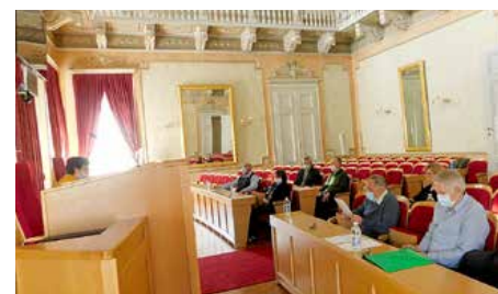
Представителе поволаних институцийох на Конференциї о стану рускей заедниці у РГ