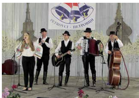
КУД „Осиф Костелник“ Вуковар