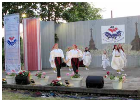
Бошнячке КУД „Лілян“ Райово Село