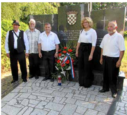
Покладане венцох при Памятнику погинутим бранителюм и цивилним жертвом у Отечественей войны на петровским грекокатолицким теметове