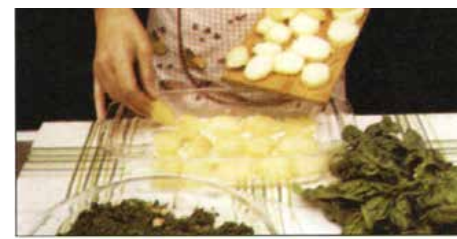
Тепшичку намастиц з маслом. Усапац дакус млека и наскладац шор кромплї.