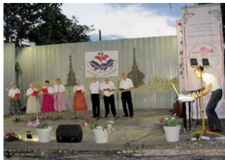
КУД Русинох Винковци