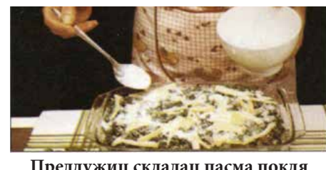
Предлужиц складац пасма покля ше не потроша шицки сстойки. Закончиц зоз сиром и пармезаном.