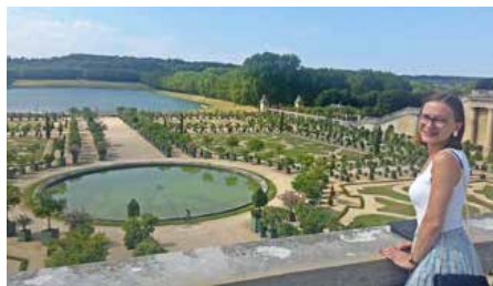
У паркох Версаю

тримали ведно. Шицко зме порихтали и вивежбали, научели як треба, цо треба. Пришли зме на факултет зоз трему бо вас на тей годзини патра дас дзешецеро студенти, патри вас ваш професор-ментор, патра вас учителька и дзеци. Було стресно з того боку бо ше од нас обчековало же би було шицко добре и же прейдземе. Було ту и дакус страху чи шицко випадне добре и чи ше не случа даяки непредвидзени ситуацији. Але шицко добре прешло. Познейше було вше легчеше и легчеше.