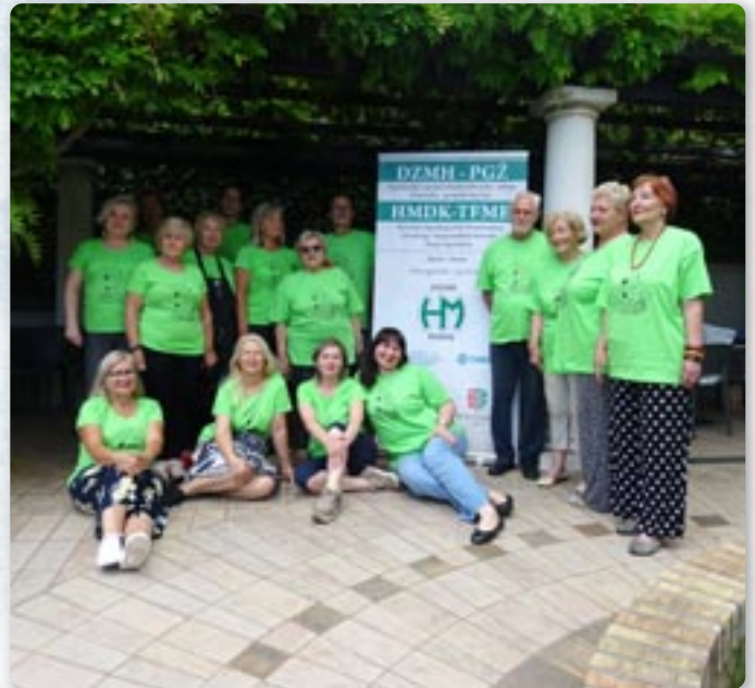
Учашніки подобовой колонії національних меншинох у Риєки