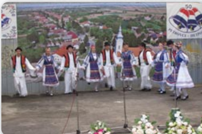
Танец Куцкуруши КУД Яким Гарди Петровци