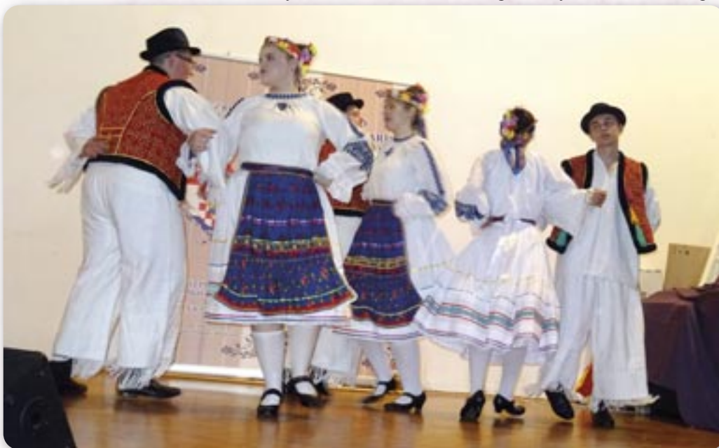
Руски танци на Трсату

Концерт националних меншинох у Доме Козала позберал пейц национални меншини: КУД „Яким Гарди“ мал 4 наступи зоз руским репертоаром, а наступели ище Бошняцка национална заеднїца Риєка, хор вибеженцох з України „Червона калїна“, горватски ансамбл „Приморски Горват“ и КД Рушняк ПГЖ. Шицки дали найкраще цо мали, а КУД „Яким Гарди“ брилїрал. Їх танци предста-