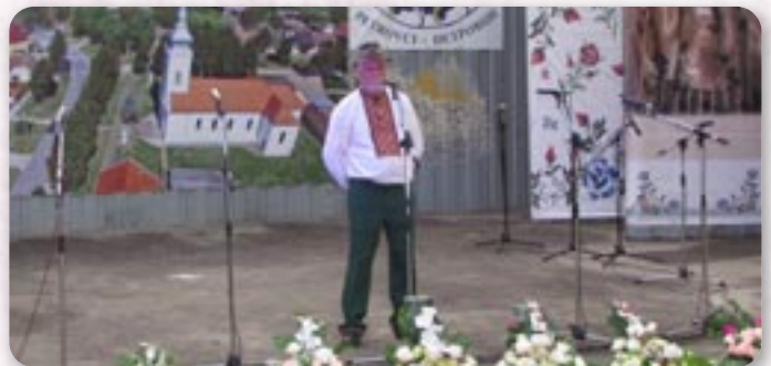
КД Рушняк ПГЖ