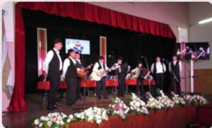
Петровска хлопска шпивачка група

зени 1959. року у Петровцох. Ту закончел и основну школу, а потим интерни курс за боровского роботніка, дзе бул и заняти. Дроворези почина вирабяц зоз гобию 1996. року, а то тирва и по нешкайши дні. Потераз направел коло 30 слики хтори подзелени до вецей групох, як цо амблеми, римски пенєж, та валалски, лесово и церковни мотиви. Мал вецей самостойни вистави у Петровцох и Миклошевцох. Виставу отворела председателька Союзу Дуб-