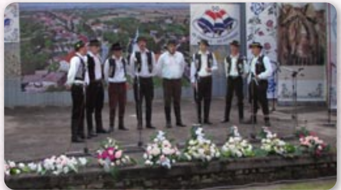
КУД Йосип Ловретич Оток