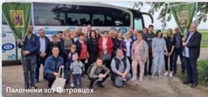
Паломніки зоз Петровцях

З нагоди 170. Завитного дня и 200. рочніци од остатніх Марийових указаньох у Водици, грекокатоліки наших сримских парохийох и того року на Треци дзєнь Русадльох/швета Сошествия Св. Духа у красним числу ишли на паломніцтво до Марийового святиліща при Руским Керестуре. Того року треци дзєнь швета, 30. май, у Горватской бул источносно и Дзєнь державносци, та ше так пре нероботни дзєнь витворєла можлівосц организовано, на автобусу, пойсц до Водици.