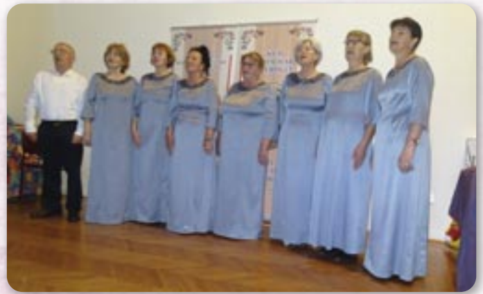
Хор Бошняцкей националней меншини зоз Риєки