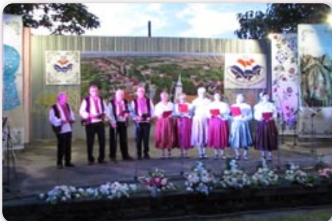
КУД Русинох Винковци