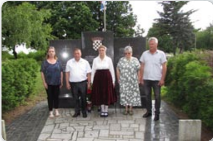
Покладанє венцох на петровским грекокатолицким теметове при памятніку жертвох у Отечественной войны

„Петровски дзвон“, централна манифестация Руснацох Републики Горватскей, отримани 9. и 10. юния у амфитеатру у Петровцох, а дожил свойо 50. юбилейне отримоване. Шицке богатство и краса руских обичајох, културного скарбу, фолклору, народней творчосци Руснацох и шицко зок чим ше Руснаци