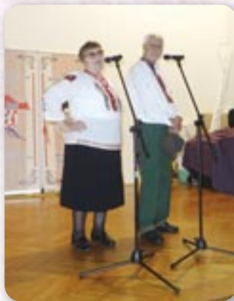
КД Рушняк ПГЖ