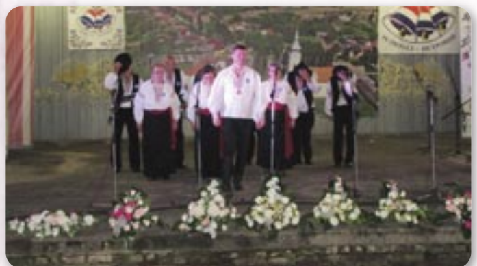
КУД Осиф Костелник, Вуковар