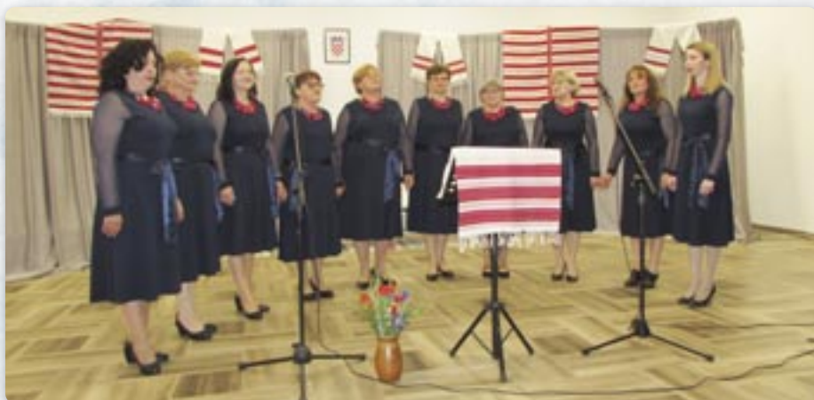
Женска шпивацка група КУД Яким Говля

Руснаци у РГ за преславу свойого дня вибрали 25. май як здогадоване на найстарши запис у церковних матрикюлох, дзе зазначене же 25. мая 1836.