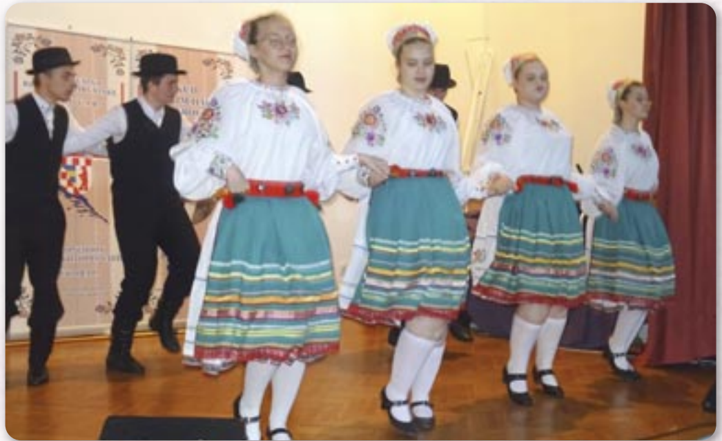
КУД „Яким Гарди“ у доме Козала у Риєки

Шлїдуючих дньох отворени пейц подобово вистави членох Подобовой секциї у вецей галерийох. У Опатїї, у галерїї „Тик так“, од 9. по 20. май викладали рижни авторе. Од 10. по 23. май у „Руским обисцу“ у Матульох тиж викладали рижних авторе, а у галерїї „Приморска понештрица“ у Матульох од 10. по 25. май виложени работи остатнїх 5 рокох работи Подобовой колонїї хтори ше отримовали у Матульох, а познейше у Риєки на Концерту, у сали Дома Козала од 12. мая по тераз отворена вистава. У просторе „Базо-