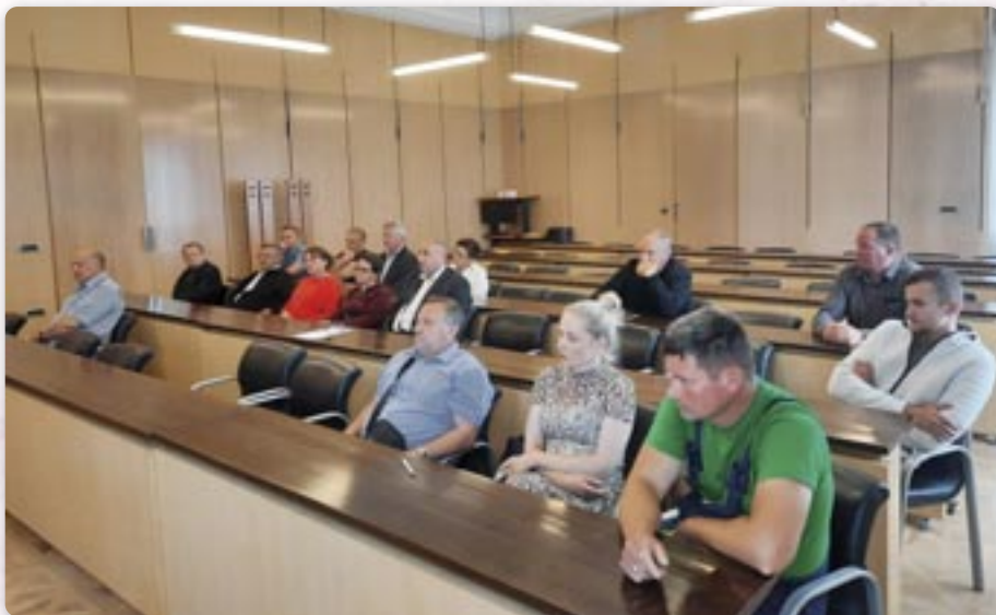
Виборна схадзка у Вуковаре у просторе жупаниї

и представительох национальных меншинох и после отриманих виберанкох 7. мая того року принесло и обявело одлуку о конечних резултатох вибору членох Ради рускей национальной меншини у Вуковарско-сримскей жупаниї, при чим розпорядок направени на основи достатих гласох.