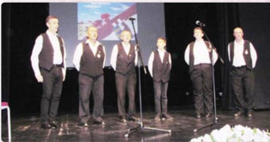
КУД Яким Гарди