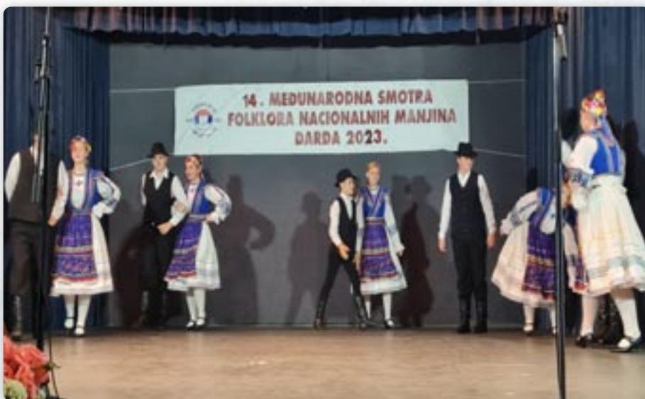
Танечніки КУД „Яким Гарди“ на бини у Дарди