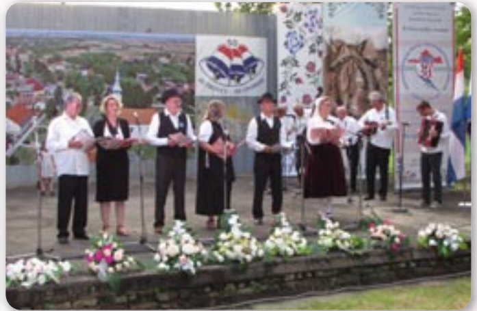
КУД Руснацох Осієк

представел и як вокални солиста петровского Дружтва зоз писню „Мне не жаль“, а танечна пара одтанцовала танец „Свадзєбни“.