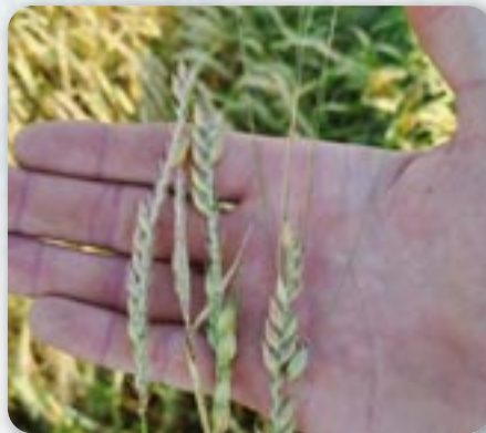
Ярец после ляду и побити класки

Подлому урожаю ярцу погодовали константни дижджи кед ше случовало же чим ше осушели дораз и змокли през одредзени период, цо спричинело же гектолитер ярцу просеково менши 10% од прешлого року котри бул сушни. Велькей чкоди нанесол и ляд котри не пографел цали хотар, а найвекши чкоди указали ше на житу и ярцу хтори були пред дозреваньом, док ше кукурица и слунечнік вишулькали, бо чкода була лем на маси лісца. У даедних часцох над хторима прешла лядова хмара на ярцох настала чкода коло 30%.