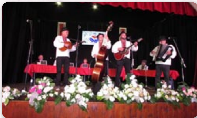
Наступ КД Русинок Цвелферії зоз Райового Села

У другей часци вечара наступели госци зоз Словацкей, фолклорни ансамбл „Видуманец“ зоз места Кужмице, хторе ше находзи 40 км од Кошицох. На комични способ