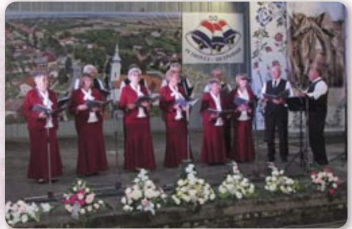
КУД Ади Ендре, Кородь