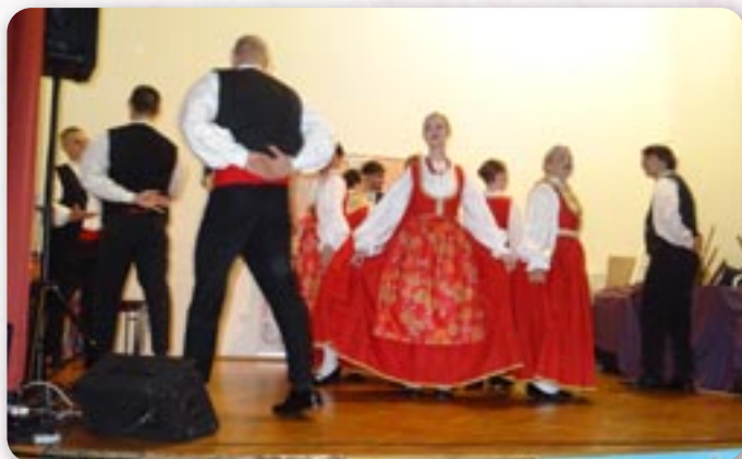
Ансамбл украинских вибеженцох зоз Риєки Червона калїна