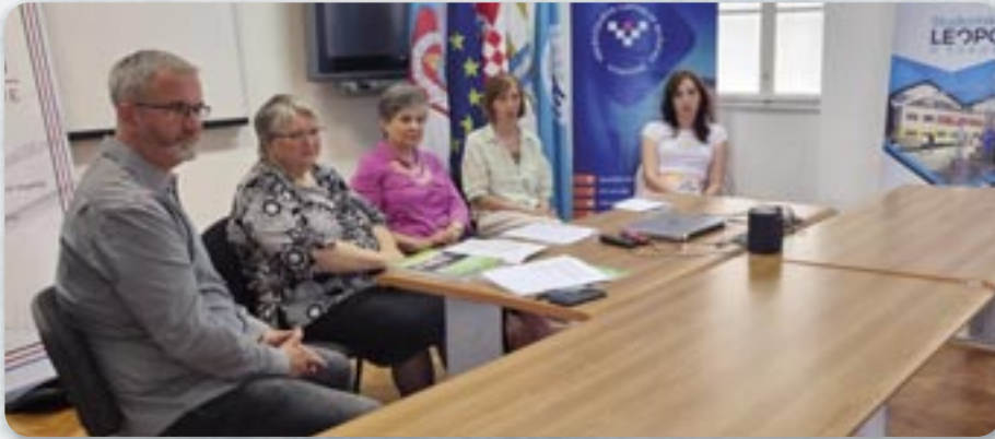
Учасніки Пленуму о меншинским информованю

Штварти по шоре Медийни фестивал по назву „Media in time festival” отримани 16. и 17. юния у Винковцох и Вуковаре, а у организацији Центра за культуру медийох и партнерох – Горватского новинарскогo дружтва и Академији за уметносц и культуру у Осиеку. Пяток, 16. юния, у Винковцох додзелени награди за локалне новинарство хтори додзелюе Горватске новинарске дружтво и отримана панел розправа на тему „Новинарски фотографове – професия хтора вимера.“