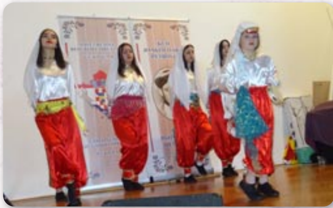
Танци Бошнякох зоз Риєки