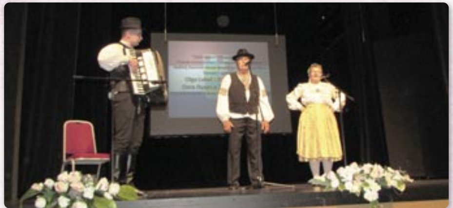
КУД Осиф Костелник

Скорей Шветочней академії при Крижу на уліву Вуки до Дунаю, положени венец и запалена швичка за погинутих бранітельох и цивилох у Отечественей войны, а у голу Гор-