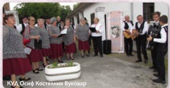
КУД Осиф Костелник Вуковар

организацию того збуваня на себе пребера КУД „Яким Гарди“ Петровци. У програми участвовали оркестер и Хлопска шпивацка група КУД „Яким Гарди“, як и КУД „Осиф Костелник“ зоз Вуковару, а представели ше зоз рускима народнима пиянями.