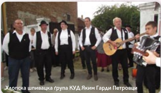
Хлопска шпивацка група КУД Яким Гарди Петровци

Тогорочне валяне майского древа отримане под покровительством Совету за национални меншини Републики Горватскей и Союзу Русинох Републики Горватскей, а з нагоди означованя 50. манифестациі култури Русинох Републики Горватскей „Пет-