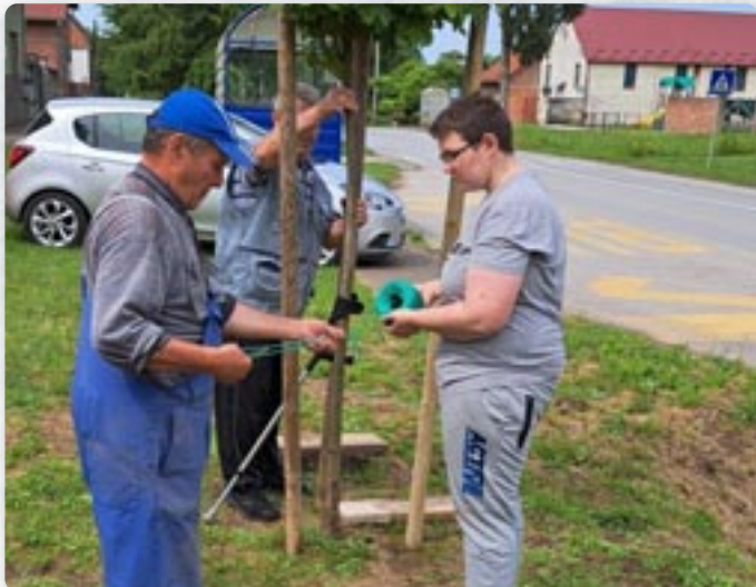
Роботна акція Церковного одбору

Церковний одбор грекокатоліцької парохії Покрову пресв. Богородици у Петровцях вже глашел як еден од активнейших церковних одборох у нашей церковней стварносци. Порядни схадзки на мешачним уровню, записніки, активна учасц у каждодньовим креированю живота парохії ведно з парохом не лем одгук прешлосци з даяких златних часох, але и терашня реалносц петровської грекокатоліцької духовней єдинки.