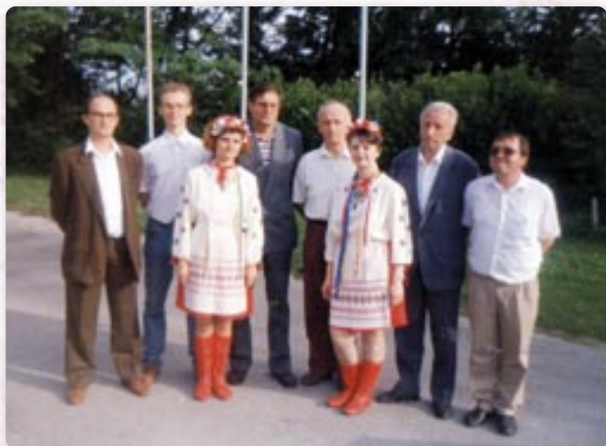
Наступ КПД Русинох и Українцох Осиек у Липовлянох 1994. року