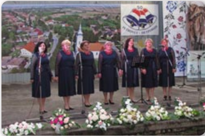
Женска шпивацка група КУД Яким Говля Миклошевци