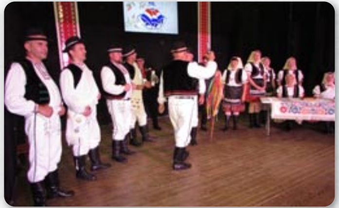
Фолклорни ансамбл «Видуманец» - Кужмице Словацка

виведли свадзбени обичај одходу приданцох до непознатого краю, а вец одшпивали векше число шпиванкох зок