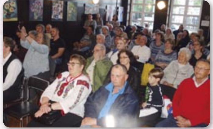
Нащивителе концерту у Риєки