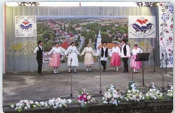
Руски народни танци у виводженю КУД Яким Говля зоз Миклошевцох