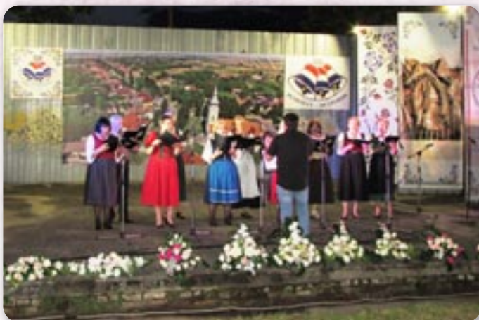
Здружене Немцох и Австриянцох Вуковар