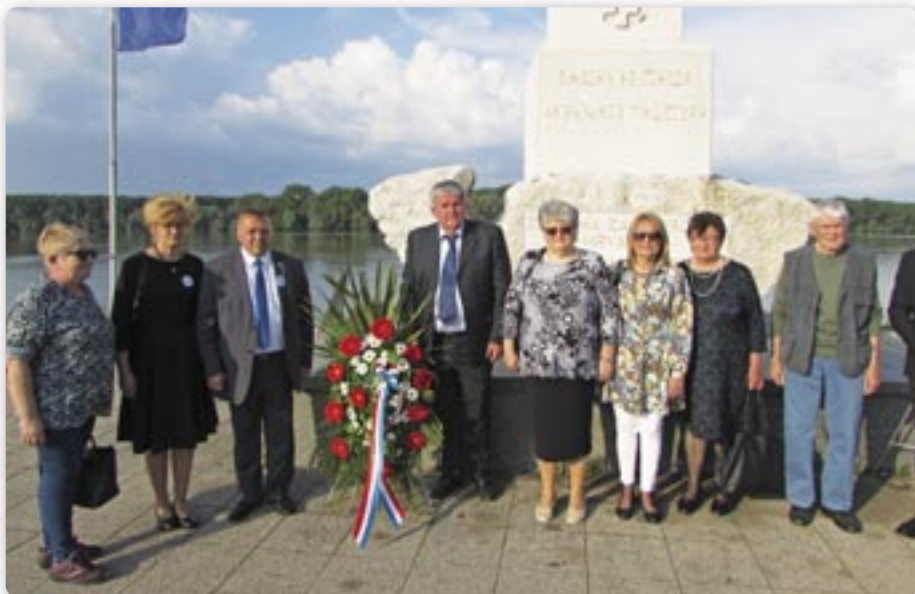
Покладанє венцох при памятніку на улїву Вуки до Дунаю