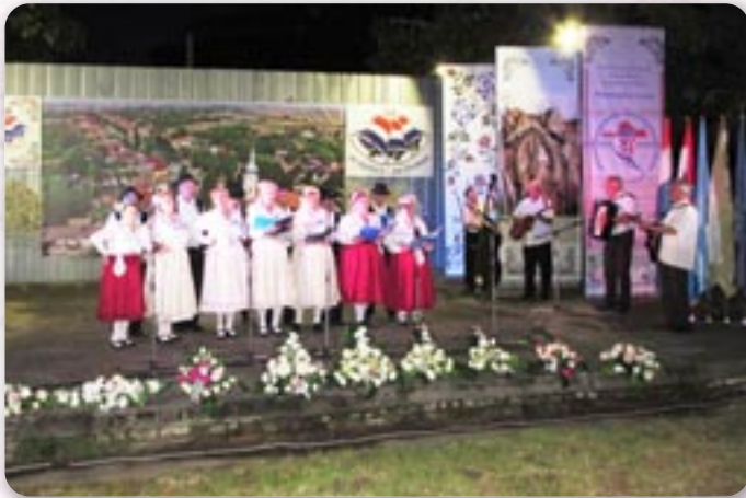
КУД Дюра Киш, Шид