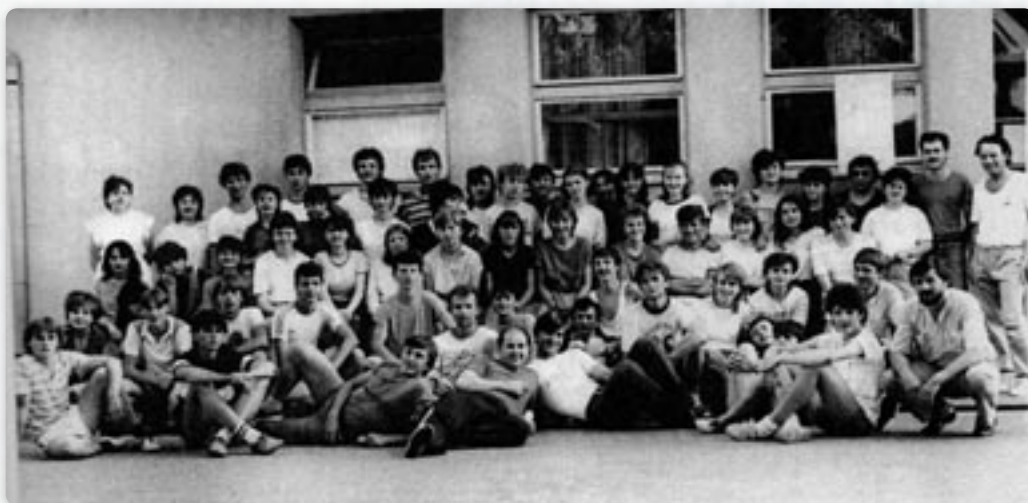
Учашніки семинару за младеж у Ердуту 1984. року

Рок 1988. цали бул и знаку означованя 20-рочнї-