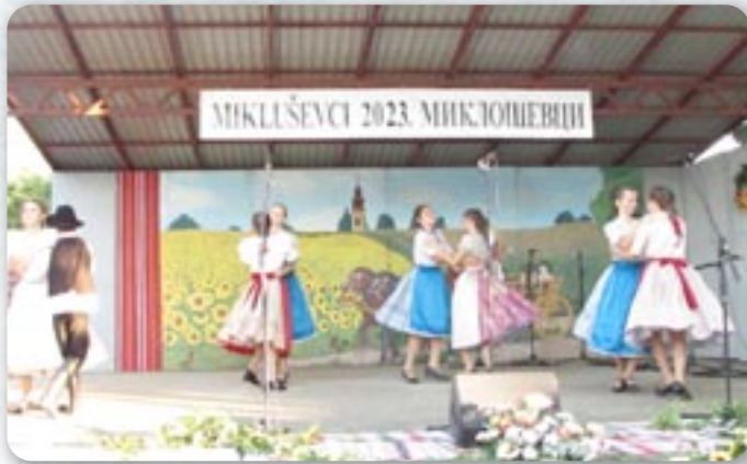
КУД Петефи Шандор Ласлово