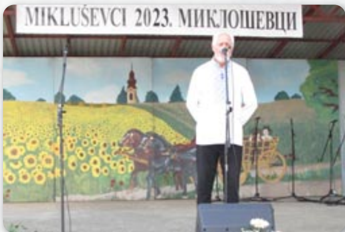
КД Рушняк Риека

Традиційна смотра фолклору под назву Поздрав ровніни отримана всоботу, 2. септембра, на отвореней бини. Скорей програми члени дружтва, представніки Општини и числени Миклошевчане з покладаньом венца и паленьом швичкох опрез памятніка у центру Миклошевцох дали чесц шицким страдалим у Отечестваей войны.