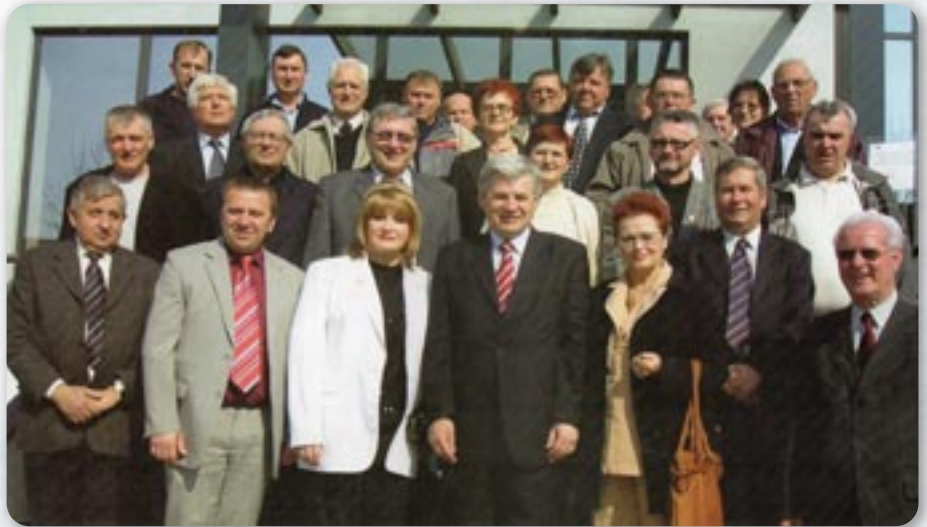
Делегати на рочней схадзки Союзу 2007. року

Початком марца 2003. року зоз вуковарского КУД „Осиф Костелник“ вишло векше число членох украинскеј национальной меншини и основали свой