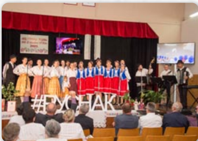
Дружтво Руснак и госци зоз Румунії

Под покровительством Совету за национални меншини РГ, а у организацији Дружтва «Руснак», од 22. по 24. септембер у Петровцох и Старих Янковцох отримана културна манифестација медзинародного характера «Кед голубица лещела». На истей означени три юбилеї – 220 роки од народзєня русинского просвितителя, будителя националней свідомосци Карпато-Русинох и автора рускей гимни «Я Русин был, есмь и буду» Александра Духновича, 100 роки рускей Граматики бачванско-рускей бешеди Гавриїла Костельника та 20 роки роботи и активносци здружєня «Руснак» Дружтва Руснацох у РГ зоз шедзиском у Петровцох.