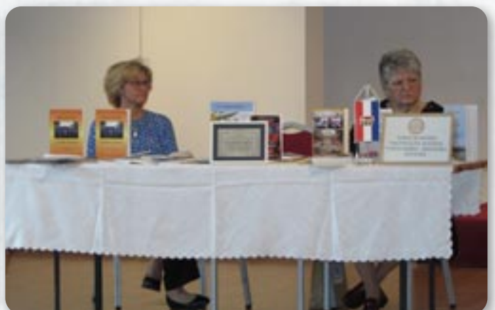
Нови кніжки Союзу Русинох РГ на САКНАМ-у