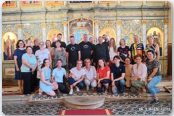
Križevački i mikluševački zbor

Nedjelju nakon kirbaja 10.09. našu župu posjetio je i katedralni zbor iz Križevaca sa svećenicima i đakonom te su svojim pjevanjem uzveličali slavljenje sv. liturgije. Naša župna zajednica navikla je dugi