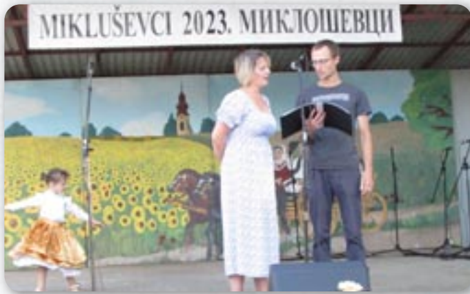
КУД Руснацох Осиек