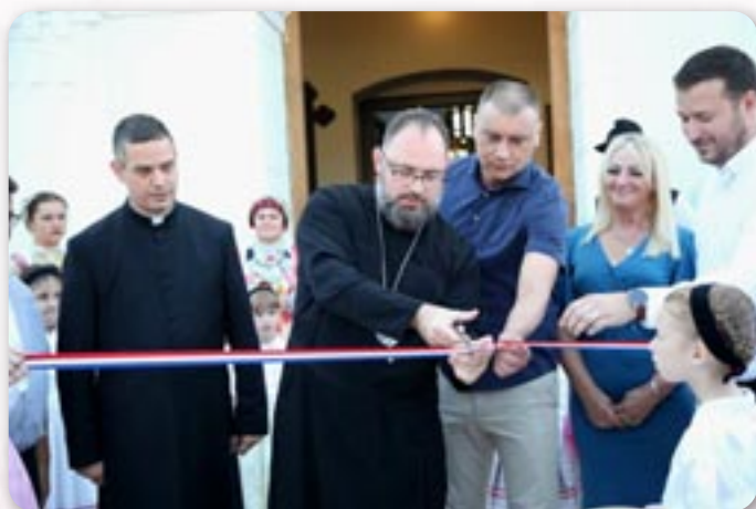
Владика, под'жупан, началник Општини Богдановци, председателка валалу и петровски парох отвераю нову площу опрез церкви

Зоз торжествену архиерейску Службу Божу, всоботу 9. септембра у Петровцох преславена 130. рочница од будованя и пошвещаня нешкайшей грекокатоліцкей церкви Покрову Пресвятей Богородици. То тиж и найстарши грекокатоліцки храм у Славонско-сримским викаријату Крижевскей епархиї. Тото богослужене було источашне и благодарене за успишно окончену обнову вонкашньосци церкви. Пред Службу Божу тиж отворени и нови дражки и площа пред церкву котри витворени преїл проекту при Министерству регионалног розвою и фон-