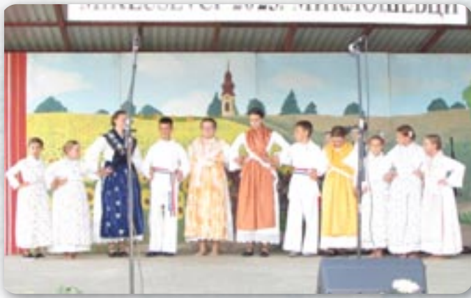
КУД Младосц Водінци