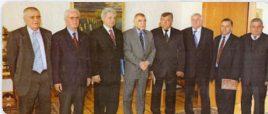
Представителе Союзу зоз председателюм держави Степаном Месичом