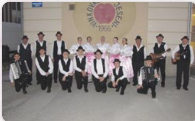
Памятка на Винковски єшені 2023.

зоз Петровцох, а єдине руске дружтво котре порядно наступа на тей манифестациї.