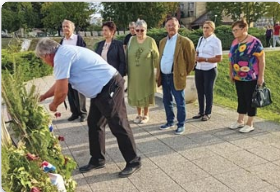
Покладанє венца за погинутих бранїтельох