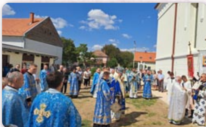
Обход коло церкви

Зоз крижевским владиком кир Миланом Стипи-