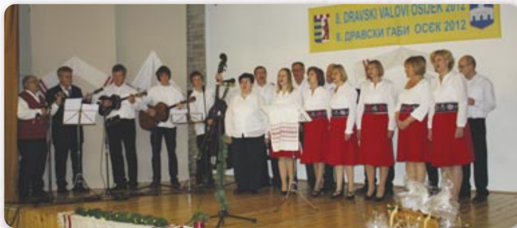
8. Дравски габи - КУД Руснацох Осиек

Але и попрѣ шицкогo того, ниа, КУД Руснацох