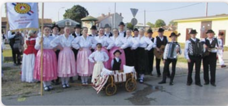
Учасніки святкового дефілеу на Єшенях, члени КУД Яким Гарди Петровци

Винковски єшені постали популярно-наукови сход жридлової культури котри вишли зоз души наших людзох, вони чуваре кедишнього валала, звичайох и писньох, вони указую слики прешлосци и терашньосци, упуцуюци на невидгледани напрями и можлівосци у будучносци.