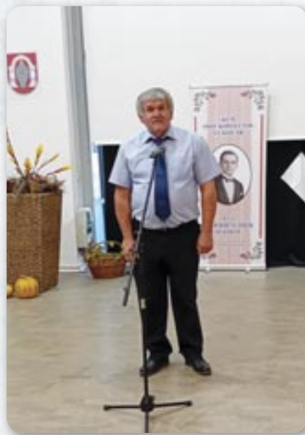
Предсидатель Мирко Дорокази вита госцох