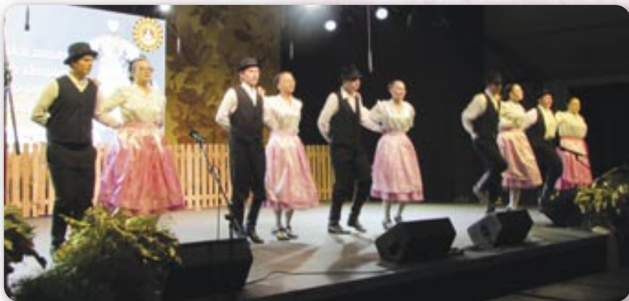
Венчик руских народних танцох на Винковских єшенях

Винковски єшені почали 8. септембра зоз манифестацию „Фолклорни вечари“, на котрих ше представели понад пейдзешат фолклорни ансамбли зоз Вуковарско-сримскей жупанії и иножемства. Медзи теліма учасніками наступело и нашо Культурно-уметніцке дружтво „Яким Гарди“