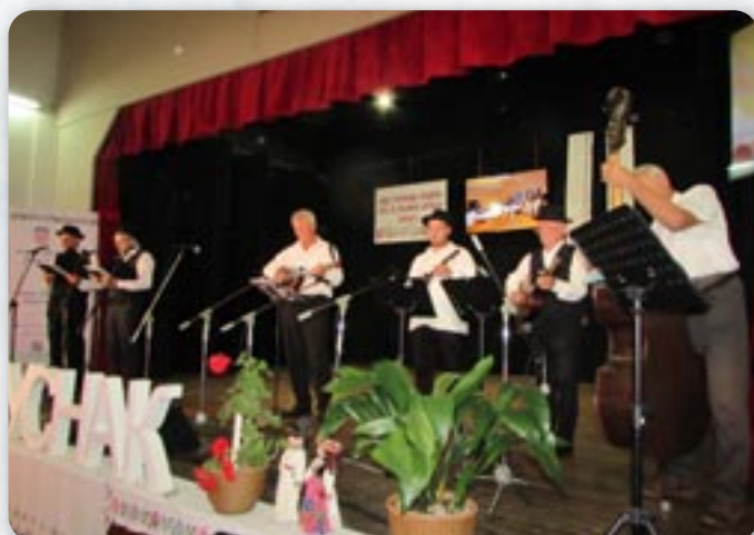
КУД Руснацох Осиек