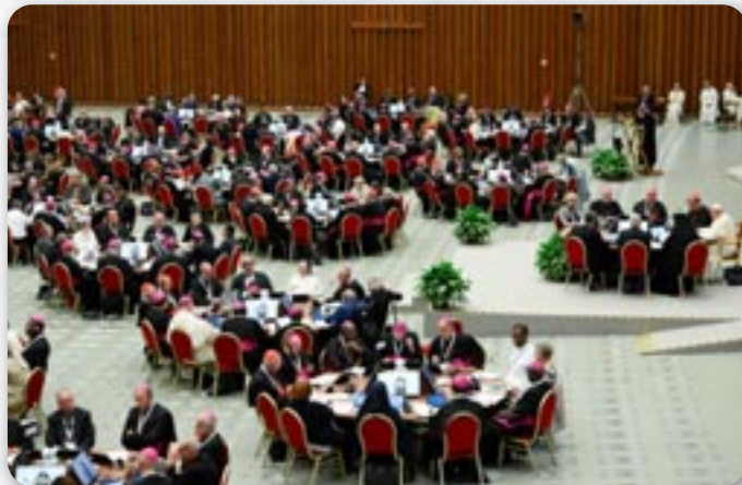
Синода у Риме 2023, округли столи наместо лавкох у сали виражаю потребу вецей дискусийох и медзисобней бешеди

На тим шлїду цо то природне, а цо штучне и питане прилапйованя рижних полних ориентацийох. Окрене актуална тема то питане gap культури котра присутна и у наших дружтвох и у наших штрєдкох. Церква нас учи почитовац каждого человека. Прилапиц го у цалосци и не етикетовац як особу. Але праве прето же нет прешвеченосци же то природни човечески стан, Церква и далей учи и гутори же ше таки особи не можу