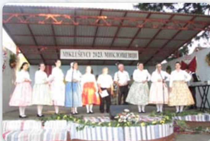
КУД Жатва Коцур