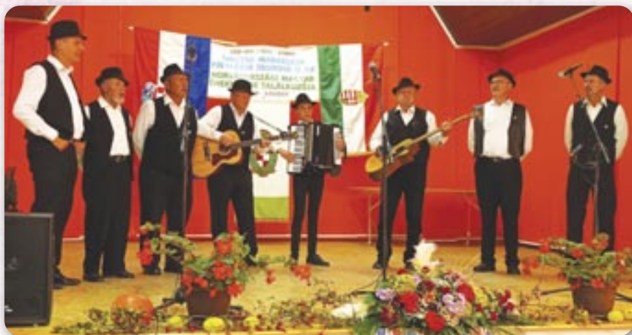
Наступ хлопскей шпивацкей групи