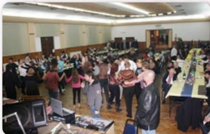
9. Дравски габи - дружене

У ревиалней часци Дравских габох практиковало ше наступ єдного фолклорного ансамблю. Најчастейше то були фолклорни ансамбли наших најстарших дружтвох зоз Петровцох, Миклошевцох и Вуковару.