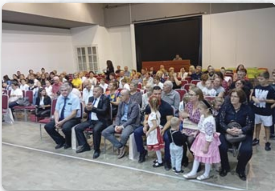
Публика на Першим аплаузу