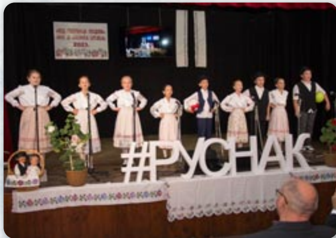
Младежки хор Дружтва Руснак Голубки

ботову культурну програму манифестациі возвелічал и отворел председател Совету за национални меншини РГ