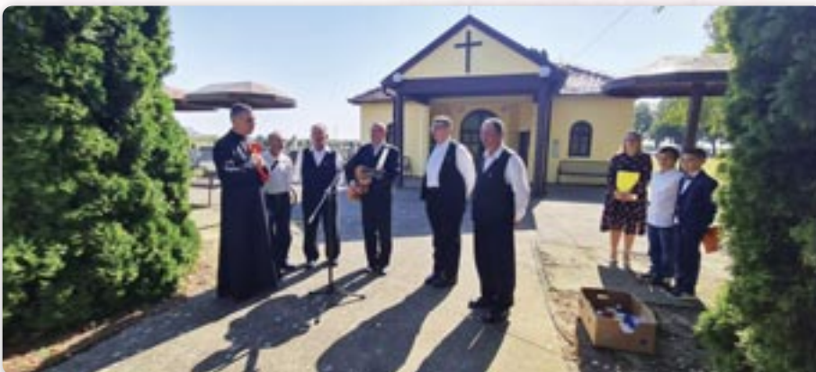
Хлопска шпивацка група КУД Яким Гарди опрез памятник на грекокатолицким теметове