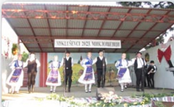
КУД Яким Гарди Петровци