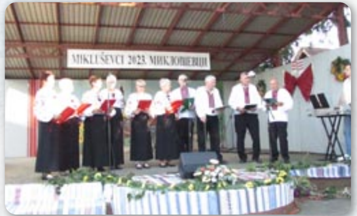
КД Русиных Винковци