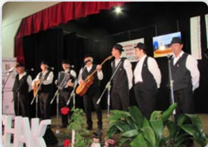
КУД Яким Гарди Петровци