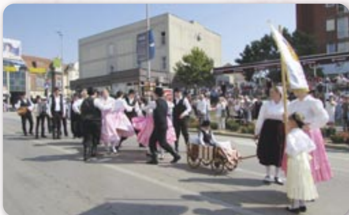
На винковскей Єшеньскей плоци