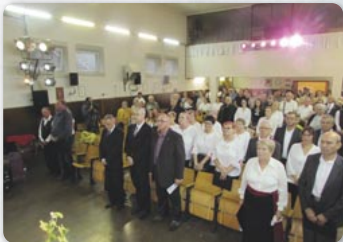
Публика на Голубици