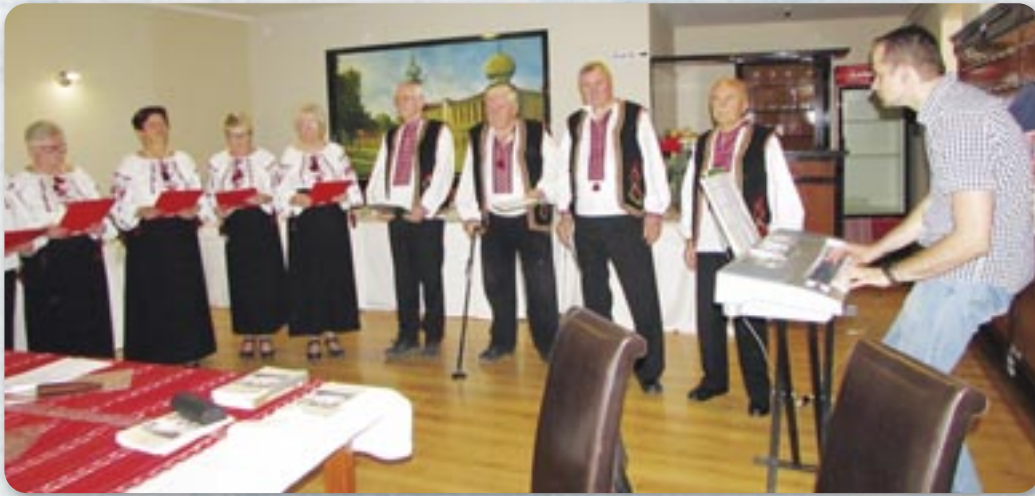
Мишани хор КУД Русинох Винковци

Всоботу, 14. октября, КУД Русинох зоз Винковцох зоз шветочну акедемию и пригодну програму у просторе Хотела Адмирал у Винковцох преславело 30 роки своєї діялносци.