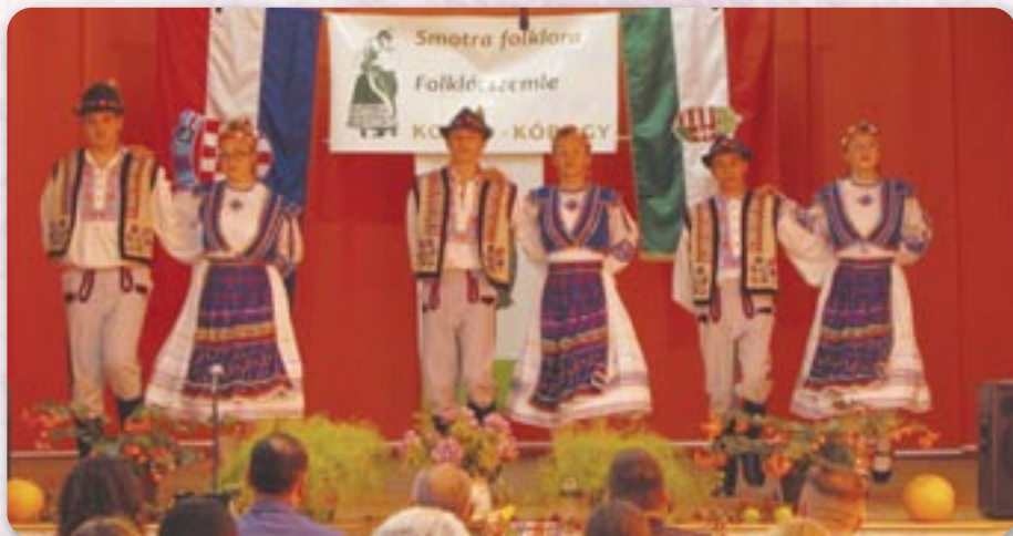
Танечніки КУД Яким Гарди у Кородю