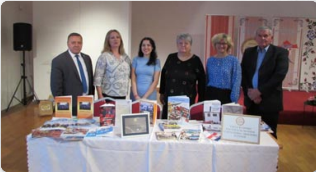
Представніки організатора манифестації

Зоз плакетами учаїніком Манифестації означени перши ювилей