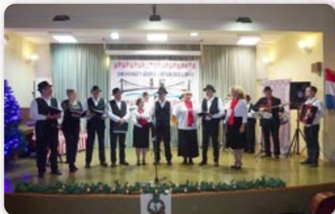
15. Дравски габи