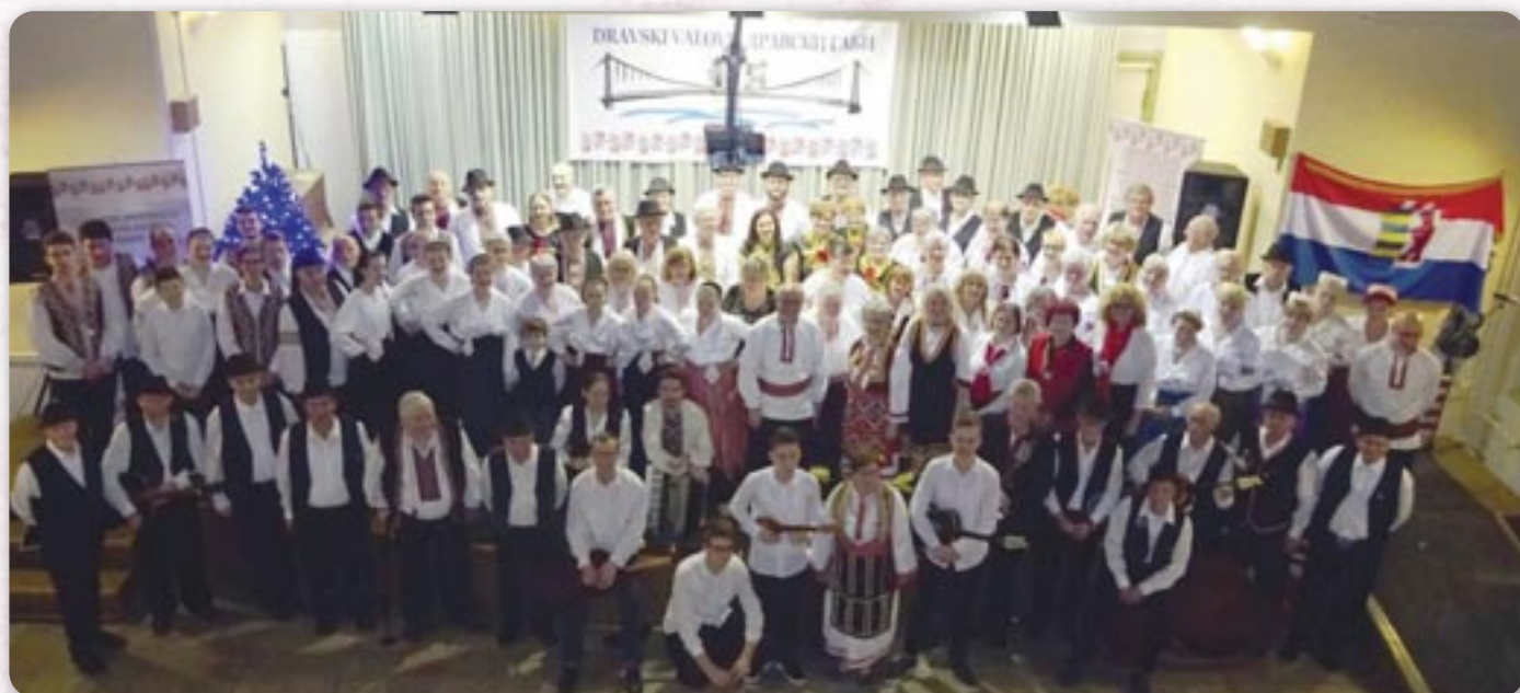
15. Дравски габи - учашніки

Кажди початки чежки, та так було и з тоту манифестацио. Перше ше отримовала у ткви. Щечеранским доме , не було конферанси, але дружтва наступали єдно за другим. Шедзело ше за столами у єдней велькей сали, подобне як на свадзбох, а на бини, дзе на свадзби знаю буц гудаци, зменьовали ше наступи културних дружтвох. Програма була, так повесц, свойофайтово вешеле Руснацох зоз шицких бокох Горватскей и Войводини. Не таке як бал, бо ту наступали велі дружтва, а часто знало буц и коло 200 учашнікох, але розположенє и друженє после