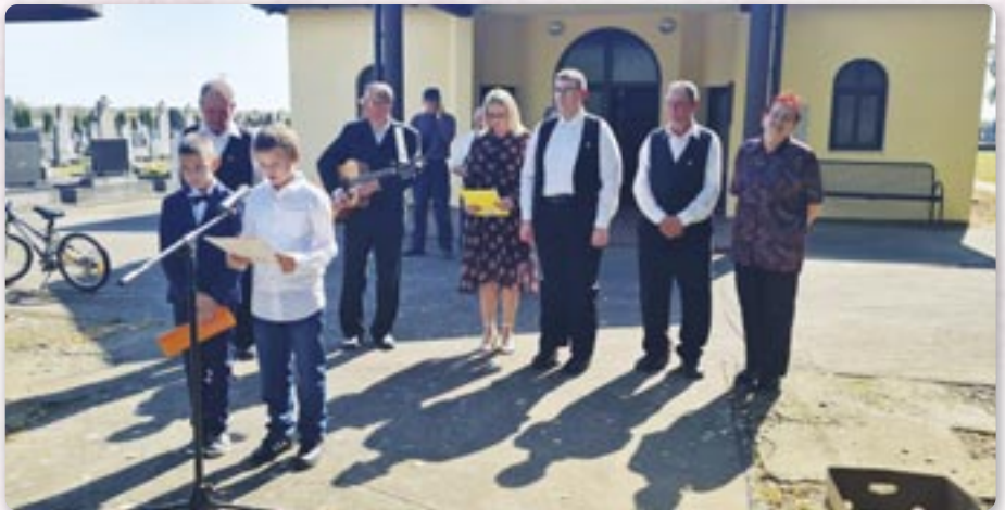
Школяре ПШ Петровци

сримскей жупанії, Горватского Собору, висланік Городу Вуковару Совету за бранітельох и Општина Богдановци за едніцки венец горватских бранітельох.