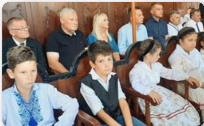
Почитовани госци и часц петровскей младосци на Служби Божей

По богослуженю бул святочни полудзенок за шицких присутних под шатром при дружтвеним доме „Соколана“. Дзекуеме и на тот способ шицким донатором, а окреме волонтером котри нам помогли у организовању тей велїчезней подїї.