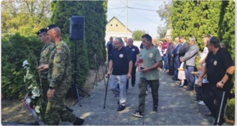
Покладане венца и паленє швичкох

Венци положили и висланіки Министерства горватских бранітельох, Влади Републики Горватскей, Вуковарско-