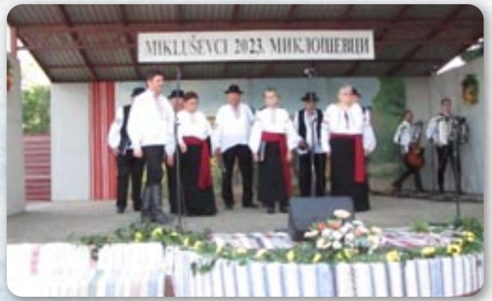
КУД Осиф Костелник Вуковар