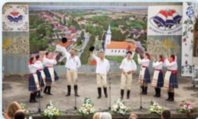
Словацке Дружтво Франьо Страпач, Марковац Нашицки