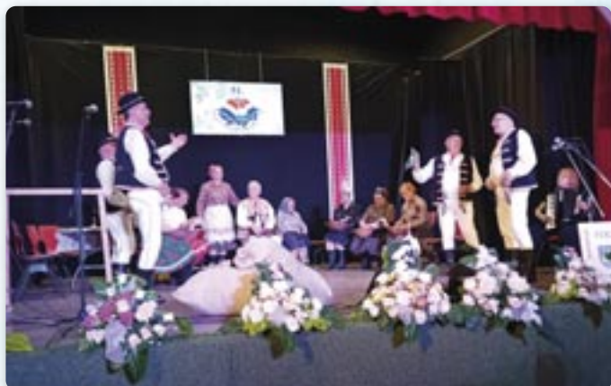
Лупане кукурици, фолклорни ансамбл Роньва Сланске Нове Место, Словацка