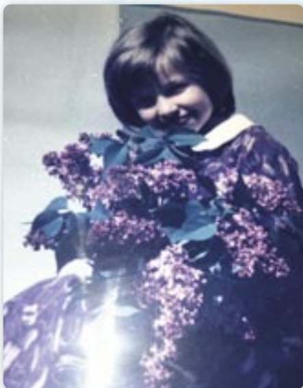
Памятка зоз дзединства ш. Навкратий

Мойо дзединство було найобичнейше, полне любви моїх родичох и красних дзединских подїях. Єден час жили зме у Кули, у Войводини. Основну школу и гимназию закончила сом у Руским Керестуре, у Войводини. На жаль, час гимназїї прешол у воєних подїях. Пре тотї подїї уписала сом факултет историй у Києве, у України, спецификация