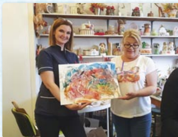
Малюнок у техніки енкаустики