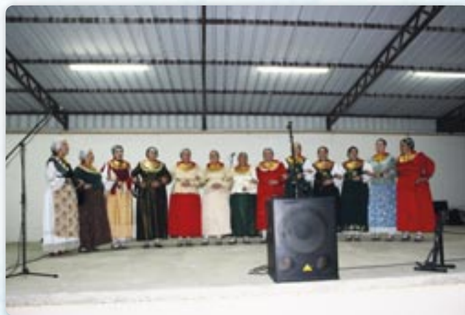
КУД Дукати Свняревци

Початок означованя Дня Општини Богдановци започал зоз шветочним покладаньом венцох на здогадоване жертвом зоз Отечественей войны при памятнику у Богдановцох. Програма предлужена зоз Службу Божу у церкви Св. Мартина у Свняревцох.