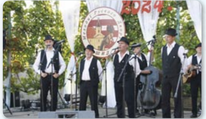
Хлопска шпивацка група КУД Яким Гарди Петровци