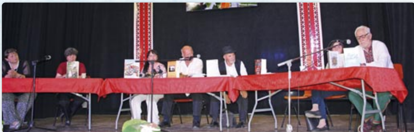
Представяне поезії на Литературним вечару