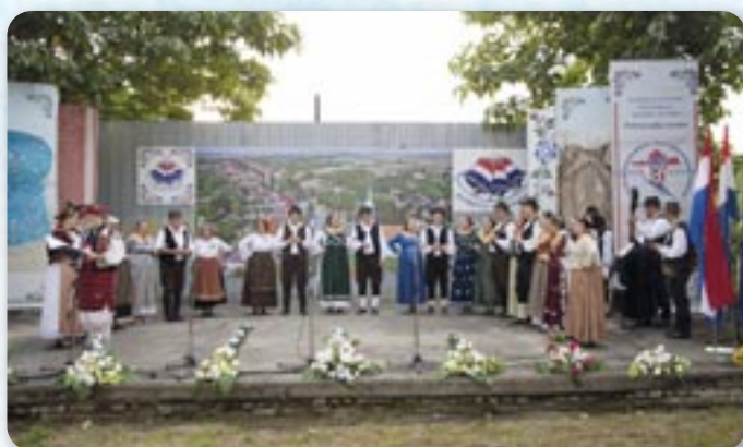
КУД Томислав Церна