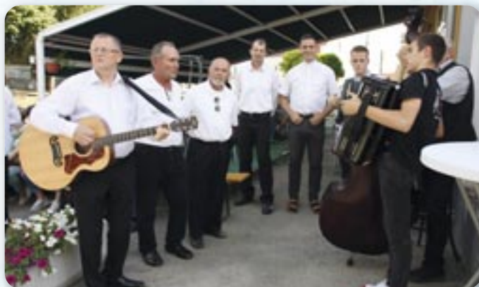
КУД Яким Гарди Петровци

Пред Етнографску збирку Руси-нох у Петровцох члени КУД „Яким Гарди“ 2. юния зрубали майске древко.