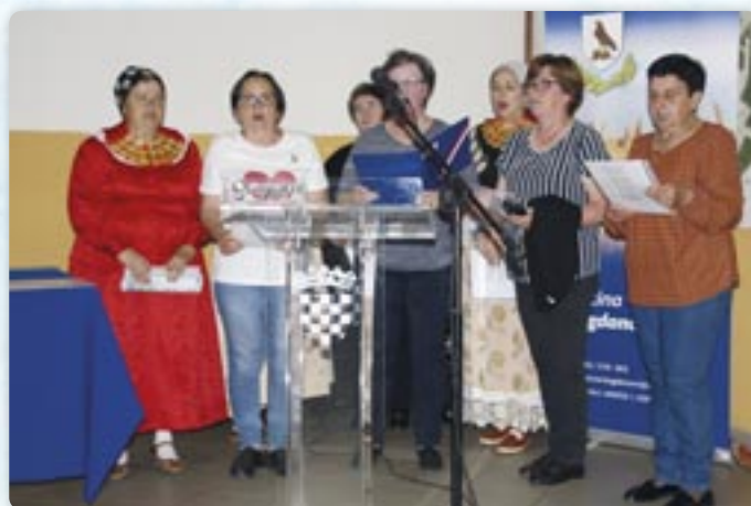
Церковни хор Свняревци