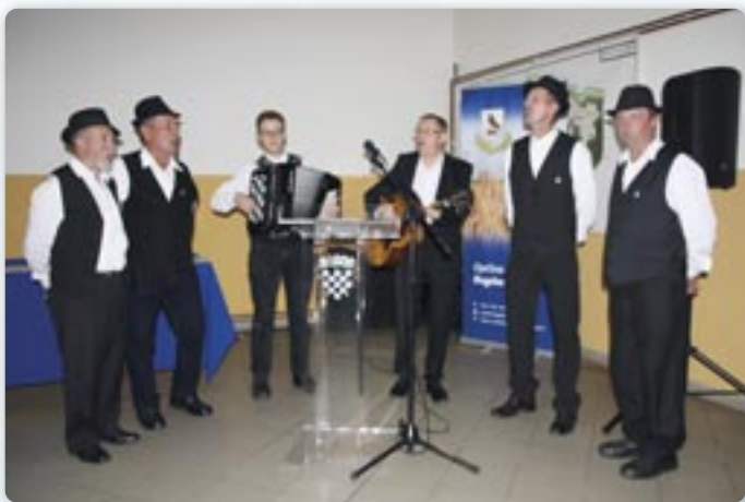
Хлопска шпивацка група КУД Яким Гарди Петровци