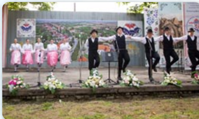
Венчик руских танциох КУД Яким Гарди