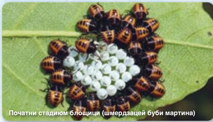
Початни стадиум блощици (шмердзацей буби мартина)