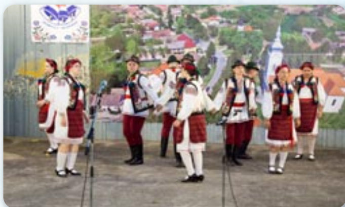
Пастирски танци КУД Яким Гарди, Петровци