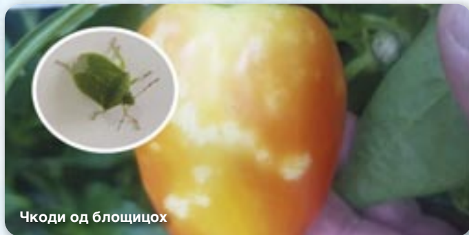
Чкоди од блощицох

На скоро каждой заградкарскей култури и на веліх овоцох могли зме обачиц чкоди од блощицох, т. е. шмердзацей буби мартина. Вони вициую соки зоз младих младнікох, лісца и плодох, та як резултат добиваме деформовани плоди. Заградкарски блощици постали нательо розширени и моцни як популация же нет дакого хто не зна за шмердзацу бубу мартина. Една з причинох іх велькей популации и тото же не маю природног неприятеля, як на приклад божо катички котри едза лісцово вши.