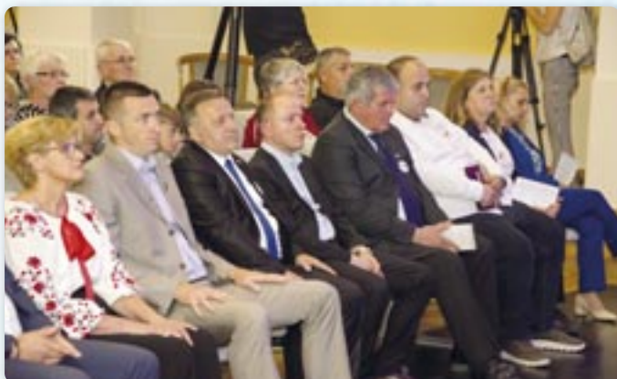
Госци зоз жеми и иножемства