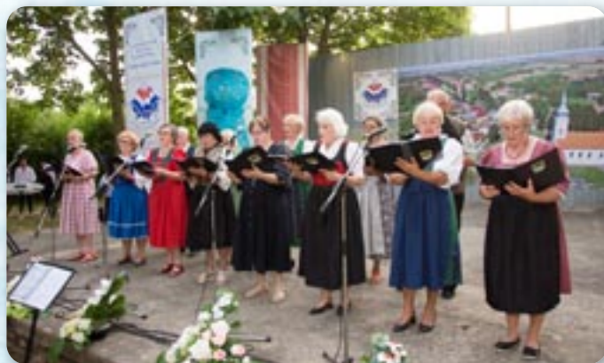
Здружене Немцох и Австрияноцох Вуковар