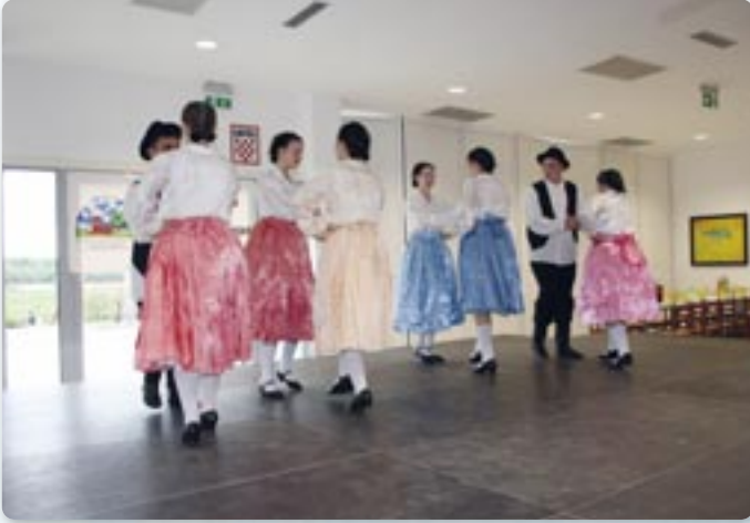
Венчик русских танцов