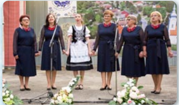
Женска шпивацка група КУД Яким Говля Миклошевци

После удатного наступу Осєчаньох представело ше Дружтво Руснацох у Рєпблики Горватскей „Руснак“, хторе основане 2003. року зоз шедзиском у Петровцох, а з цильом очуваня и розвиваня язика и культурного скарбу Руснацох. З рускима піснями и у руских шматох панонского краю Дружтво „Руснак“ наступа на академийох, културних манифєстацийох и фестивалох рускей култури як у Рєпублики Горватскей, так и за єй границами: у Польскей, Словацкей, Румунії, Сербії и