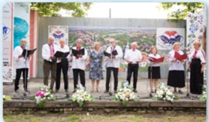
КУД Руснацох Осієк