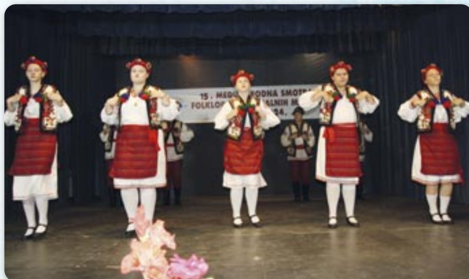
Гаю, гаю мой желени

шинох. Наступели пейц ансамбли зоз Горватскей. Окрем КУД „Яким Гарди“ зоз Петровцох участвовали и Бошняцке КУД „Лілян“ Дреновци, словацке КПД „Людовит Штур“ Илок, фолклорни ансамбл „Ческа Просвита“ зоз Ягодняку и Ческа Беседа Општини Липовляни.