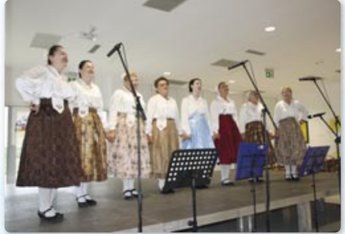
Женска шпивачка група КУД Яким Говля, Миклошевци