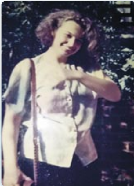
Шестра Навкратия у дзивоцкох дньох

кустос иконох. Пре воєни подїї, шицки млади Руснаци и Українци з наших просторох мали можлівосц студирац у України.