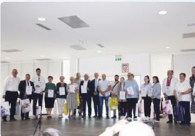
Представителе националних меншинох ВСЖ