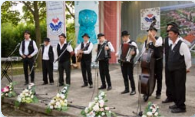
Хлопска шпивацка група КУД Яким Гарди Петровци