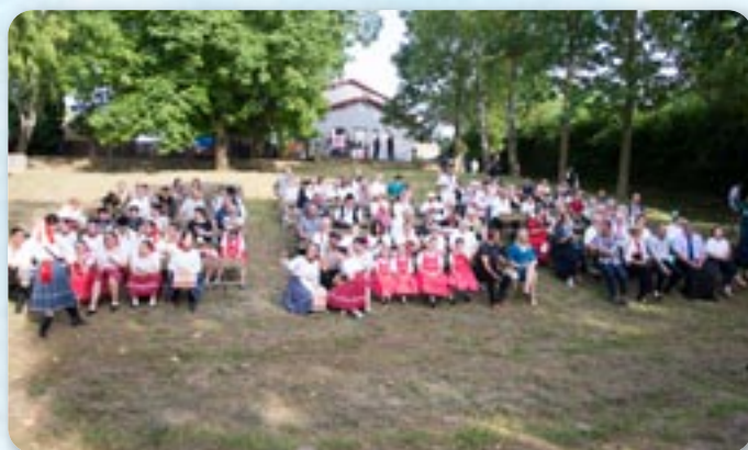
Публика у амфитеатру