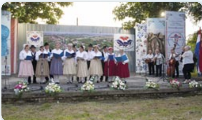
КУД Дюра Киш Шид

Програма ше предлужела зоз наступом милих госцох, КПД „Дюра Киш“ зоз Шиду, хтори ше з тей нагоди представли зоз шпиванками Шицким добре , Щесце и Пчолка .