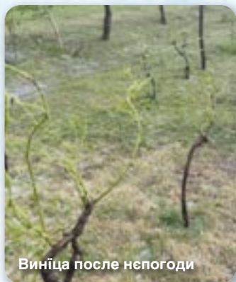
Виніца после непогоди

На славонских и сримских польох початком юния рушела жатва статкарского и пивского ярцу. Жатва пришла кус скорей як у просековим року, але и урожай задовольюци, з оглядом же нам жита и ярци не „отлачел“ ляд з поглядом на непогоди. Вельки непогоди и ляд у опасних розмирох по цалей Горватскей, а и у нашим блізшим околіску коло Илоку и Жупані, на жаль, одробел жатву житаркох и оберане овоци скорей шора, так же наисце маме щесца же зме у можлівосци позберац плоди своей роботи, чи то жито, ярец, брескиня або парадичи зоз загради.