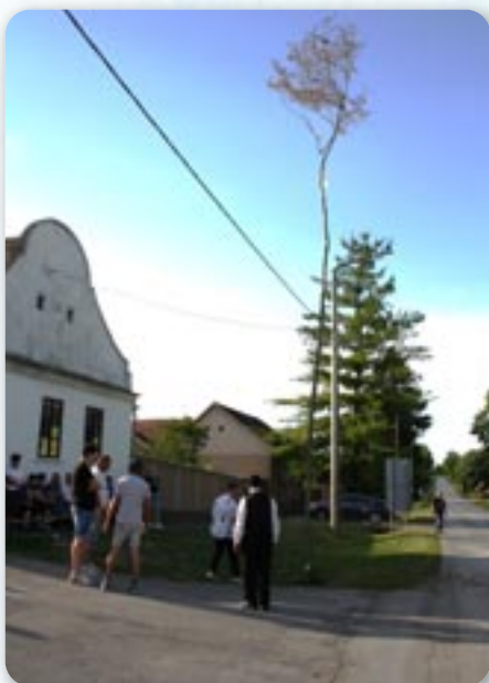
Майске древо опрез рускей Етнографскей збирки у Петровцох