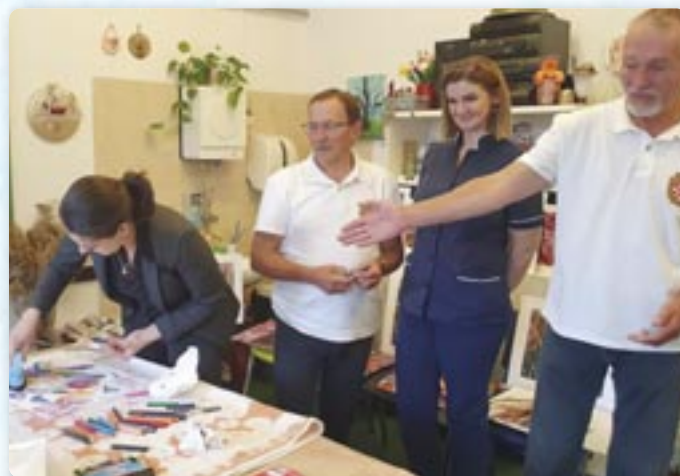
Поступок наставаня малюнку