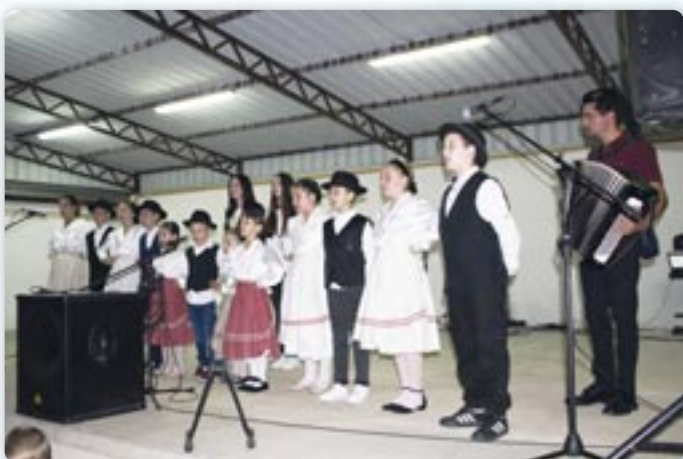
Дружтво Руснак Петровци