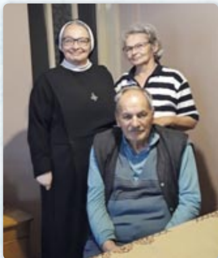
ш. Навкратія з родичами

Поведзце нам дацо о Вашей служби, точнейше работи як шестри у манастире и вонка з нього.