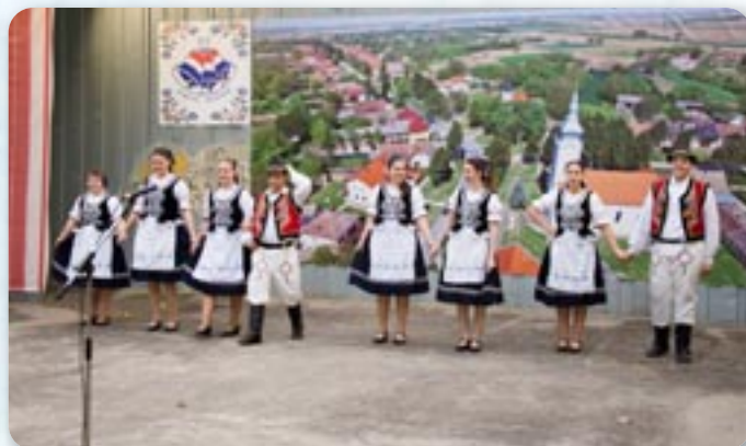
Шаришка полка, КУД Яким Говля Миклошевци