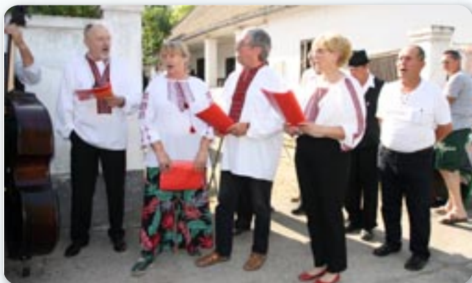
КУД Руснацох Осиек