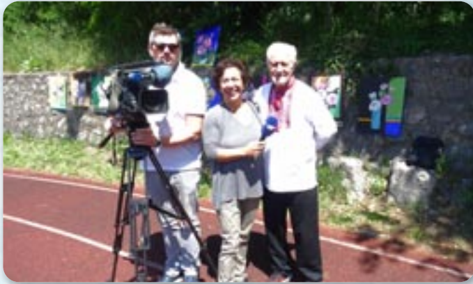
Виява за „Канал Р“ з Риєки