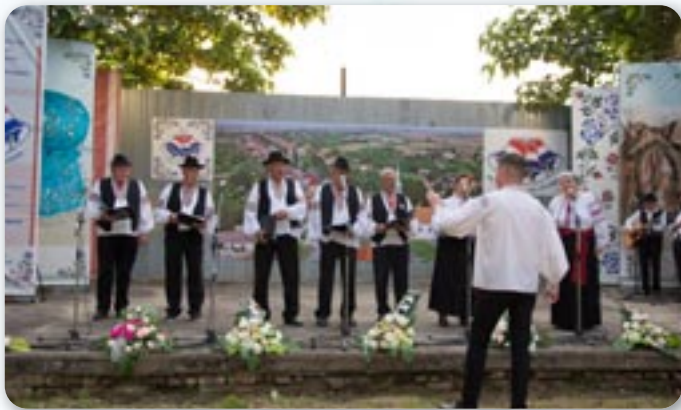
КУД Осиф Костелник Вуковар