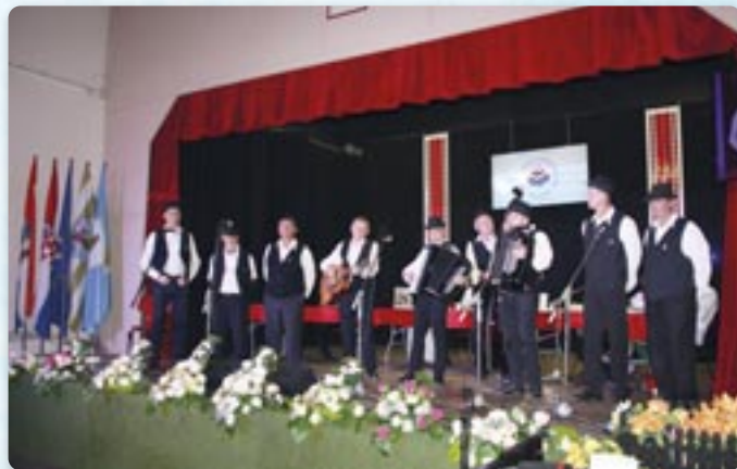
Члени КУД Яким Гарди Петровци