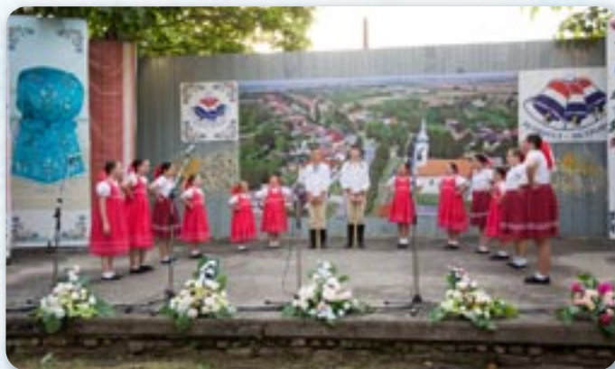
Матка словацка, Марковац Нашицки