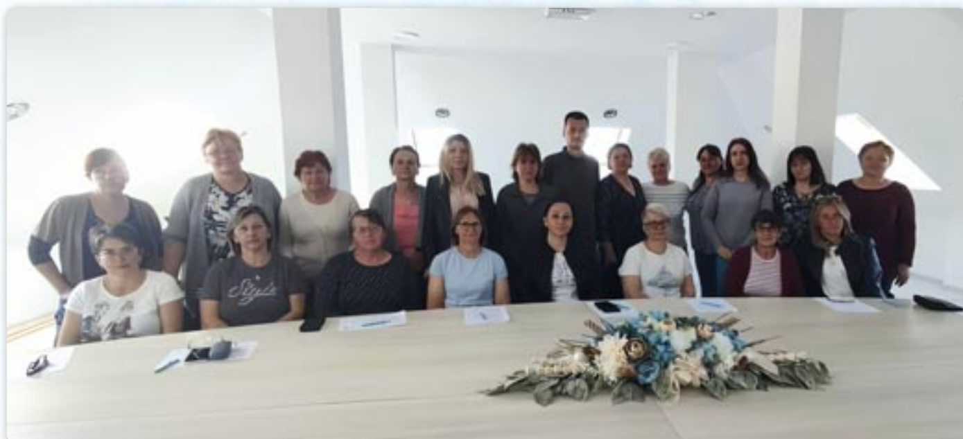
Жени хтори достади роботу ведно зоз водителями проєкту