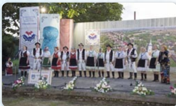
Ансамбл Роньва зоз Сланского Нового Места, Словацка

Потим нашо мили госци зоз Словацкей, ансамбл „Роньва“ зоз Сланского Нового Места, представели едну часц своїх активносцох.