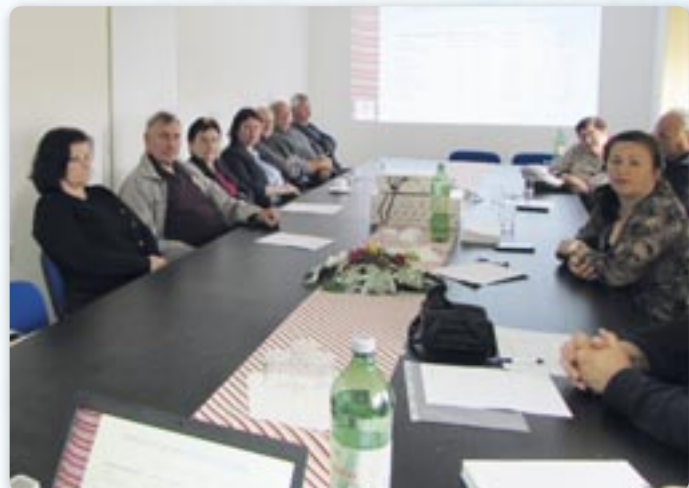
Розправа по дньовом шоре