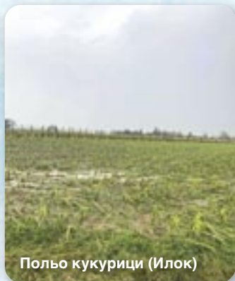
Польо кукурици (Илок)

За тераз рок не бул идеални цо ше дотика польоділских культурах. Мали зме еден вельки период без дижджу, вельки осцилації у температури, константни моцни витри котри нарушували роботу, та з оглядом на шицко тото можеме буц задовольни зоз урожаєм ярцу од 2,8 по 4 тони по катастарским голгту, або 5 до 7 тони по гектару, док ше конечна цена, логично, по конец жатви вироятно не будзе ані знац.