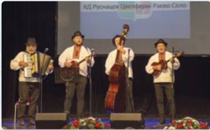
КД Руснацох Цвелферії Райово Село