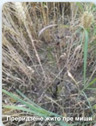
Преридзене жито пре миши

Идеалне би було кед би зарно мало влагу 14 % або меней, влажне зарно преїг 14 % ше лем пресушуе у сушарох за житарки на температурах 40-60° Ц, док зарно котре лем кус влажнейше можливе пресушиц и природно, на сухим и превитреним месце зоз частейшим преврацањом маси зарна.