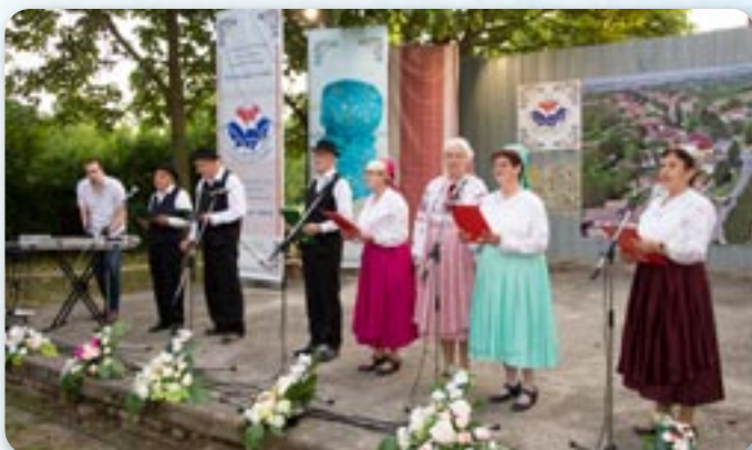
КД Русинох Винковци