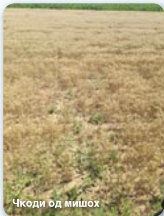
Чкоди од мишох

Того року була и покус чудна жатва цо ше дотика ярцу, бо у веліх случайох класка и зарно були сухи, док слама ише тримала влагу и була зеленкава. Ярец солидног квалитету, без ценких зарнох и доброг гектолитру, а на менши урожай жита и ярцу того року з едну вельку часцу уплівовал недостатночни склоп рошлінох на метеру квадратним. Зоз зменшаньом числа рошлінох по метеру квадратним маме и менше число класкох, цо зменшуе урожай, за цо можеме подзековац и мишом, хтори од шатви по жатву поступне зменшую число рошлінох и зоз чим ше зменшуе и урожай.