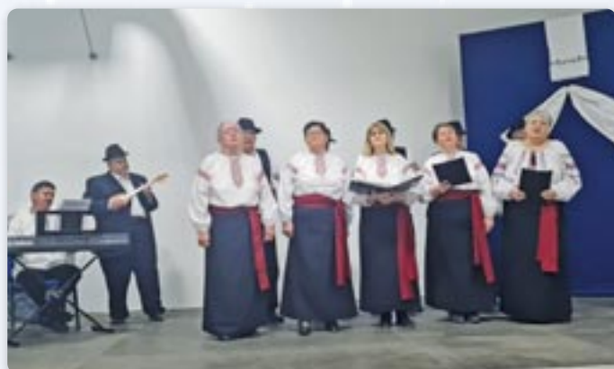
КУД „Осиф Костелник“ Вуковар