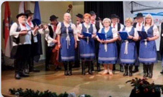
Матка Словацка Осиек