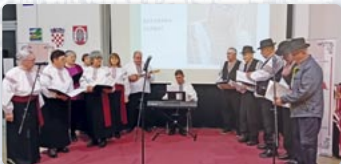
Мишани хор КУД „Осиф Костелник“ Вуковар