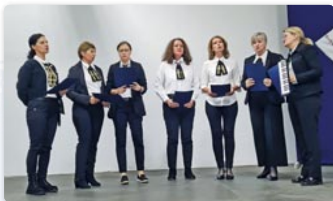
Женска шпивацка група „Арсновиа“ зоз Райового Села