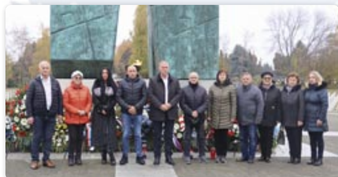
Члени Координацији националних меншинох ВСЖ