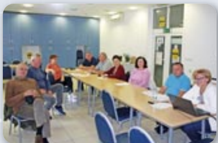
Члени Председательства Союзу Русиных РГ