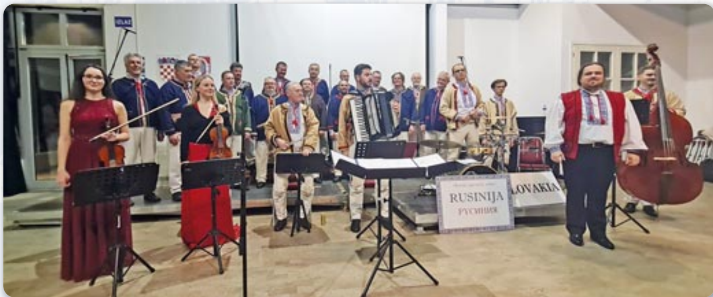
Ансамбл Русиния зоз Гумена у Словацкей