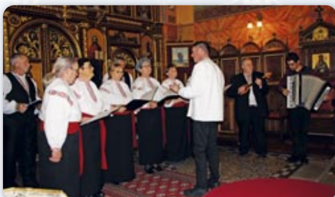
КУД „Осиф Костелник“ Вуковар