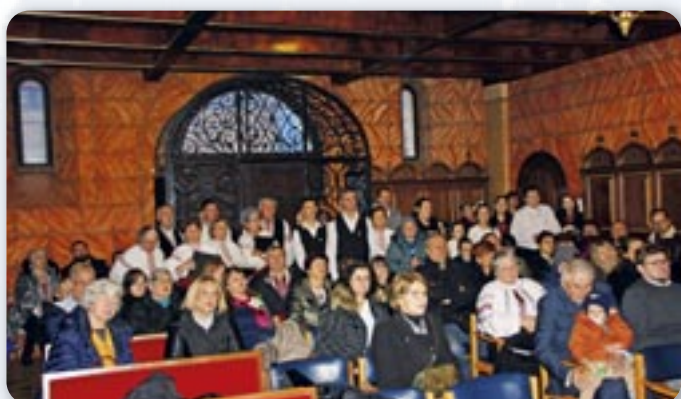
Вирніки и патраче програми