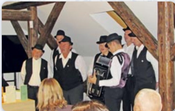
Хлопска шпивацка група КУД „Яким Гарди“ Петровци

Стреду, 20. новембра, у новим просторе Центра за культуру войвођанских Руснацох отримана перше векше представяне видавателства Союзу Русиних РГ.