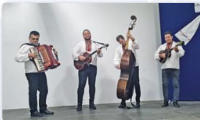
Тамбурови оркестер КД Руснацох Цвелфериі Райово Село