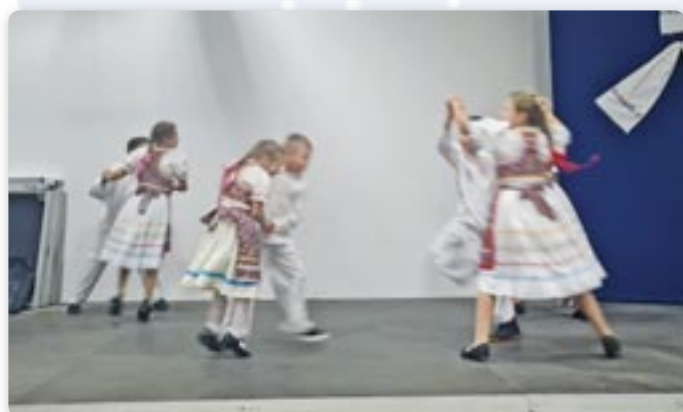
Дзецинска танечна група КУД „Яким Говля“ Миклошевци