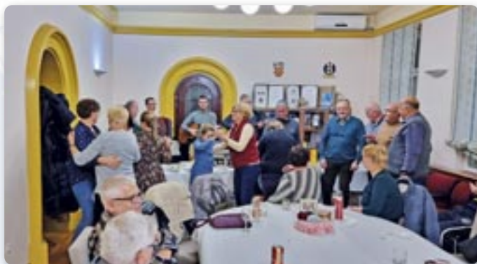
Дасдни и затанцовали на нашо руски шпиванки