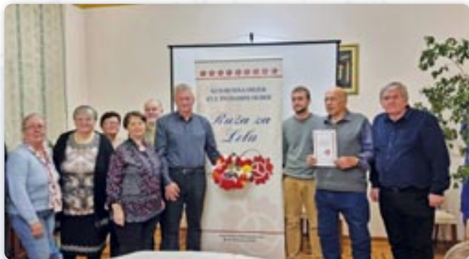
Креативна секція КУД-а „Осиф Костелник“ з Вуковару на мانی-фестації „Ружа за Лелу“ у Осієку