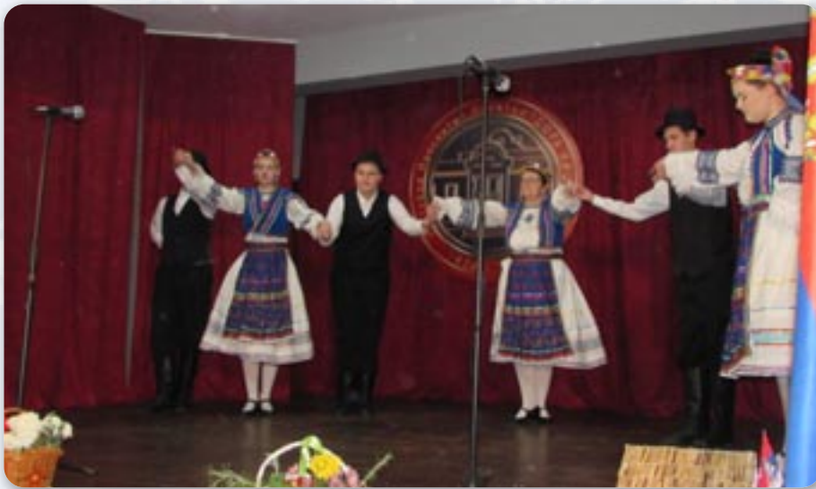
Красота закарпатського жіночого одягу

У Руському домі, 16. листопада цього року, отримали рочний концерт Культурно-просвітнього товариства „Дюра Киш“ зоз Шиду на хторим аматере приказали свою єднорічну роботу секційох.