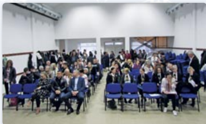
Публика на манифестациі