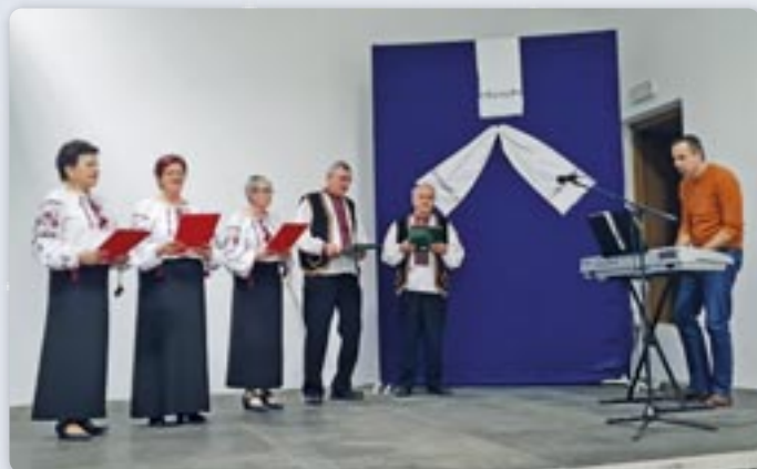
КУД Русиных Винковци