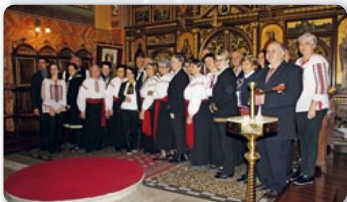
Часц учашнікох програми