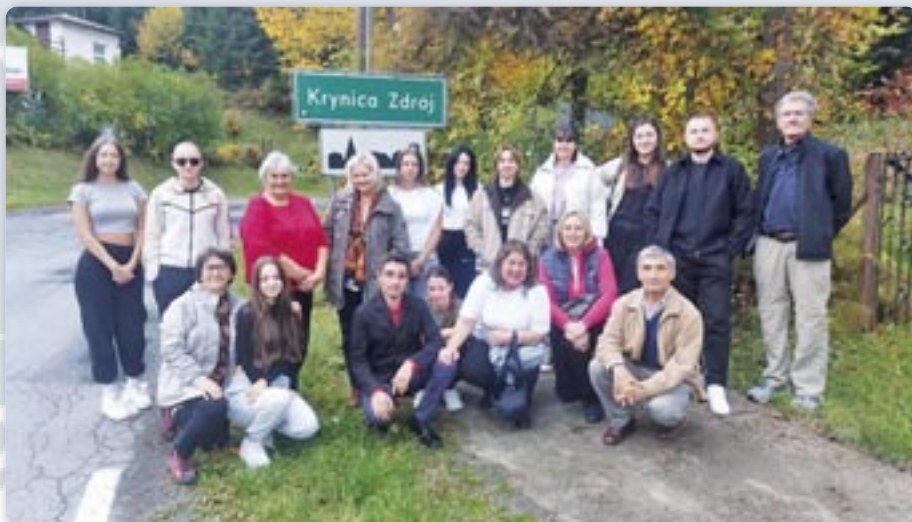
Дружтво „Руснак” з Горватскей и учашники зоз Сербїи

Путоване на Биенале оможлирене зоз финансїйних средствох Совету за национални меншини РГ.