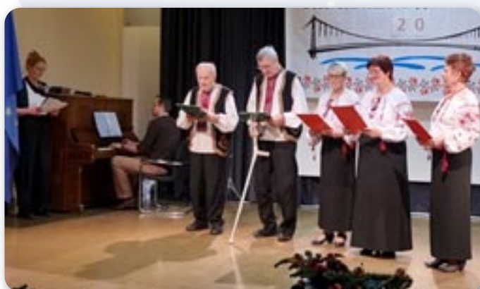
КД Русинох Винковци