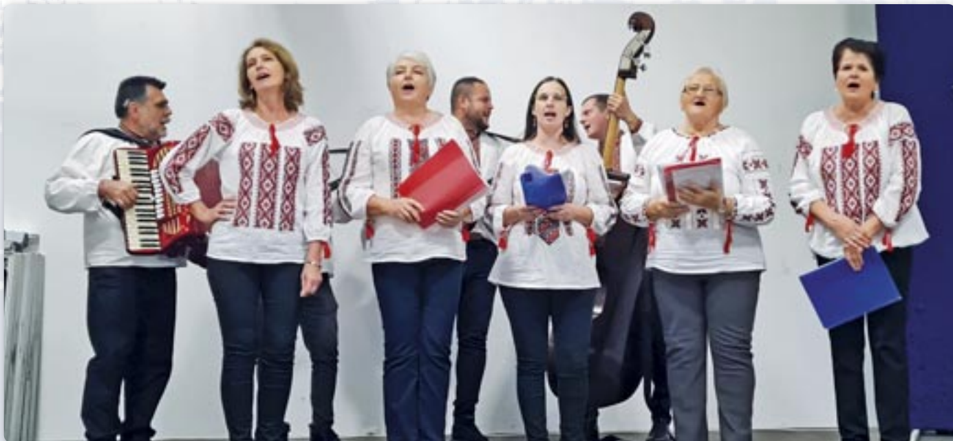
Женска шпивачка група домашњого КД Руснацох Цвелферії Райово Село

Внедзелью, 10. новембра, Културне дружтво Руснацох Цвелферії з Райового Села организовало осму културну манифестацију Руснацох „Обичај нашого народу“ у Райовим Селу под покровительством Совету за национални меншини РГ, Союзу Русиных РГ и Општини Дреновци.