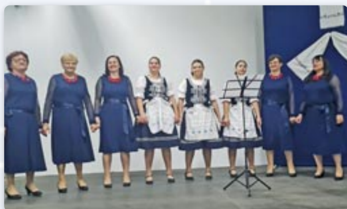
Женска шпивацка група зоз Миклошевцох