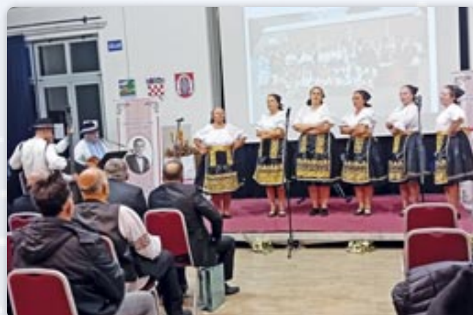
КПД „Людовит Штур“ Илок