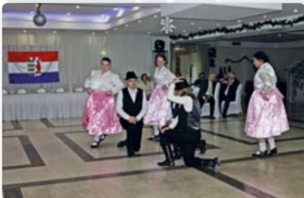
Венчик руских народних танцох