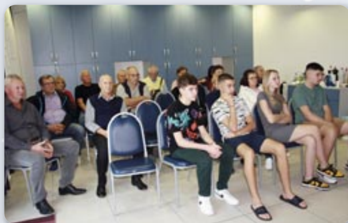
Провадзене звиту Горватскей телевизії о програмах информования националних меншиных