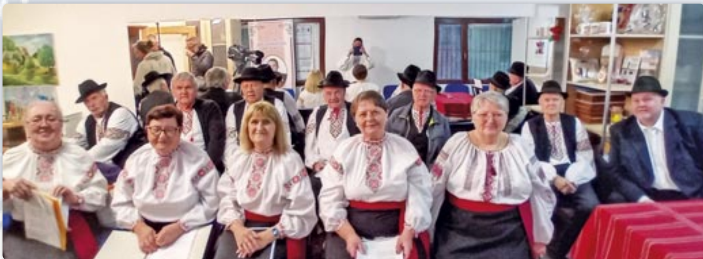
Мишани хор КУД „Осиф Костелник“ Вуковар