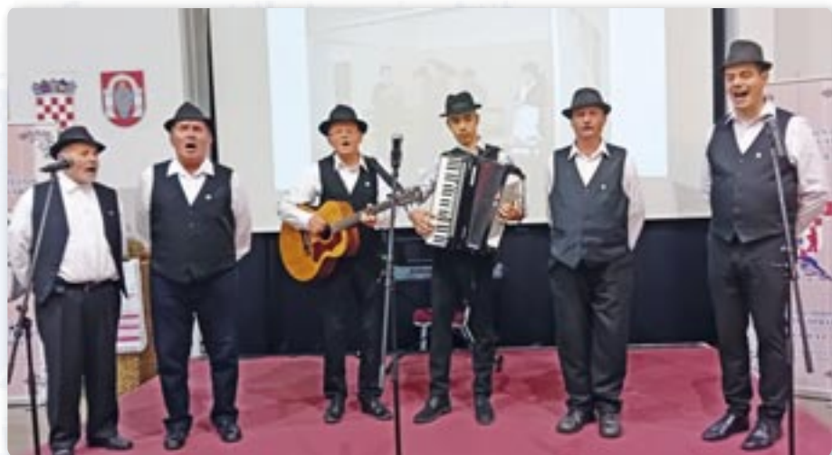
Хлопска шпивацка група КУД „Яким Гарди“ Петровци