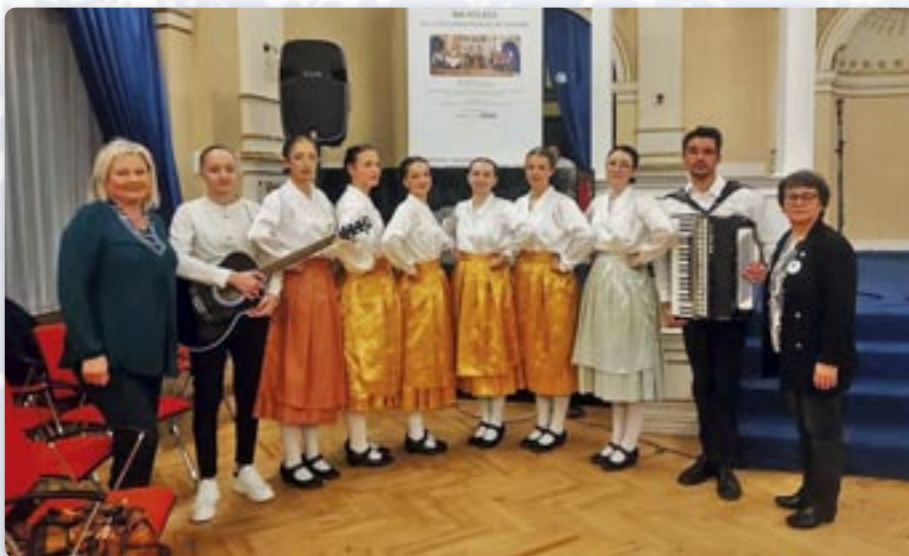
Наступ Дружтва „Руснак”

У рамикох другей часци културней програми престижну Награду Василя Турока-Гетеша за витворени позарядово резултати у розвою, напредованю и презентованю русин-