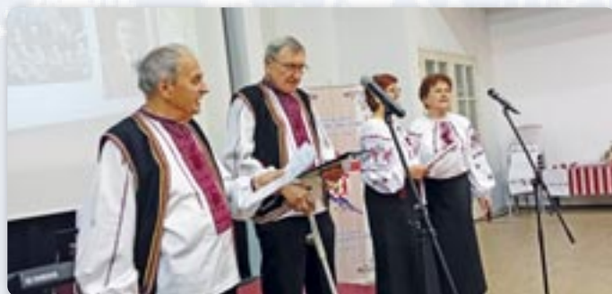
Квартет КУД Русинох Винковци

Внедзелью, 1. децембра у Хижи Лавослава Ружички у Вуковаре удатно отримана друга литературно-музична манифестация „Стих коло стиха – здогадоване на Осифа Костелника“. Манифестацию организовало Културно-уметнице дружтво „Осиф