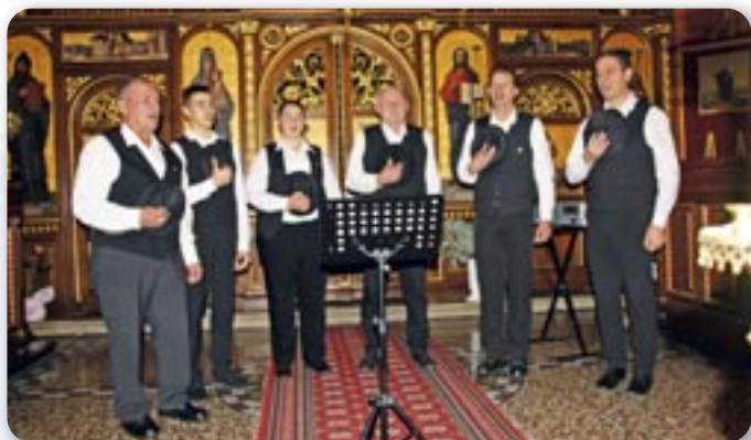
КУД Яким Гарди Петровци