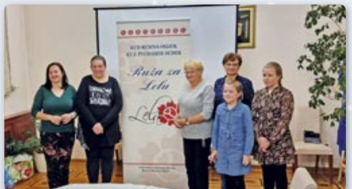
Креативна секция КУД-а „Яким Говля“ з Миклошевцох на манифестациї „Ружа за Лелу“ у Осиеку