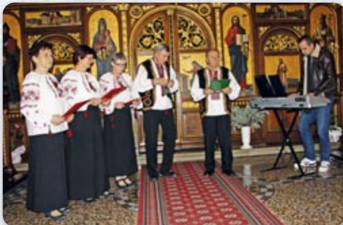
КУД Русиных Винковци

У організації Союзу Русиных РГ ведно зоз КПД Рускиня и Руснак Загреб, 14. децембра у грекокатолицкей церкви св. Кирила и Метода отримана дзешата по шоре манифестация Руснацох Републики Горватскей „Крачун у Загребе“, а под покровительством Совету за национални меншини. Тота манифестация култури Руснацох Републики Горватскей основана у напряме заштити и розвиваня културней творчосци у форми жридлових крачунских шпиванкох, же би ше збогацел скарб нашей националней меншини и же би ше чувало и розвивало културни идентитет Руснацох у РГ, а основали ю здруженя котри члени Союзу Русиных Републики Горватскей Вуковар.