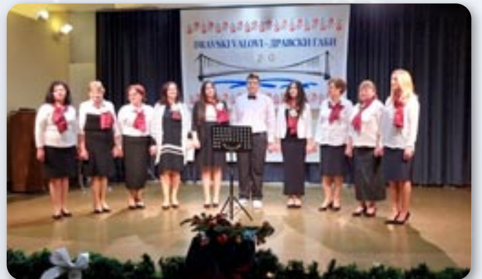
КУД „Яким Говля“ Миклошевци