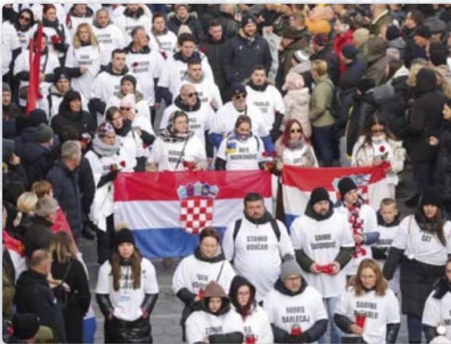
Крачали «Место ніх»

Здогадніме ше ище раз чарних и чежких податкох новшей историйі городу Вуковару: 18. новембра 1991. року зламана охрана городу хтори ше цеком тримешачней агресії геройски борел. Цеком агресії забито 2.717 бранітельох и цивилох, коло 22.000 Вуковарчаньох вигнато, а вецей як 300 особи ше нігда не врацели зоз сербских лагрох. У Ву-