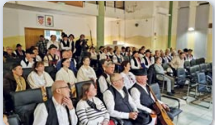
Патраче на 20. Дравских габох