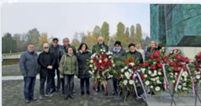
Положени венци и запалени швички у спомин страдалим барнителюм и цивилним жетвoв Oтечественој војни