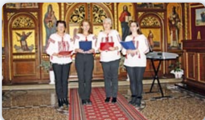
ҚД Руснацох Цвелфериі Райово Село