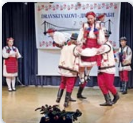
КУД „Яким Гарди“ Петровци - танечна секция, Пастирски танци

З привитну шпиванку городу Осиеку Мой Осиек , як уж звичайно, домашнє Дружтво започало стретнуца хорох и шпивацких групох, а потим, праве пре окремну шветочносц длугорочног отримованя „Дравских габох“, на сцену вишла танечна секция КУД-а „Яким Гарди“ з Петровцох хтора одтанцовала При-