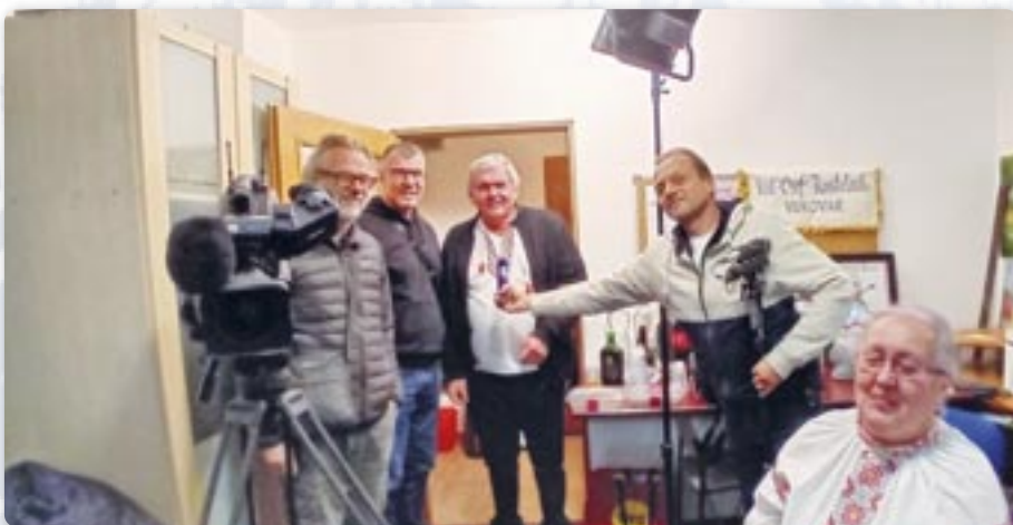
Екипа ГРТ у просторийох КУД „Осиф Костелник“

по 10. новембер. Знімало ше на вецей атрактивних локацийох у Петровцох, як и у просторийох КУД „Осиф Костелник“ у Вуковаре.