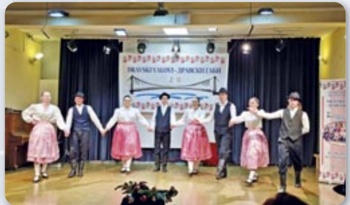
КУД „Яким Гарди“ Петровци - танечна секция