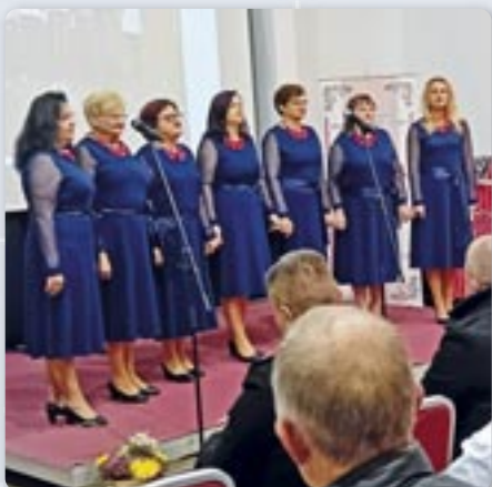
Женска шпивачка група КУД „Яким Говля“ Миклошевци