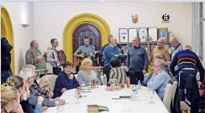
Зашпивало ше и Лелову наймилшу шпиванку Били оргони