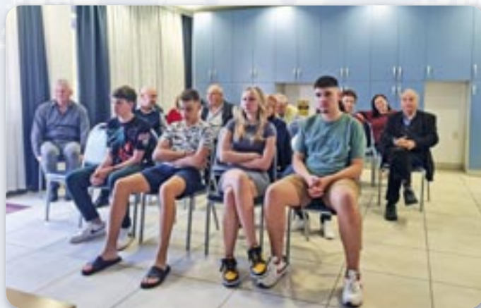
На совитованю були и млади члени наших дружтвох

Од 25. по 27. октобер у просторийох центру за едуковане городского Червеного Крижу Осиек, у Ораховици, у одпочиваліщу Меркур, у організації Союзу Русиных Републики Горватскей отримани Округли стол „Русини вчера, нешка, ютре“ и 15. схадка Председательства Союзу Русиных Републики Гор-