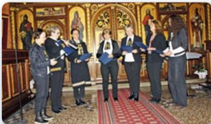
Женска шпивацка група „Арсновиа“ Райово Село