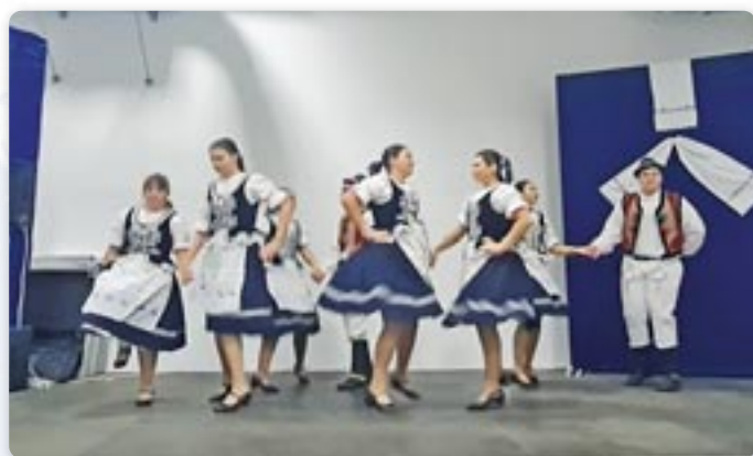
Шаришка полка у виводзеню танечнікох КУД „Яким Говля“ Миклошевци