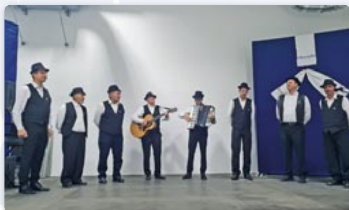
Хлопска шпивацка група КУД „Яким Гарди“ Петровци