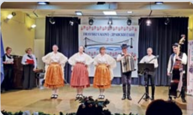
Руснак Дружтво Руснацох у РГ