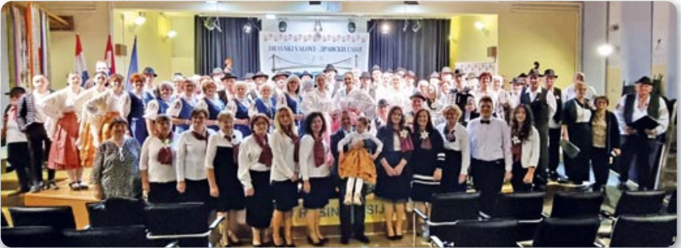
Заедніца фотография учашнікох юбилейних 20. Дравски габох

Коло 100 виводзацох през 7 культурно-уметніцки дружства презентували народни и крачунски шпиванки у 90-минутовой програми на 20. Дравских габох у Осиеку