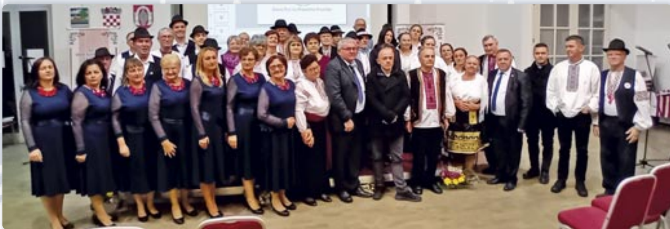
Шицки учашніки програми