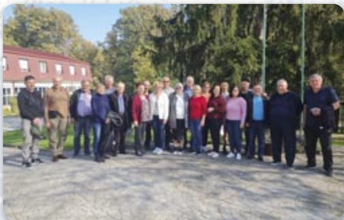
Учасніки Округлого столу