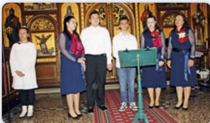
Мишани хор Миклошевци