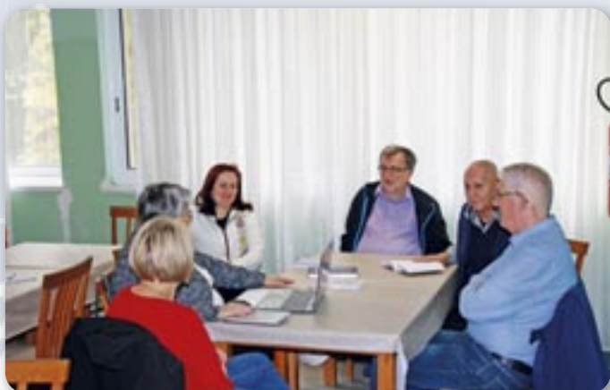
Совит и Редакция Новей думки