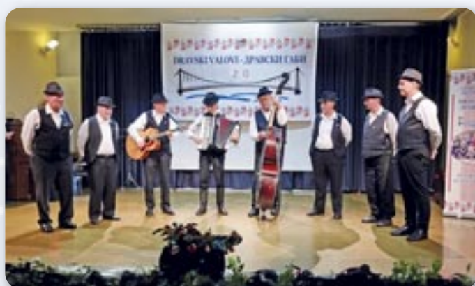
КУД „Яким Гарди“ Петровци - хлопска шпивацка група