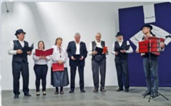
КУД Руснацох Осиек