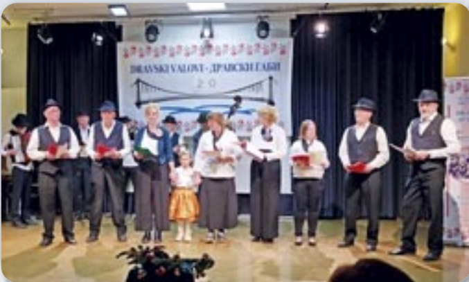
КУД Руснацох Осиек