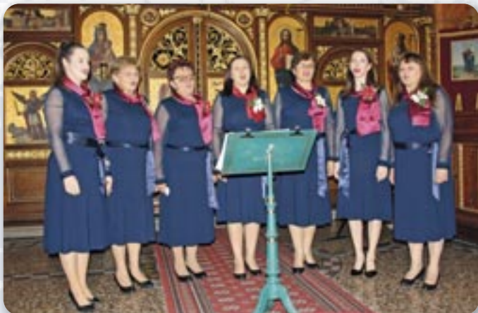
Женска шпивацка група КУД Яким Говля Миклошевци