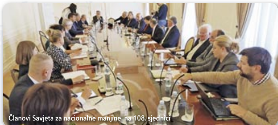
Чланови Савјета за националне мањине на 108. сједници