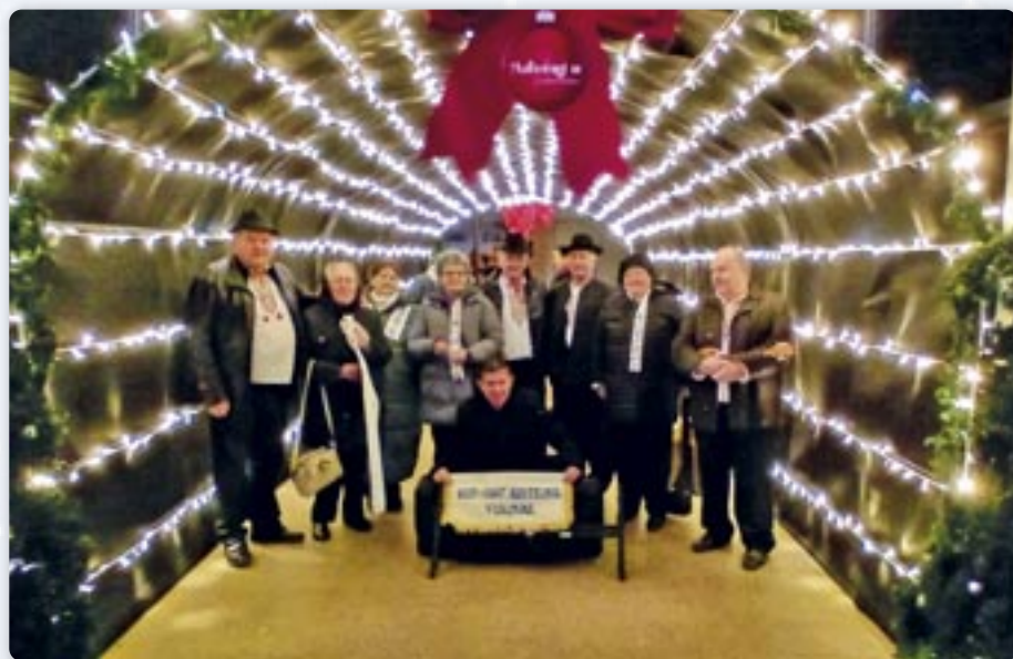
КУД „Осиф Костелник“ на Адвенту у Вуковаре

Внедзелю, 8. децембра на 18:30 годзин, у програми под назву „Ведно у Крачуне“ наступели Здружене Ма-